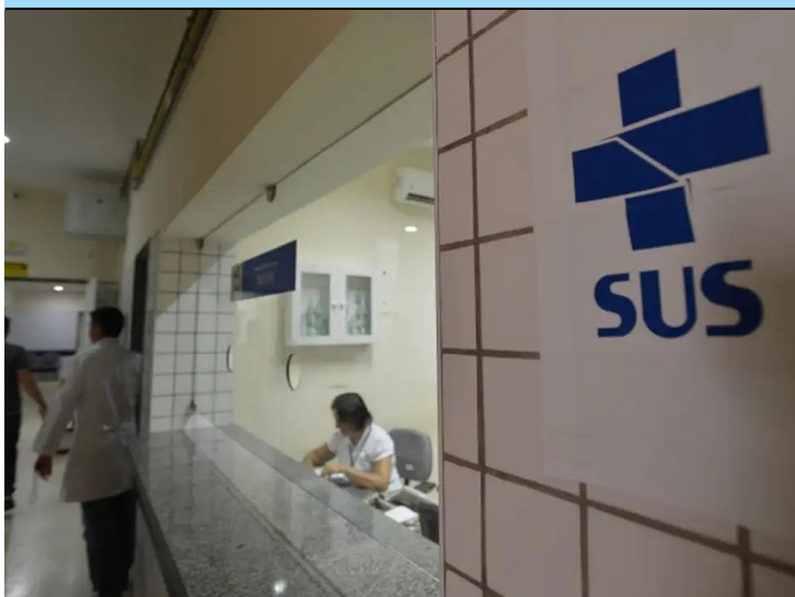
Comissão foi criada nesta quarta-feira para elaborar propostas