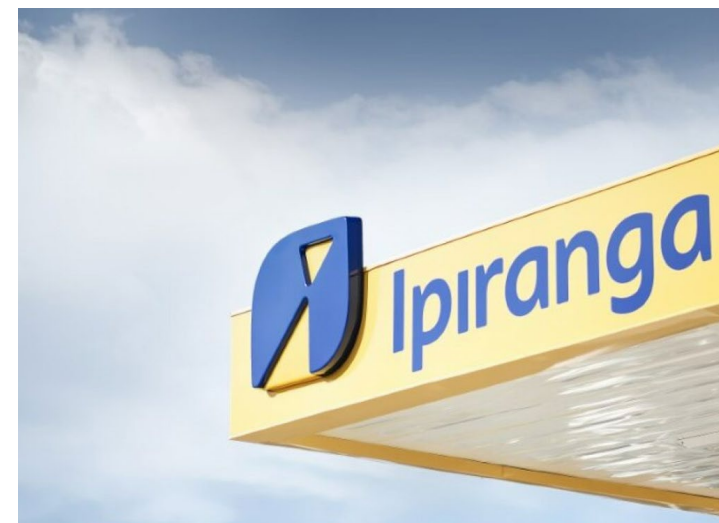
Metade das vagas se destina a pessoas pretas e pardas

Os benefícios oferecidos pela Ipiranga são: bolsa auxílio compatível com o mercado; seguro de vida; plano de saúde; auxílio alimentação; auxílio transporte; zenklub e gympass, além de cursos on-line e trilha de desenvolvimento.