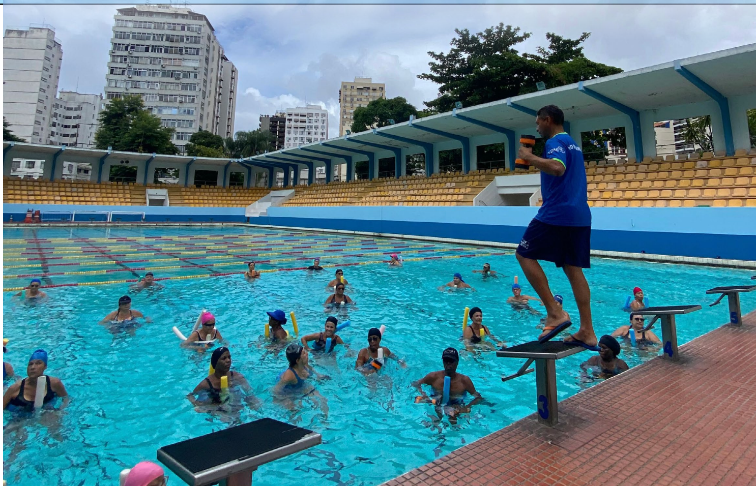
Governo do Estado promove atividades durante o recesso para os cerca de 2 mil alunos matriculados

O trio estreou no Torneio Pré-Olímpico na noite do último domingo, no empate entre Argentina e Paraguai em 1 a 1. A partida em questão era válida pela primeira rodada do Grupo B da competição.