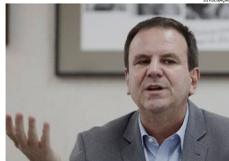
Áudio do prefeito circula nas redes sociais; esporro ocorre após publicação de subprefeito da Zona Norte