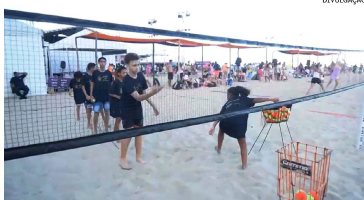
Iniciativa que busca promover a inclusão social por meio do esporte

“Ter a oportunidade de desenvolver e difundir a modalidade do Beach Tennis no nosso estado é um grande privilégio, afinal, o Rio de Janeiro possui características que abraçam a categoria. Nós já temos o maior torneio do mundo, que é o Follow The Beach, e ele agora inicia o seu braço social que perpetuará essa cultura do Beach Tennis em todos os municípios através do Follow