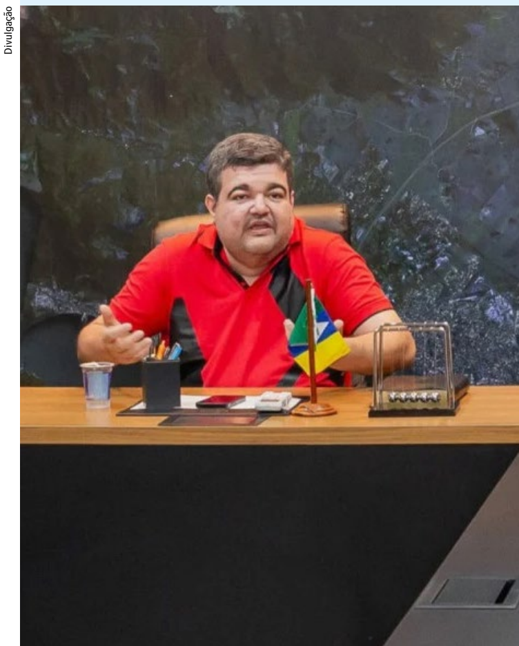
Encontro liderado pelo prefeito Rubem Vieira reuniu secretários de todas as pastas

O programa Casa do Servidor reflete o compromisso contínuo da Secretaria de Recursos Humanos em valorizar o funcionalismo público. Além do novo projeto, iniciativas como o “Acolher”, que prestou apoio a mais de 200 famílias de servidores que sofreram perdas durante a pandemia, demonstram a preocupação da administração em atender as necessidades dos servidores municipais.