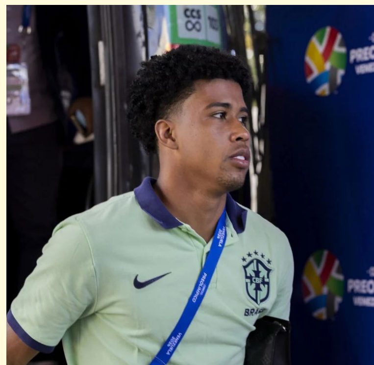
Seleção volta a campo na próxima sexta-feira (26), contra a Colômbia

Quem lidera o Grupo A do Pré-Olímpico é o Equador, que venceu a Colômbia por 3 a 0. Com o resultado, o Brasil fechou a primeira rodada na segunda posição por conta do saldo de gols.