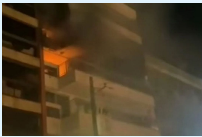
Um curto-circuito em uma tomada no apartamento da vítima pode ter causado as chamas

Uma idosa, de 90 anos, morreu, na madrugada desta terça-feira (23), durante um incêndio em seu apartamento no Leblon, Zona Sul. Esther Spritzer foi encontrada já sem vida depois que bombeiros controlaram as chamas no imóvel, localizado na Rua Juquiá.