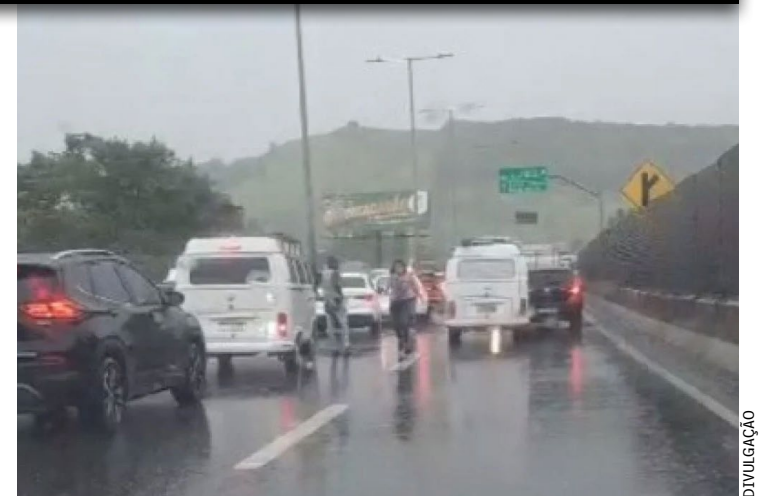
Duas pessoas tiveram seus veículos levados por criminosos na altura de Deodoro, Zona Oeste do Rio

Duas pessoas foram roubadas dentro de seus próprios carros durante um arrastão, na manhã desta terça-feira (23), na Avenida Brasil, altura de Deodoro, na Zona Oeste. Uma terceira vítima ainda teve pertences e a chave do veículo levados pelos criminosos. Um vídeo que circula nas redes sociais mostra o trânsito completamente parado na via. Pessoas aparecem correndo e um motorista pergunta o que aconteceu. Uma mulher, que havia começado a correr, respondeu que havia cerca de 10 homens armados e encapuzados no local. Segundo a Polícia Militar, agentes