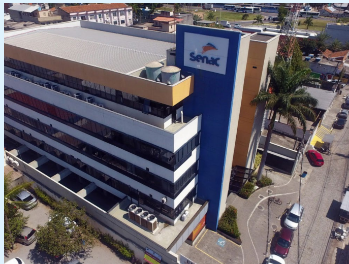
Ao todo são disponibilizadas 74 vagas de cursos profissionalizantes gratuitos nas unidades do Senac RJ

O Departamento Geral de Ações Socioeducativas (Degase), vinculado à Secretaria de Estado de Educação (SEEDUC), junto com o Senac RJ, está ofertando 74 vagas para cursos profissionalizantes nas áreas de: Cake Design, Barbeiro, Preparo de massas frescas e Informática fundamental, destinados para egressos do sistema socioeducativo, familiares e servidores Departamento. As aulas serão ministradas nas unidades: Irajá, Riachuelo, Campo Grande e Nova Iguaçu, respectivamente.