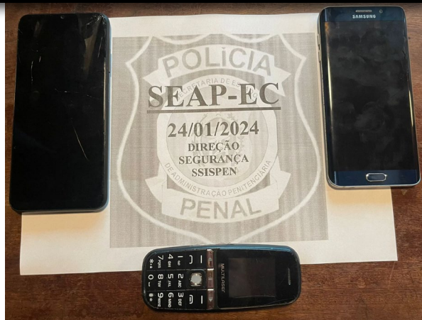
Iago Mendes Silva, encontrado com um dos aparelhos, é investigado por envolvimento na prática do crime