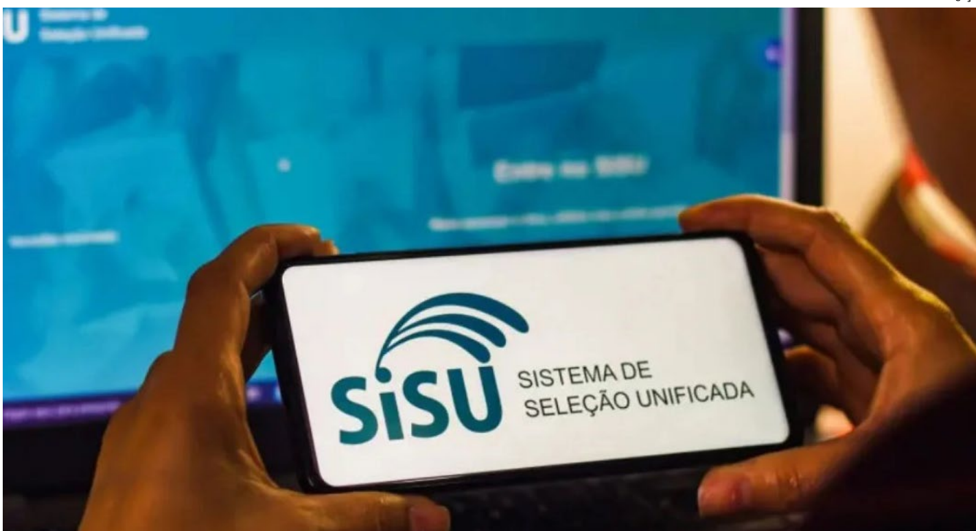
Na comparação com 2023, houve um aumento de 122% no número de vagas oferecidas

Serão destinadas 45% das vagas para os candidatos com carência socioeconômica comprovada, através do CadÚnico do Governo Federal, por meio da inscrição individual ou familiar. Há ainda reserva de 20% das vagas para estudantes negros, indígenas e quilombolas. Além disso, são 20% para oriundos da rede pública de ensino e 5% para pessoas com deficiência, filhos de policiais civis, militares, bombeiros militares, inspetores de segurança e administração penitenciária, mortos ou incapacitados em razão