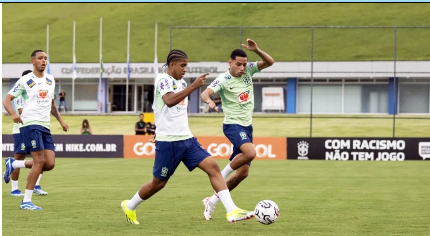
Os 23 atletas convocados já foram a campo na Granja Comary nesta segunda-feira (8) e ficam no centro de treinamento até dia 16