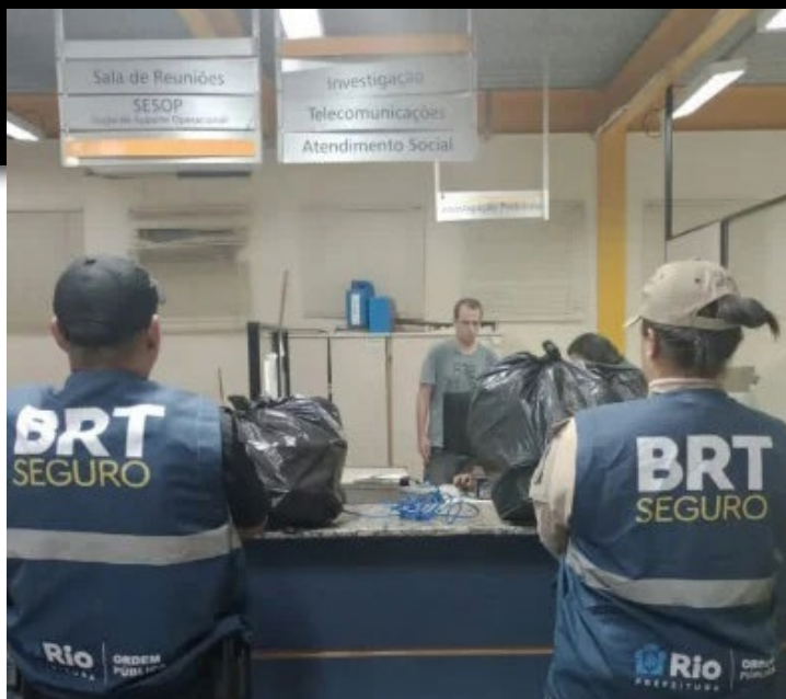
Suspeito cortou e arrancou os fios de uma máquina no terminal de tickets da estação

Na ação, um PM também ficou ferido por estilhaços