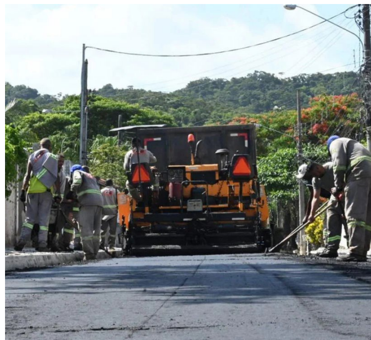
Obras foram realizadas pela Emusa em 75 ruas nos dois bairros da Região Oceânica, além do recapeamento da Estrada Washington Luiz, em Pendotiba