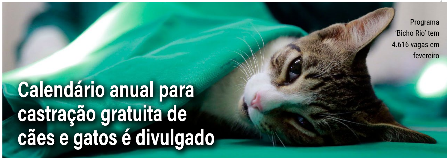
Programa 'Bicho Rio' tem 4.616 vagas em fevereiro

Os interessados no serviço podem obter outras informações no site do programa.