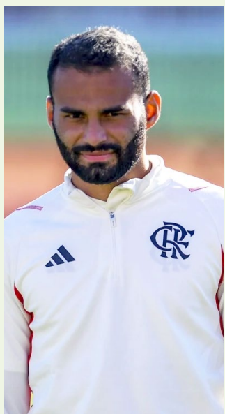
Colorado já tem acordo com o volante e deve enviar proposta ao Rubro-Negro nos próximos dias

Conquistou Libertadores, Brasileiro, Copa do Brasil, Recopa Sul-Americana, Supercopa do Brasil (duas) e estadual (dois).