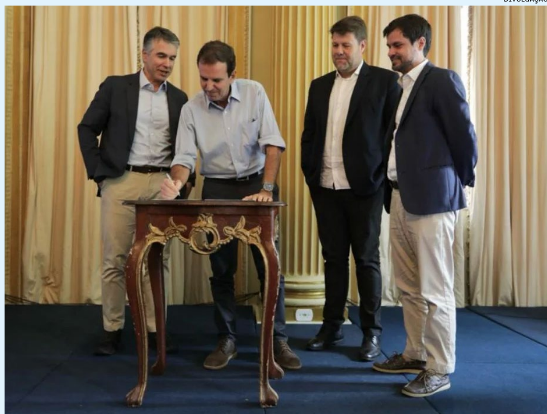
Parceria terá um investimento de R$ 270 milhões e visa atrair novas rotas e frequências de voos para o Aeroporto do Galeão

A proposta é que o acordo gere estímulos financeiros para atrair as grandes companhias aéreas e incentive que empresas que já operam no Galeão aumentem frequência de voos, impulsionando a receita direta e indireta para a cidade por meio do turismo de lazer e negócios.