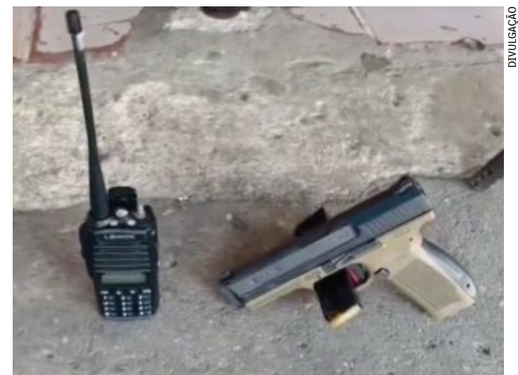
Pistola e rádio transmissor foram apreendidos durante ação

O caso foi encaminhado a 64ª DP (São João de Meriti). Não há informações sobre o estado de saúde do homem.