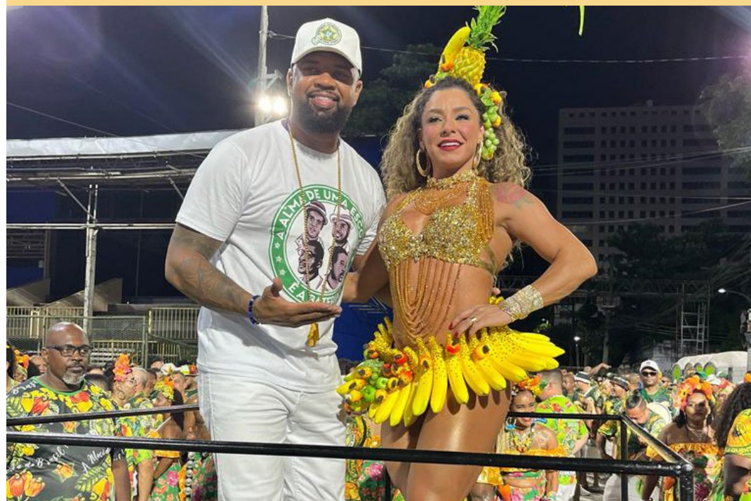
6 vezes CAMPEÃO DO CARNAVAL CARIÓCA, escola está sonhando com mais um título

bancadas, fez o público cantar, evoluir e trouxe de novo um gostinho perdido que a escola de Padre Miguel sentiu no último carnaval de 2023. "Pede Caju que dá, Pede Caju que Dou", assinado pela carnavalesco Marcus Ferreira, que pelo segundo ano consecutivo faz as honras de contribuir com seu brilhantismo artístico, que acredita veementemente na vitória, e se ela não chegar, de certo vai avançar e chegar pertinho do pódio, pela desenvoltura, desenvolvimento e saborosidade expostas nos figurinos e alegorias que estão prestes e deixar o público no desfile oficial, com água na boca e coração quentinho.