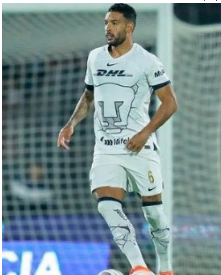
Defensor, de 26 anos, atua no futebol mexicano