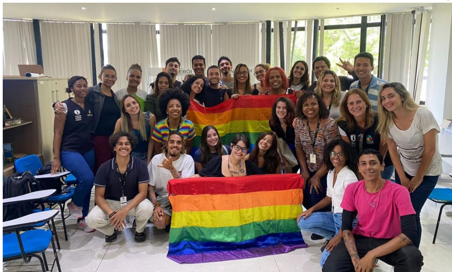
Tratamento do público LGBTQIA+ foi atualizado para promover a diversidade

A iniciativa marca a primeira ação de parceria entre a Codir e a Neltur, duas instituições cujos trabalhos incluem a excelência no atendimento ao público em geral – já que os CATs recebem turistas e visitantes do Brasil e do mundo. A Coordenadoria trabalha as questões inerentes ao público LGBTQIA+ especificamente.