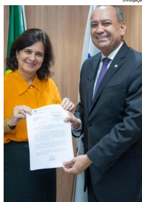
Encontro Focado em Projetos e Investimentos para Saúde na Baixada Fluminense e Interior do Estado