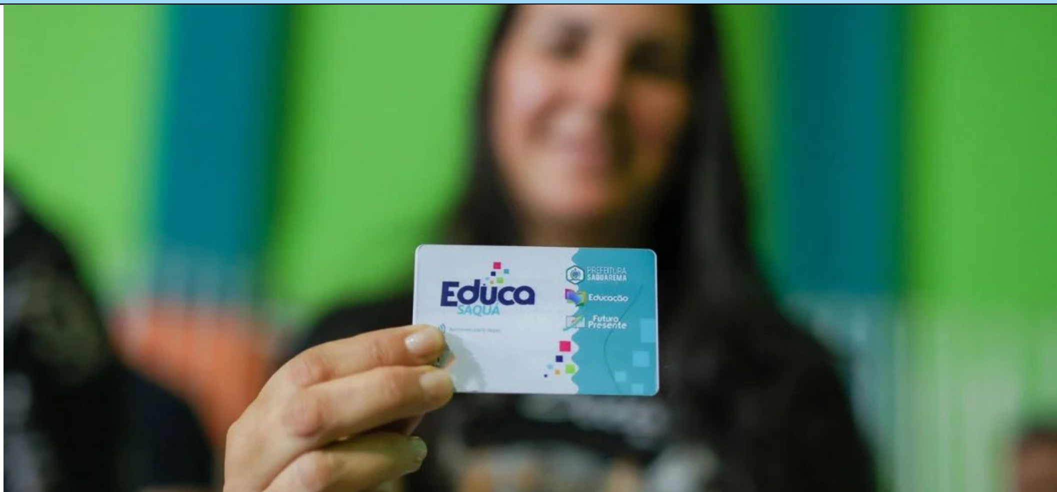
Evento de entrega simbólica dos cartões foi realizado na Escola Municipal Ismênia de Barros Barroso, em Jaconé