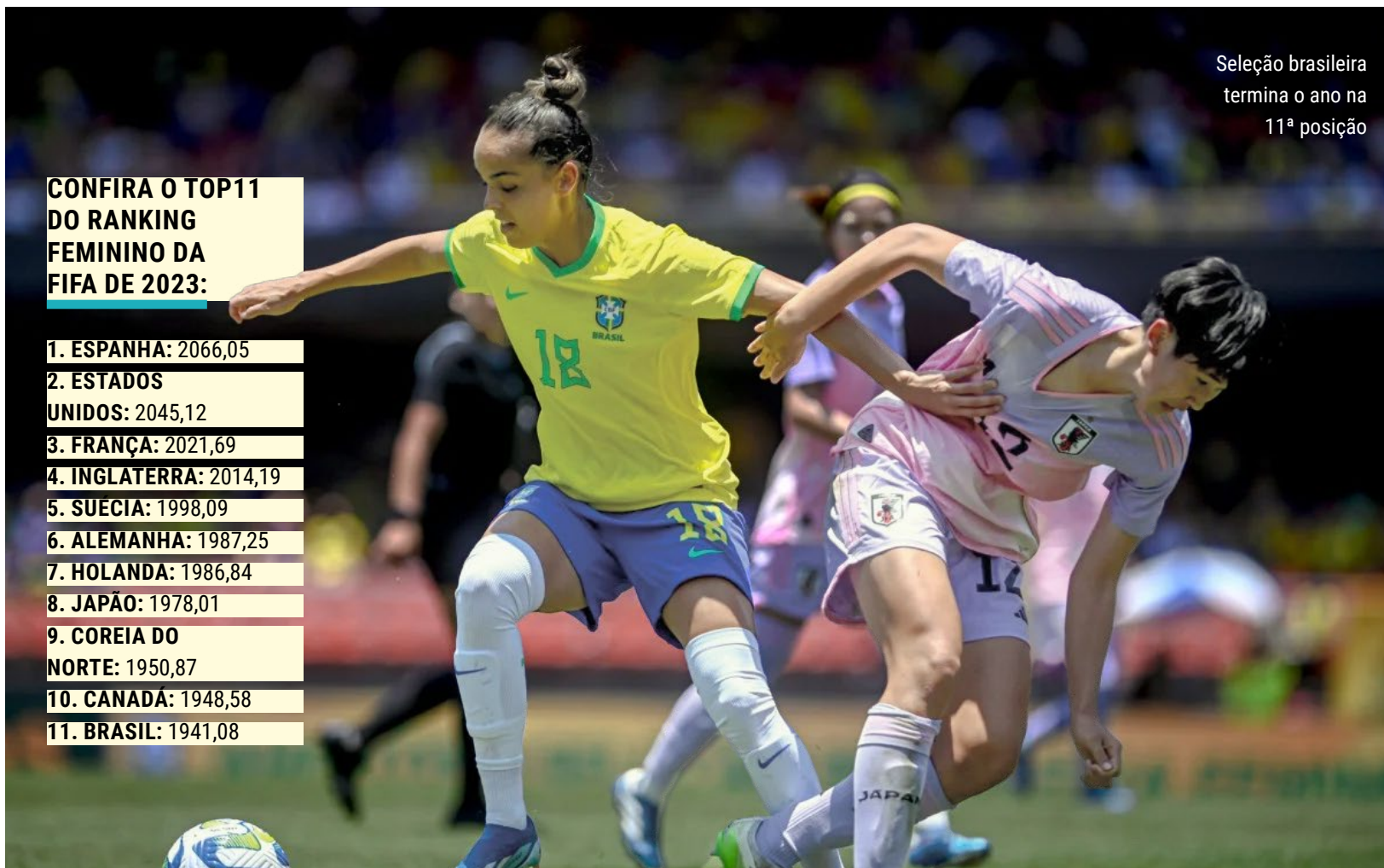
Seleção brasileira termina o ano na 11ª posição