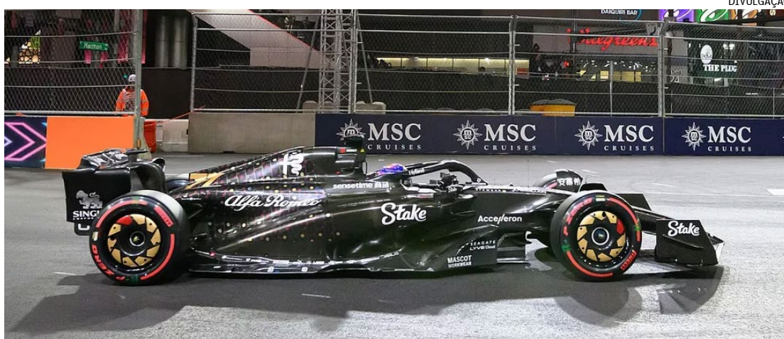
Equipe suíça passa a ter o nome do patrocinador principal pelos próximos dois anos

A Stake, empresa do ramo de cassinos online, já era patrocinadora da equipe suíça, mas agora entra como detentora dos naming rights. Já a Kick, serviço de streaming austrá-