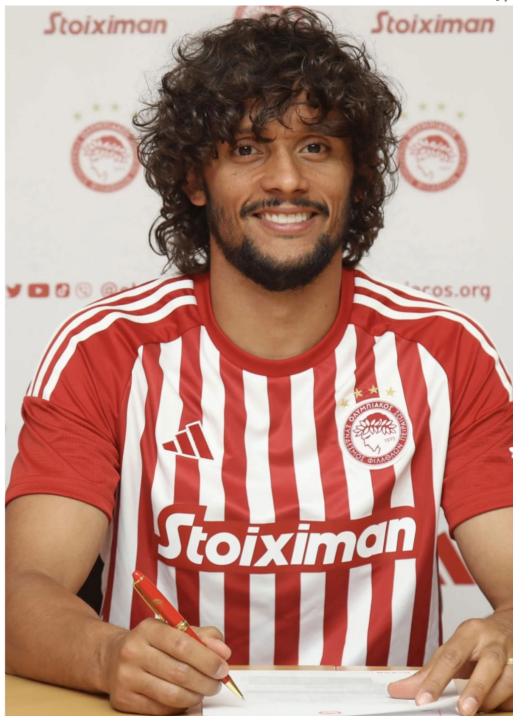
Rubro-Negro tem mais um foco para reforçar elenco

O apoiador foi consultado em outros momentos por clubes brasileiros sobre um eventual retorno, mas acabou rejeitando porque desejava se firmar no futebol europeu. No momento, a situação parece ter mudado, e Scarpa pode voltar ao Brasil.