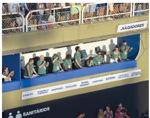
Fábio Costa / Liesa

Corpo julgador tem duas novidades em relação ao último ano