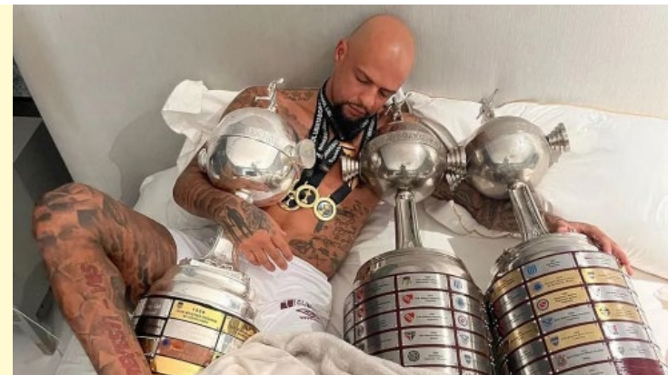
Zagueiro de 40 anos brinca com troféus conquistados por Fluminense e Palmeiras

taça da Libertadores na carreira no último sábado (4), diante do Boca Juniors, no Maracanã. O Fluminense venceu o time argentino por 2 a 1, na prorrogação, e se sagrou campeão do torneio pela primeira vez em sua história.