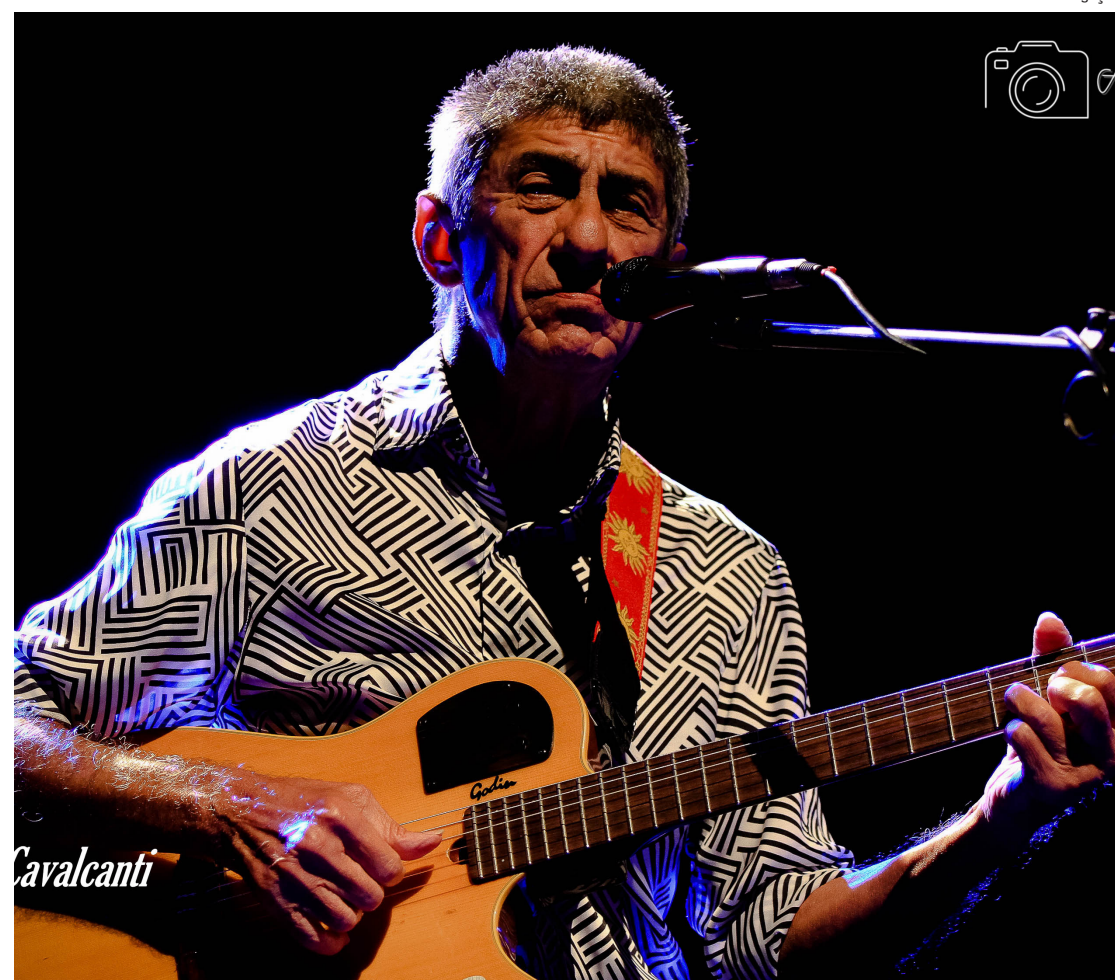
Compositor cearense festeja com os cariocas nesta sexta

Aos finais de semana, a partir do dia 11/11, as crianças poderão participar do Meet & Greet com o personagem Bitá. As sessões serão divididas em três horários diferentes em cada dia e o acesso é gratuito. Para participar, é necessário agendar o encontro via ANA (assistente virtual do shopping), as vagas são limitadas e estarão disponíveis para agendamento uma hora antes da primeira sessão. Nos encontros, as crianças poderão interagir diretamente com o personagem e tirar muitas fotos.