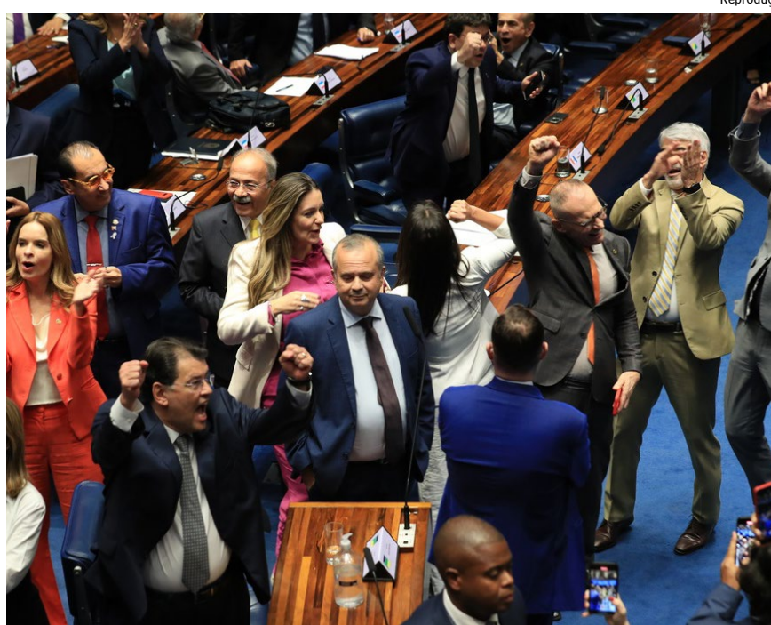
Relator acatou seis emendas durante discussão em plenário

posta enfrentou resistência de última hora de governadores do Sul e do Sudeste. Eles protestaram contra uma emenda acatada por Braga na CCJ que acrescentou três parágrafos ao Artigo 19 da PEC que prorroga, pela quarta vez, incentivos a montadoras de veículos do Nordeste e do Centro-Oeste. Essa prorrogação havia sido derrubada na Câmara, em julho, quando os deputados rejeitaram um destaque para prorrogar os benefícios para as duas regiões.