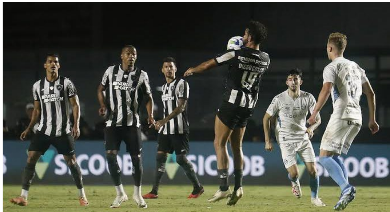
Brasileirão agora tem três times na frente com 59 pontos; alvinegros ainda lideram pelos critérios de desempate

Na volta do intervalo, já no primeiro minuto, foi a vez