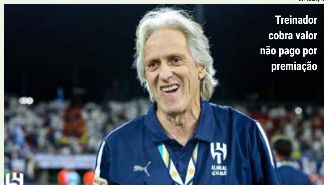
Treinador cobra valor não pago por premiação