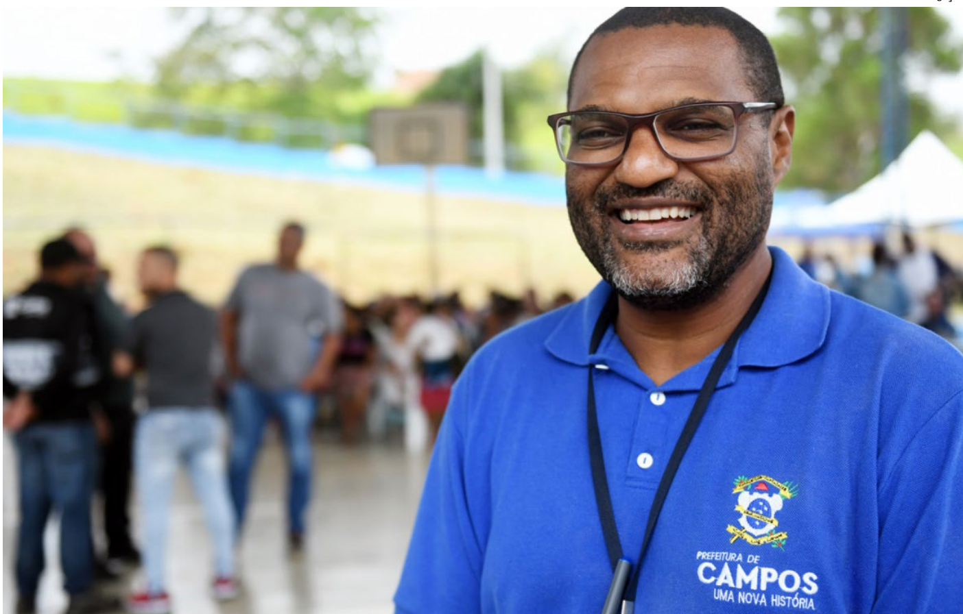
Indicativos da Firjan mostram que Campos subiu 50 posições nos últimos dois anos, em nível estadual

mudar veio com a conscientização da situação fiscal: “Em 2020, o IGFF de Campos para o indicador gastos com pessoal, por exemplo, era apenas 0,2748, situando o município na 3994ª posição nacional e 61ª no estado, neste indicador em particular; em 2022, atingiu o índice máximo neste quesito, ocupando a primeira posição tanto no ranking nacional quanto estadual”.