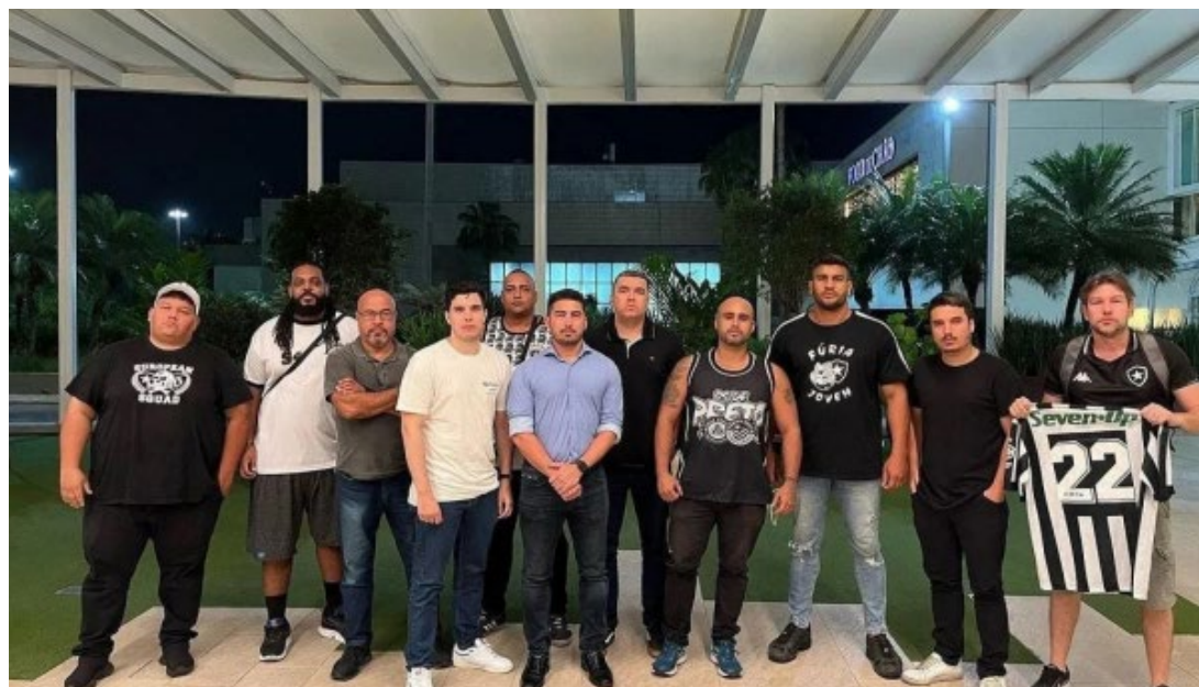
Representantes prometeram apoio até o fim do Brasileirão, mas fizeram cobranças