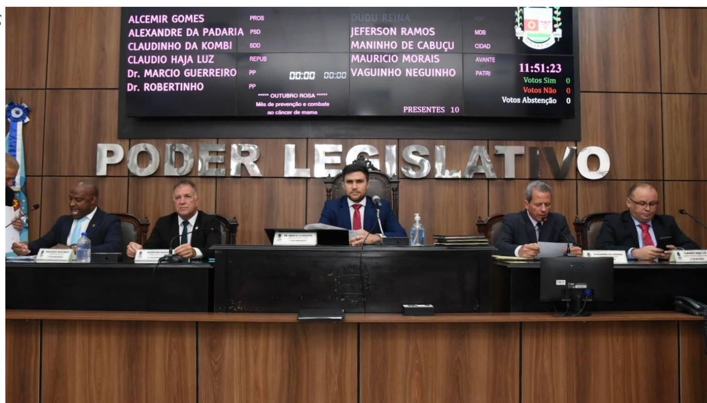
Proposta foi aprovada na última semana