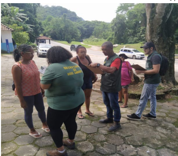
A ação visa diminuir a poluição nos rios, cachoeiras, praias e córregos da cidade

Segundo a SMMA, a equipe técnica da pasta segue fazendo o mapeamento das áreas onde estão localizados os corredores hídricos em Mangaratiba, para que futuramente, o projeto possa ser ampliado para os demais distritos.