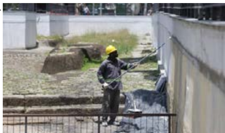
Iniciados em julho, trabalhos de restauração e instalação de guarda-corpo estão praticamente concluídos no sítio arqueológico que fica na Região da Pequena África, na Saúde

As obras de valorização do sítio arqueológico do Cais do Valongo, localizado na Pequena África, na Saúde, Zona Portuária do Rio, parecem estar perto do fim. Nesta terça-feira (7), no mês da Consciência Negra, os trabalhos completaram exatos quatro meses e a expectativa é que a conclusão se dê até o fim de novembro, com um evento de inauguração. A expectativa, segundo responsáveis pela obra, é que a conclusão ocorra ainda neste mês, com a instalação de um novo esquema de iluminação. Atualmente, já foi concluída a parte do guarda-corpo e também a colocação dos módulos expositivos.