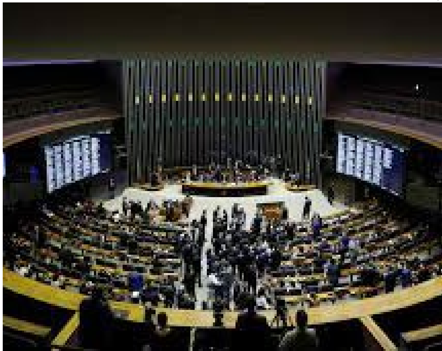
Tratamento será garantido em caso de reabilitação e prevenção de complicações. Atualmente, lei já garante direito à cirurgia plástica reconstrutiva

“Isso, dentre tantos outros benefícios, fatalmente proporcionará melhoria na qualidade de vida da mulher e poderá ser um estímulo a mais para que decida se submeter à cirurgia reparadora”, diz a deputada no parecer.