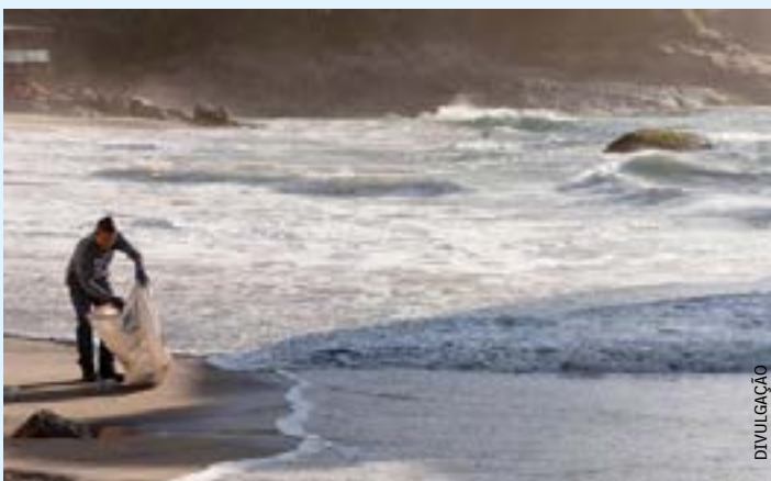
Itaguaí, Maricá e a capital fluminense são destaques na coleta, que troca resíduos por bonificações. O trabalho é realizada no estado desde 2019, em um raio de até 50 quilômetros de zonas costeiras

Os participantes do projeto recolhem o plástico em um raio de até 50 quilômetros de zonas costeiras e levam o material para algum ponto de coleta cadastrado. Os coletores recebem um valor oferecido em cada posto pelo quilo de material plástico mais uma bonificação de cerca de 35 centavos por venda - a chamada