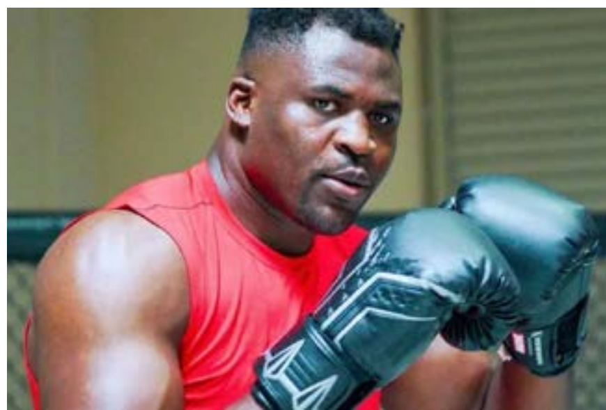
Durante entrevista, Ngannou foi questionado sobre como presidente do UFC deve estar se sentindo com o sucesso do ex-funcionário no Boxe

Uma das maiores rivalidades do MMA atualmente não se trata especificamente de dois atletas. O lutador Francis Ngannou e Dana White, presidente do UFC, travam uma batalha de poder no cenário global. Quando “The Predator” recusou renovar o contrato com o Ultimate, o “Big Boss” disparou contra o camaronês.