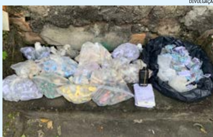
Comunidades São Simão e Caixa D'água, em Queimados, serviram de abrigo para envolvidos em guerra de facção, segundo a corporação

De acordo com a corporação, agentes do 24º BPM (Queimados) foram alvos de disparos durante patrulhamento na localidade. Houve troca de tiros e um homem foi atingido. Ele foi socorrido e encaminhado para a Unidade de Pronto Atendi-