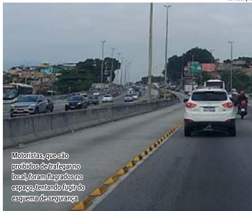
Motoristas, que são proibidos de trafegar no local, foram flagrados no espaço, tentando fugir do esquema de segurança

Quando a Transbrasil entrar em operação, a seletiva dará lugar ao corredor do BRT. Os ônibus seguirão podendo utilizar a via, mas agora compartilhando o espaço com os articulados “amarelinhos”. Em virtude do aumento do número de ônibus, o corredor será ampliado entre o Terminal Margaridas e o Cemitério do Caju, passando a ocupar duas faixas da pista, em ambos os sentidos. Apenas os articulados poderão fazer parada para embarque e desembarque de passageiros nas estações de BRT.