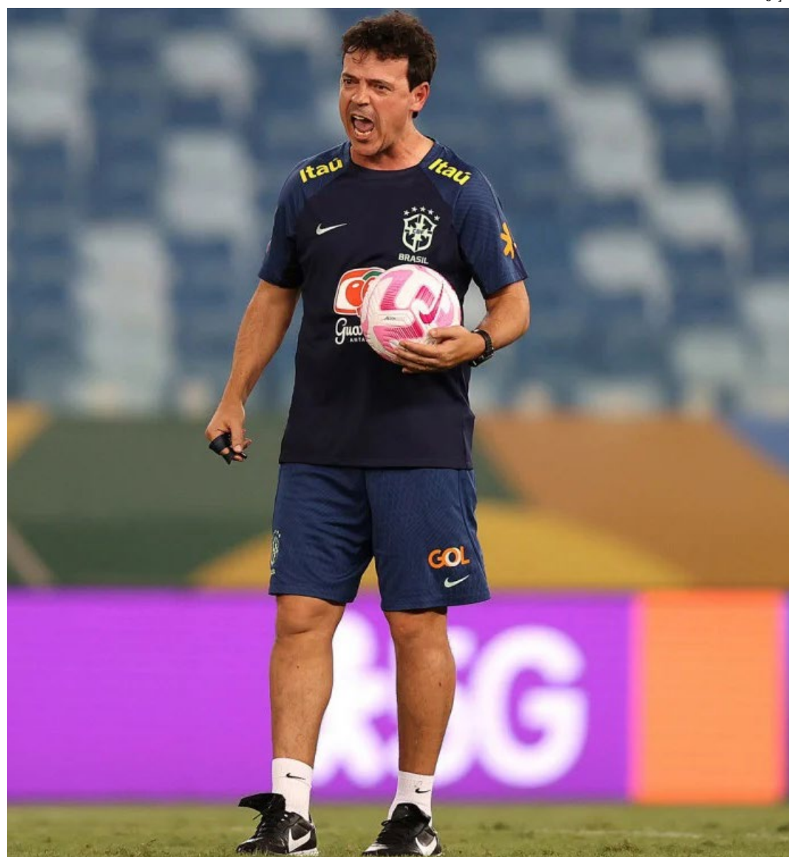
Partida irá acontecer em Wembley e será a primeira da seleção brasileira em 2024

ros compromissos da seleção brasileira no próximo ano. No início de junho, haverá uma nova Data Fifa com possibilidades de amistosos de preparação para a Copa América, que será disputada entre 20 de junho e 14 de julho.