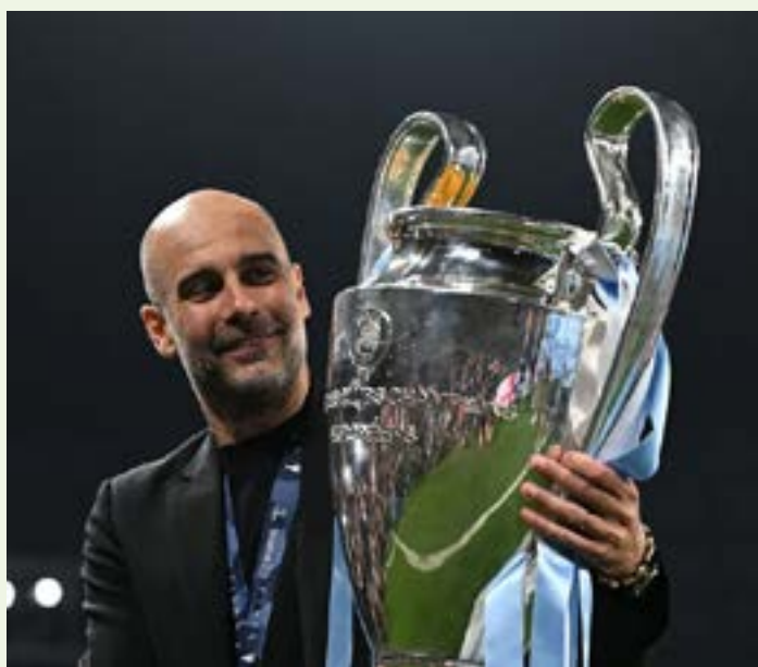
Treinador do Manchester City ressaltou expectativa para o torneio, que será disputado em dezembro na Arábia Saudita

“Nós nunca ganhamos antes, claro, já que para participar você precisa ganhar uma Champions, e nós acabamos de vencer a primeira. Os jogadores estarão prontos, mas são duas partidas.