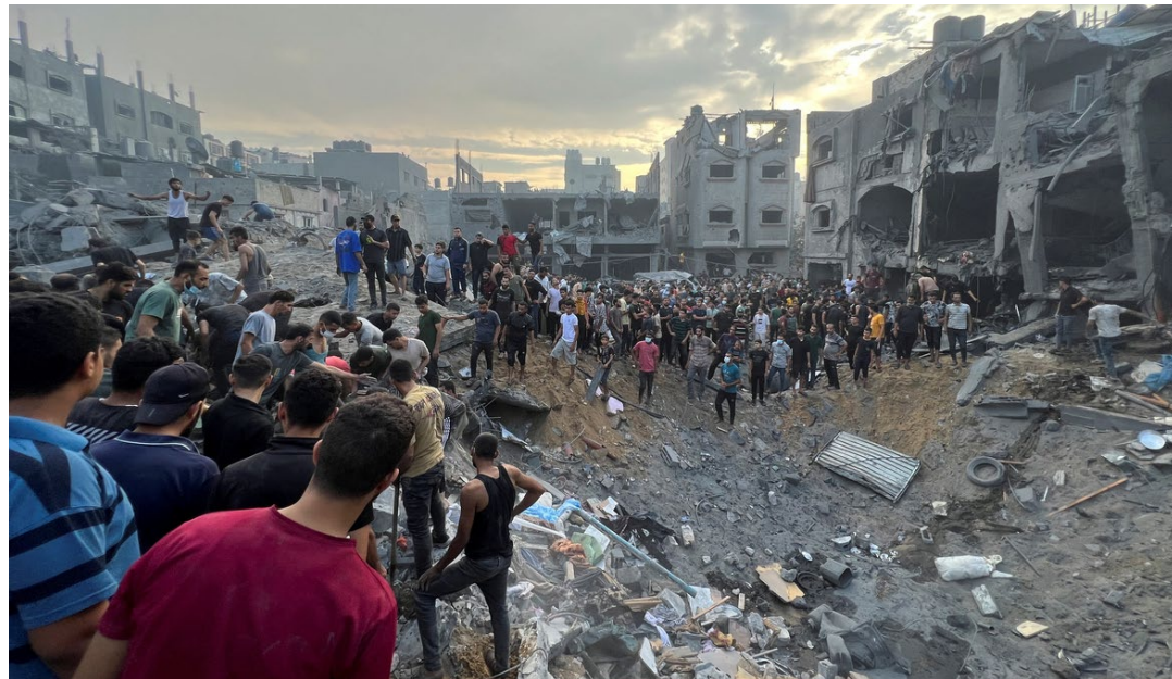
Conflito entre Israel e o Hamas é o mais grave em 75 anos

um sábado, quando o Hamas disparou 5 mil foguetes, a partir da Faixa de Gaza, para atingir cidades israelenses, conforme notícias de agências internacionais. Lideranças do grupo afirmaram que a operação tem o propósito de “acabar com a última ocupação na Terra” e é uma resposta ao bloqueio imposto por Israel aos palestinos de Gaza, que já dura mais de uma década.