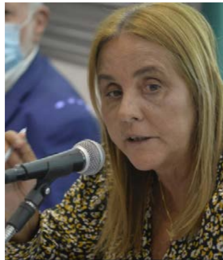
Acusado foi pego em Campo Grande

A ocorrência foi registrada na 35ª DP (Campo Grande).