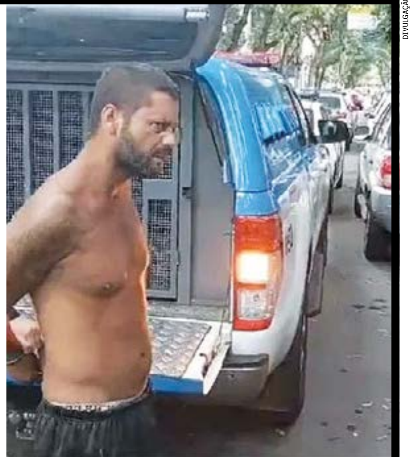
Ao ser preso, assaltante disse que a peça foi roubada por outros criminosos na Central do Brasil

O Iphan encaminhou fotos e a ficha da peça furtada no Inventário Nacional de Bens Móveis e Integrados para contribuir com os trabalhos de investigação da Polícia Federal. O caso também está sendo investigado na 5ª DP (Mem de Sá), onde foi registrado.