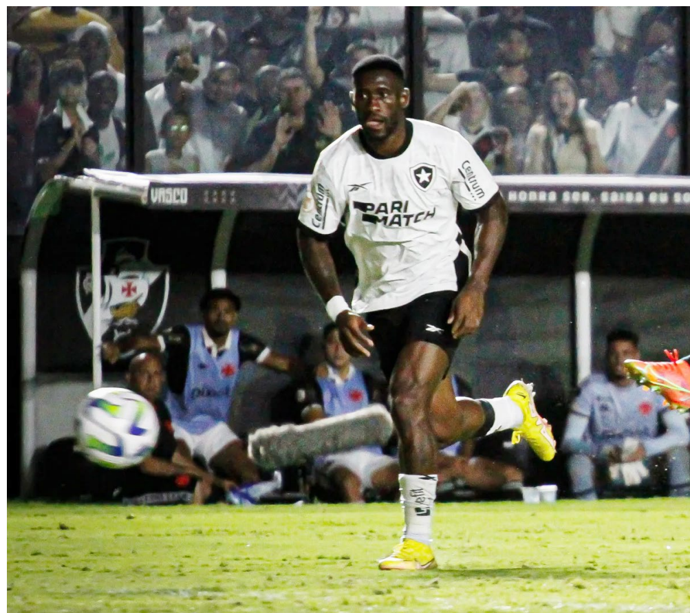
Cruz-Maltino deixou a zona de rebaixamento do Brasileiro

Outros clubes também correm risco. O Bahia tem 24%, o Santos aparece com 22% e o Corinthians com 12%. Com possibilidades menores estão: Cuiabá com 5%, Inter com 3%, São Paulo com 2% e Fortaleza com 1%.