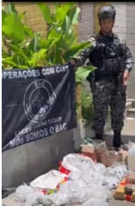
Operação foi realizada com o apoio de cães farejadores