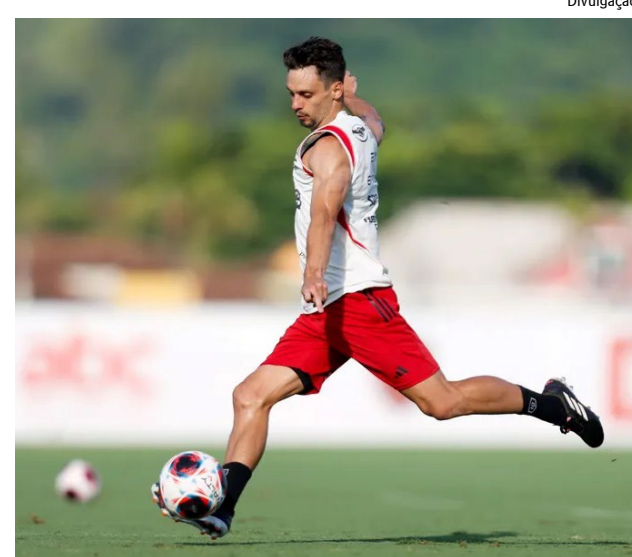
Jogador, de 30 anos, deverá deixar o clube no fim do ano

O jogador, de 30 anos, foi contratado pelo Flamengo em 2019, sendo peça fundamental naquela temporada, quando o Rubro-Negro conquistou o Carioca, o Brasileiro e a Libertadores. Nas temporadas seguintes, passou a sofrer de problemas físicos.