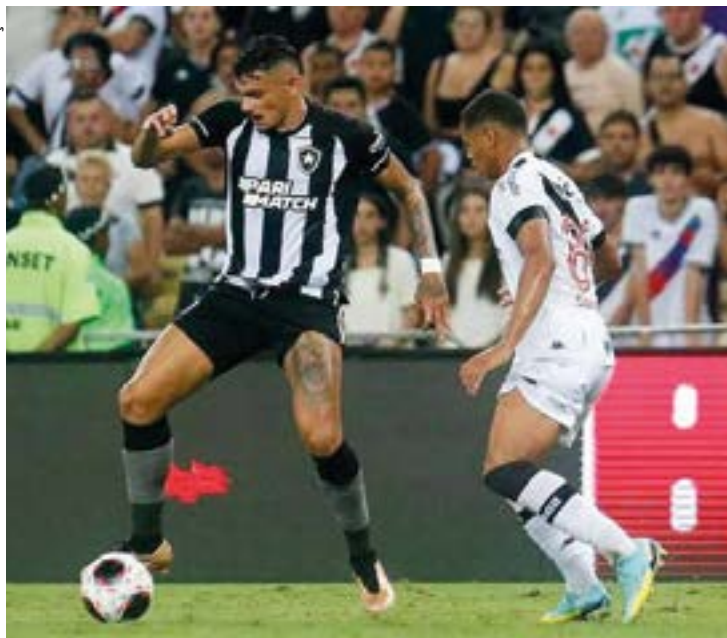
O bilhete custa R$ 80, com meia-entrada a R$ 40

O Vasco divulgou as informações sobre a venda de ingressos para a torcida do Botafogo para o clássico da próxima segunda-feira (6/11), às 19h, em São Januário, pela 32ª rodada do Campeonato Brasileiro-2023.