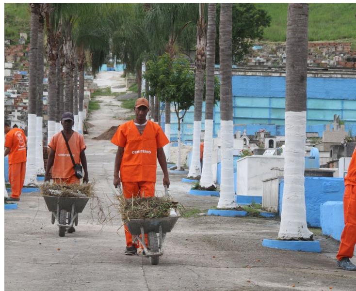
Serviços de manutenção e limpeza estão sendo realizados