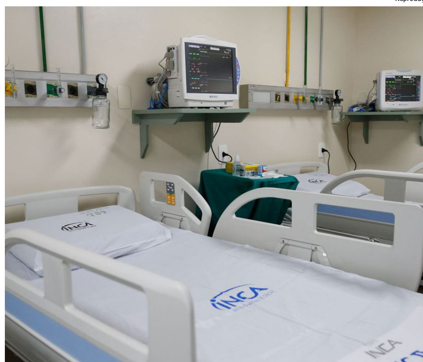
Dados são da Sociedade Brasileira de Urologia

Os sintomas são aumento da frequência de urinar durante o dia, diminuição da força e do calibre do jato urinário, dificuldade para iniciar a