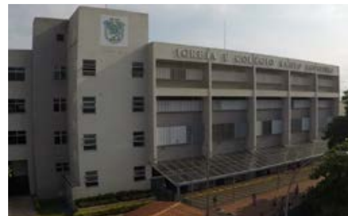
Estudantes são suspeitos de manipular fotos de meninas e compartilhá-las em grupos

Em nota, a Delegacia de Proteção à Criança e ao Adolescente (DPCA) informou que instaurou procedimento para apurar os fatos e que todos os envolvidos estão sendo chamados para serem ouvidos na especializada. Além disso, está sendo feita uma investigação para identificar a autoria do crime e