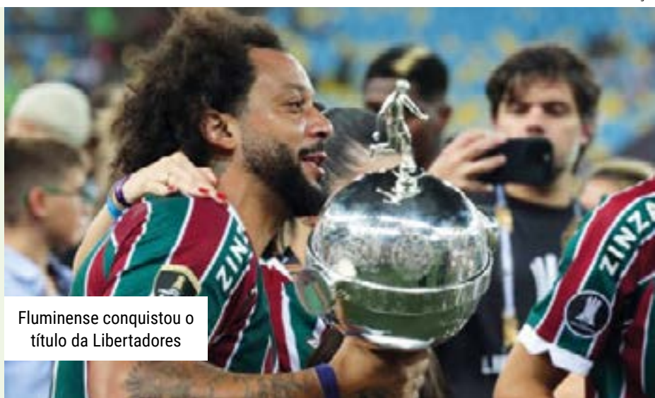
Fluminense conquistou o título da Libertadores

JORNAL ESPANHOL EXALTA NOVA CONQUISTA DE MARCELO: 'REINA NA AMÉRICA DO SUL'