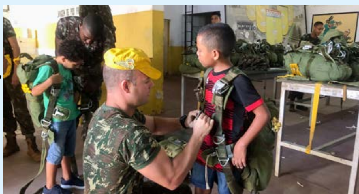
Cerca de dez usuários do Projeto Florescer visitaram as instalações do Exército Brasileiro na Vila Militar

Nesta semana, crianças do Alto do Uruguai tiveram uma quarta-feira diferente. No último dia 24, a parceria do Núcleo de Atendimento de Medidas (NAM) com o Projeto Florescer levou cerca de dez mesquitesenses mirins que utilizam a Sala de Leitura Carolina Maria de Jesus e fazem aulas de xadrez no Fórum de Mesquita para conhecer o Batalhão Dompsa, de paraquedistas do Exército Brasileiro, na Vila Militar.