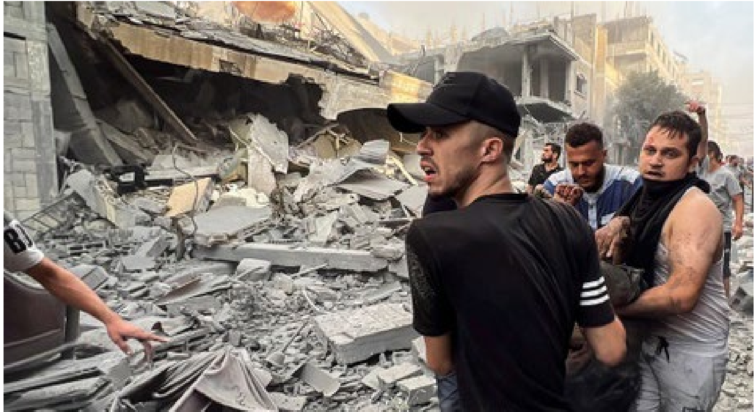
Maioria deixou terra natal por ter sido expulsa

“Imagine você sendo forçado a largar a sua casa agora, com a roupa do seu corpo, e fugir para outro país a pé, ou de carro, com o pouco que você tem. A sensação do desterro é algo que nunca vai abandonar o refugiado. Ele foi forçado a sair