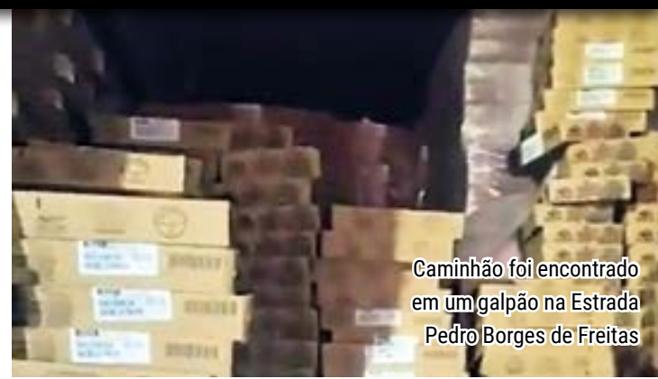
Caminhão foi encontrado em um galpão na Estrada Pedro Borges de Freitas

De acordo com a corporação, agentes do 41 BPM (Irajá) foram acionados para a Estrada Pedro Borges de Freitas para verificar um roubo de cargas. Ao chegarem no local, localizaram um galpão de uma fábrica desativada. Em seu interior, foram encontrados o caminhão com uma parte da carga e o motorista do veículo. A ocorrência foi registrada na Delegacia de Roubos e Furtos de Cargas (DRFC).