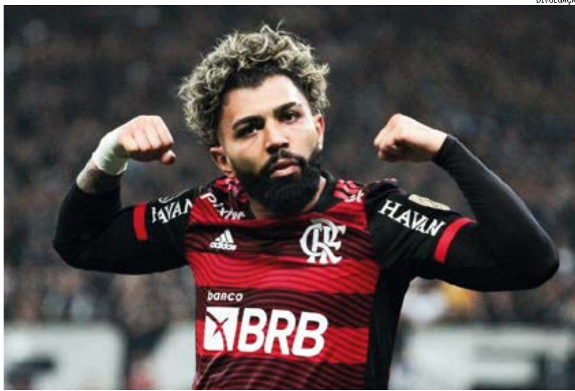
Clube inglês quer a contratação do atacante brasileiro, mas tem a concorrência do Milan

Com 12 gols marcados em 11 partidas de Premier League, o Manchester United pretende reforçar seu ataque na próxima janela de transferência, em janeiro do ano que vem, e já tem um alvo para a posição. Segundo o jornal inglês The Mirror, o clube do noroeste da Inglaterra quer o atacante brasileiro Gabigol, do Flamengo, e está disposto a oferecer Antony por empréstimo.