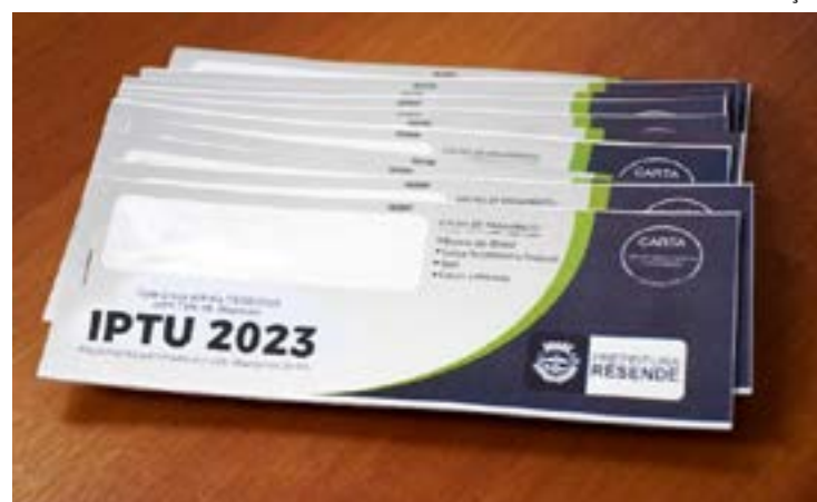
Não pagamento do tributo gera multas, juros e cadastro na Dívida Ativa do município