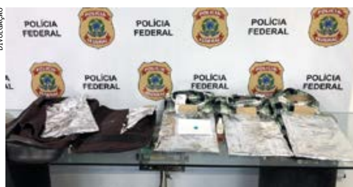
Segundo a Polícia Federal, que conduziu a ação, o destino final da droga seria a cidade de Johannesburgo