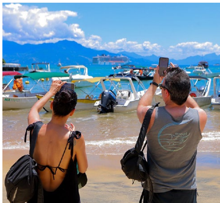
Festa acontece nos dias 16, 17 e 18 de novembro