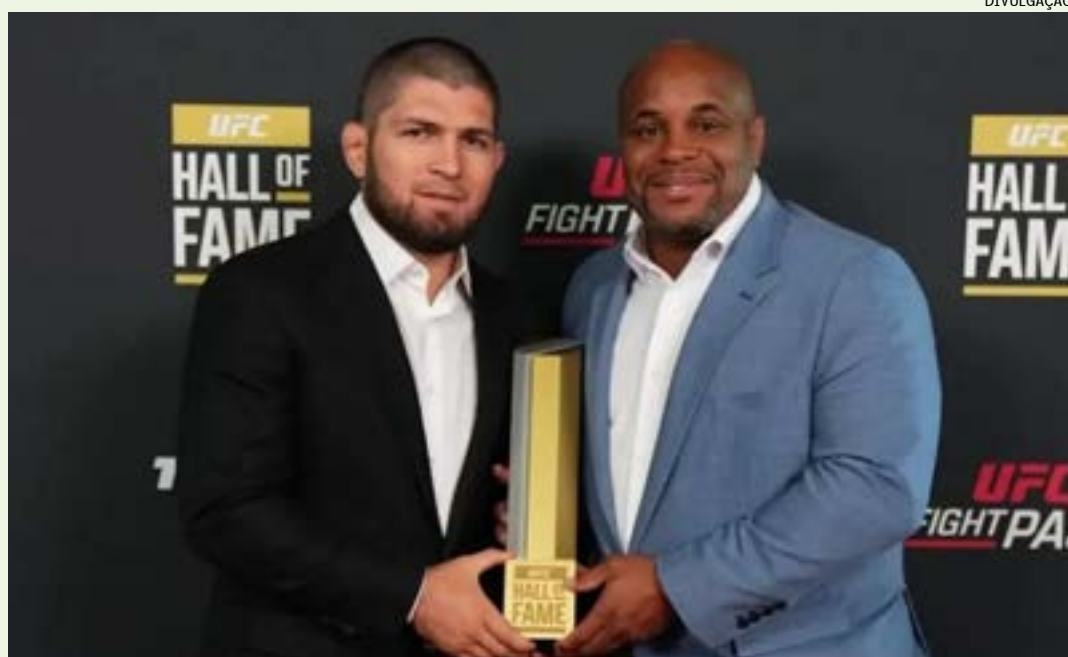
Cormier, ex-lutador e atualmente comentarista, foi enfático ao projetar o UFC 300 durante o podcast “DC&RC”

“O UFC 100 teve Brock, né? Com Georges St-Pierre e todos aqueles caras. O UFC 200 teve Brock, era para eu e Jones também, mas acabei enfrentando o Anderson Silva. O UFC 300 tem que ter um nome assim. Não temos mais Brock Lesnar. Então, acho que você tem que ter um Conor McGregor contra Michael