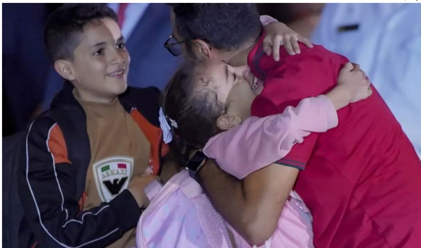
Voo foi o décimo da Operação Voltando em Paz

A garota demonstrou alívio em deixar a região e voltar para casa. “Sinto que estou em uma