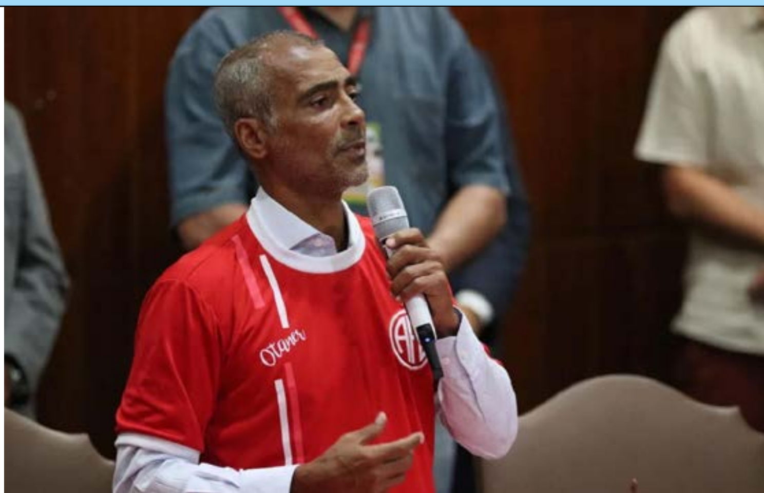
Baixinho foi eleito presidente do clube carioca na última quinta-feira (9)