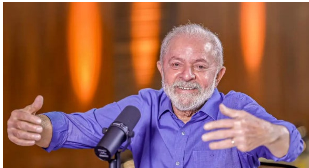
Segundo turno das eleições no país vizinho ocorre no próximo domingo

No próximo domingo (19), os candidatos Sergio