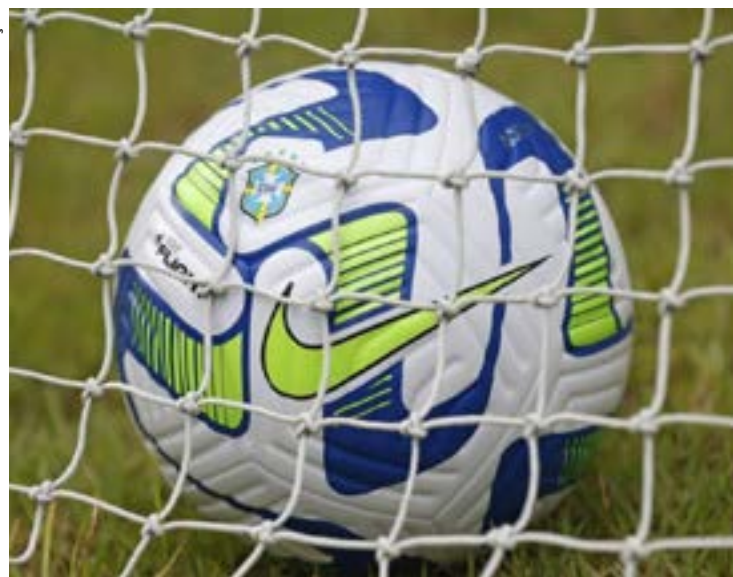
Entidade atendeu pedido dos clubes, que se viam em risco por conflito com o calendário europeu