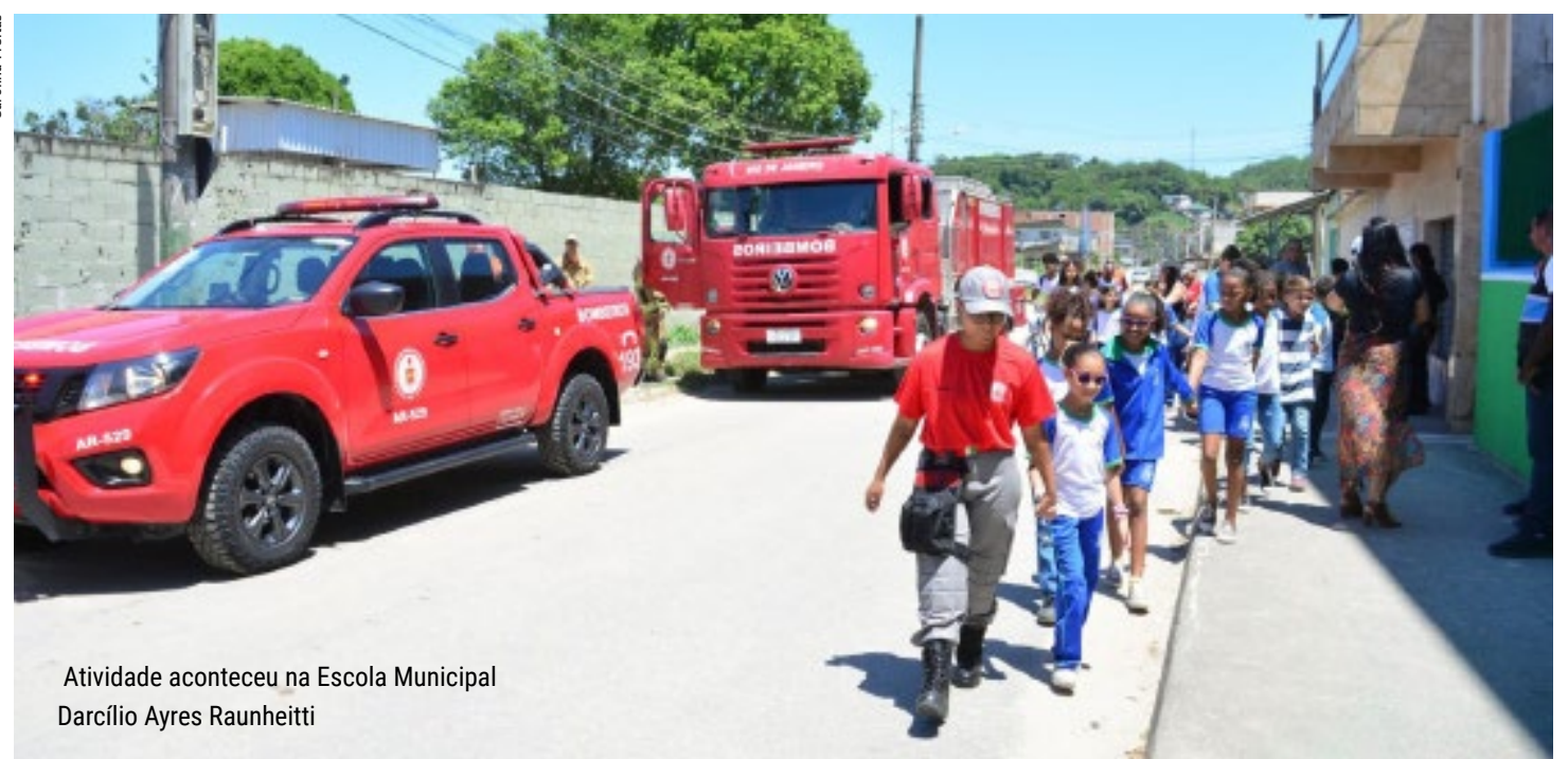
Atividade aconteceu na Escola Municipal Darclício Ayres Raunheitti

Nada melhor do que estar preparado para qualquer eventualidade dentro de uma escola. Pensando nisso, a Prefeitura de Japeri, por meio da Secretaria Municipal de Defesa Civil, realizou uma simulação de incêndio e desocupação de espaço na Escola Municipal Darclício Ayres Raunheitti. A iniciativa aconteceu nesta quinta-feira (9) e contou com a participação de mais de 200 alunos, educadores e equipes da Defesa Civil, Corpo de Bombeiro, Samu e Segurança Presente.