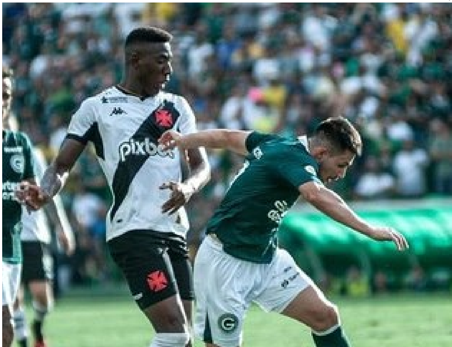
Times seguem na zona de rebaixamento

Na próxima rodada, o Goiás recebe o Bragantino no dia 2, às 18h (de Brasília), enquanto o Vasco visita o Cuiabá, no mesmo dia, mas mais cedo, às 17h.