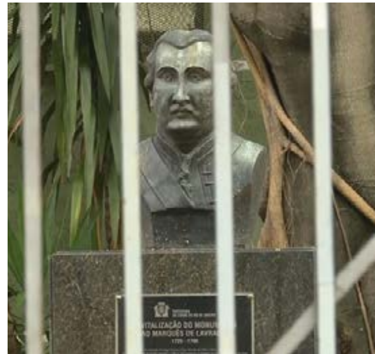
O texto ainda passará pelo prefeito Eduardo Paes para ser sancionado ou vetado

Outro exemplo de estatura que seria tirada das ruas seria a do Marquês de Lavradio, na Rua do Lavradio. O Marquês, Dom Luis de Almeida Portugal Soares, foi vice-rei no Brasil