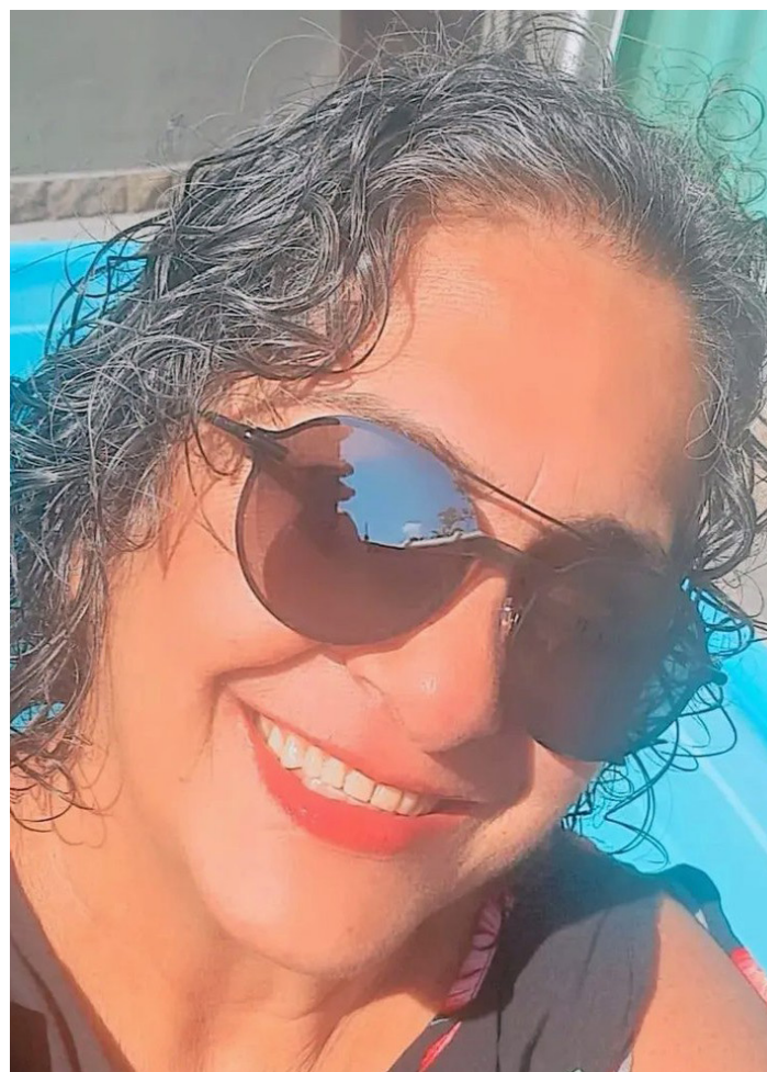
Tiroteio em Queimados deixa duas pessoas ligadas à política mortas