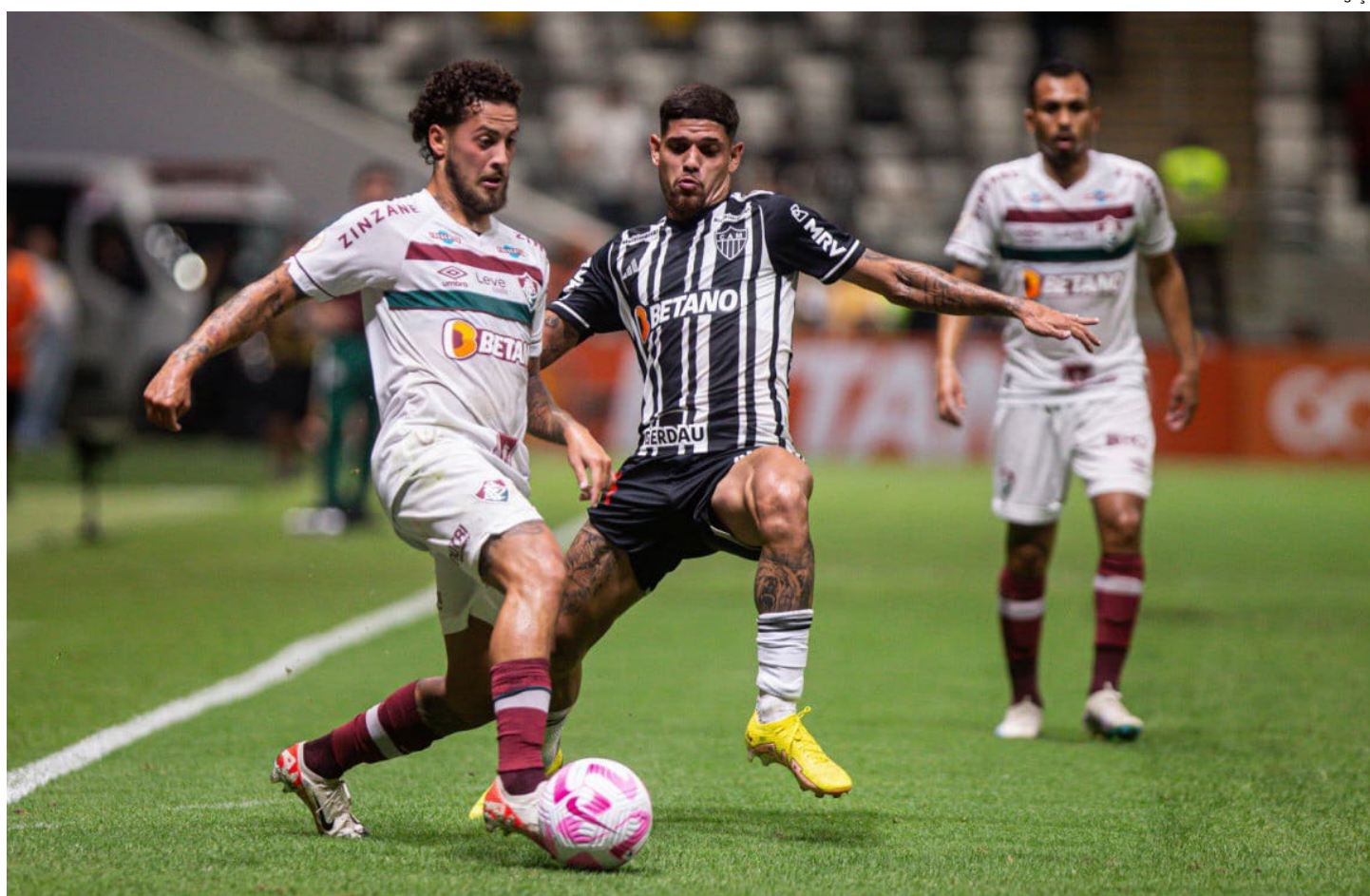
Apesar do resultado, o Tricolor não pode ser ultrapassado na tabela

O Fluminense foi à Arena MRV com boa parte dos titulares poupados e saiu de “mãos vazias”. Sem muita inspiração, o Tricolor das Laranjeiras perdeu para o Atlético-MG por 2 a 0, na noite deste sábado, 28, em partida válida pela 30ª rodada do Campeonato Brasileiro. Paulinho (2) marcou os gols do jogo.