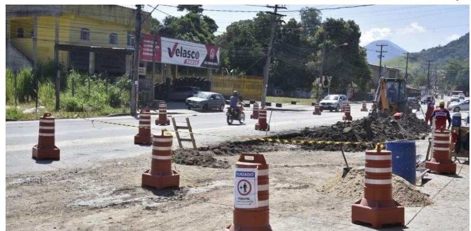
O bloqueio irá durar cerca de 6 meses

zado pelos moradores do Marquês e os condutores que estiverem se dirigindo para Niterói. Estes últimos, precisarão acessar ainda, um pequeno trecho em mão dupla, em frente ao Condomínio Helena Varella.