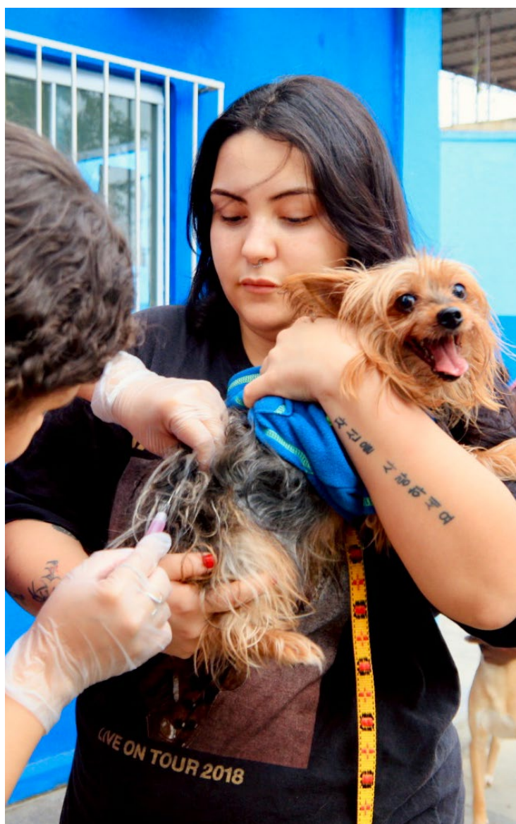
Foram 11.275 pets entre cães e gatos vacinados