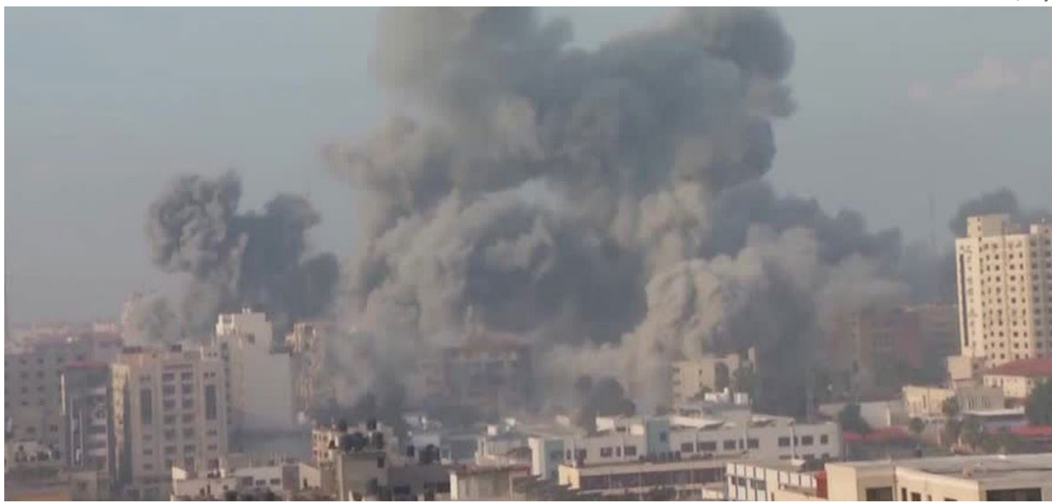
Chanceleres brasileiro e egípcio conversaram por telefone

“Creio que esta será a saída para evacuar os brasileiros que se encontram correndo riscos nesta região conflagrada”, acrescentou o chanceler brasileiro, afirmando contar com o apoio egípcio na liberação da passagem dos brasileiros pelo posto de fronteira, fechado devido à escalada da violência na região em função do