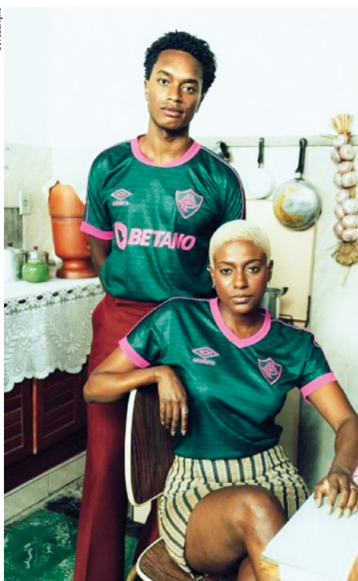
Nova camisa do Tricolor tem as cores verde e rosa em referência à Mangueira, grande paixão do compositor

O Fluminense divulgou na manhã desta quarta-feira o seu novo terceiro uniforme para a atual temporada. O Tricolor fez uma homenagem a Angenor de Oliveira, o Cartola, um dos maiores nomes da história da música brasileira, que completaria nesta quarta: 115 anos.