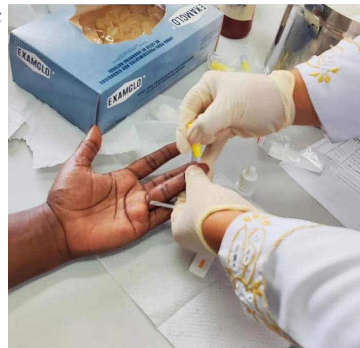
Ação é considerada inovadora no SUS

“A hanseníase é uma doença que tem tratamento e cura. Entretanto, o estigma que cerca a doença e o núcleo familiar do doente é enorme. Isso dificulta em muito a procura pelo diagnóstico e a adesão do paciente ao tratamento. A detecção precoce, aliada ao tratamento oferecido em tempo oportuno, reduz consideravelmente as chances de a pessoa ter alguma deficiência ou lesão permanente”, afirmou.