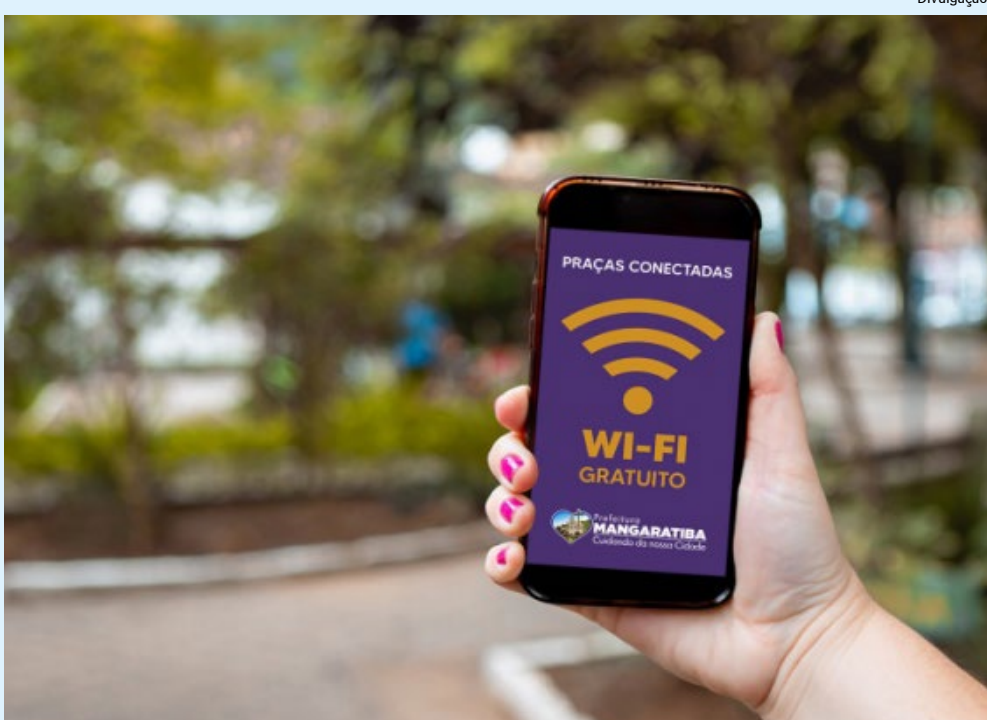
O projeto 'Praças Conectadas' chegou ao município em 2020, e hoje conta com cerca de 22 pontos de wi-fi gratuito