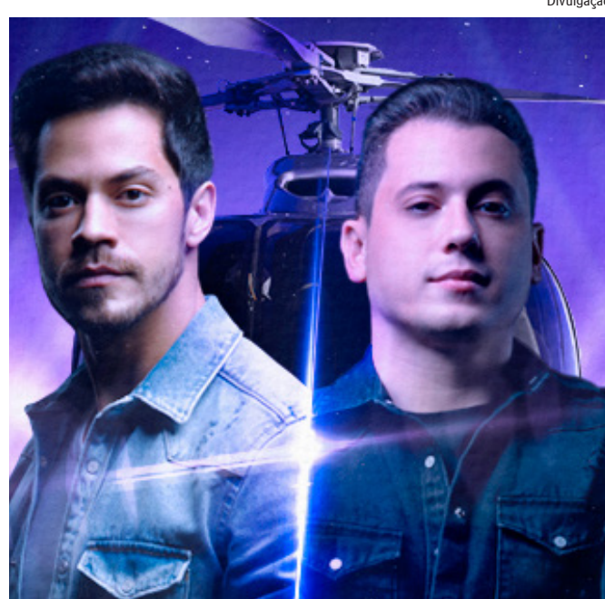
Com mais de 15 anos de carreira, os brasileiros são considerados os maiores ilusionistas da América Latina

Os artistas, que ficaram famosos devido ao quadro no Fantástico (TV Globo), são mestres em desafiar o impossível de forma inteligente e tecnológica, a visão moderna utilizada por eles faz com que esse misterioso universo se torne ainda mais encantador, se distanciando da imagem clássica e tradicional do mágico. Eles já se apresentaram em mais de 20 países e impactaram mais de 2,5 milhões de pessoas por meio de seu trabalho.