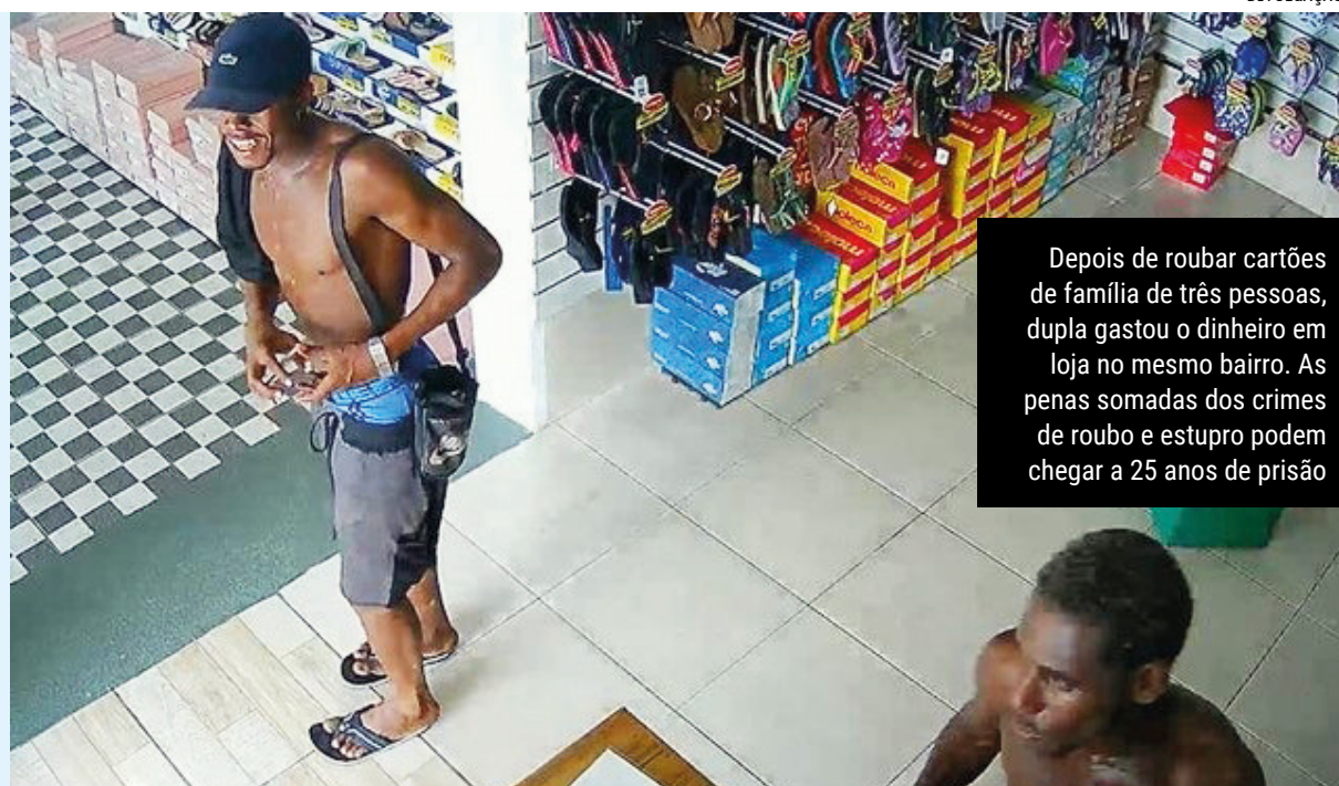
Depois de roubar cartões de família de três pessoas, dupla gastou o dinheiro em loja no mesmo bairro. As penas somadas dos crimes de roubo e estupro podem chegar a 25 anos de prisão

Agentes da Delegacia da Criança e do Adolescente Vítima (DCAV) identificaram o suspeito após uma troca de informações com a agência Homeland Security Investigations (HSI), da Embaixada dos Estados Unidos em Brasília, em conjunto com o Laboratório de Operações Cibernéticas (Ciberlab) do MJSP.