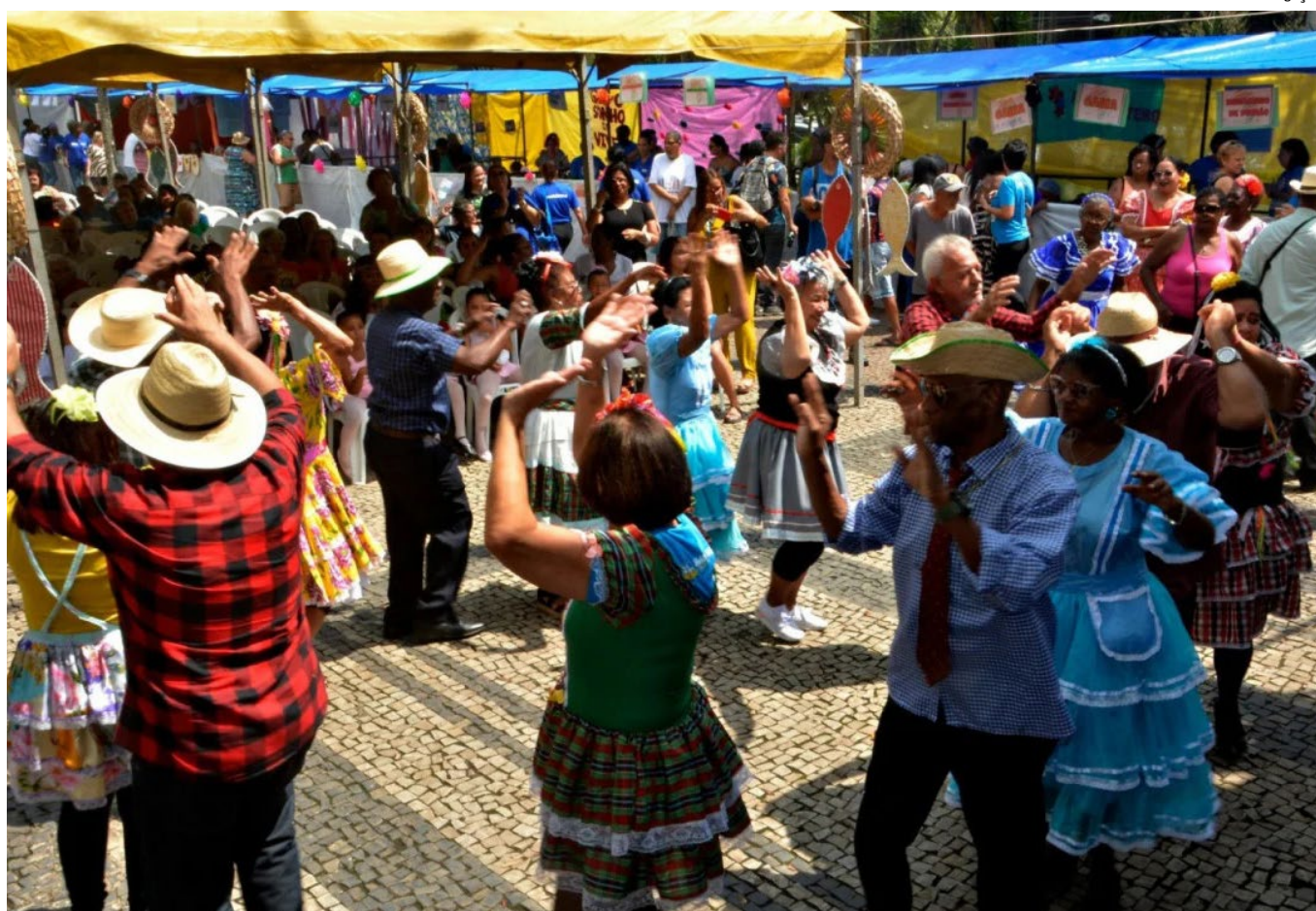
Usuários dos centros de convivência comemoraram sucesso do evento na Praça Sávio Gama, com música e comida típica de regiões do país