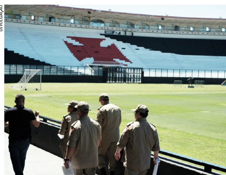
Melhorias que o local vai receber não são estruturais

Durante o período de fechamento do estádio, o Cruz-Maltino já havia iniciado o processo de algumas melhorias. Na próxima temporada, o Vasco deverá ter compromissos no estádio a partir de janeiro.