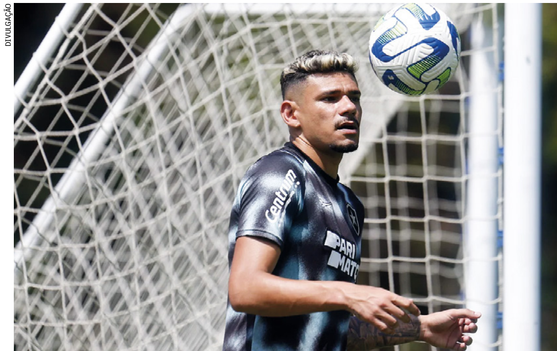
Atacante, de 32 anos, tem contrato até o fim de 2024