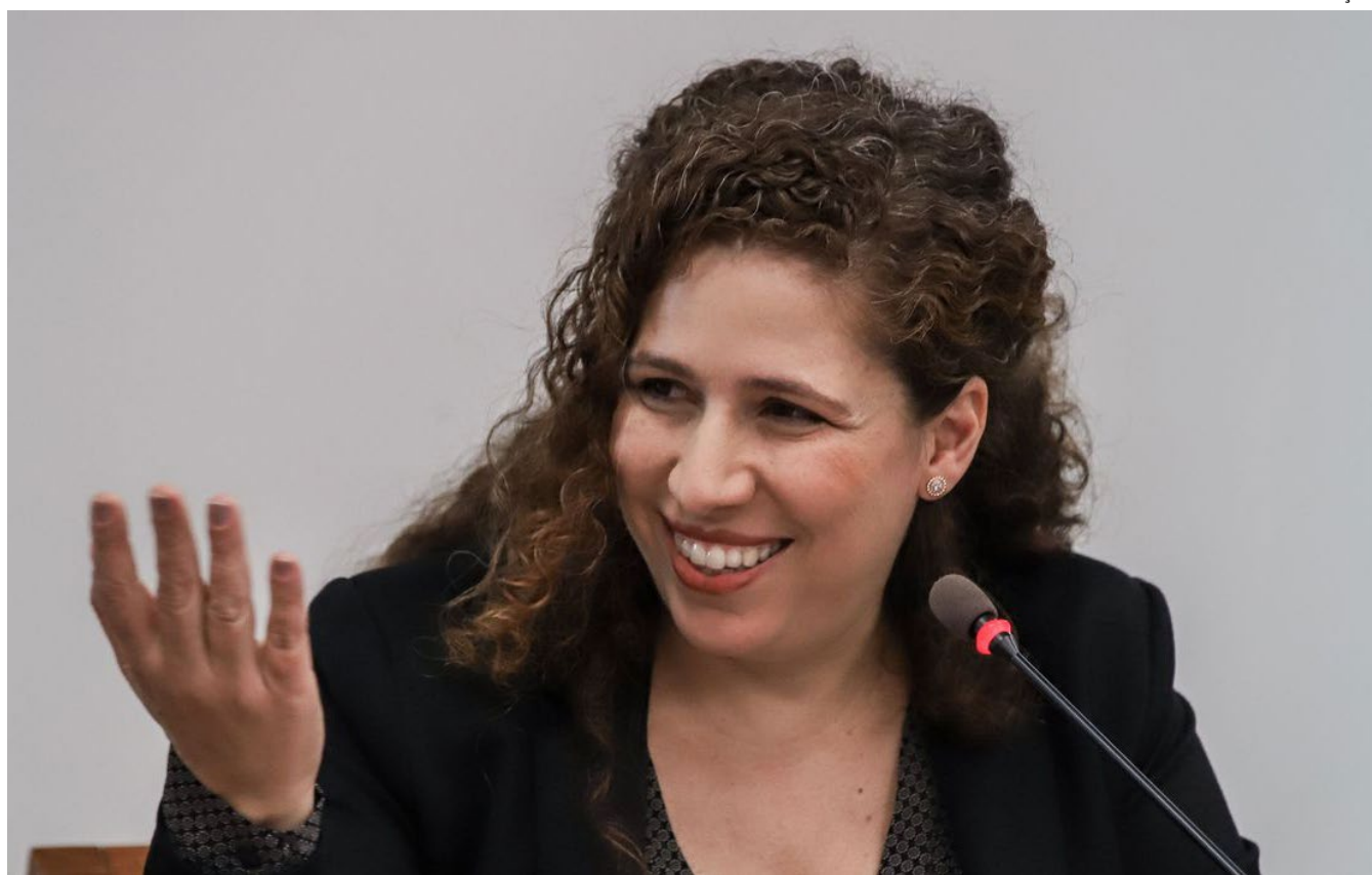
Outros órgãos ainda podem aderir à nova modalidade de seleção