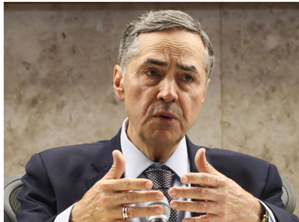
Presidente do STF disse que pretende dialogar com o Legislativo