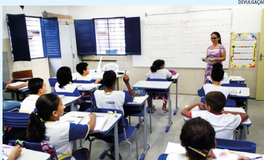
Acompanhamento da rotina escolar por formandos é obrigatório

Cerca de 55% dos concluintes em licenciaturas, o equivalente a cerca de 165 mil estudantes, disseram que cumpriram menos de 300 horas de