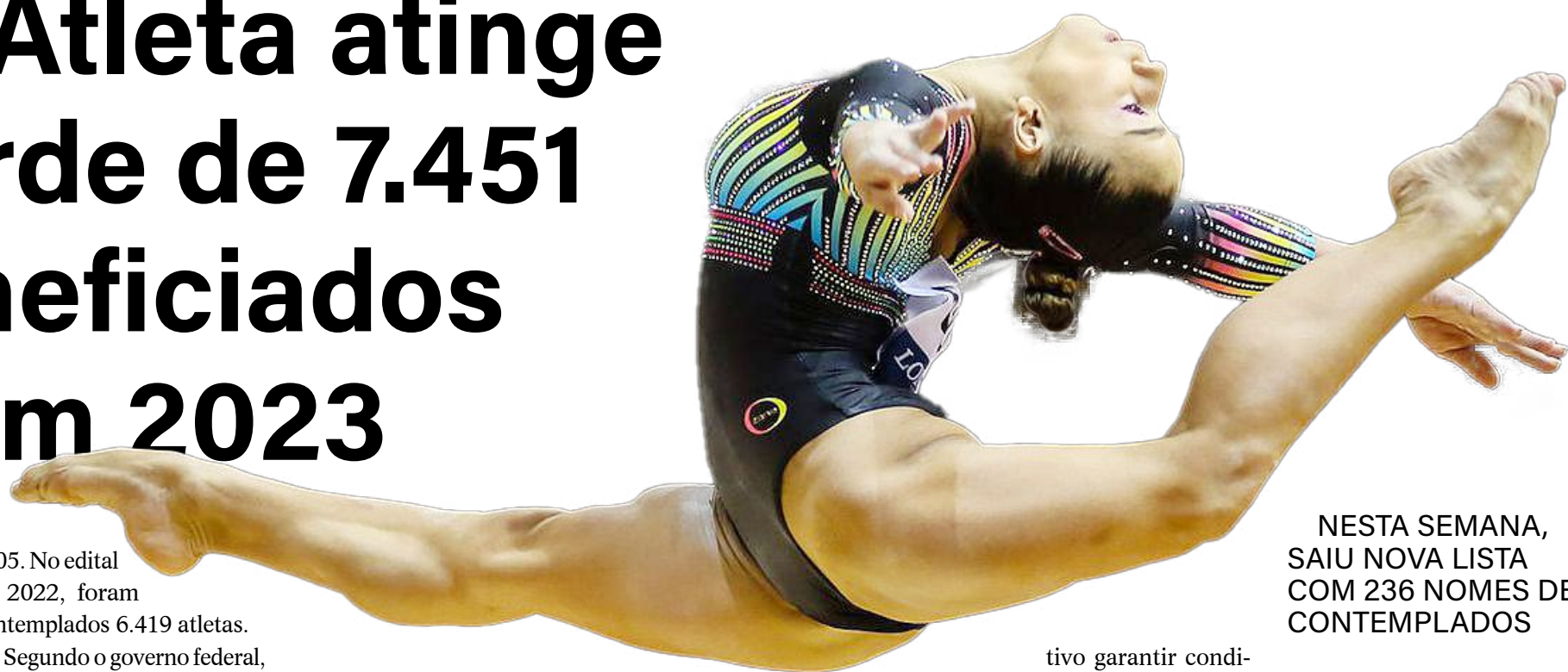
NESTA SEMANA, SAIU NOVA LISTA COM 236 NOMES DE CONTEMPLADOS

O Ministério do Esporte divulgou uma nova lista com 236 nomes de contemplados pelo programa Bolsa Atleta, do governo federal, em 2023. Os novos bolsistas já assinaram o termo de adesão ao programa e a portaria foi publicada no Diário Oficial da União (DOU). Agora, os beneficiários estão aptos a usufruir do valor pelos próximos 12 meses.