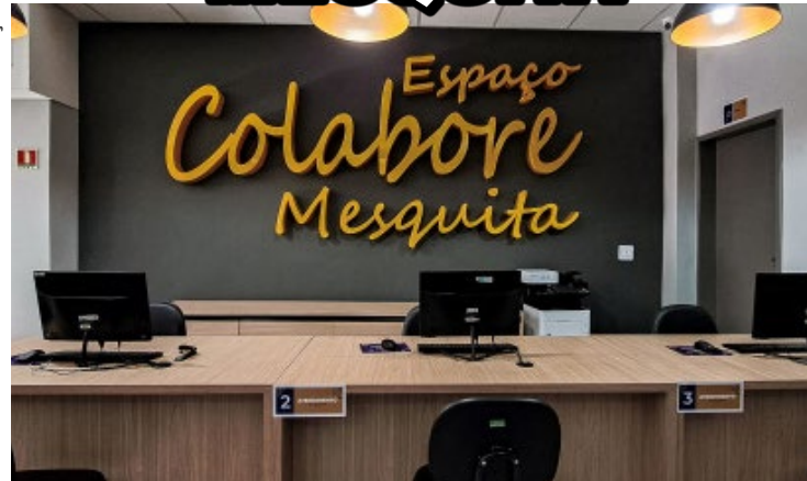
Iniciativa acontecerá às terças-feiras, e é direcionada aos microempreendedores individuais