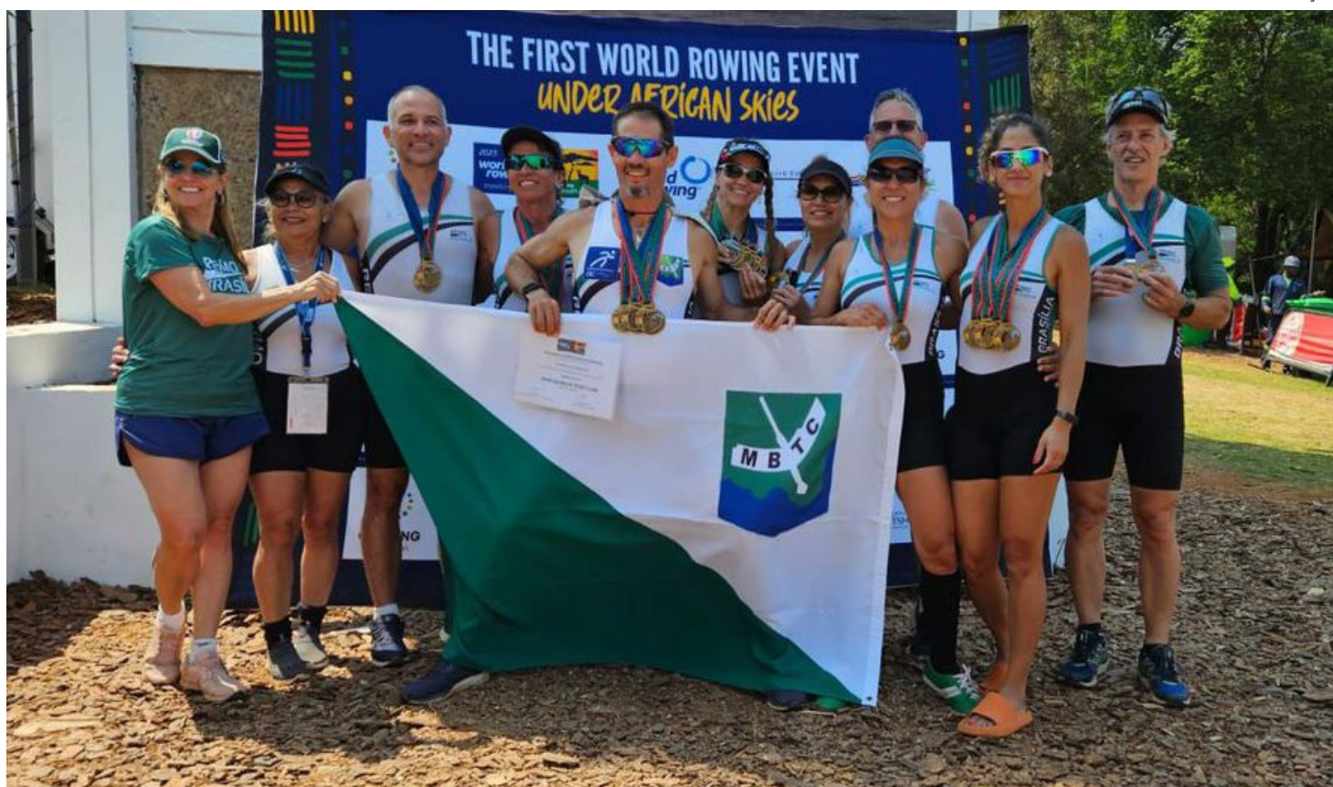
Minas Brasília foi o 3º melhor clube entre as 199 delegações do evento