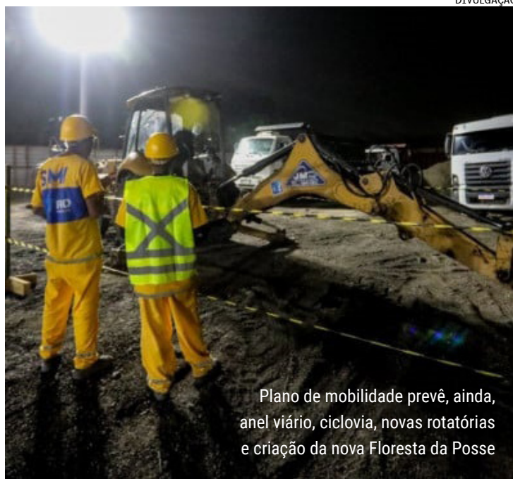
Plano de mobilidade prevê, ainda, anel viário, ciclovias, novas rotatórias e criação da nova Floresta da Posse

A Prefeitura do Rio deu início à obra de expansão da Estrada do Tingui, abrangendo um novo trecho de 2,1 mil metros, com o objetivo de conectar essa via à Avenida Brasil, localizada no bairro de Campo Grande. Com a extensão, a estrada, que atualmente possui 4,9 mil metros, será ampliada para 7 mil, proporcionando aos cariocas uma alternativa de acesso à uma das vias mais estratégicas e movimentadas da cidade.