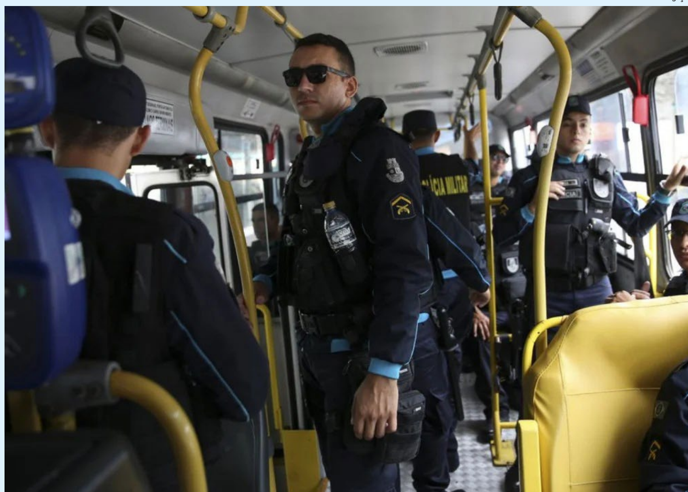
Auxílio beneficiará policiais, bombeiros, peritos e guardas municipais

As vagas são para analistas técnico-administrativo e serão ofertadas nos mesmos prazos que os previstos para o processo seletivo da AGU, com limite de seis meses para o lançamento do edital e mínimo de dois meses, após a publicação das regras, para a aplicação das provas.