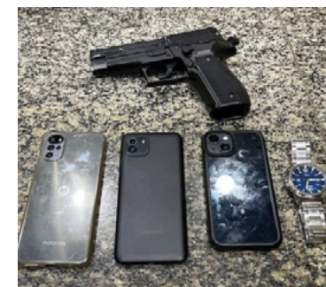
Polícia Militar encontrou suspeito na Rua Mena Barreto

Um adolescente foi apreendido por policiais militares em Botafogo, na Zona Sul, após roubar um motorista de aplicativo nesta quarta-feira (27). Segundo informações da corporação, equipes do 2º BPM (Botafogo) realizavam um policiamento de rotina quando foram avisadas sobre o crime por pessoas que passavam pelo local. Pouco depois, os agentes encontraram o suspeito na Rua Mena Barreto com celulares e um relógio, que pertenciam à vítima. Na ação, a PM ainda apreendeu uma réplica de pistola. O caso foi encaminhado à 12ª DP (Copacabana).