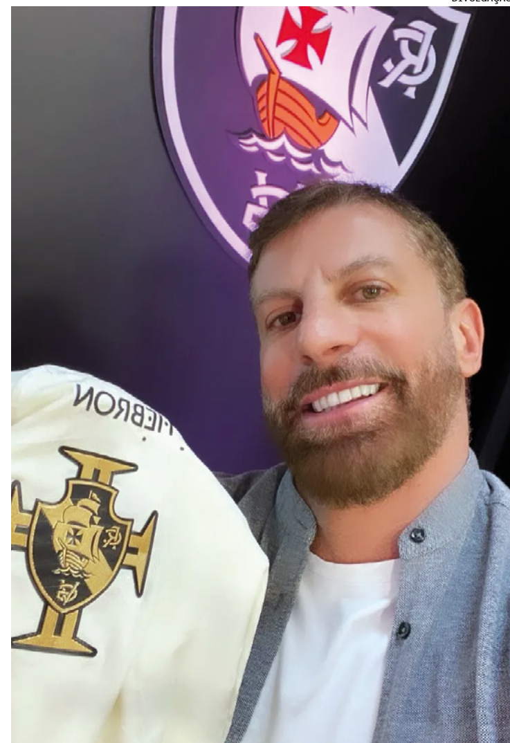
Comentarista deixou a TV Globo no último dia 14

“Um dos objetivos é poder retribuir o que o Vasco fez por mim. Isso me deixava muito angustiado. Fiquei fora do Mundial em 2000 por lesão. Me sinto na obrigação de viver, me relacionar novamente [...] Quando a Sempre Vasco escolhe meu nome, é uma decisão que interfere em tudo, estava no melhor momento da comunicação, na melhor emissora do país [...] Tenho a oportunidade de fazer parte de uma candidatura num grupo de vascaínos apaixonados, pessoas muito capacitadas em todas as áreas”, disse.