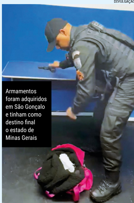
Armamentos foram adquiridos em São Gonçalo e tinham como destino final o estado de Minas Gerais

A detida foi encaminhada junto com o material apreendido à 4ª DP (Praça da República) e está à disposição da Justiça do Rio.