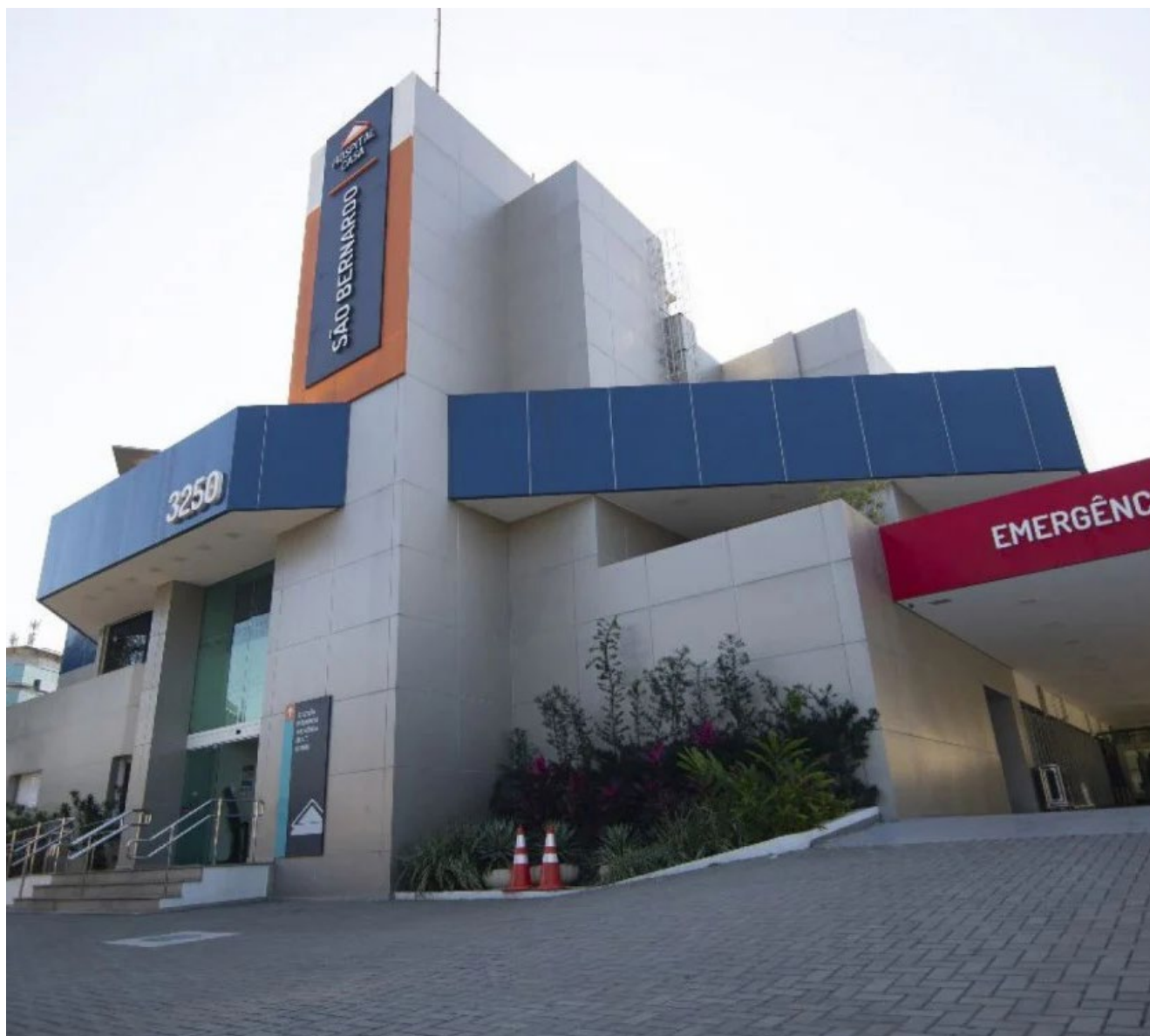
Grupo tem oportunidades para técnico de enfermagem, recepcionista, assistente administrativo, analista comercial, cuidador e assistente social

A Rede Hospital Casa é composta por 11 hospitais e uma empresa de diagnóstico por imagem. O grupo possui Emergências 24 horas, Centro-cirúrgicos, Unidades de Terapia Intensiva, Leitos Particulares e de Enfermaria.