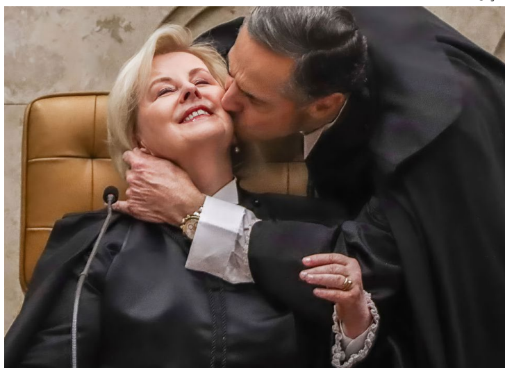
Ato prossegue com discursos de representantes da PGR e da OAB

de dados para que a ONG pudesse desenvolver o próprio diagnóstico. “Ficou mais evidente que muitas famílias vivem em questão de insegurança alimentar. Há uma lacuna na oferta de políticas públicas que não responderam de imediato à situação”, explicou a coordenadora. A Redes da Maré atendeu a mais de 18 mil famílias durante a pandemia.