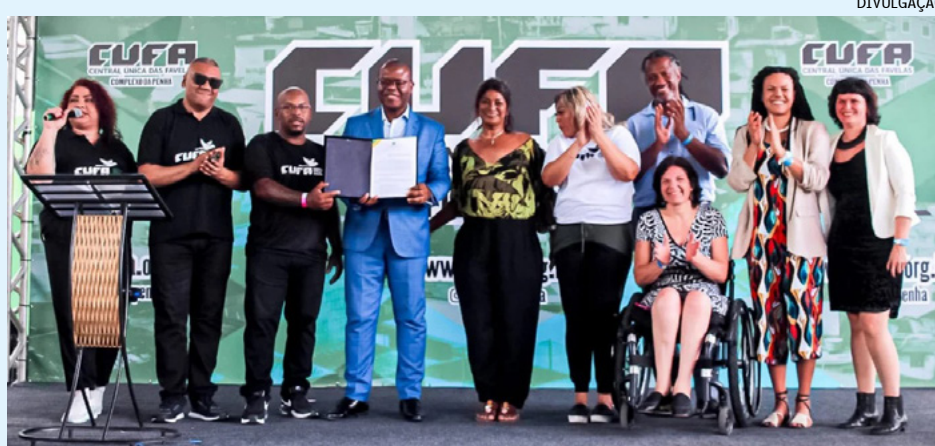
Cerimônia contou com a presença do ministro Silvio Almeida

Durante a visita, Silvio Almeida conheceu parte do trabalho social e conferiu aulas de balé, zumba, música,