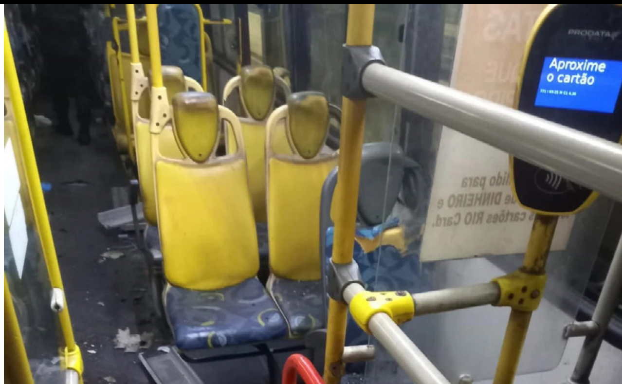
Um artefato explosivo foi jogado no interior do veículo na altura de Barros Filho, na Zona Norte; Uma das vítimas foi socorrida em estado grave

Imagens que circulam nas redes sociais mostram ainda o desespero