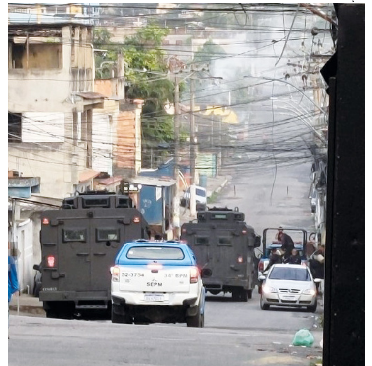
Homem de 47 anos morreu no local. Segundo a PM, policiais foram atacados por criminosos na altura do Gramacho

No dia em que a ocupação teve início um intenso tiroteio