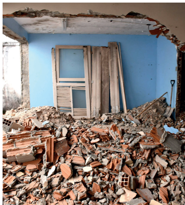
Neste primeiro momento, atividades acontecerão nas áreas de esporte e lazer; reforma completa está prevista para o início de 2024