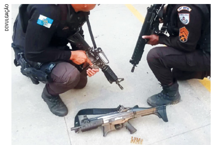
Na ação houve intensa troca de tiros. Com a dupla, foi apreendido uma carabina com 15 munições intactas

Uma perseguição entre suspeitos e policiais militares provocou intenso tiroteio na manhã desta quarta-feira (20) na Avenida Vereador Alceu de Carvalho com Avenida das Américas, no Recreio, na Zona Oeste. Na ação, dois adolescentes foram apreendidos após capotarem com um veículo durante uma tentativa de fuga.