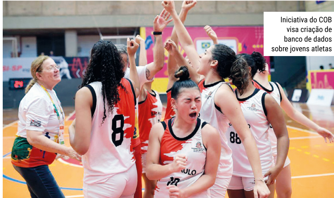
Iniciativa do COB visa criação de banco de dados sobre jovens atletas

“O Centro de Avaliação e Monitoramento é uma iniciativa que vem desde 2019 nos Jogos da Juventude. A gente coleta informações para criar um grande banco de dados, que sirva de referência para os professores compararem seus atletas com aqueles que são os melhores deste ano no Brasil, em idade escolar”, explicou o supervisor de