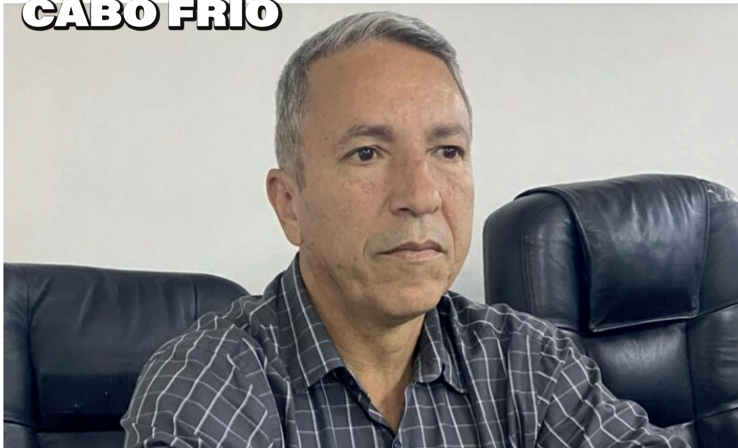
Prefeitura confirmou informação no começo da tarde desta segunda-feira (18)