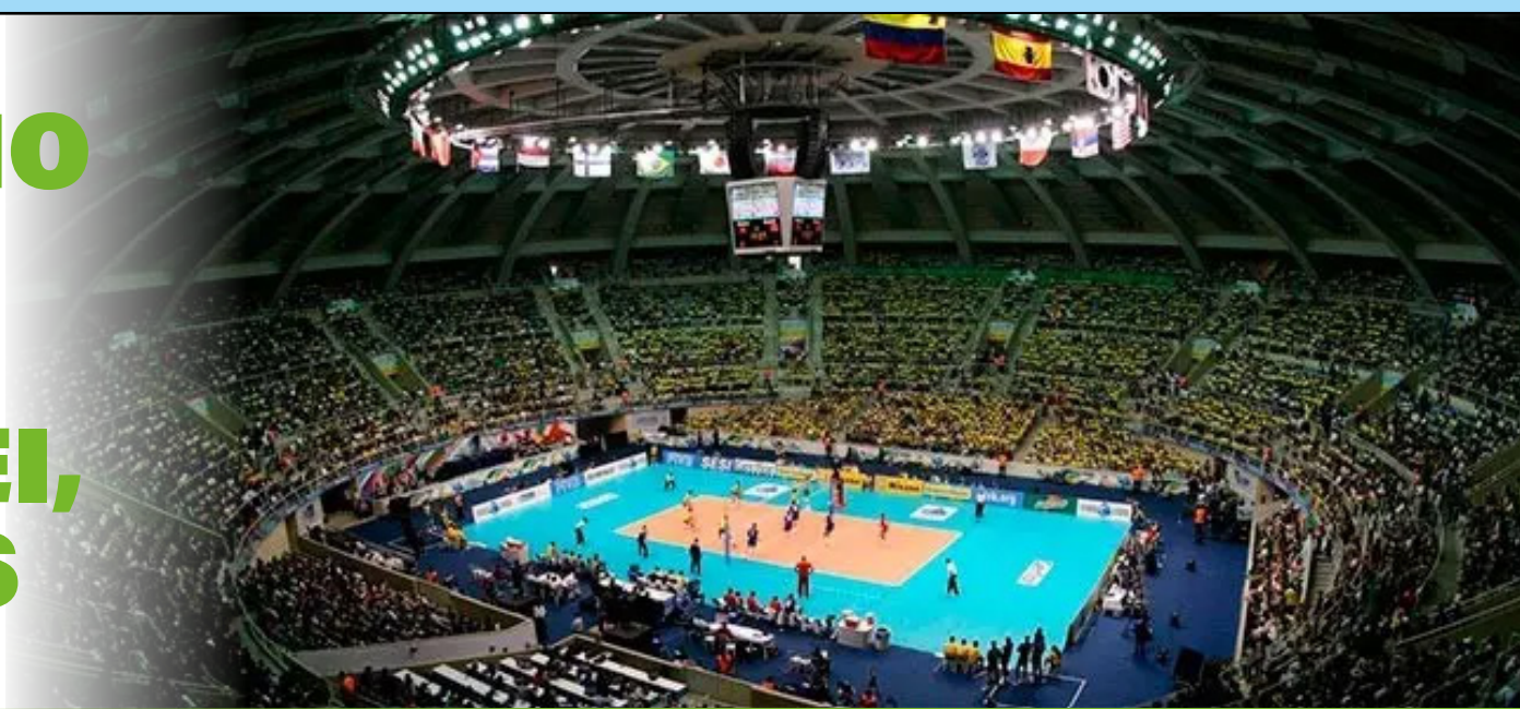
Estádio será sede do Pré-Olímpico masculino, entre 30 de setembro e 8 de outubro

S em sediar um campeonato oficial desde os Jogos Olímpicos de 2016, o Maracanãzinho, localizado na Zona Norte da cidade, será a sede do Pré-Olímpico masculino da modalidade,