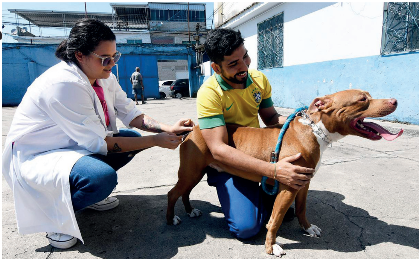
Ação vai acontecer pelos próximos cinco sábados, terminando em 21 de outubro