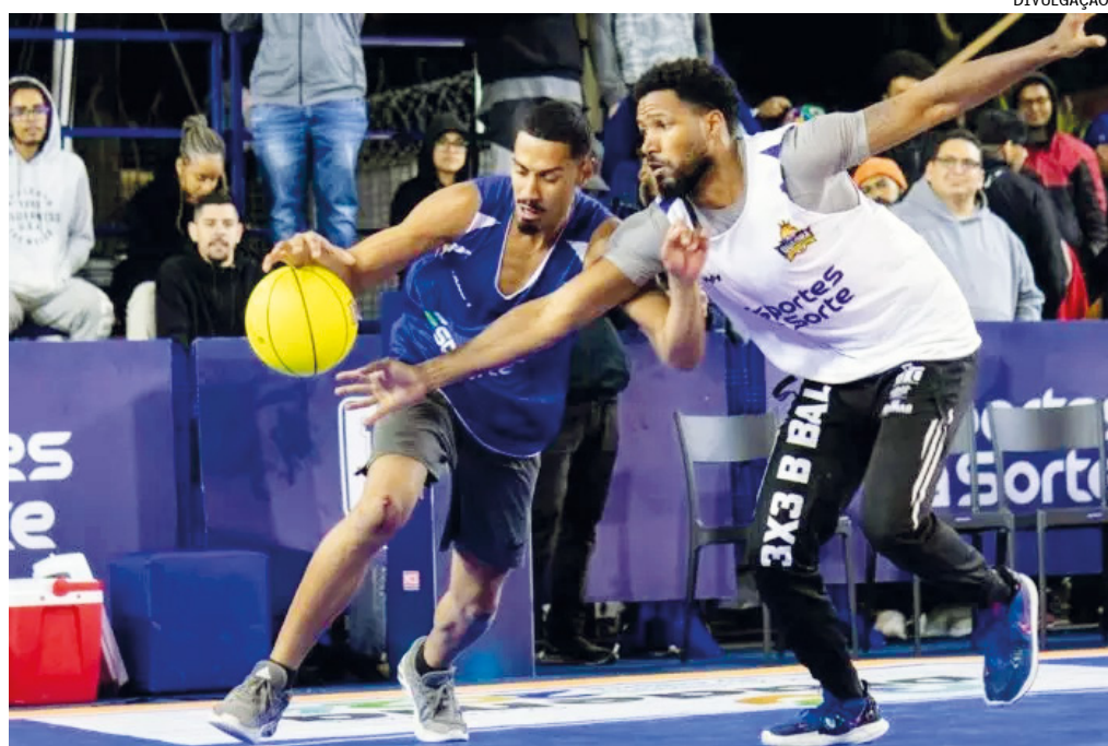
O evento acontece nos dias 22, 23 e 24 de setembro, com entrada gratuita

De acordo com um levantamento realizado o Ibope Repucom, o vôlei desperta o interesse de 87% dos brasileiros, ocupando a 5ª posição no ranking das modalidades esportivas mais praticadas no Brasil.