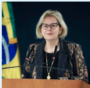
Plenário virtual do STF analisará questão de 22 a 29 deste mês

A liberação do caso para julgamento ocorre uma semana antes de Rosa Weber se aposentar compulsoriamente aos 75 anos e deixar o tribunal. Na próxima semana, o ministro Luís Roberto Barroso assumirá a presidência do STF.