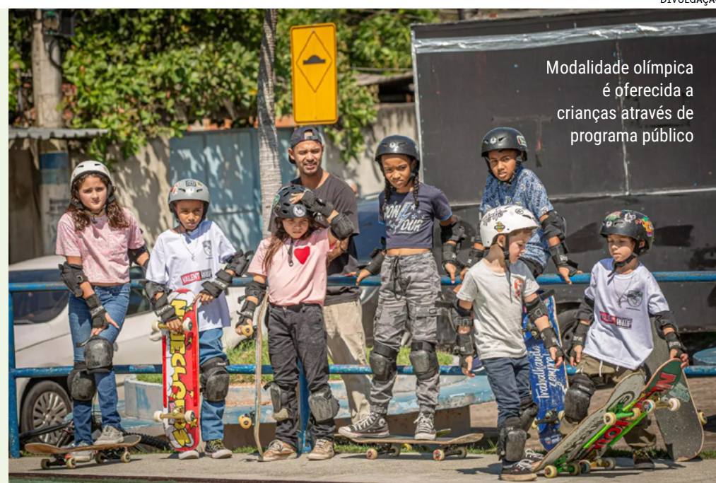
Modalidade olímpica é oferecida a crianças através de programa público