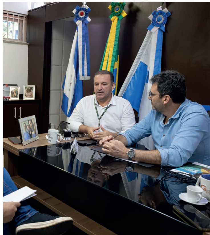
Autoridades participaram da solenidade com o prefeito

“Com todas essas realizações, Barra do Piraí já vinha sendo considerada a “Cidade do Audiovisual”, essa lei oficializa ao mesmo tempo em que proporciona maior visibilidade institucional e o reconhecimento oficial dos poderes Legislativo e Executivo do Estado do Rio de Janeiro”, conclui o presidente da Alerj, Rodrigo Bacellar.