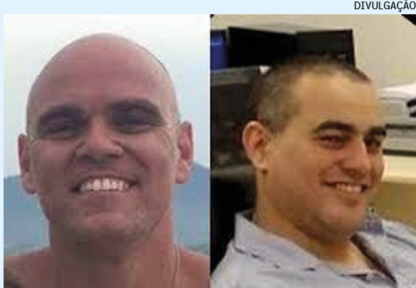
Dupla foi condenada por crimes de organização criminosa, extorsão mediante sequestro, usurpação de função pública e corrupção. Eles embolsaram nos últimos meses mais de R$ 700 mil dos cofres públicos

No entanto, até agora, os agentes seguem na Polícia Civil, apesar da decisão judicial. Eles estão com os salários em dia, de acordo com o Portal da Transparência do Estado.