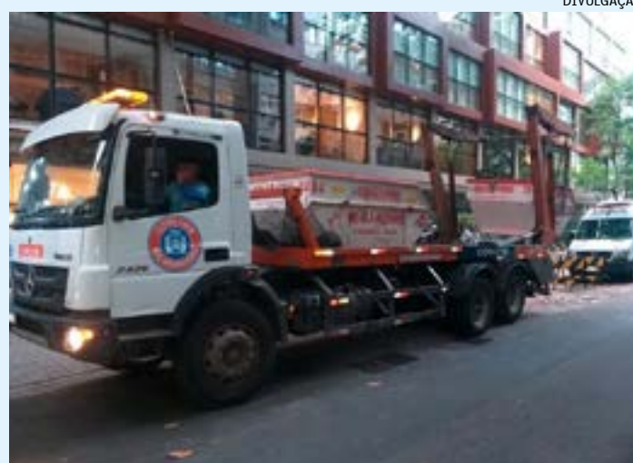
Além do reajuste no valor das multas do Lixo Zero, novas normas para apreensão de caçambas também passam a valer no Rio

Além do reajuste no valor das multas, a Comlurb também publicou novas normas para o caso de apreensão de caçambas estacionárias pelas equipes de fiscalização. De acordo com as novas regras,