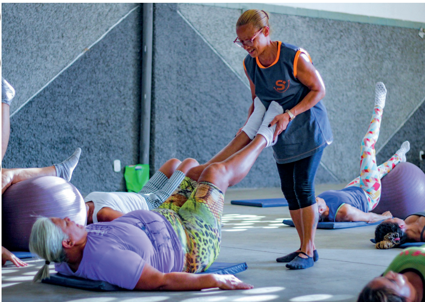
Pilates tem atraído um bom número de pessoas no projeto Saúde + Feliz