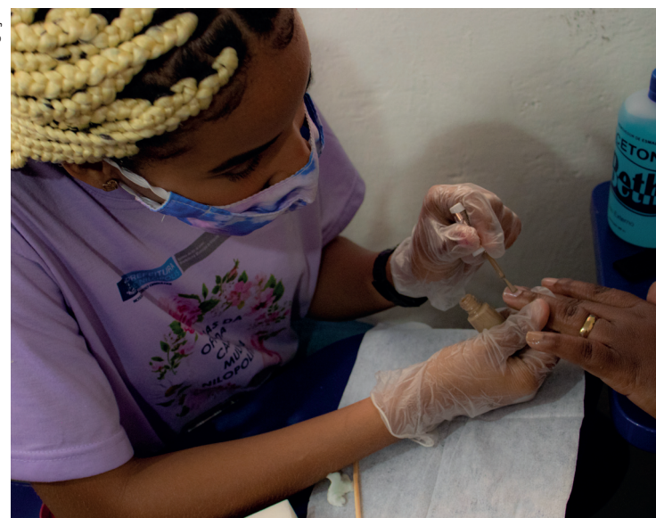
Oficina é para maiores de 14 anos