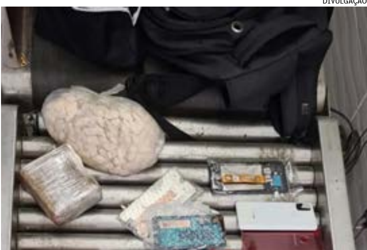
Servidor foi flagrado por colegas de profissão no Instituto Penal Plácido de Sá Carvalho, no Complexo Penitenciário de Gericinó