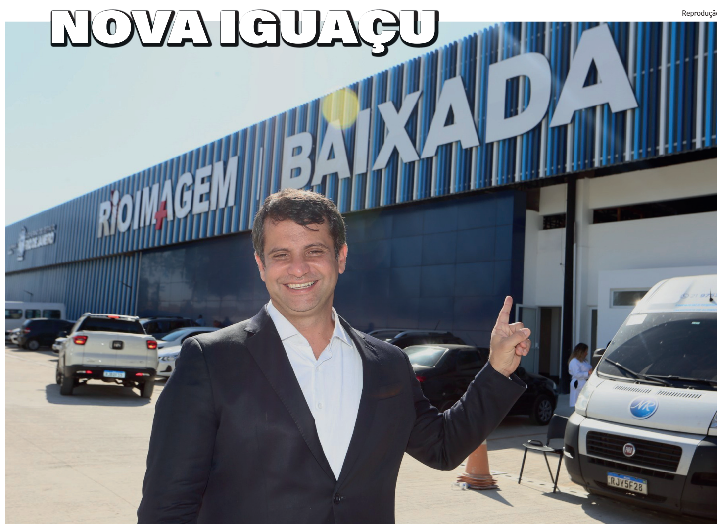
Unidade conta com ultrassonografias, mamografias, Raios x e tomografias computadorizadas, fazendo a fila de espera por exames andar

descobriu que tinha um tumor que levou à retirada de uma