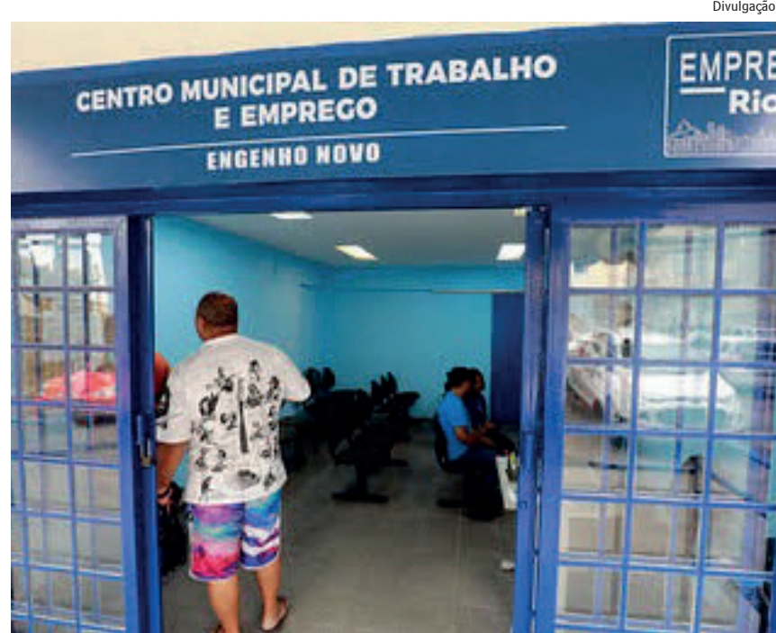
Entre as oportunidades há 89 vagas de estágios em diversas áreas

v488009 Atendente de Mesa v724009 Auxiliar de Cozinha v210009 Auxiliar de Limpeza v775009 Auxiliar de Sushiman v107009 Babá v597009 Copeira v763009 Cozinheira v409009 Cozinheiro v178009 Doméstica v096009 Eletricista de instalações de veículos automotores