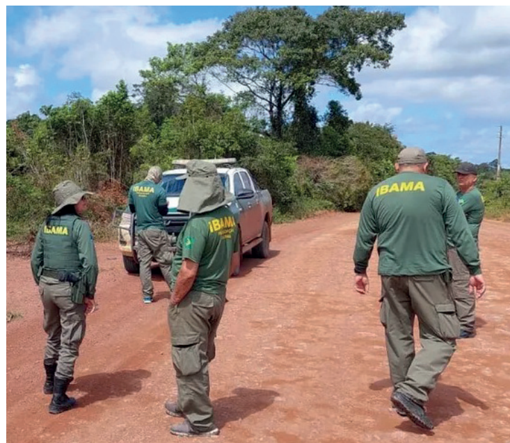
Autorização foi publicada no Diário Oficial da União