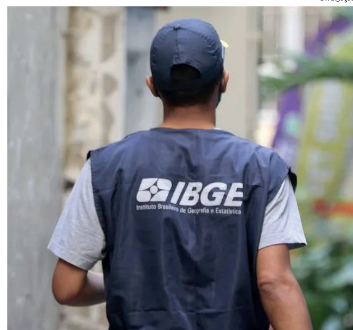
Mudança foi adotada após recomendação do MPF, que apurou discriminação de candidatos PCD em concurso

De acordo com o edital, seriam eliminados do processo seletivo candidatos que tivessem alguma deficiência “incompatível com a natureza das atribuições e exigências para o desempenho da função”, como não ter capacidade auditiva e de comunicação verbal para realizar entrevistas e coletar dados, por exemplo.