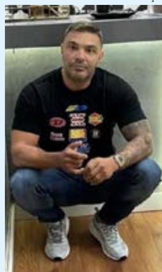
Conhecido como Batata, ele também já foi alvo de investigações por participar de uma milícia. Ele foi preso, junto de dois seguranças, quando estava a caminho do dentista

De acordo com o MP, o objetivo era eliminar um possível rival na disputa pelo domínio de territórios na Zona Oeste explorados pela milícia.