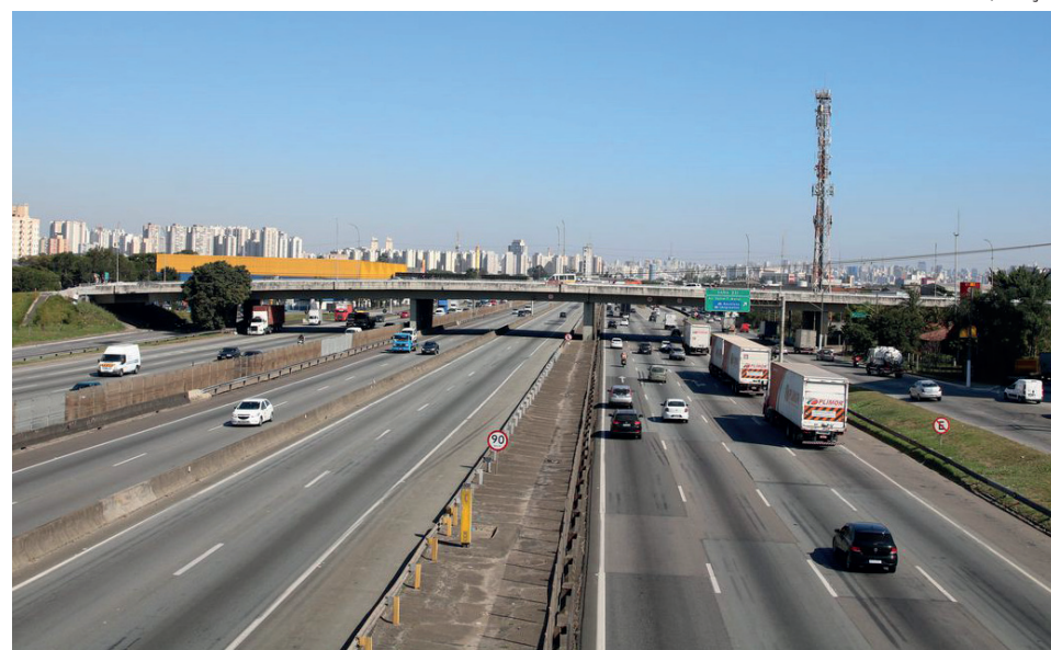
Programa terá R$ 1,7 trilhão em investimento

As intervenções em ferrovias e rodovias integram o eixo Transporte