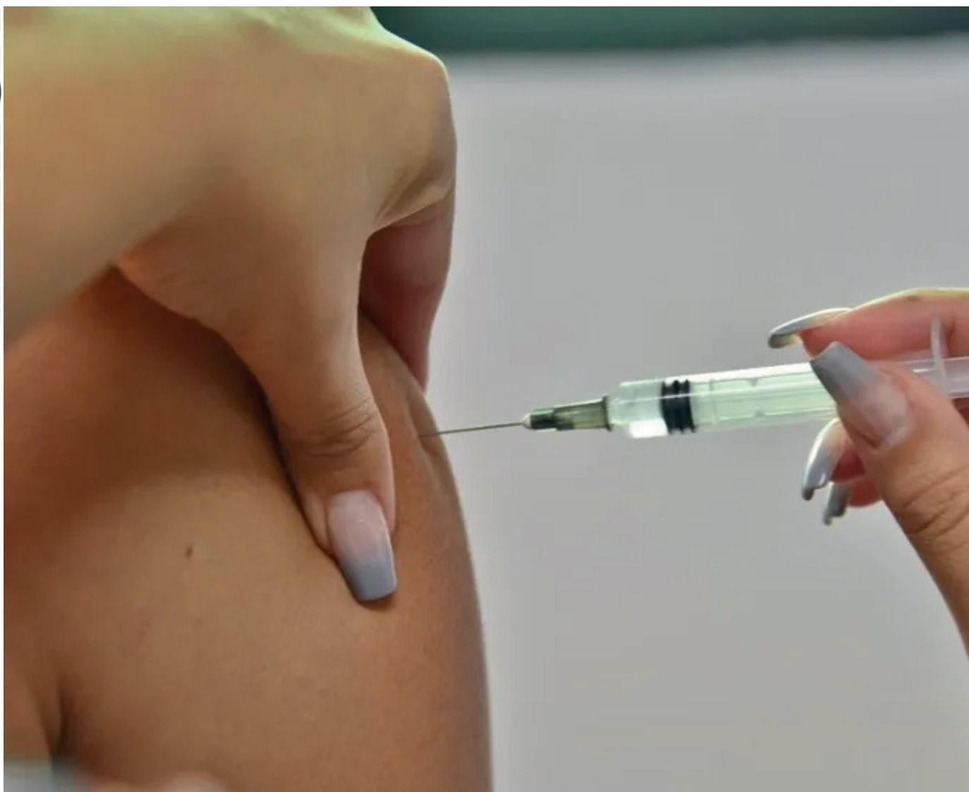
As USF Barroco e Bambuí deixam de ser polos de imunização infantil temporariamente