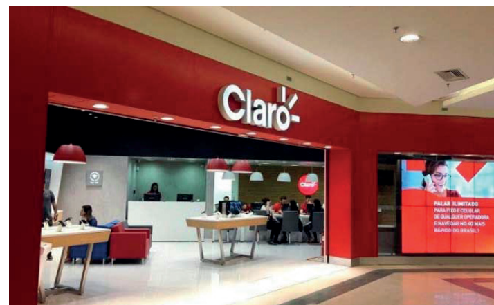
O projeto oferece vagas nas áreas do Marketing, Comercial, Comunicação, Inteligência de Mercado, Recursos Humanos, Logística, Finanças, Jurídico, entre outras

“Neste programa, fazemos questão de não ter a faixa etária como um fator de seleção, pois assim conseguimos incluir profissionais que estão mudando de área ou que aqueles que conseguiram acesso à universidade mais tarde, ampliando a diversidade do