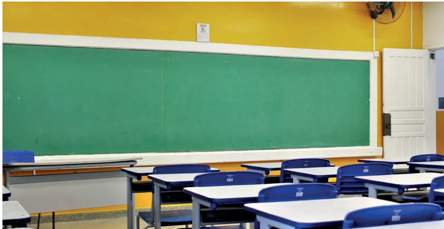
Governo divulgou sumário com resultados de consulta pública. Documento será analisado pelo setor educacional antes de versão final ser encaminhada ao Congresso.