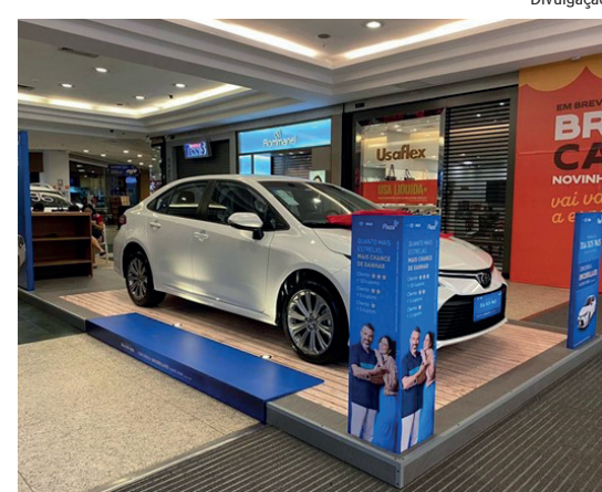
Além da ação, restaurantes preparam menus especiais para celebrar a data

Fora da alameda, os clientes encontram outras ideias de bistrôs e restaurantes, como o italiano Tutto Nhoque, a pizzaria Mamma Jamma, o francês Amélie Crêperie, o niteroiense Noi Gastronomia, entre outros. Muitos deles estão preparando menus exclusivos para o Dia dos Pais. O Mamma, por exemplo, lançou dois sabores de pizzas para a data: Origini, feita com linguiça toscana, bacon, mozzarella, zabaione e parmesão, e a Dolce di Banana e Cannella, que leva banana d'água, mozzarella, açúcar e canela. As pizzas ficam disponíveis no cardápio até o dia 3 de setembro.