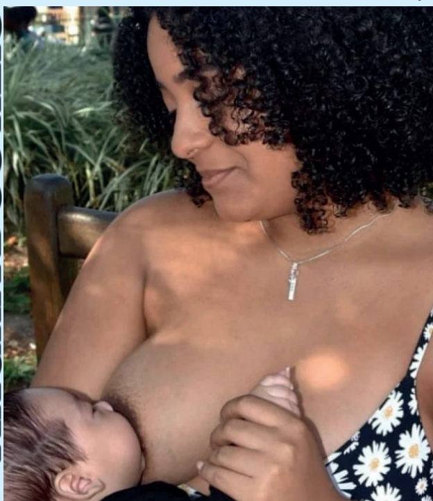
Programação já começou e se estende até o dia 10 de agosto