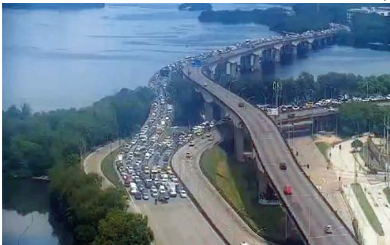
Prefeitura de Caxias segue com obra da nova UBS em Jardim Primavera

O projeto de Unidade Básica de Saúde conta com cinco consultórios, sala de coleta, fisioterapia, sala de curativo, sala de vacina, consultório odontológico e farmácia. Outras unidades estão em construção no município a fim de melhorar o atendimento nos hospitais da rede pública.