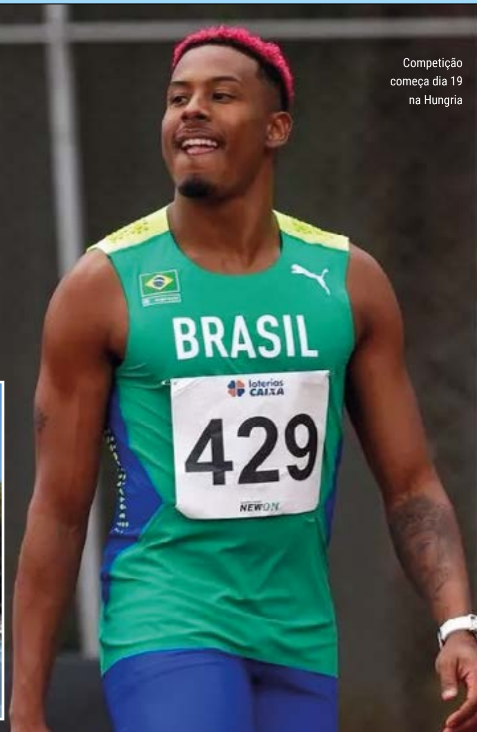
Competição começa dia 19 na Hungria