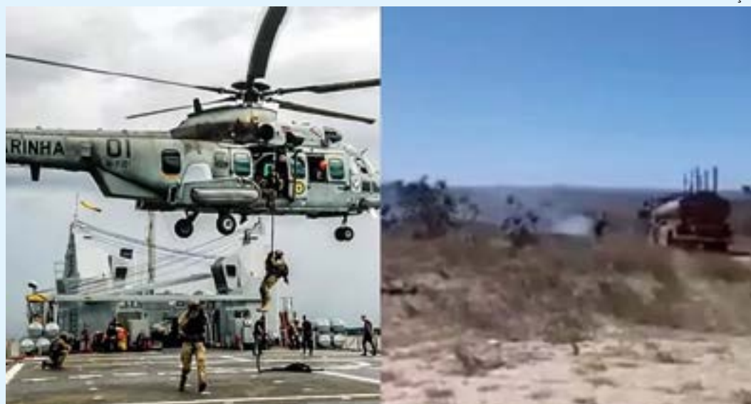
Outras quatro pessoas envolvidas no acidente estão hospitalizadas

De acordo com a Marinha, dois militares foram encaminhados ao Hospital das Forças Armadas e quatro ao Hospital Regional de Formosa. "Lamentavelmente, dois militares vieram a óbito no momento do acidente", diz o comunicado. "A MB está prestando todo o apoio aos militares e familiares envolvidos", acrescenta o texto.