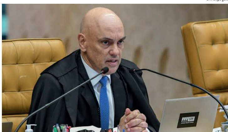
Prisão foi substituída por medidas cautelares