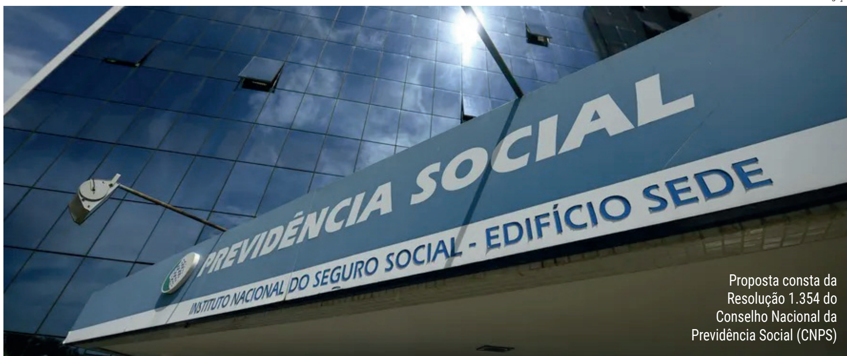
Proposta consta da Resolução 1.354 do Conselho Nacional da Previdência Social (CNPS)

De acordo com a previsão orçamentária, para o ano que vem — para as despesas discricionárias (cuja execução está sujeita à avaliação de oportunidade pelo gestor) —, serão necessária as suplementações de R$ 652 milhões, além do valor de R$ 1,788 bilhões previsto para o INSS, e de R$ 45 milhões, além do valor de R$ 150,5 milhões previsto para o Ministério da Previ-