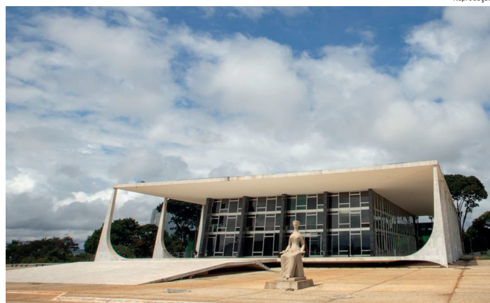
Decisão assinada por Fachin em 2022 agora é julgada em plenário

O pedido de proteção foi feito ao STF pela Articulação dos Povos Indígenas do Brasil (Apib). A ação foi protocolada em