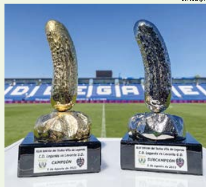
O vencedor do confronto entre Leganés e Levante receberá uma taça no formato de um pepino

Carinhosamente apelidado como Pepino d’or, ou Pepino de Ouro, o troféu estará em jogo no Está-