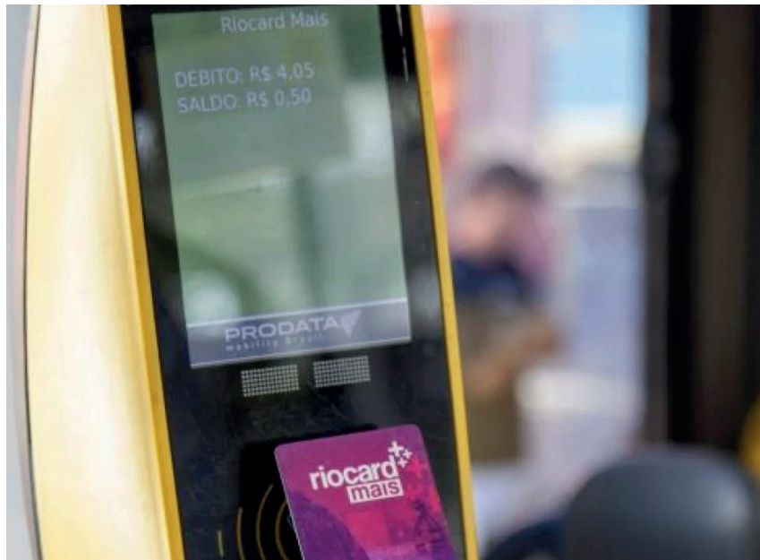
Devido a uma medida judicial, somente usuários que têm renda mensal de até R$ 3.205,20 vão ter direito aos benefícios

A atualização do cadastro pode ser concluída com apenas três passos, já que os beneficiários do BUI já estão inseridos no sistema Riocard Mais e o cartão de transporte é associado ao número de CPF. O passageiro deve atualizar apenas a informação da sua renda de acordo com o novo limite estabelecido. Não será preciso apresentar novos documentos, uma vez que cada cliente deverá informar dados que já o identificam no sistema Riocard Mais.