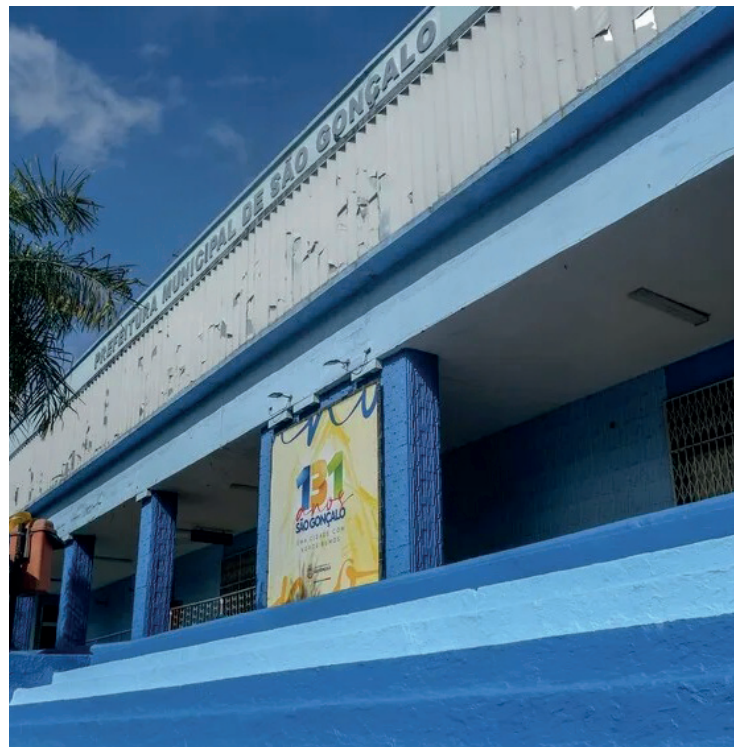
Interessados em se cadastrar devem acessar o aplicativo Colab