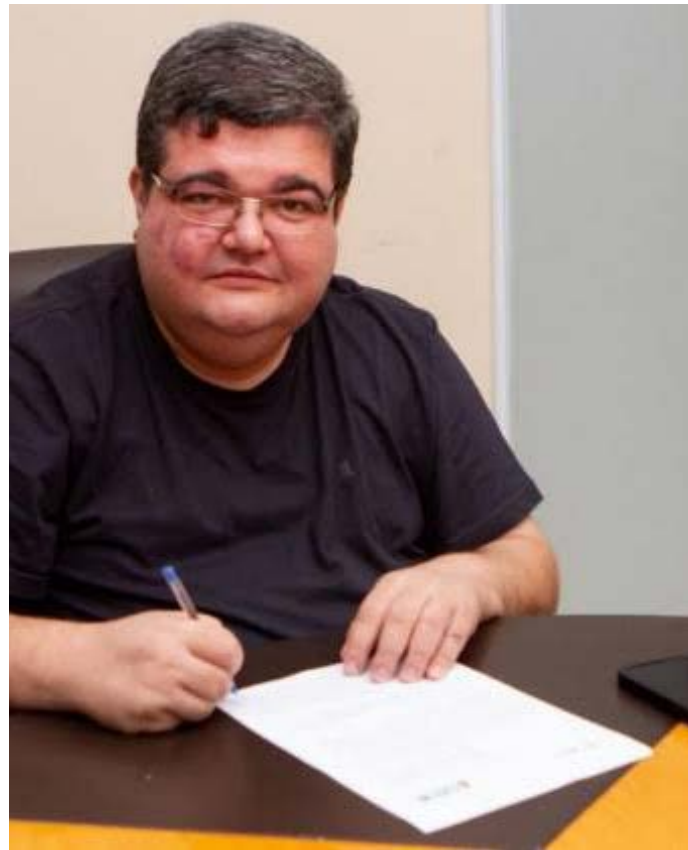
Com a nova estrutura, espera-se uma maior agilidade no atendimento aos cidadãos