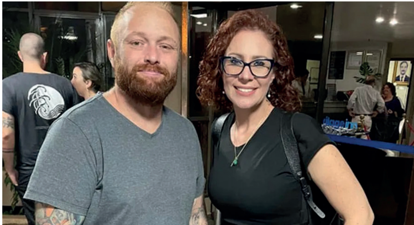
O hacker disse aos investigadores, no entanto, que “isso não foi adiante”

“QUE apenas pode afirmar que a Deputada Carla Zambelli esteve envolvida nos atos do declarante, sendo que o declarante, conforme saiu em reportagem, encontrou o ex- Presidente Jair Bolsonaro no Palácio do Alvorada, tendo o mesmo lhe perguntado se o declarante, munido do código fonte, conseguiria invadir a Urna Eletrônica, mas isso não foi adiante, pois o acesso que foi dado pelo TSE foi apenas na sede do Tribunal, e o declarante não poderia ir até lá, sendo que tudo que foi colocado no Relatório das Forças Armadas foi com