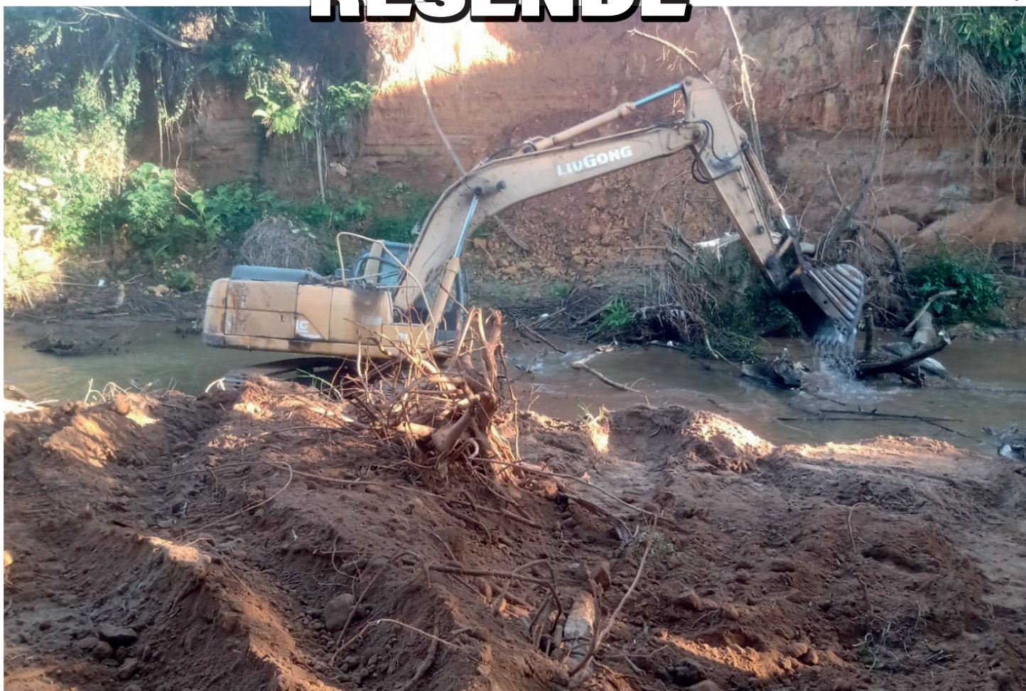
Equipes da gestão municipal também atuaram na limpeza da calha do rio