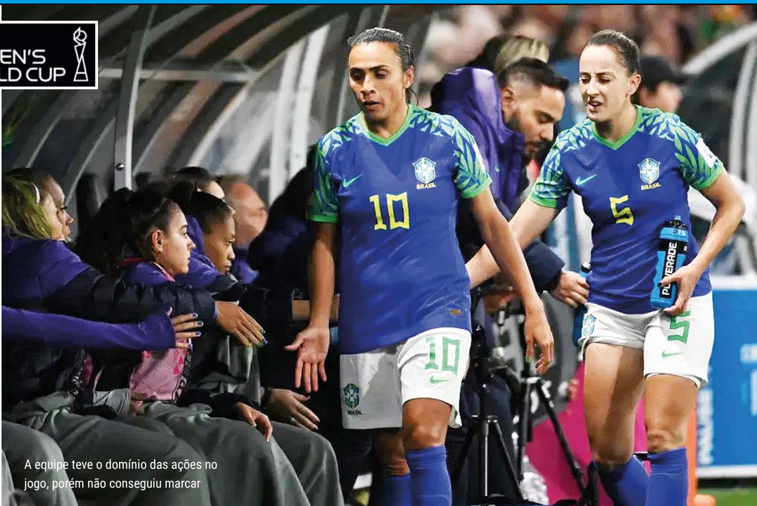
A equipe teve o domínio das ações no jogo, porém não conseguiu marcar

O Brasil está desclassificado da Copa do Mundo Feminina. A seleção comandada por Pia Sundhage empatou com a Jamaica em 0 a 0 e ficou em terceiro no grupo F. A equipe teve o domínio das ações no jogo, porém não conseguiu marcar.