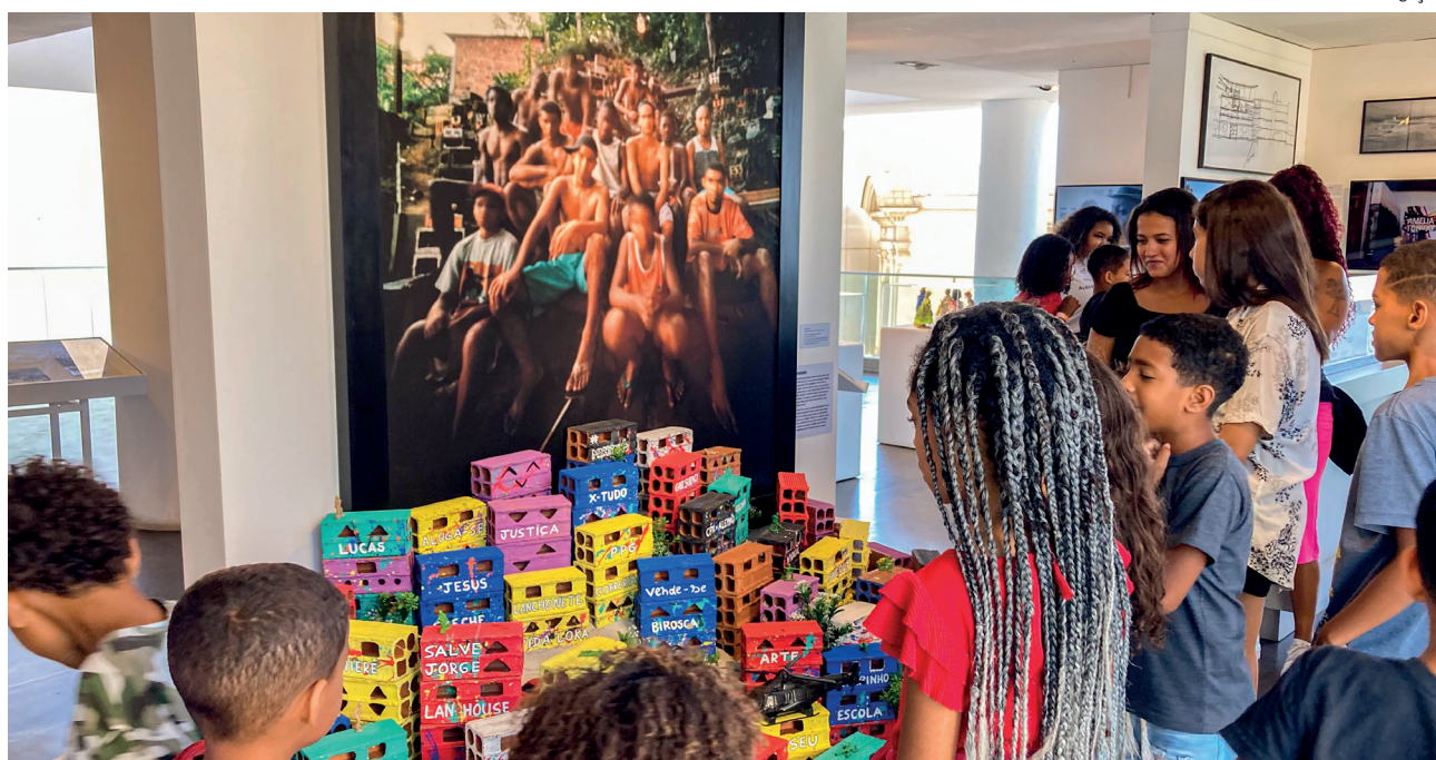
Ao todo, 25 crianças e adolescentes do Alto Uruguai que frequentam a sala de leitura do Núcleo de Atendimento de Medidas participaram da atividade cultural

A quinta-feira foi especial para 25 crianças e adolescentes que moram no Alto Uruguai, bairro de Mesquita, e frequentam a sala de leitura do Núcleo de Atendimento de Medidas (NAM), fruto de uma parceria entre a Prefeitura Municipal de Mesquita e a 7ª Vara