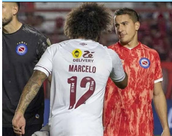
O clube carioca também prestou apoio a Luciano Sánchez