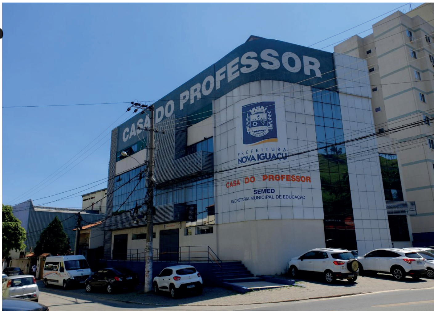
SEMED dará início a três novos cursos para os professores da rede