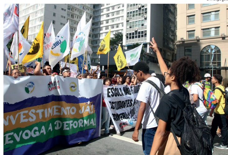
Majoria, na região Sudeste e em áreas urbanas

xandre de Moraes, cumpriu uma ordem de prisão preventiva contra Walter Delgatti Neto e cinco mandados de busca e apreensão contra ele e Carla Zambelli (três no DF, dois em SP).