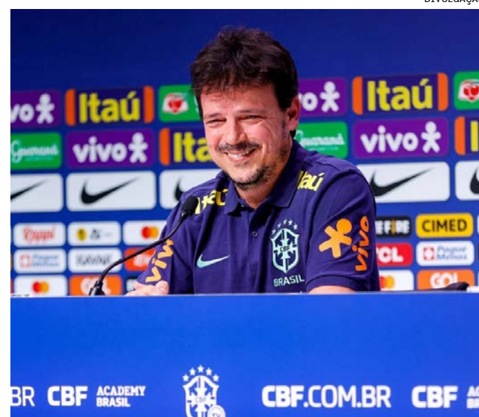
Brasil estreia nas Eliminatórias no dia 8 de setembro em Belém

Fernando Diniz tem contrato com a seleção brasileira até o meio de 2024. A CBF espera por Carlo Ancelotti, que encerra o vínculo com o Real Madrid no fim da próxima temporada europeia. Com o Fluminense, o técnico, de 49 anos, tem compromisso até dezembro do ano que vem.