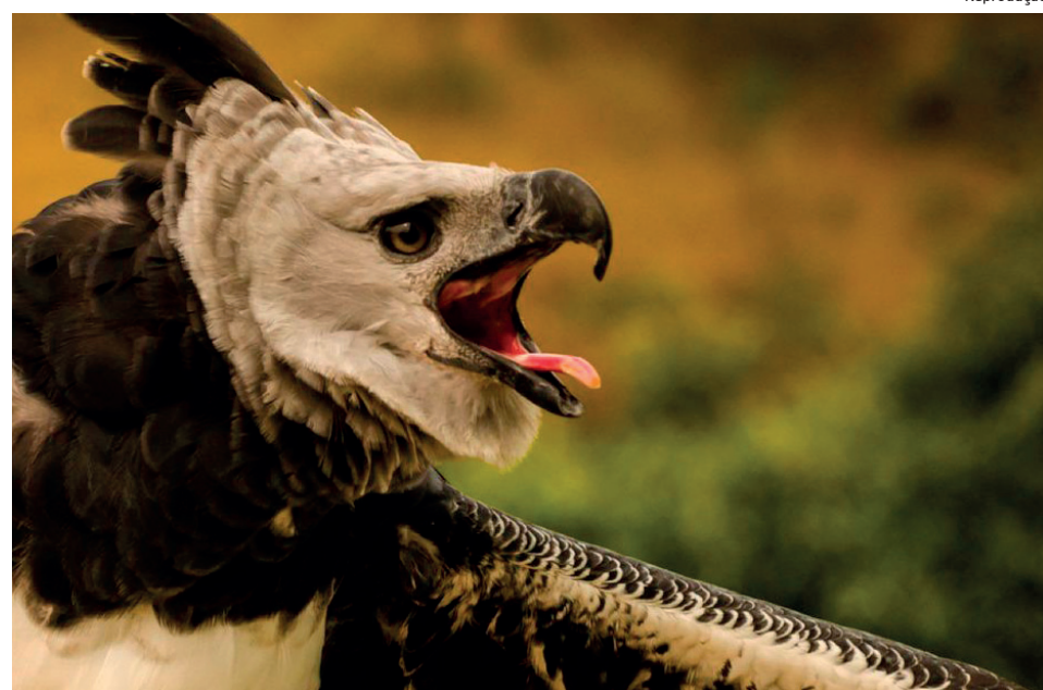
Sistema vai disponibilizar informações sobre quase 15 mil animais

“Fica evidente a necessidade urgente de reverter essa tendência. Por isso, a postura da atual gestão de priorizar o combate ao desmatamento traz boas pers-