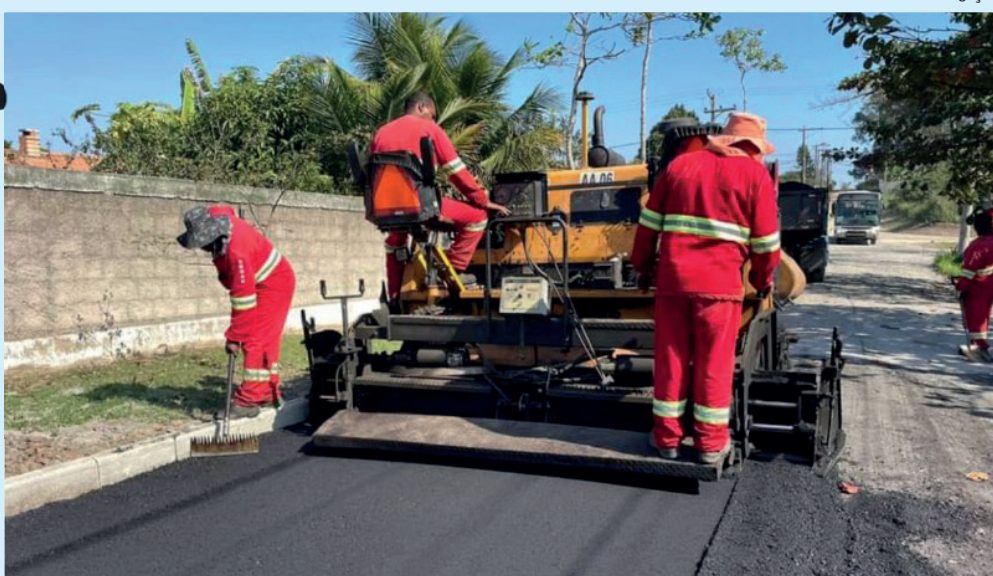
Em breve, a população irá usufruir do espaço totalmente revitalizado