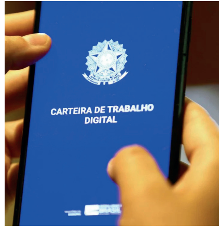
Inscrições podem ser feitas até 13 de agosto pela internet

Desde 2021, a Secretaria da Mulher já capacitou mais de 90 mil mulheres para o mercado de trabalho.