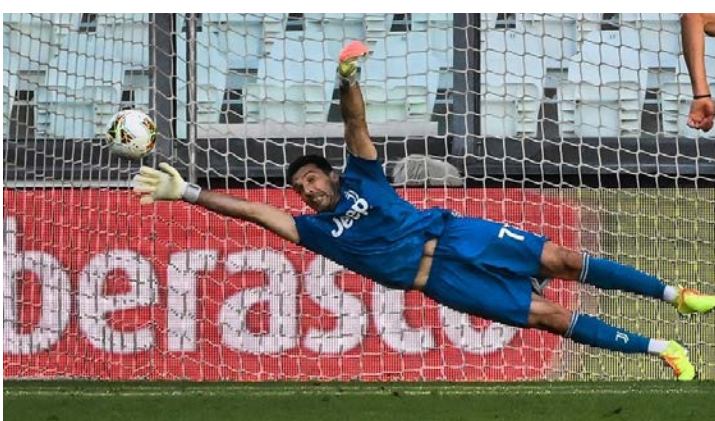
Campeão da Copa do Mundo com a Itália em 2006 publicou sua decisão nas redes sociais

Aos 45 anos, o italiano Gianluigi Buffon, um dos maiores goleiros da História do futebol, anunciou, nesta quarta-feira, a sua aposentadoria. Nas últimas duas temporadas, ele atuou pelo Parma, clube que o revelou.