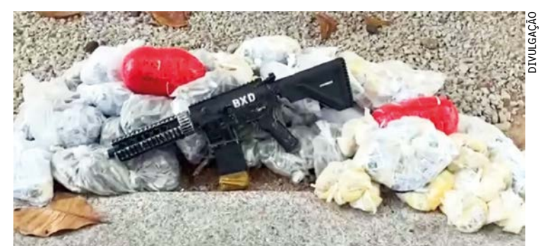
Ação dos policiais militares do GAT do 39º BPM localizou na manhã da última sexta (30) o esconderijo das armas e drogas na comunidade Coro Come, no bairro Parque Floresta

Policiais militares do Grupamento de Ações Táticas (GAT) do 39º BPM (Belford Roxo), apreenderam um fuzil calibre 556 e uma grande quantidade de drogas, na manhã desta sexta-feira (30/06), ao localizarem um esconderijo de criminosos na Comunidade Coro Come, no bairro Parque Floresta, em Belford Roxo. Na ação, os agentes foram até a comunidade para averiguar informações sobre criminosos que estariam escondendo armas e drogas na região. Os policiais militares foram recebidos por disparos de arma de fogo. Após o confronto, a equipe localizou o esconderijo onde estavam o fuzil e as drogas. A ocorrência policial foi registrada na 54ª DP (Belford Roxo).