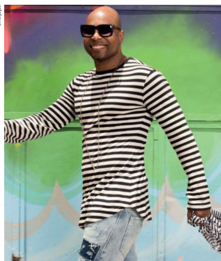
A festa de aniversário quebra um jejum de quatro anos