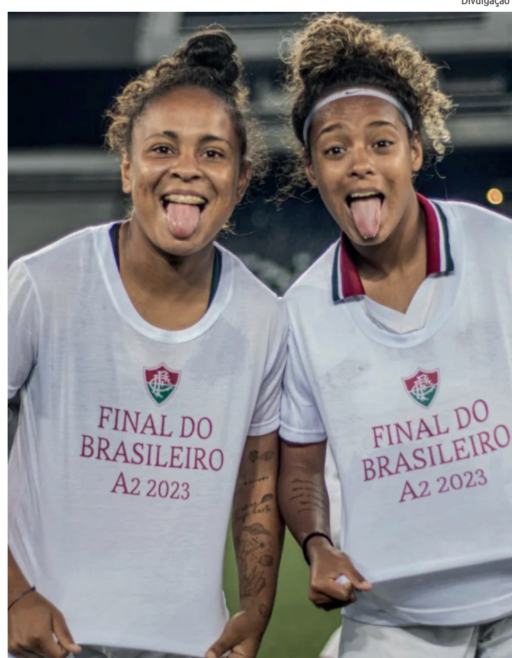
Tricolor fará partida inicial da decisão contra o Bragantino neste domingo (2), com portões abertos