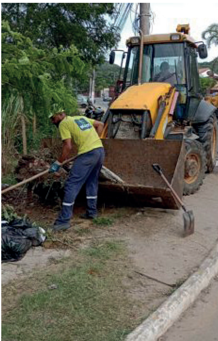
Retirada de galhos, coleta de lixo e poda de árvore, estão entre as atividades realizadas nos próximos dias