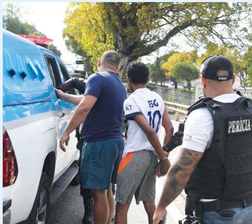
Ele estava sem algemas e correu por cerca de 500 metros a pé até ser alcançado por um policial

Ainda de acordo com a corporação, ele foi levado para a 21ª DP (Bonsucesso) e estava no IML somente para medida de praxe — fazer corpo de delito por conta da apreensão.