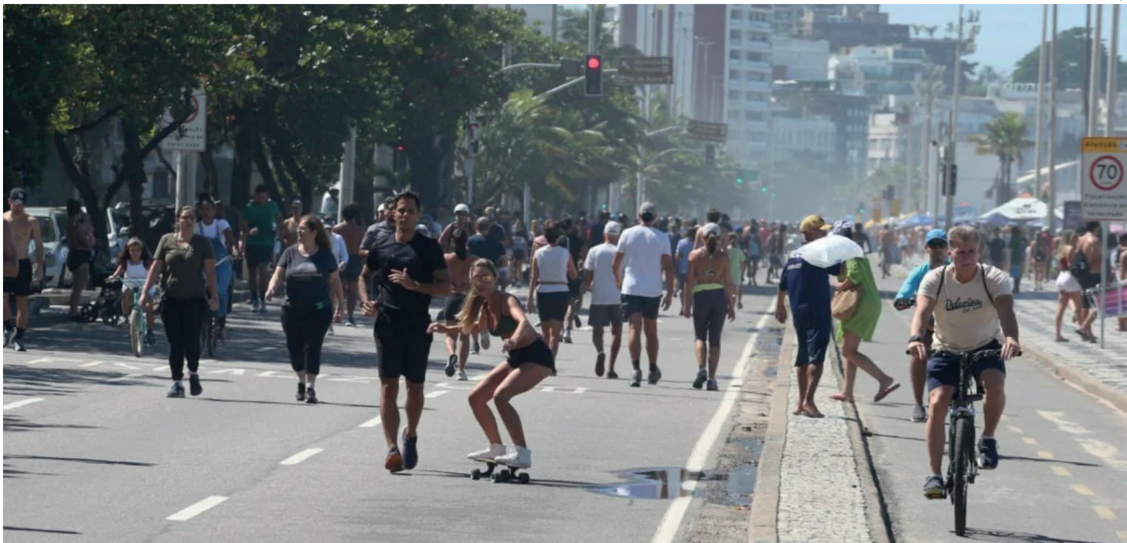
O estudo mostra que é possível reconhecer um fluminense em qualquer canto do mundo