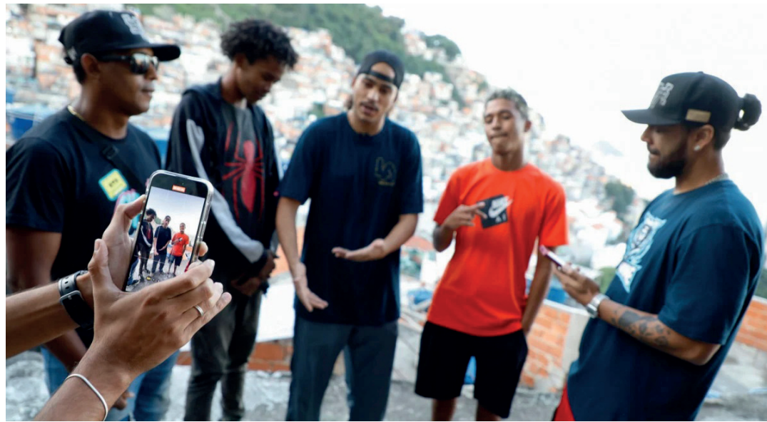
Iniciativa vai destinar R$ 320 mil para 37 propostas selecionadas

O Cria RJ, que tem como foco os agentes de cultura com projetos inovadores, conta com o apoio do Programa Cidade Integrada, sendo realizado pela Quitanda Soluções