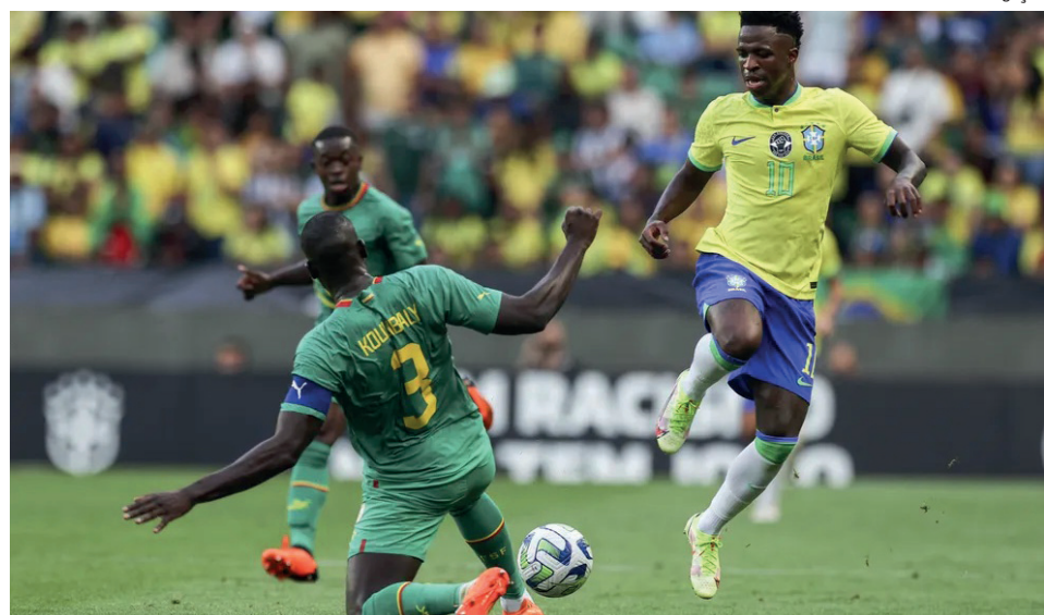
A Argentina, campeã da Copa do Mundo, segue no primeiro lugar na tabela

Segundo o relatório divulgado pela Entidade, O Cazaquistão foi a seleção que mais subiu de posição no ranking — foram oito no total, saltando de 112º para 104º —, enquanto País de Gales foi quem mais caiu na tabela — de 26º para 35º, nove posições no total.