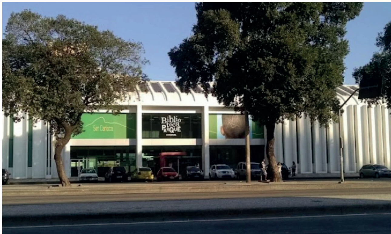
Oportunidades são destinadas a alunos que concluíram ou estejam cursando o Ensino Médio na rede pública

Ao final do curso, os participantes recebem certificado de conclusão e acesso a uma plataforma exclusiva de vagas de emprego. A Secretaria