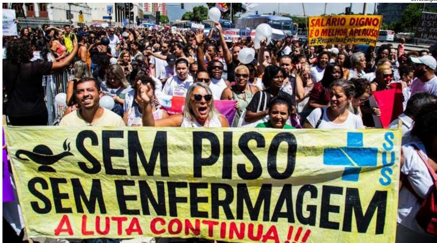
Segundo o Sindicato dos Enfermeiros do Rio, 70% dos profissionais ficarão fora da atividade por tempo indeterminado. Secretaria Municipal de Saúde (SMS) considera o movimento ilegal

Fundado em 2003, no intuito de ampliar as vozes dos trabalhadores ambulantes, o MUCA sobrevive há 20 anos lutando contra a criminalização da categoria, pela regularização dos trabalhadores, pela ocupação organizada dos espaços públicos, pelos direitos humanos e direito ao trabalho. O movimento se tornou uma importante organização popular na luta pela defesa dos camelôs do Rio de Janeiro.