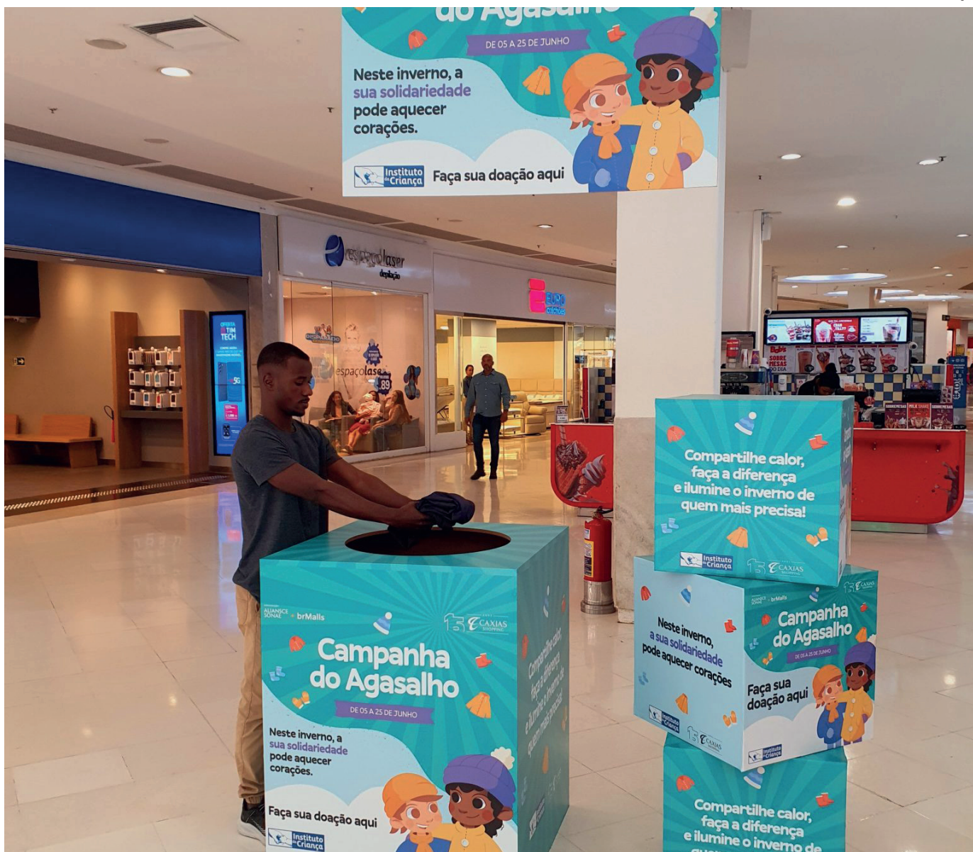
Campanha foi prorrogada até 09 de julho

A Campanha do Agasalho no Caxias Shopping, que terminaria no final de junho, prorrogou o prazo para até 09 de julho, dando mais oportunidade à população de doar casacos, roupas de frio, calçados, entre outros itens que possam trazer mais conforto aos mais necessitados no período do inverno. A campanha tem