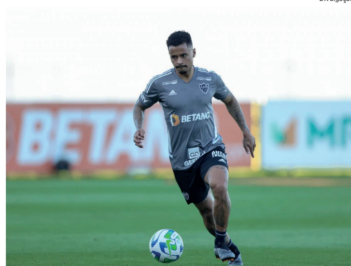
Jogador, de 26 anos, está perto de ser oficializado como reforço