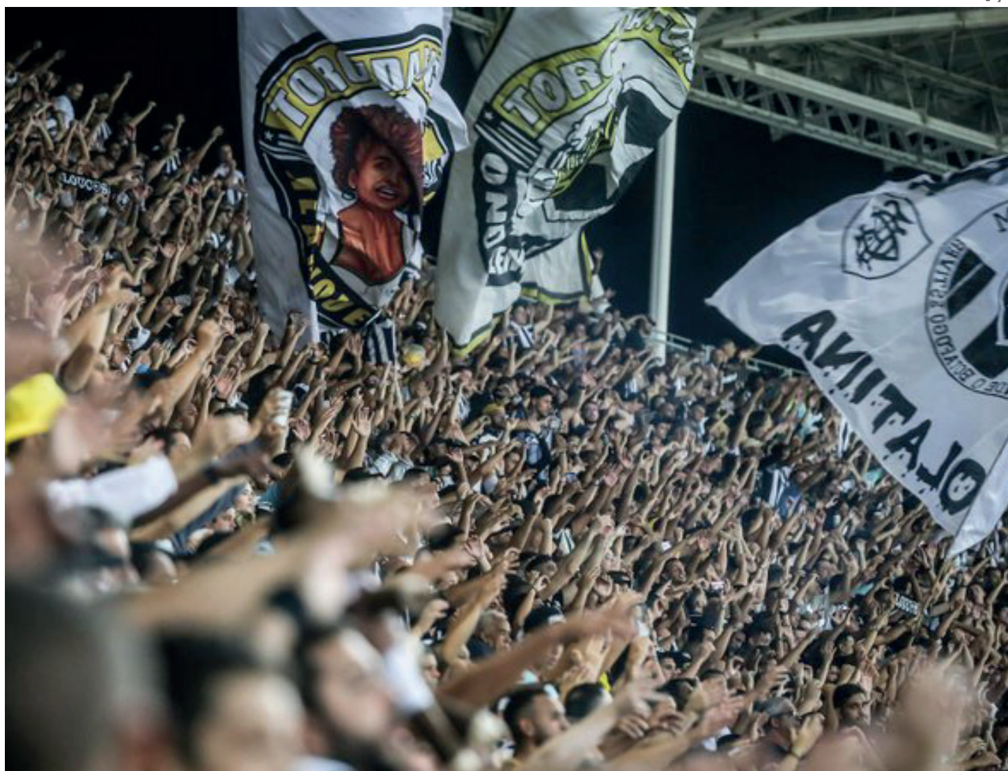
Estádio Nilton Santos deve receber bom público para o duelo. Apenas botafoguenses poderão ir ao jogo