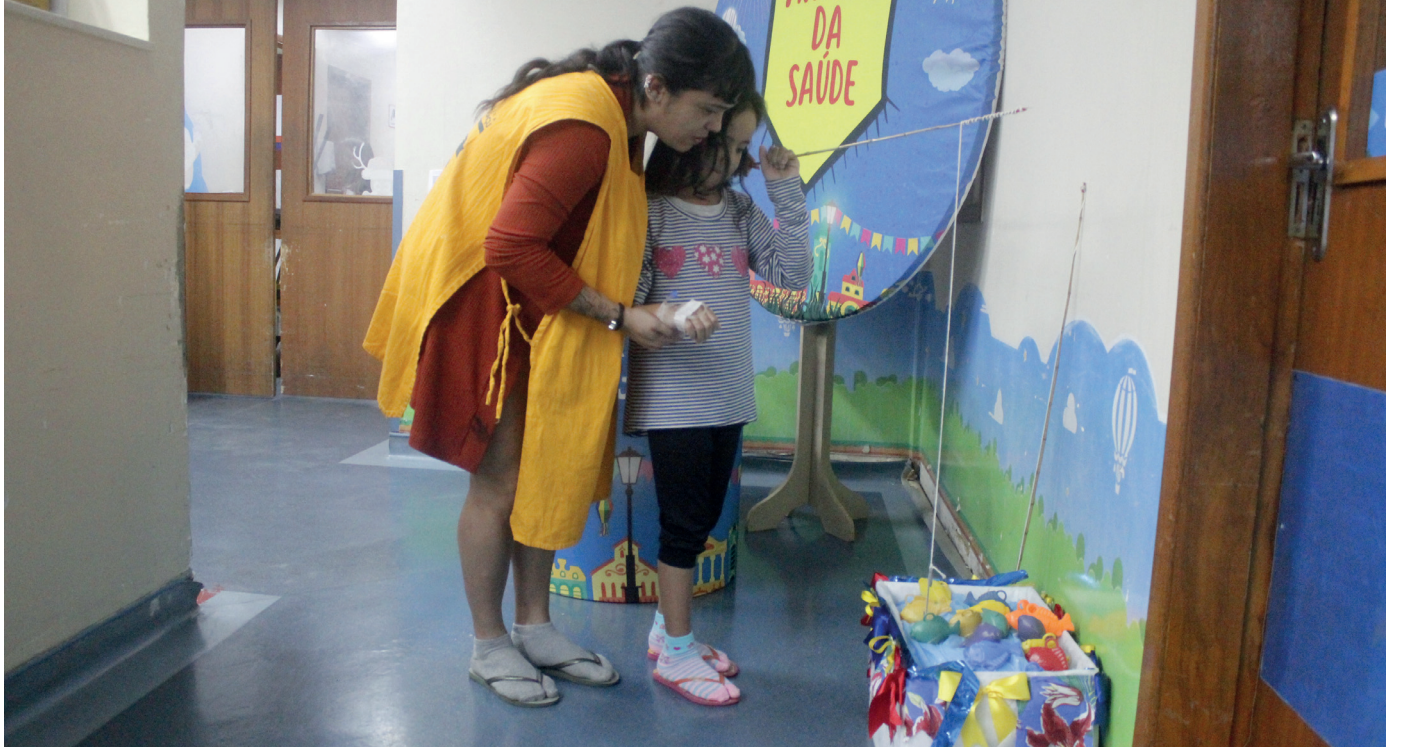
O Trio Xodó tocou composições famosas do forró que chamaram a atenção de funcionários, pacientes e acompanhantes