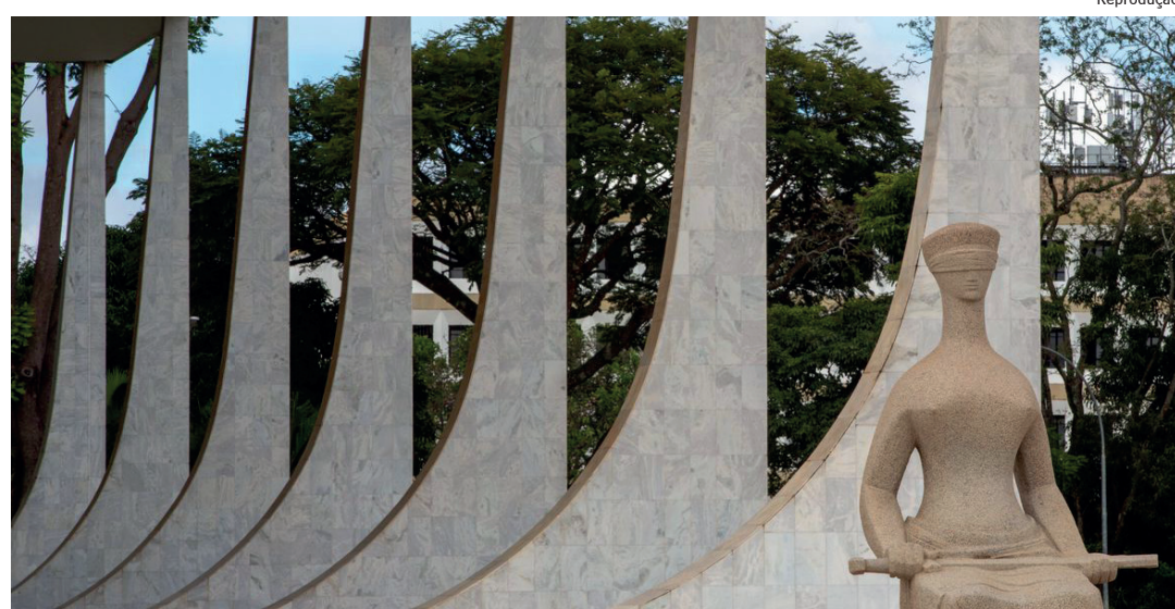
Análise foi interrompida nesta sexta e será retomada em agosto

A tese da “legítima defesa da honra” foi questionada no Supremo pelo PDT, em uma arguição de descumprimento de preceito fundamental (ADPF). O partido destacou que tal tese, que chamou de “nefasta” e “anacrô-