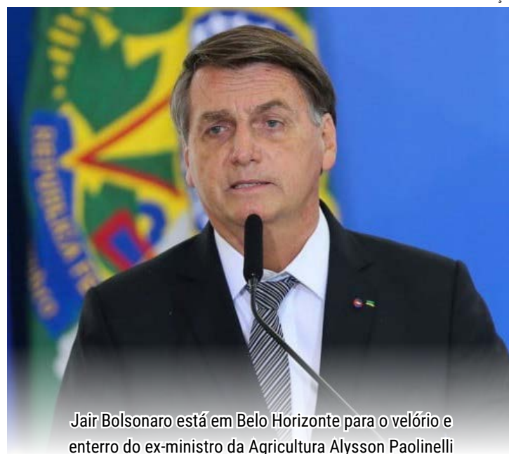
Jair Bolsonaro está em Belo Horizonte para o velório e enterro do ex-ministro da Agricultura Alysson Paolinelli

O Tribunal Superior Eleitoral (TSE) condenou o ex-presi-