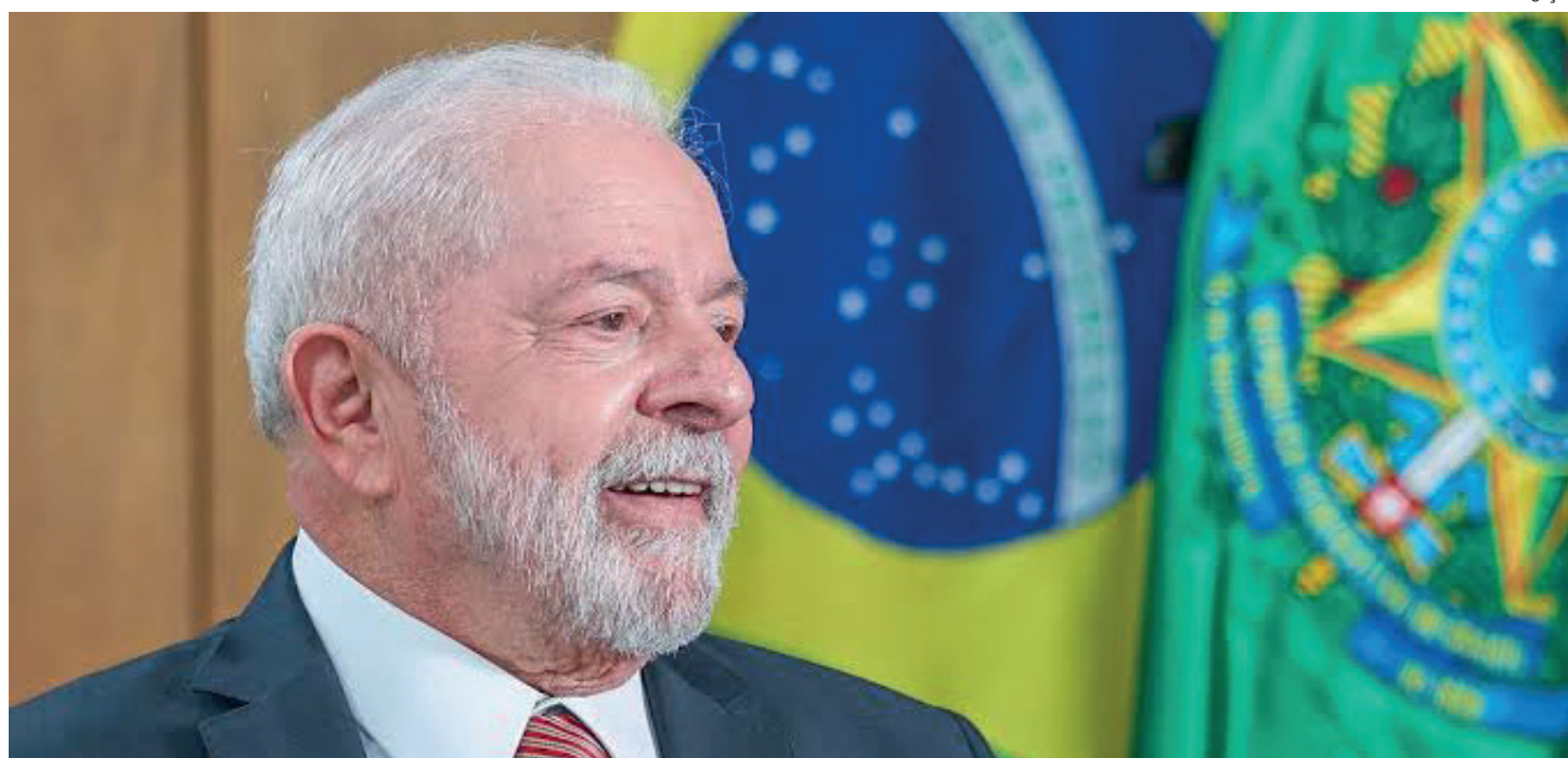
Presidente anunciou Plano Safra 2023/2024 de R$ 364 bilhões

O presidente Luiz Inácio Lula da Silva disse ontem que sua equipe não configura um clube ou um grupo de amigos. “Nós não somos um grupo de amigos. Somos um governo com gente de partido diferente, de ideologia diferente, de história diferente, que tem uma única coisa que unifica a todos nós, provar a nós mesmos e ao povo brasileiro que esse país pode ser do tamanho que a gente queira. Ou ele pode ser pequeno, se a gente pensar pequeno”.