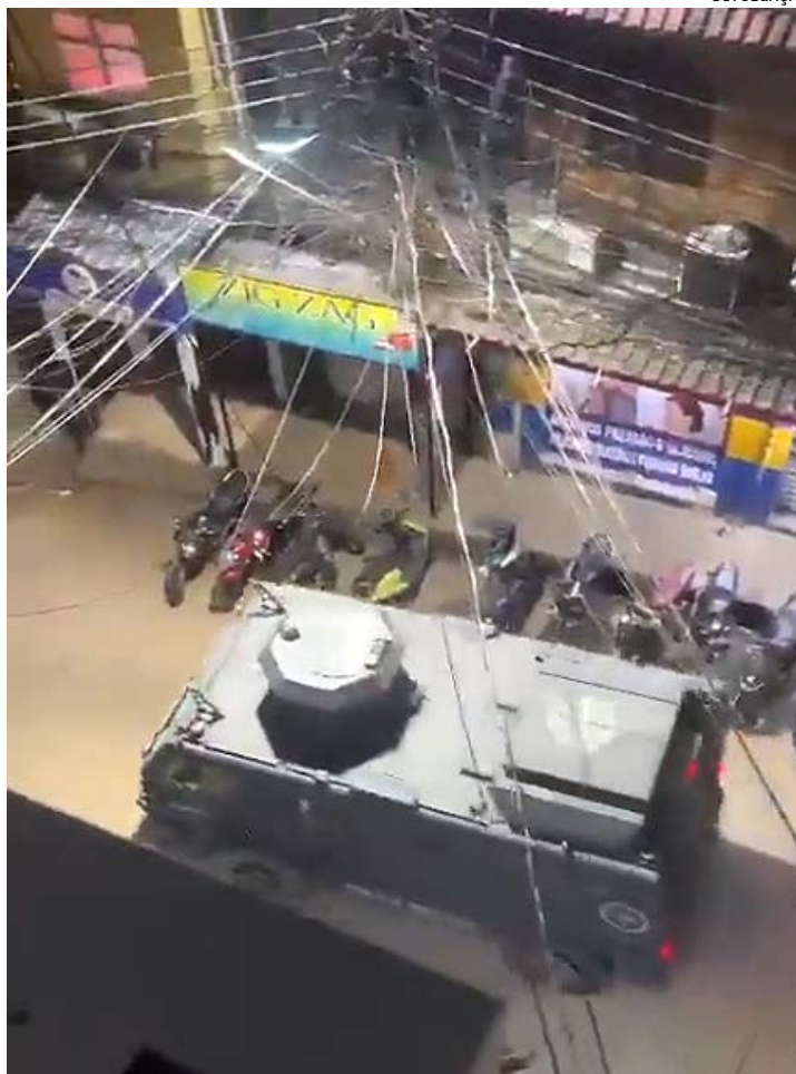
Objetivo da operação na comunidade era capturar dois traficantes dos estados de Goiás e Ceará, mas não encontrou êxito

Conhecido na comunidade da Rocinha com DJ J, sentiu na pela o que é morar em comunidade. Ele relatou que saiu na sexta-feira à noite, para pas-