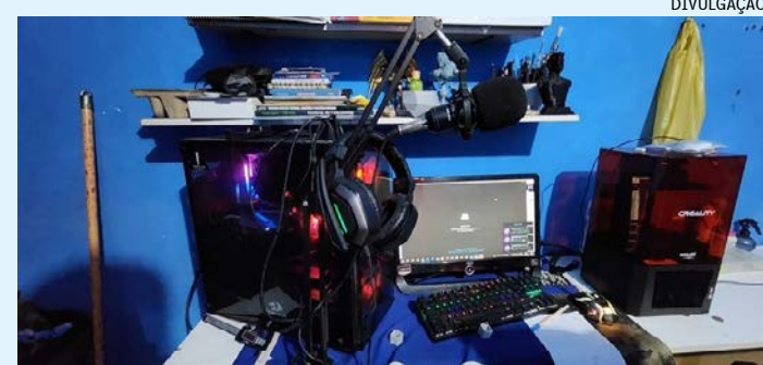
Adolescentes de 14 e 17 anos foram apreendidos. Investigações começaram em março deste ano, com o compartilhamento de informações entre a Polícia Federal e policiais civis de vários estados do país

Os policiais descobriram que os menores usavam três servidores da plataforma, que oferece a comunicação com o suporte de mensagens de texto, voz e chamadas de vídeo, para cometer atos de extrema violência contra animais e adolescentes. Eles ainda divulgavam pedofilia, zoofilia e faziam apologia ao racismo, nazismo e a misoginia.