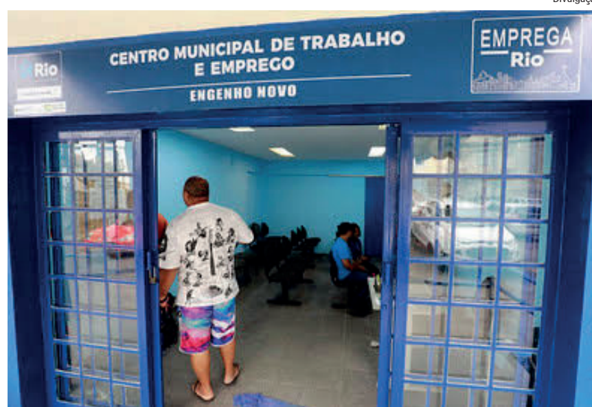
Candidato deve preencher formulário on-line

O Programa Trabalha Rio, em que são feitos cadastros no banco de empregos da prefeitura, além de encaminhamento para vagas e cursos disponíveis, será realizado nesta semana no dia 28 de junho, quarta-