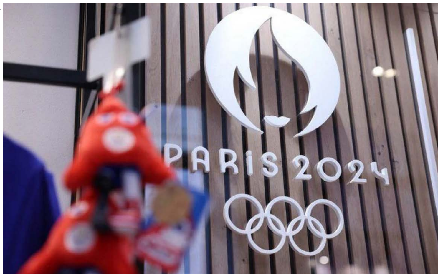
Lei da França proíbe bebidas alcoólicas em eventos esportivos

A venda de bebida alcoólica em locais de competições não será permitida durante os Jogos Olímpicos de Paris em 2024. A lei da França proíbe a venda e consumo de bebidas alcoólicas em eventos esportivos desde 1991. Existem exceções, mas o Comitê Organizador não pretende buscar liberação com as autoridades, segundo o jornal francês "Le Parisien".