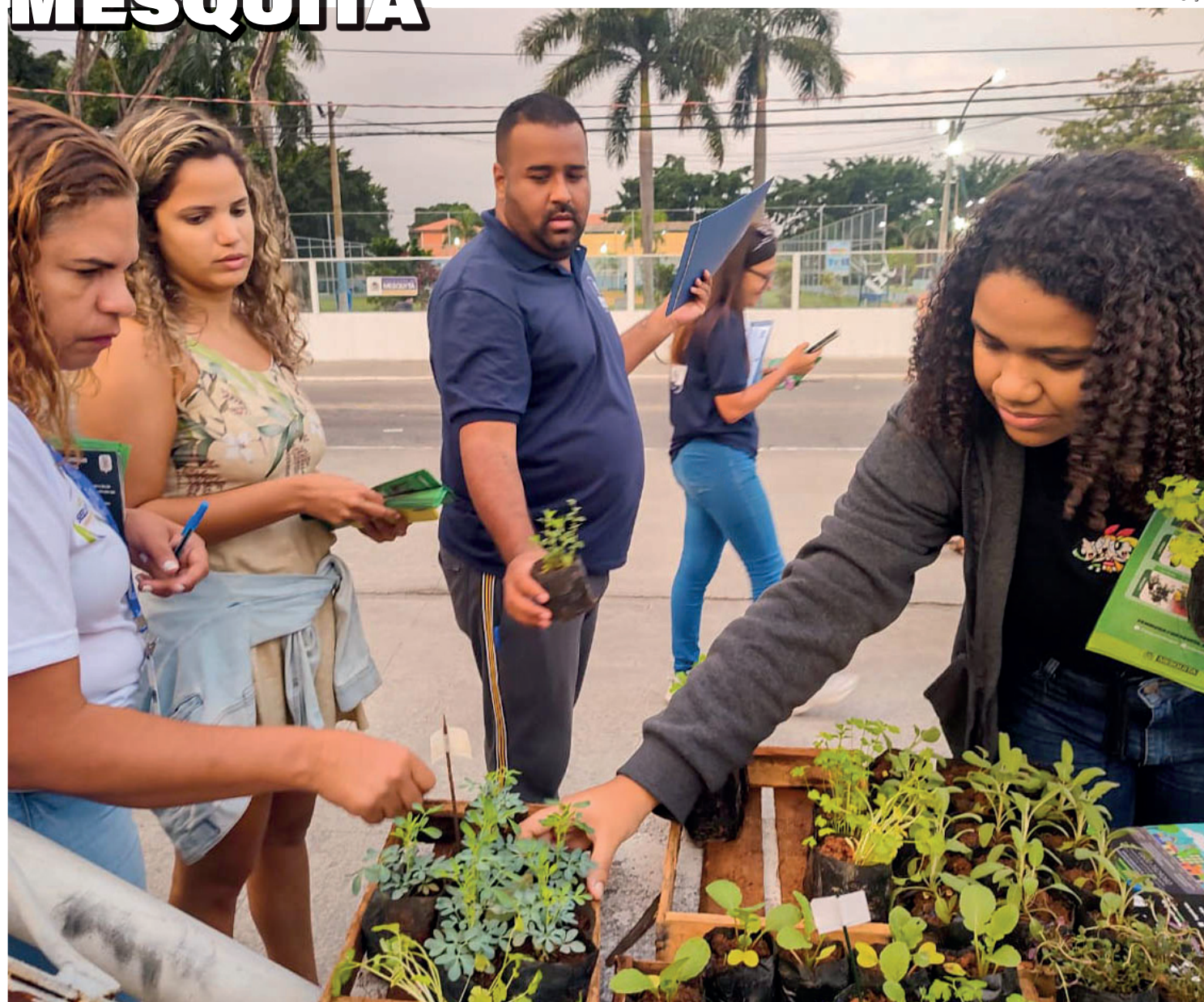
Foram entregues à população sete tipos de mudas, entre opções de verduras, temperos e ervas