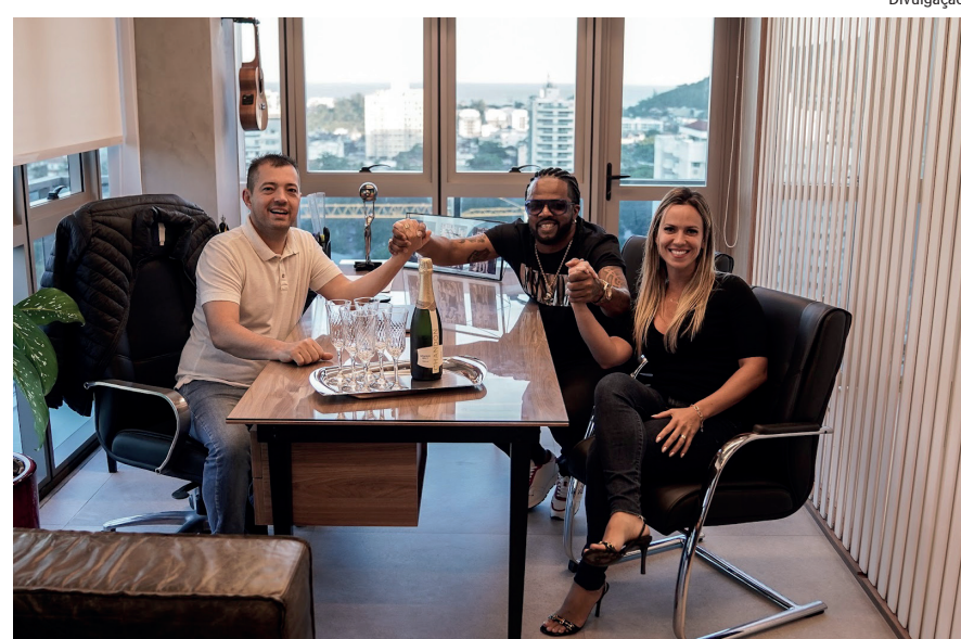
Renovação aconteceu na última semana