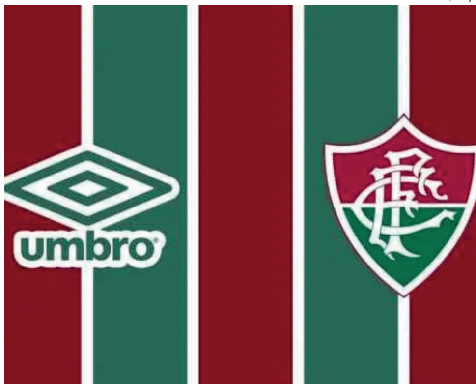
Uniforme está previsto para outubro

A paixão de Cartola pelo Fluminense sempre foi exaltada pelos tricolores, seja com bandeiras ou em forma de arte, com um grande painel com o rosto do sambista próximo à sede do clube.