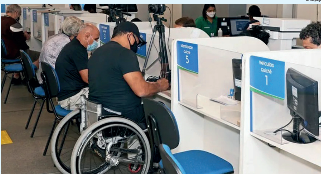
Duração média das aulas é de quatro meses. Formação é voltada para áreas de Administração e Tecnologia

desenvolver tarefas que utilizem a informática como principal ferramenta, assim como terão conhecimento das metodologias ágeis e suas aplicações. O curso está disponível na unidade de Realengo