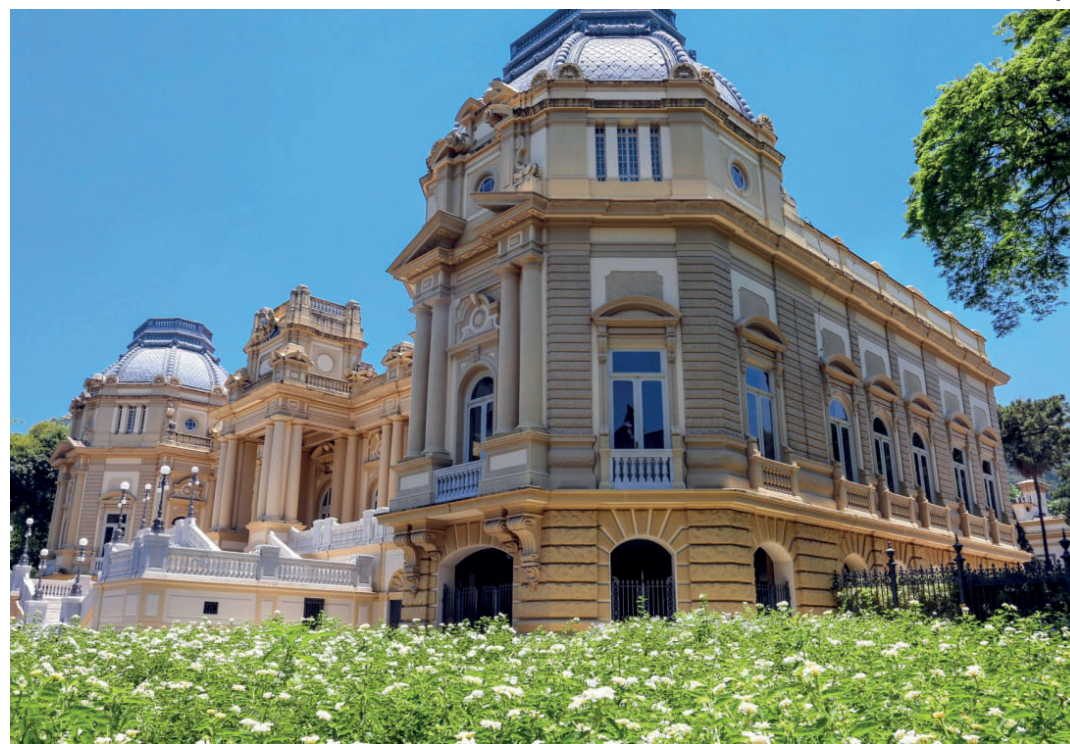
Prefeitura do Rio também adianta abono

A administração municipal cita que com o equilíbrio das contas públicas e todos os esforços feitos na atual gestão, desde 2021 a Prefeitura conseguiu voltar a pagar os servidores no 2º dia útil do mês seguinte e antecipar a primeira parcela do 13º salário no meio do ano.