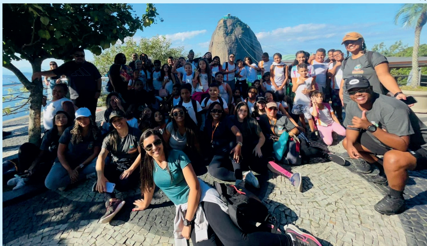
Alunos, professores e responsáveis participaram da trilha no Morro da Urca

Pela primeira vez na história da Escola Municipal Sargento Euclides, de Belford Roxo, a unidade rompeu as barreiras da Baixada Fluminense e levou os alunos do terceiro turno para fazer a trilha do morro da Urca, Zona Sul do Rio.