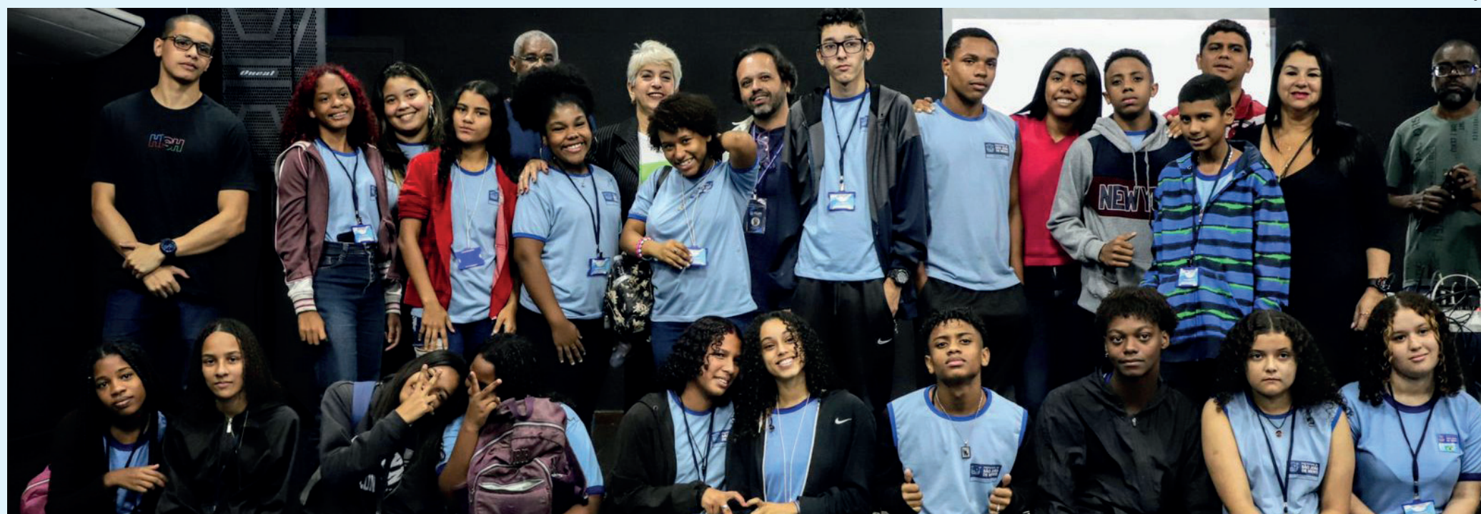
O evento tem o objetivo preservar a memória, homenagear os feitos e a bravura de João Cândido

Cerca de 80 alunos das Escolas Municipais Adérito Gomes Gouveia e Francisco Agostinho Costa, do 9º ano do Ensino Fundamental, participaram da mostra de cinema sobre a história do Marinheiro João Cândido, que ocorreu em