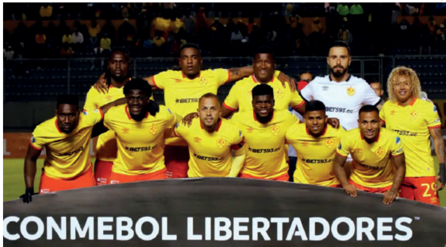
Aucas tem obrigação de vencer o Flamengo no Maracanã

Na última sexta-feira (23), o Aucas conquistou uma vitória contra o Orense, por 2 a 0. Apesar de ter tido um bom resultado em casa, os equatorianos não têm muitos motivos para comemorar quando analisam um recorte das últimas dez partidas. Foram apenas dois