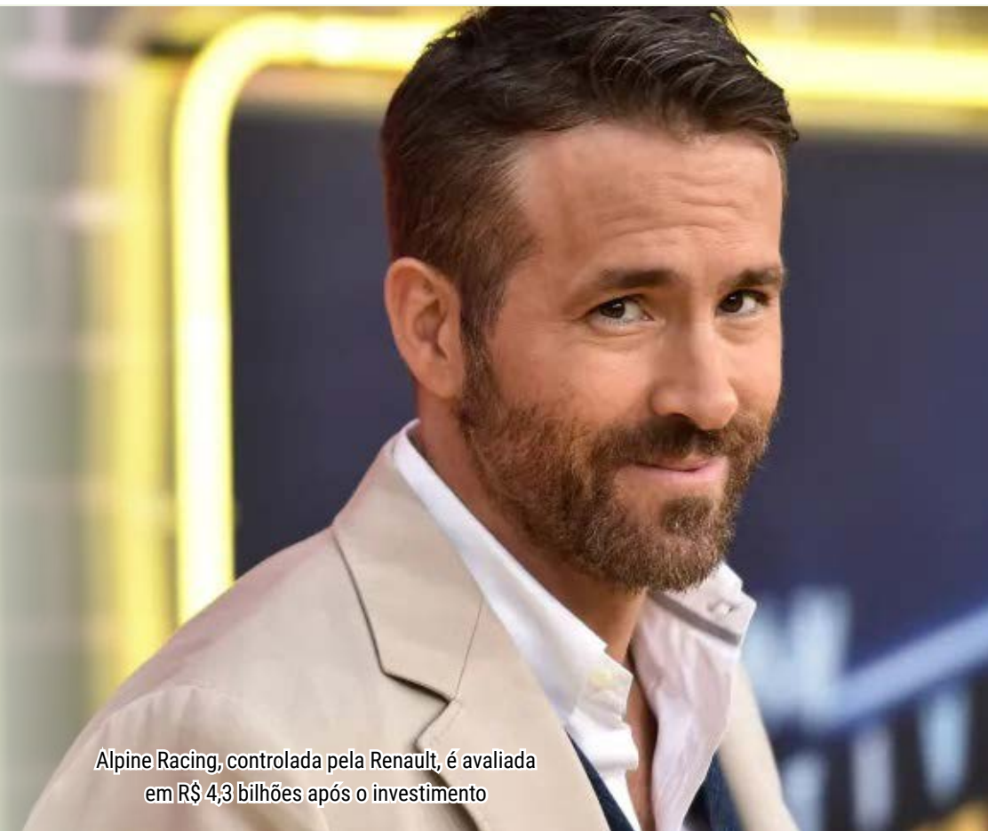
Alpine Racing, controlada pela Renault, é avaliada em R$ 4,3 bilhões após o investimento

A Renault disse que a Alpine Racing SAS, a entidade francesa que fabrica as unidades de potência da equipe em Viry-Châtillon, permanecerá inteiramente de propriedade da montadora.