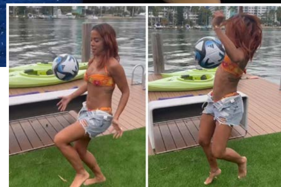
Cantora encontrou o atacante do Real Madrid em Miami, nos Estados Unidos

Sobre o desafio das embaixadinhas, Anitta brincou com a sua falta de jeito para o futebol.