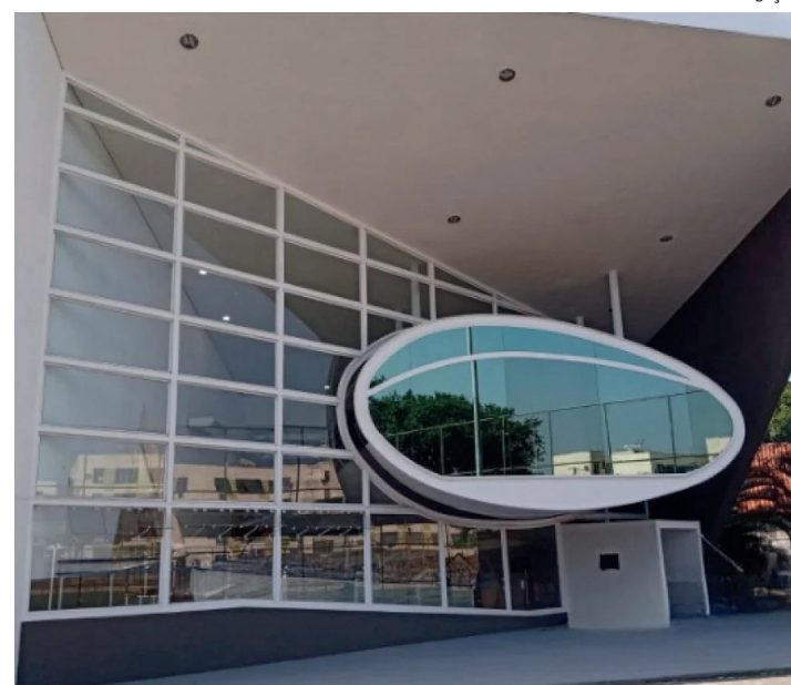
Conteúdo na área de economia criativa chega a unidades de Madureira, Irajá, Triagem, Santa Cruz, Padre Miguel e Nova Aliança por meio da iniciativa

"Essa parceria é mais uma ação que promovemos de inclusão produtiva para que jovens, assim como adultos, de várias regiões atendidas pelas Naves tenham a oportunidade de adquirir novos conhecimentos e possam atuar no campo da Economia Criativa. Através dessa iniciativa conjunta, novos conteúdos serão agregados ao que as Naves já oferecem gratuitamente para a popula-