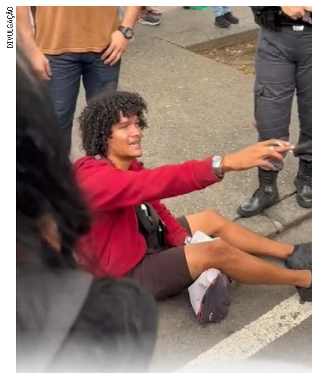
Vendedor tentou comprar um sorvete no estabelecimento quando se envolveu em uma discussão com segurança

O caso foi registrado na 27ª DP como lesão corporal e encaminhado para o Juizado Especial Criminal (Jecrim). A arma do PM reformado tem registro e não foi apreendida. O agente responde em liberdade.