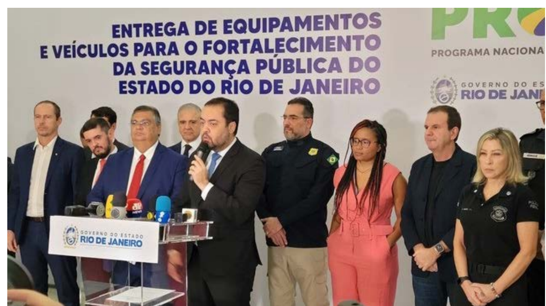
Acordo conta com a doação de equipamentos, ações conjuntas no combate ao roubo de cargas e auxílio com presos considerados de alta periculosidade

Entre as medidas também está o aumento na capacidade do sistema carcerário estadual e o acordo com a custódia federal de presos indicados pelo