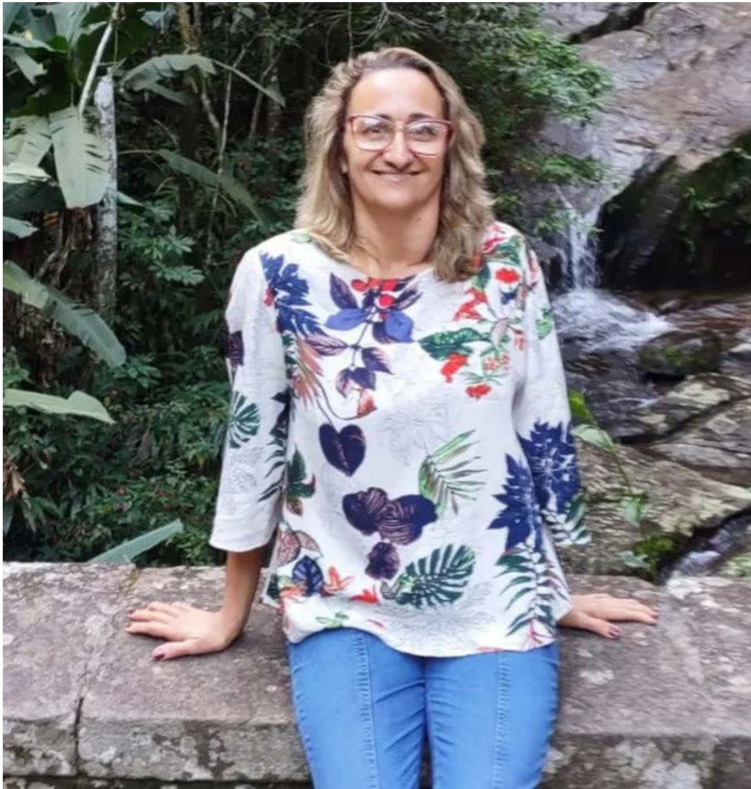
No incidente, uma universitária morreu. O policial rodoviário federal preso foi solto neste domingo (18) ao passar pela audiência de custódia na Justiça Federal

"O médico disse que ela se salvou por um milagre, por pouco não atingiu o coração dela", destacou.