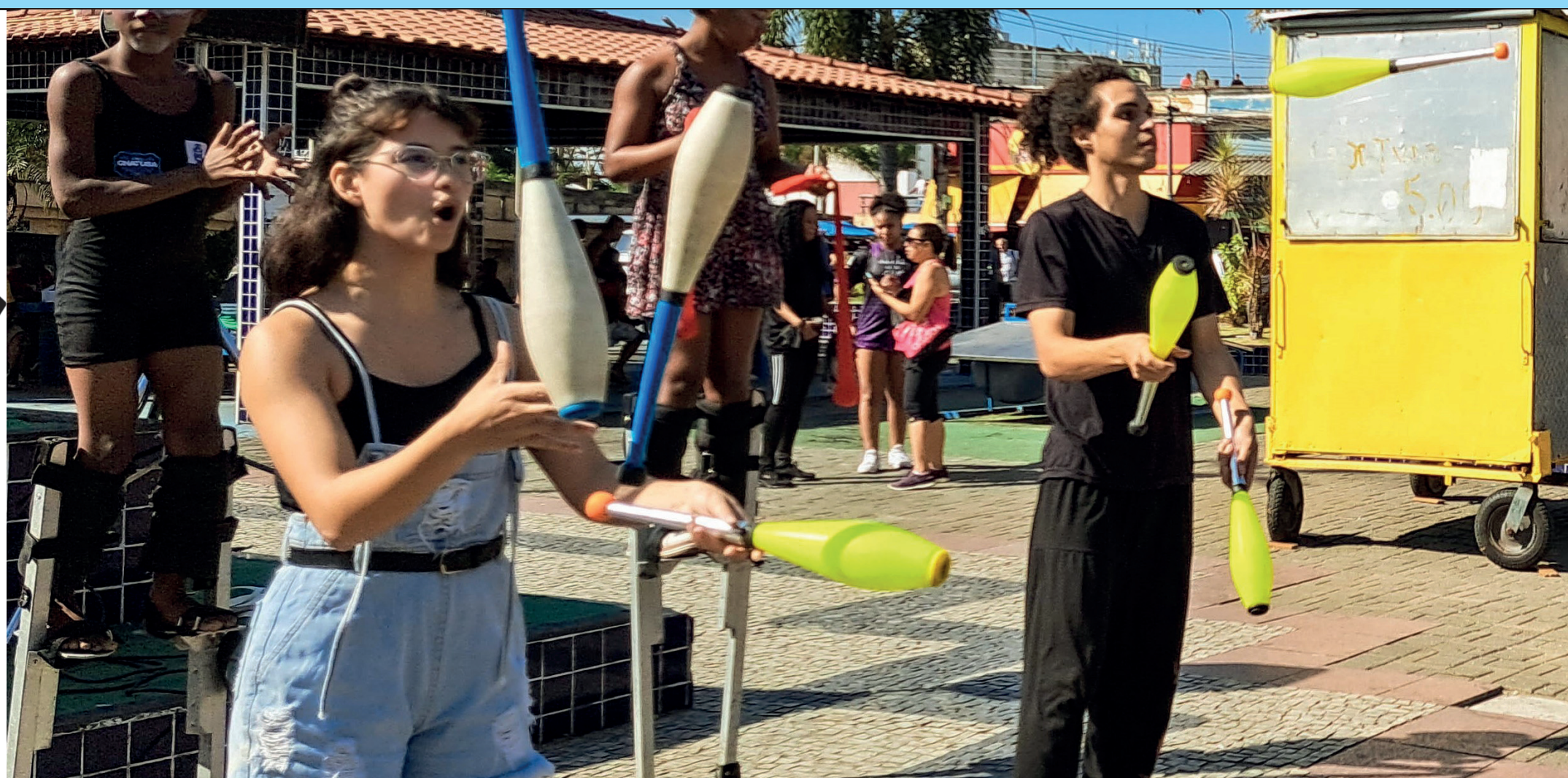
Evento aconteceu na Praça Elizabeth Paixão, no Centro, e contou com atividades intersetoriais