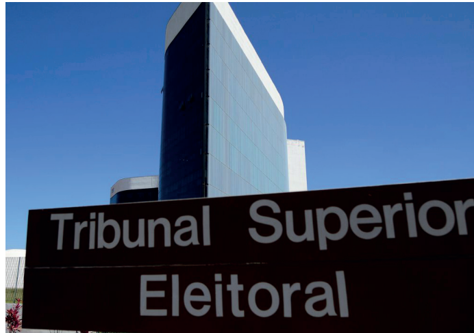
Julgamento está marcado para a próxima quinta-feira