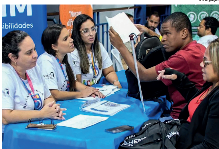
Evento acontece no dia 20 de junho e há vagas para todos os cargos e níveis profissionais