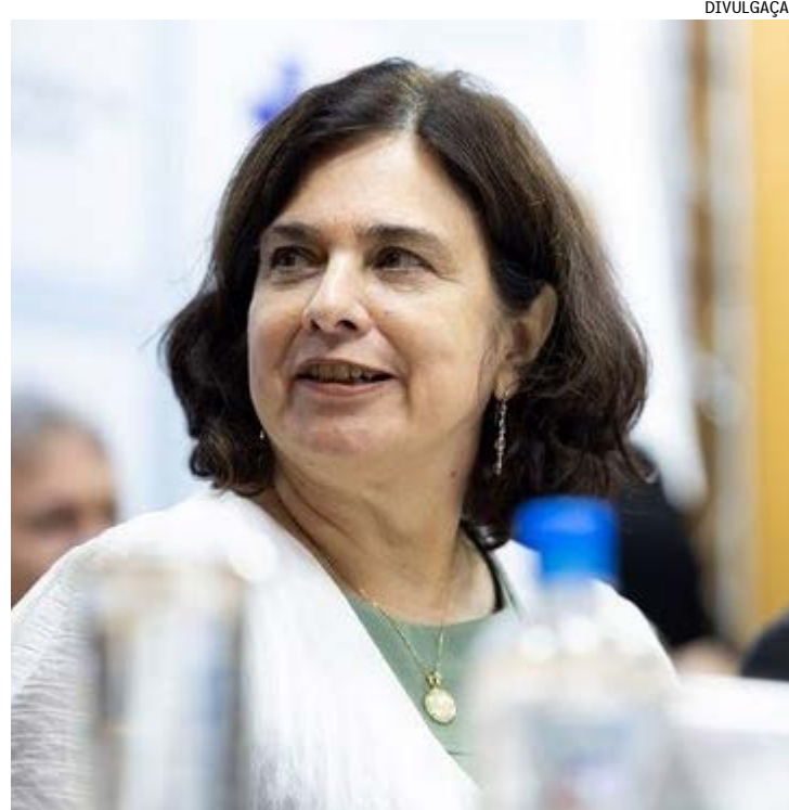
Pimenta disse que Nísia Trindade está fazendo um grande trabalho

No último sábado (17), Sabino e Lula se reuniram em Belém (PA) e o deputado