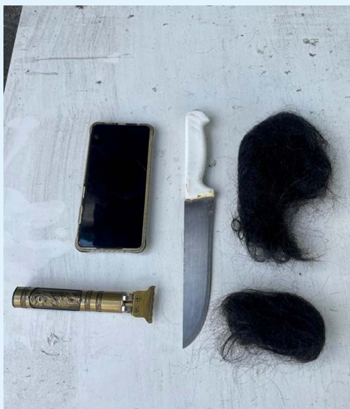
Mulher veio de Minas Gerais para se encontrar com o suspeito, acreditando que os dois reatariam o casamento