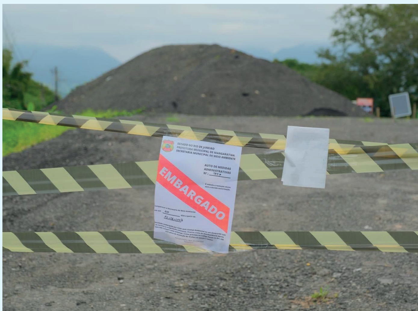
A aplicação da multa foi um desdobramento da fiscalização ambiental