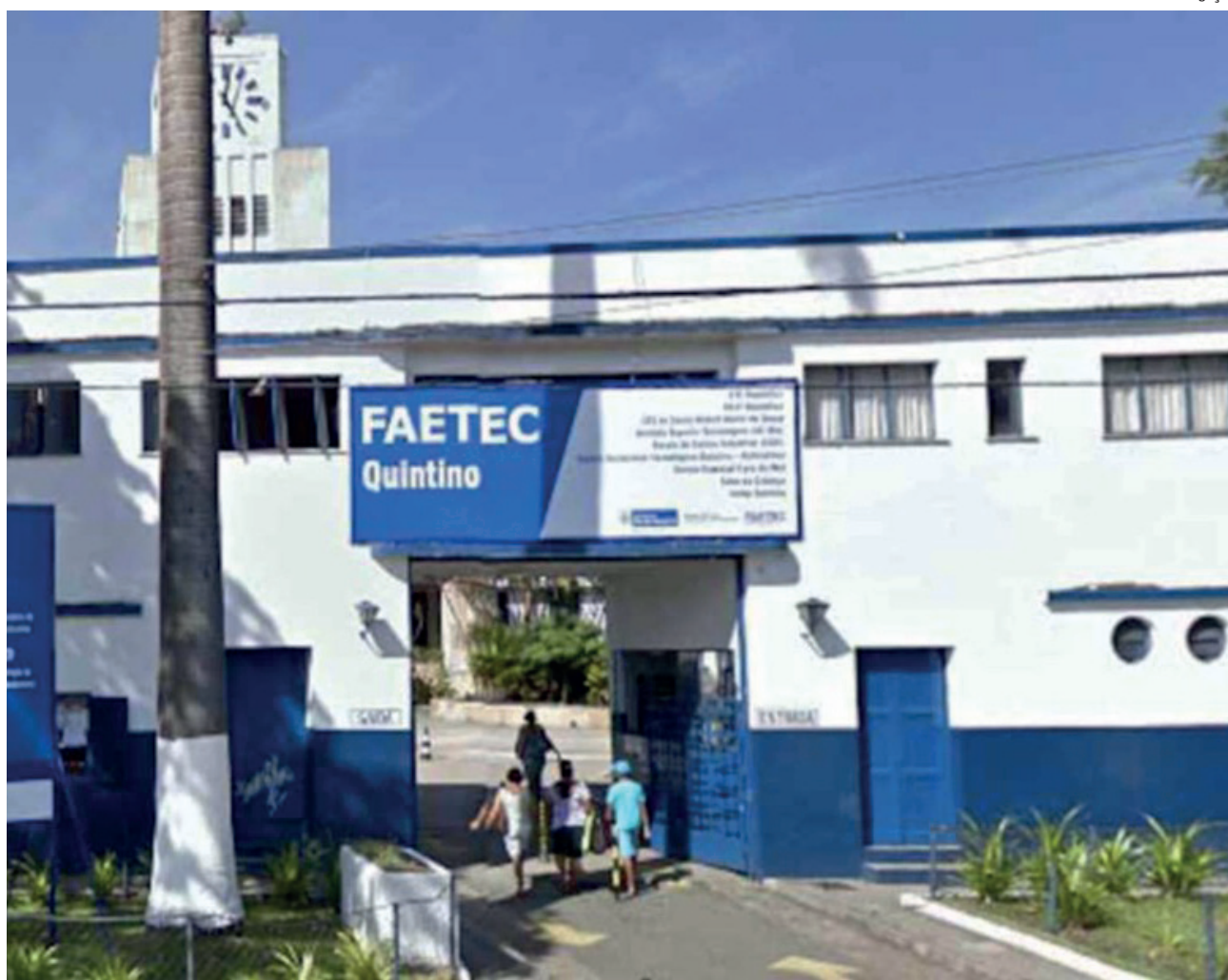
Os candidatos serão selecionados por meio de sorteio. Veja prazos de inscrição e requisitos

Também estão sendo oferecidas vagas para retomar os estudos e concluir o ensino fundamental ou médio. Para se inscrever na Educação de Jovens e Adultos (EJA), é preciso ter idade mínima de 15 anos e apresentar comprovante de conclusão dos anos iniciais do ensino fundamental (até 5º ano). Já a Educação de Jovens e Adultos para o Ensino Médio (EMEJA) é oferecida a quem possui no mínimo 18 anos e tenha concluído integralmente o ensino fundamental.