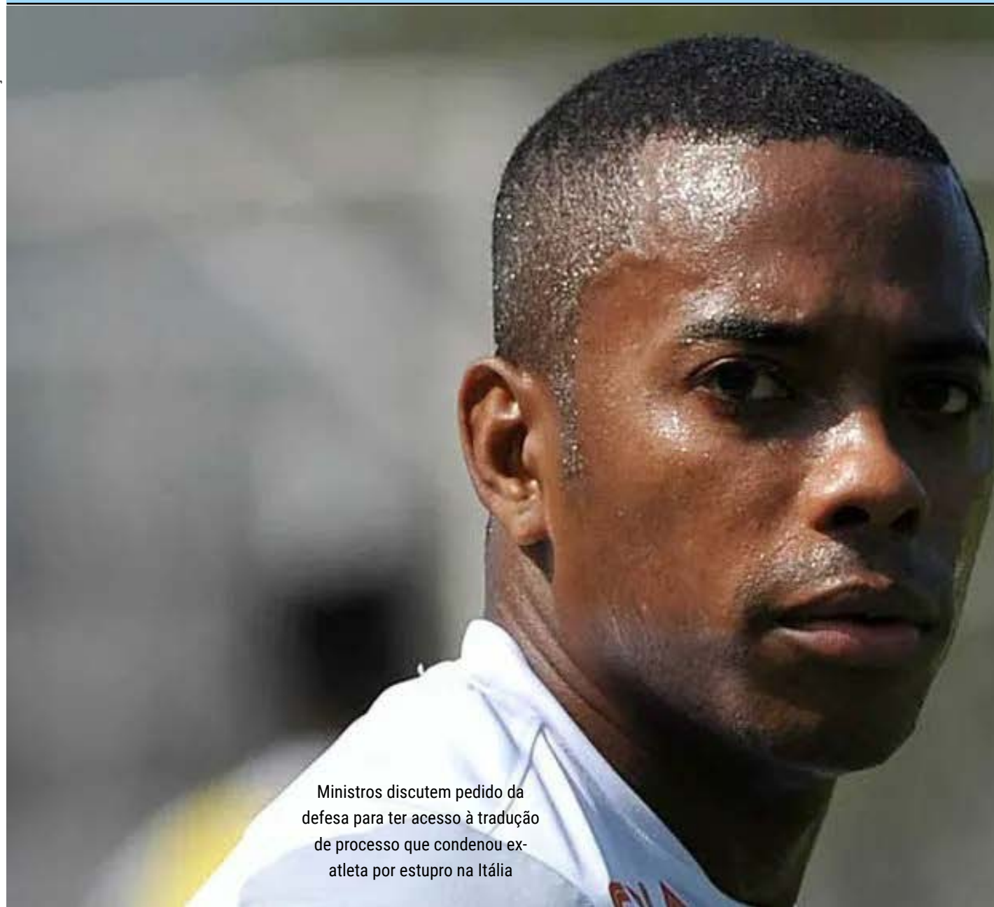
Ministros discutem pedido da defesa para ter acesso à tradução de processo que condenou ex-atleta por estupro na Itália