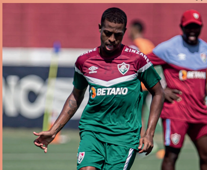
Atacante, de 33 anos, tem contrato até o fim de 2025