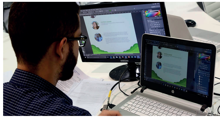
Inscrições já estão abertas; participantes receberão certificado

usar imaginação e habilidades de resolução de problemas para criar e modificar ambientes virtuais. Com esses recursos ilimitados e possibilidades de construção, os jogadores aprendem a planejar, organizar e a executar projetos complexos, desenvolvendo habilidades de liderança e gestão. Em todo o país, professores já utilizam o game em salas de aula para ensinar diversas disciplinas, desde a arquitetura a geometria, e tem se tornado uma alternativa interessante para aprender a programar.