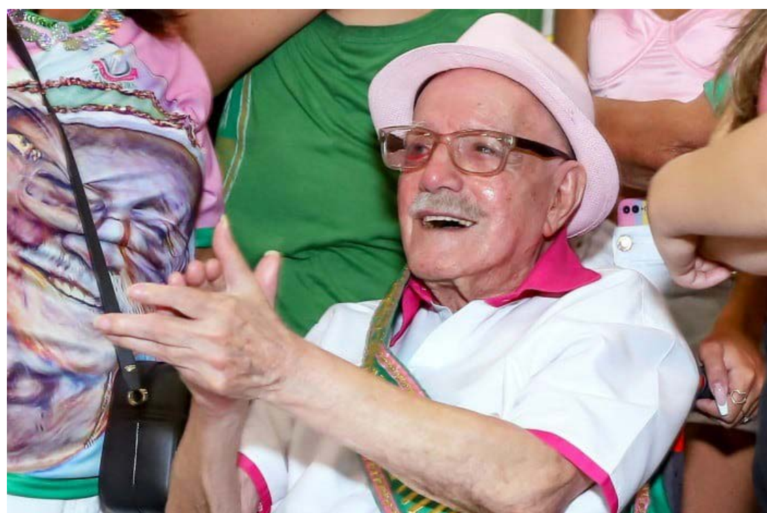
Compositor assinou 16 obras para a Verde e Rosa e, com seis delas, embalou campeonatos