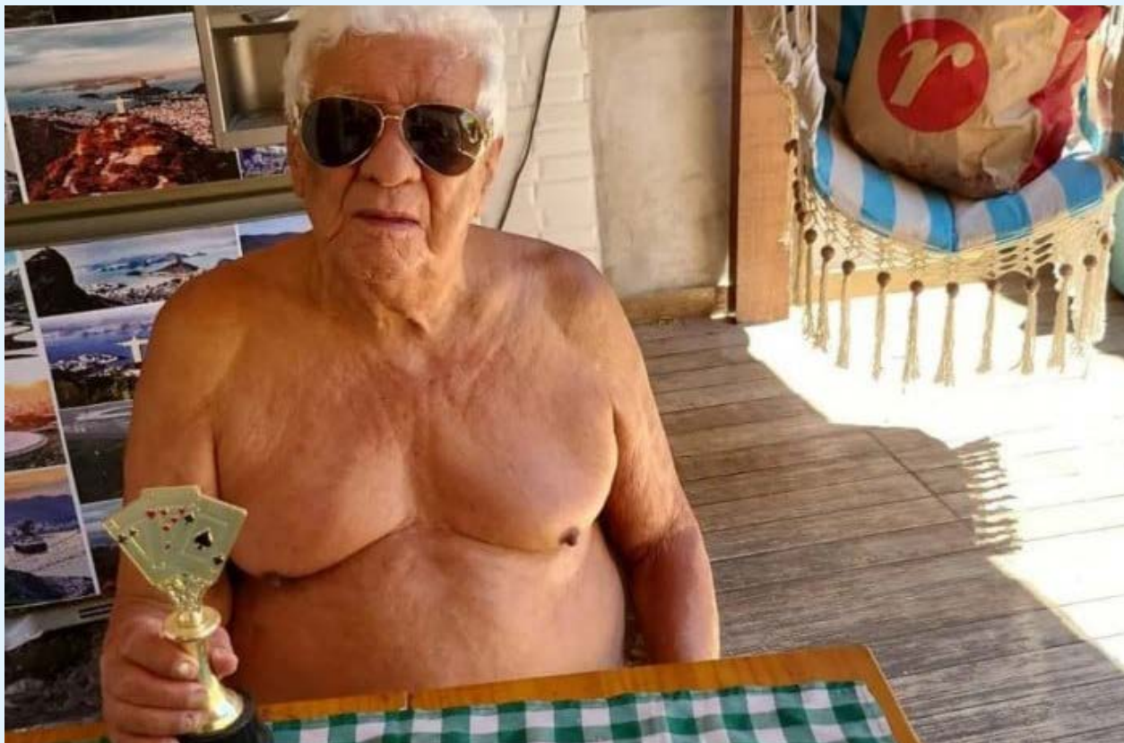
Vítima era neto de patrono da Portela, morto em 2021. Órgão também ofereceu denúncia contra integrantes da milícia 'Família Suruf', que atua em Magé, na Baixada