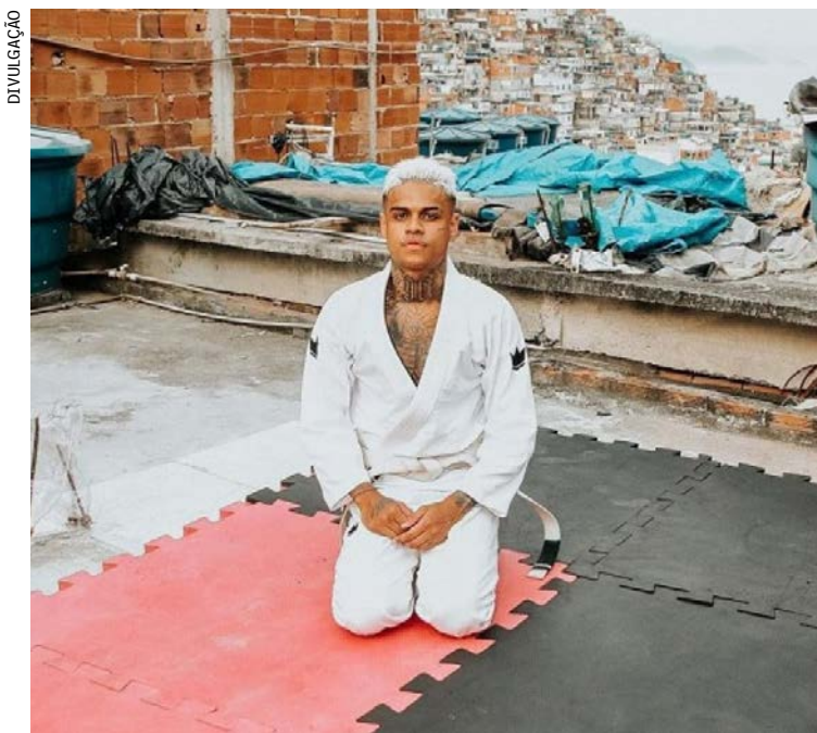
Copa Cabelinho das Favelas reúne atletas de comunidades no dia 2 de julho, no Parque Olímpico-RJ