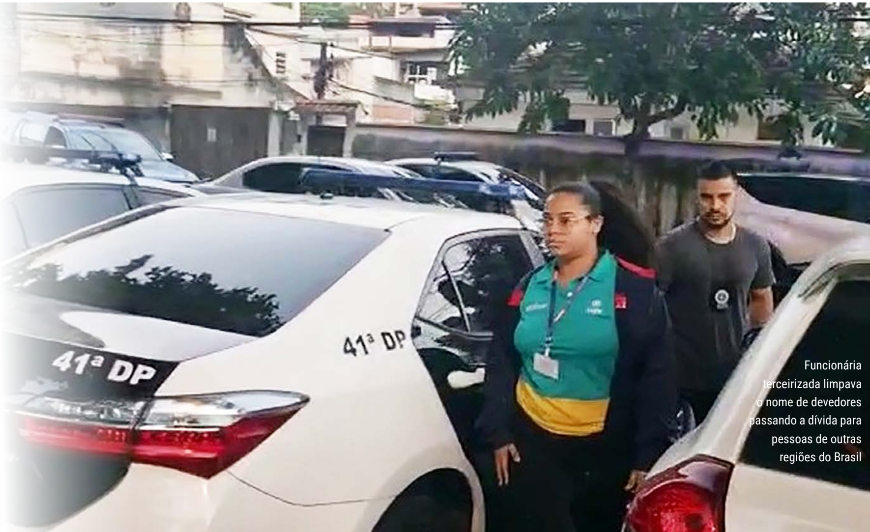
Funcionária terceirizada limpava o nome de devedores passando a dívida para pessoas de outras regiões do Brasil

Os policiais tentam agora identificar os clientes beneficiados pelas fraudes e outras pessoas utilizadas para cooptá-los.