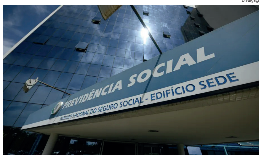
Seleção iniciada no segundo semestre do ano passado chegou a ter mais de um milhão de inscritos

Os técnicos do seguro social são responsáveis por atender o público;