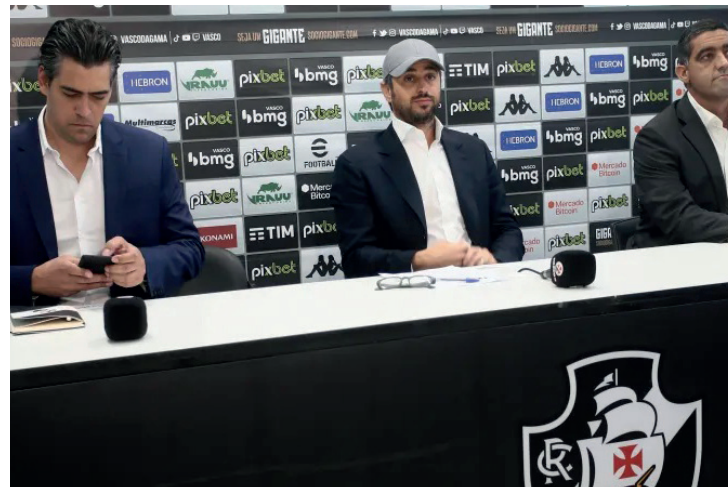
Jogadores, funcionários e membros da comissão técnica se sentiram desprotegidos

Vivendo seu pior momento na temporada, sem vencer há oito jogos e com quatro derrotas consecutivas, o Vasco busca recuperar a boa fase no próximo domingo (11). O Cruz-Maltino enfrentará o Internacional no Beira-Rio às 16h, em partida válida pela 10ª rodada do Campeonato Brasileiro.