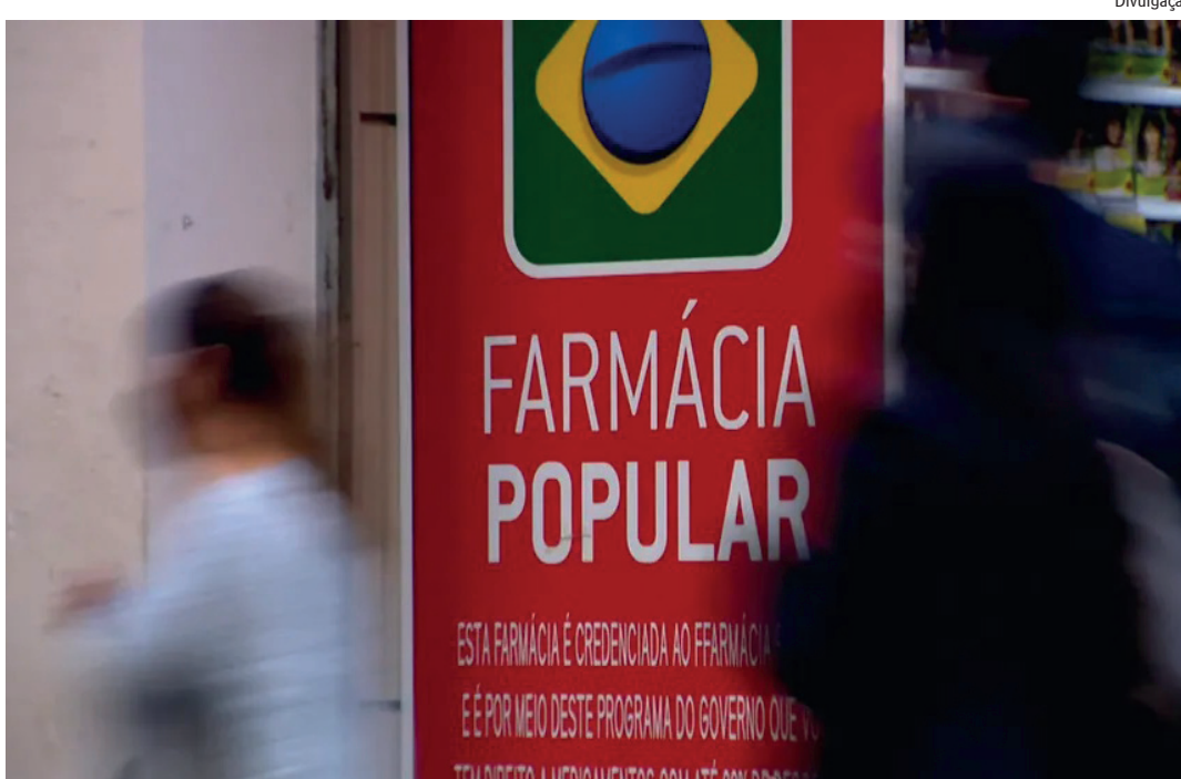
Hoje, anticoncepcionais e remédios para doenças como glaucoma e Parkinson estão disponíveis, mas quem retira paga parte do valor. Lula relançou ontem programa em evento no Recife

No ano passado, o programa Farmácia Popular atendeu cerca de 20 milhões de pessoas. Foram quase 9 milhões de atendimentos a menos do que o número registrado em 2015 – ano com o