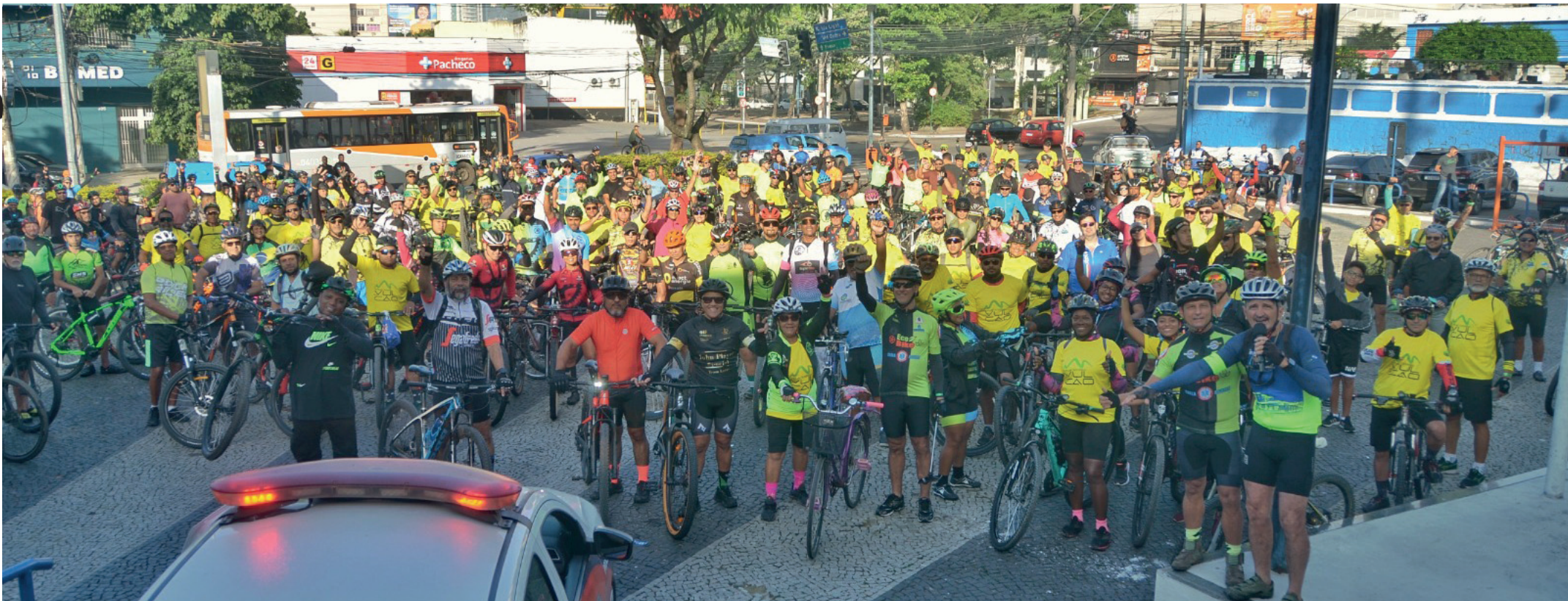
Cerca de mil pessoas encararam mais de 10 quilômetros de bicicleta e cinco quilômetros de trilha