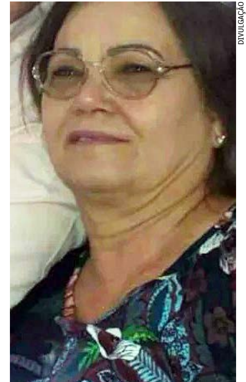
A Polícia Civil ainda não definiu se o crime será enquadrado como culposo ou doloso