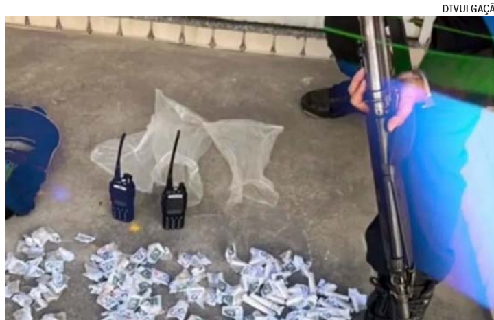
Prisão feita pelos policiais militares do 20º BPM (Mesquita) aconteceu em um dos acessos da comunidade no bairro de Olinda

A ocorrência policial com os presos e todo o material apreendido foi registrada na 57ª DP (Nilópolis).