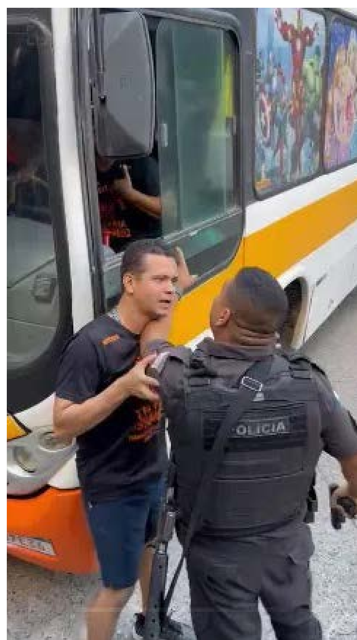
O PM chegou a sacar uma pistola e encostar no peito de um outro homem que aparece pedindo calma ao agente

A Polícia Militar informou que o comando da Coordenadoria de Polícia Pacificadora (CPP) já está em posse do material e está apurando as circunstâncias do fato. O policial será convocado para prestar esclarecimentos ao comando.