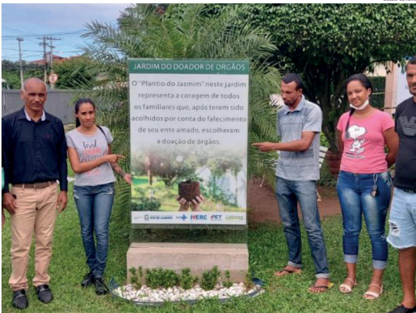
Procedimento é considerado de altíssima complexidade