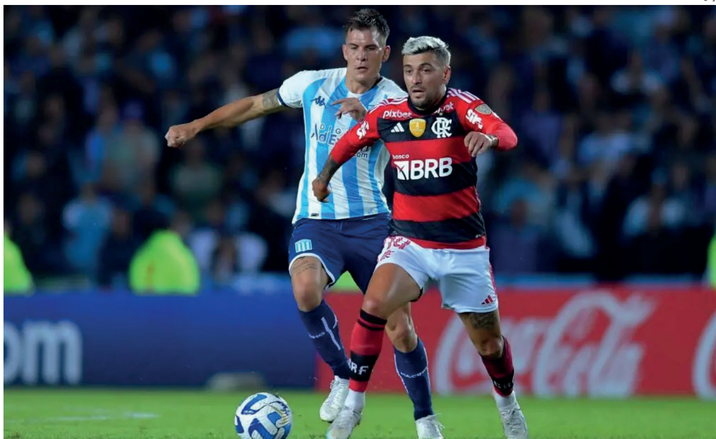
Partida acontece às 21h de hoje

O Flamengo se prepara para ter força máxima. Para isso, no entanto, a comissão técnica de Sampaoli precisará