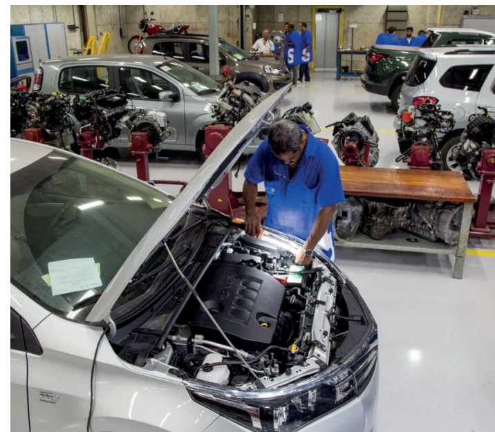
Firjan Senai informa que são 160 vagas. Os interessados terão até 26 de julho para a primeira mensalidade em cursos como de Mecânica, Informática, Automação Industrial e Eletrotécnica

As cargas horárias podem variar entre 1.200, 1.000 e 960 horas e os modelos de aula podem ser diferenciados. Quatorze cursos serão realizados com atividades semipresenciais (40% presencial e 60% à distância) e somente os cursos técnicos