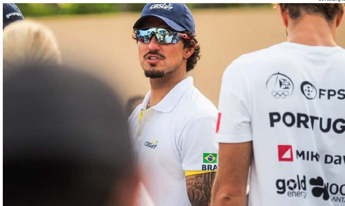
Gripado, surfista brasileiro preferiu não competir para se poupar visando a próxima etapa do circuito mundial

Duas brasileiras seguem no evento. Tatiana Weston-Webb está na quinta fase, enquanto Silvana Lima está na repescagem. João Chianca, terceiro do ranking mundial, também está na repescagem. Filipe Toledo e Luana Silva já foram eliminados.