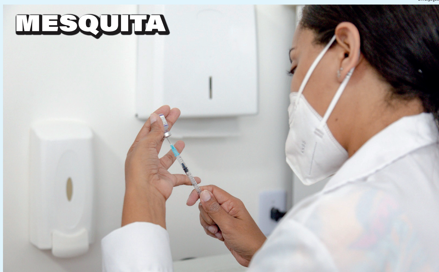
Com a prorrogação, população ganha mais oportunidades de comparecer aos postos de vacinação

Para se vacinar, basta comparecer a um dos 11 locais