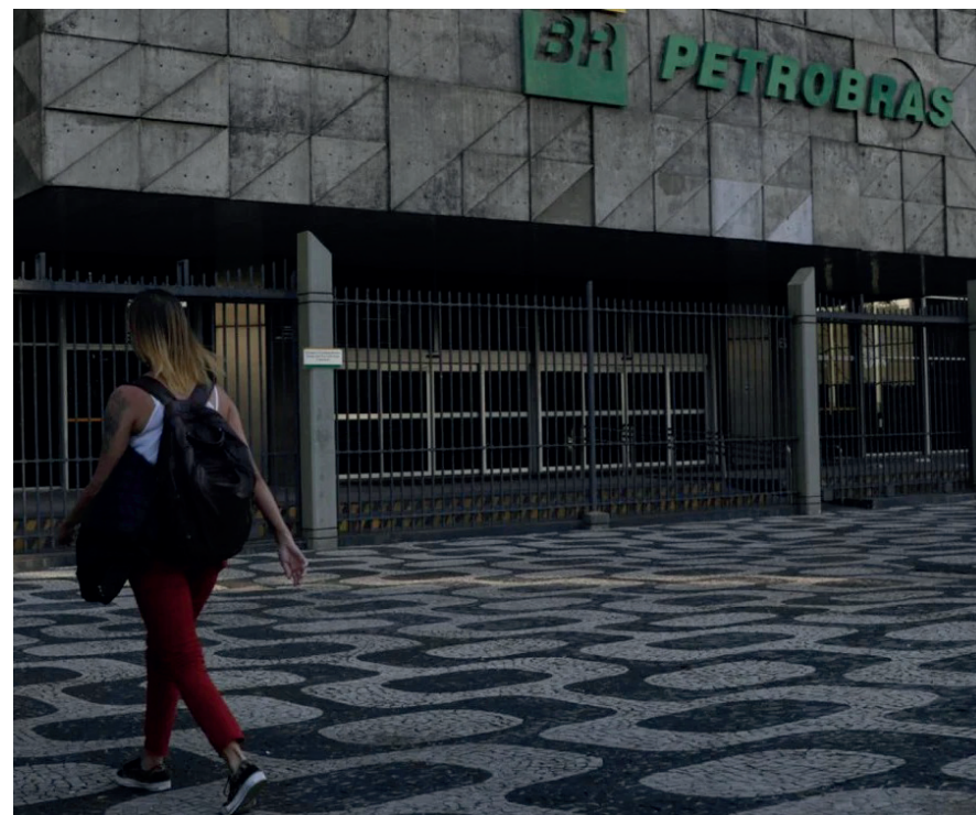
Seleção oferece 200 vagas distribuídas em 11 estados

As vagas disponíveis são para estudantes de cursos superiores de administração, análise de dados, análise de sistemas, ciência da computação, comunicação social (jornalismo, publicidade e relações públicas), contabilidade, direito, engenharia (computação, automação e controle, elétrica, mecânica, petróleo, produção e química), estatística, geologia e serviço social.