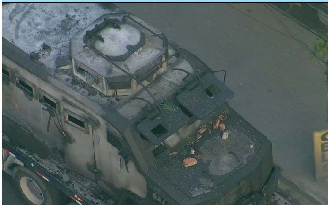
Caveirão incendiado faz parte de uma série de novos equipamentos que começaram a chegar a partir de março do ano passado