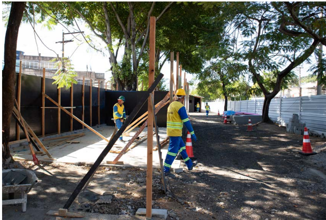
Município vai ganhar corredor exclusivo para ônibus e bicicletas, além de projetos urbanísticos e de infraestrutura

– O investimento nessas obras de grande importância para os moradores de São Gonçalo vai mudar a realidade da cidade. Esse é um dos mui-