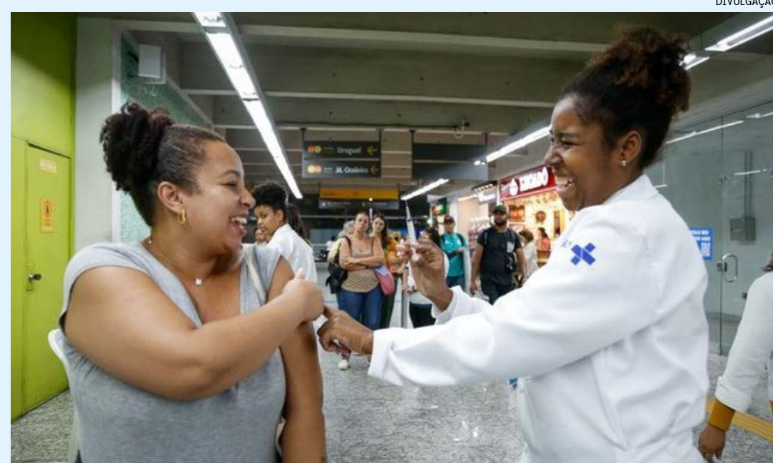
Durante a ação, as equipes da SMS vão orientar os passageiros do metrô sobre a importância de completar o esquema vacinal contra os vírus, além de tirar dúvidas sobre a imunização. Confira a agenda

Os locais de vacinação serão montados fora da área controlada, sem a necessidade de passar pelas catracas das estações, das 8 às 16h.