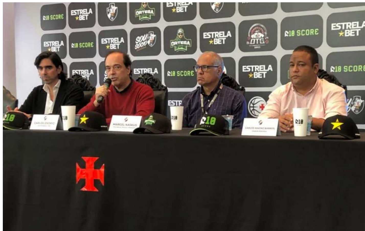
Cruz-maltino já mapeou nomes e pretende fechar com técnico campeão Sul-Americano