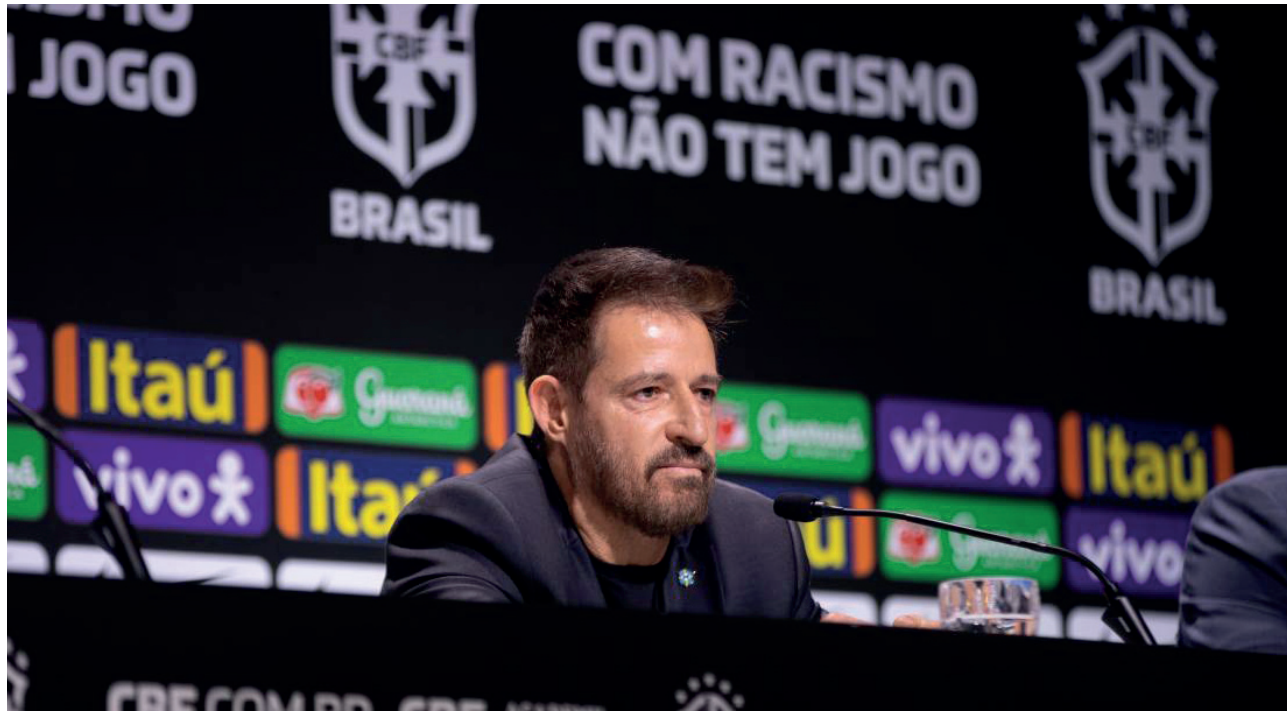
Já estamos na metade do ano e não há indício de como será a preparação para a próxima Copa; no Brasileirão, sigo encantado com o líder Botafogo