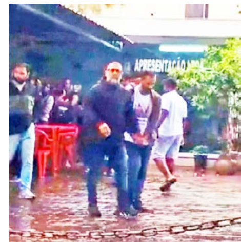
De acordo com as investigações, o grupo invadia os estabelecimentos fazendo furos nas paredes

O delegado ainda informou que, dentro do grupo, há uma divisão de tarefas entre os membros. Alguns são infratores especializados em abrir buracos nas paredes, outros em desativar alarmes e abrir cofres com a utilização de maçarico. Ainda de acordo com Ramos, há suspeitos oriundos de outros estados que atuam junto do grupo. Os criminosos agiram em Vassouras e em Volta Redonda, no Sul do estado.