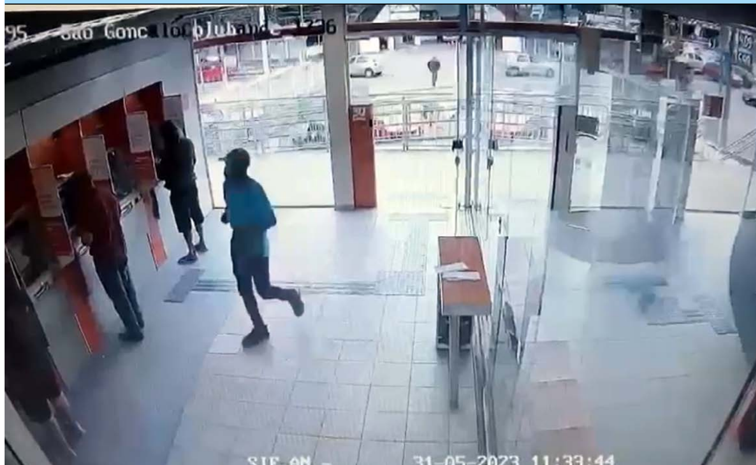
Caso foi registrado na 74ª DP (Alcântara)