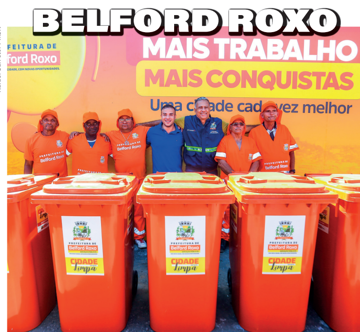
Os garis ganharam equipamentos de proteção individual e novo coletores

Inscrições acontecem na sede da Secretaria Municipal de Educação, que fica na Rua Marquesa de Grizelda s/nº, em Edson Passos