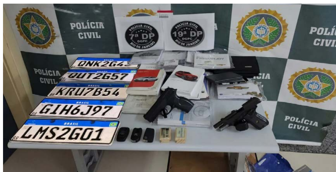
Um dos suspeitos foi localizado na Barra da Tijuca, enquanto o outro foi preso em Pedra de Guaratiba, ambos na Zona Oeste

Foram apreendidos um veículo, que foi utilizado em pelo menos um dos assaltos, dois carregadores de pistola e um celular, que serão analisados para dar continuidade às investigações e apurar eventuais outros crimes.