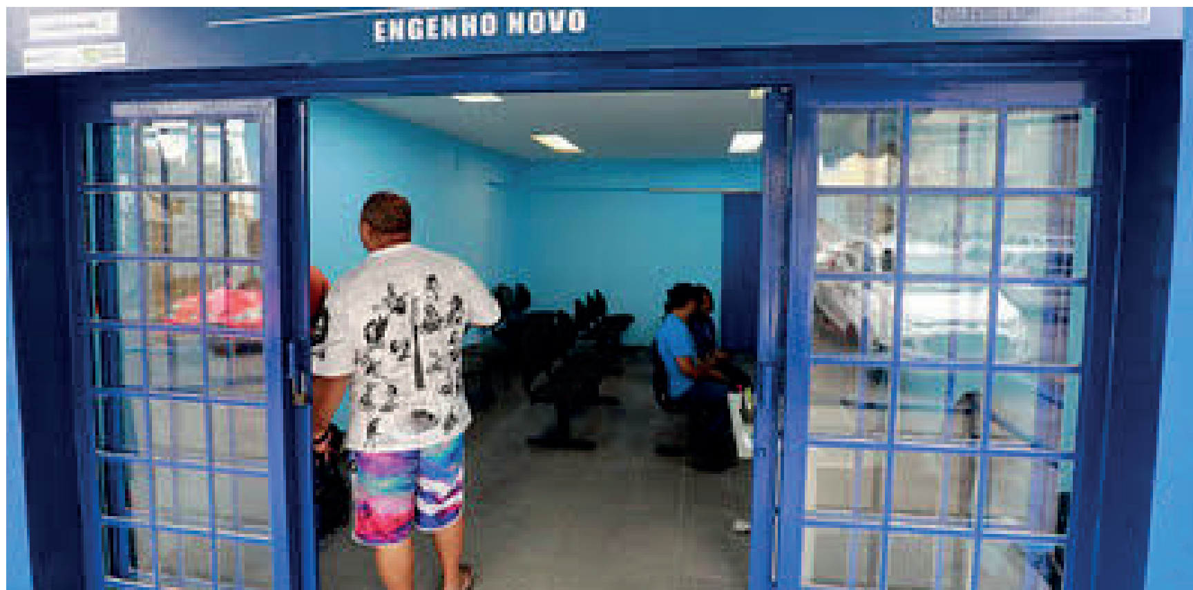
São aceitos estudantes de nível superior de várias áreas, com previsão de formatura entre dezembro de 2024 e dezembro de 2026

Os interessados devem preencher o formulário online e enviar o currículo para o e-mail trabalho.snte@gmail.com. Para as oportunidades destinadas aos trabalhadores com deficiência, é preciso enviar o currículo para o e-mail: vagaspcd.snte@gmail.com.