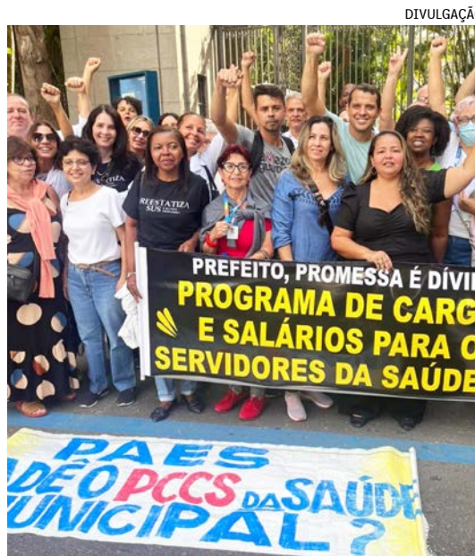
Categoria reivindica Plano de Cargos, carreira e salário dos profissionais da categoria e a implantação imediata do piso salarial

Além da nova sinalização do ponto cego, serão promovidas ações educativas com motociclistas sobre o assunto. Também serão promovidas atividades focadas na redução de acidentes voltadas para funcionários e lideranças das empresas de ônibus.