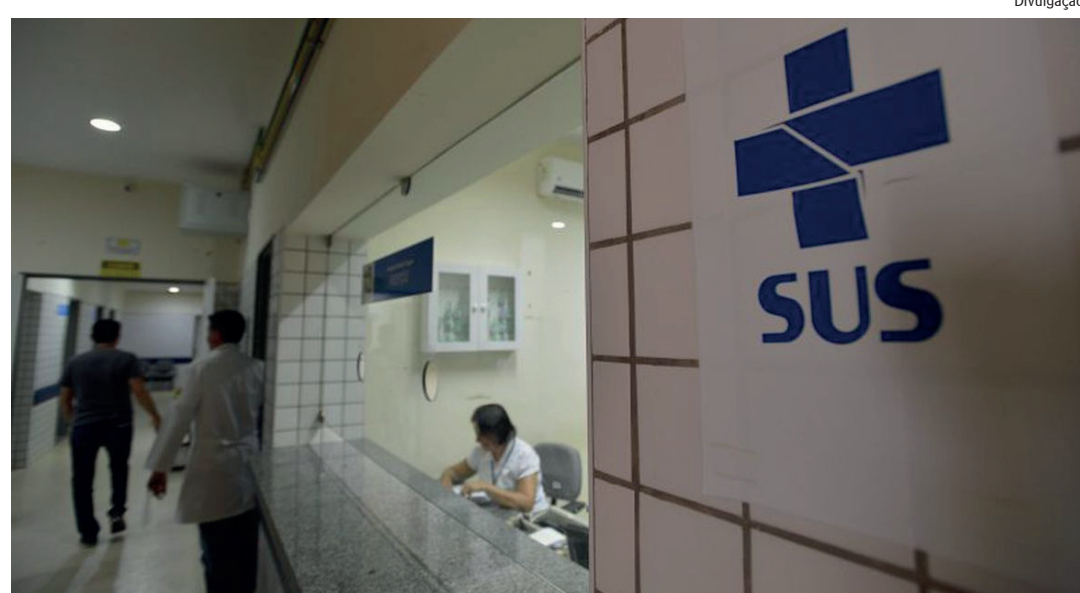
Houve redução do volume de cirurgias depois da pandemia de covid-19

Os números mostram que, entre 2012 e 2022, a rede pública realizou cerca de 86 mil transplantes de córnea