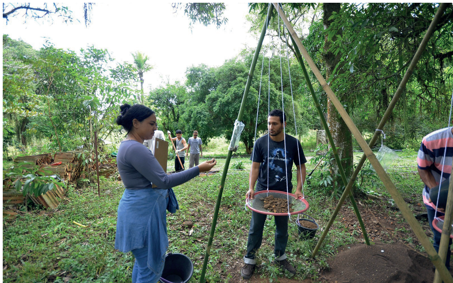
Em dois dias de trabalho já foram encontrados fragmentos de louças, garrafas, metais, vidros e cerâmicas

Ainda segundo ele, assim que a escavação for concluída na área da Câmara e Cadeia da antiga Vila de Iguassú, ela será iniciada em outros pontos, como o Porto da Praça do Comércio de Iguassú, Torre Sineira da antiga Igreja Matriz, cemitério de Nossa Senhora do Rosário dos Homens Pre-