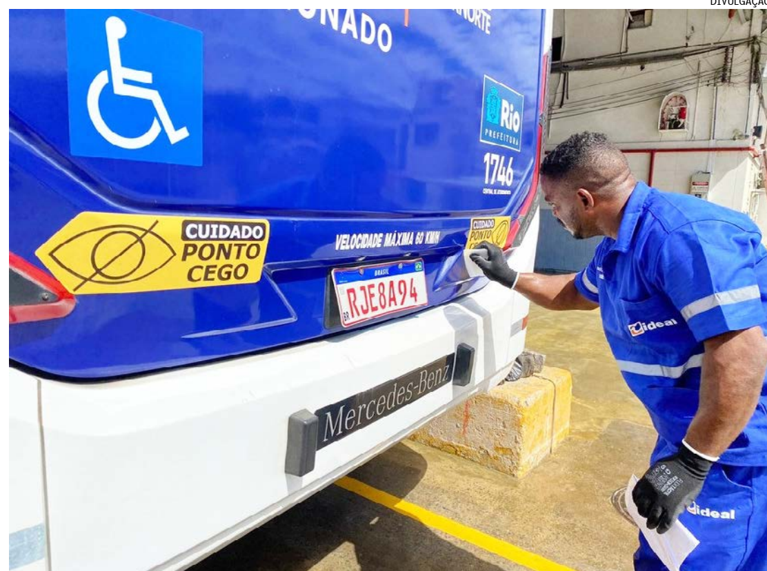
De acordo com o Sindicato das Empresas de Ônibus do Rio (Rio Ônibus), são registrados entre 10 e 12 acidentes entre motos e ônibus diariamente na cidade

Nos últimos dois anos, ainda segundo o Rio Ônibus, os casos aumentaram em 30% na cidade. Para tentar diminuir esses números, estão sendo instalados adesivos nas laterais e na traseira dos ônibus informando aos demais motoristas e, sobretudo, aos motociclistas sobre a existência dos pontos cegos. O aviso alerta para o fato de que, naquele ponto sinalizado, o motorista