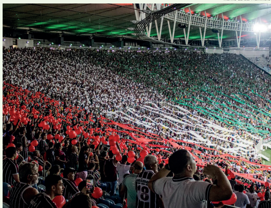
Jogo válido pela última rodada da fase de grupos será no dia 27 de junho, no Maracanã