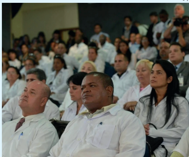
1.994 municípios brasileiros receberão profissionais

passarão a receber incentivos, proporcional ao valor da bolsa, pela permanência no programa e para atuarem em regiões de vulnerabilidade. Os médicos alocados nessas regiões, ao permanecerem por 48 meses no programa, poderão receber incentivo de R$ 120 mil – equi-