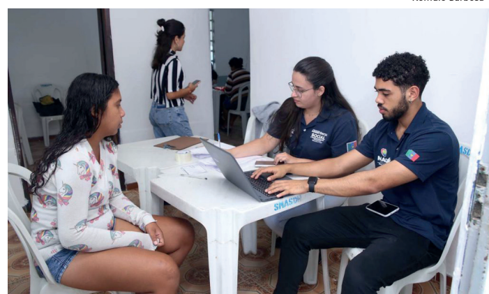
Mais de 60 pessoas se beneficiaram dos serviços