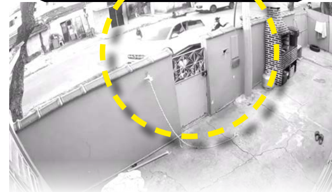
Imagens de câmeras de segurança registraram que ao menos três criminosos armados abordaram o agente na porta da sua casa