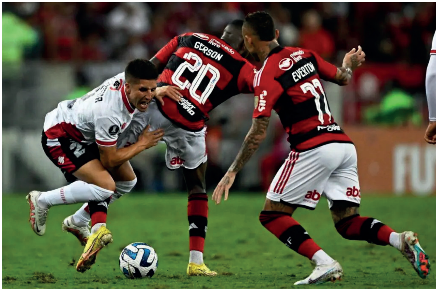
Flamengo enfrenta o Ñublense (CHI) nesta quarta-feira (23), no Chile

Flamengo e Ñublense acontecerá a partir das 21h30 (horário de Brasília) desta quarta-feira (24), no Estádio Municipal de Concepción, no Chile. No momento, o Mais Querido ocupa a segunda colocação do Grupo A, com quatro pontos conquistados. O líder é o Racing (ARG), que possui sete. Adversário da próxima rodada, o time chileno está na última posição, com três pontos.