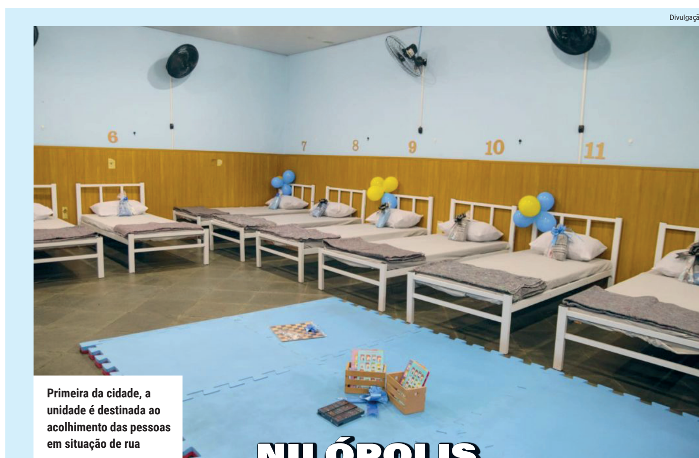
Primeira da cidade, a unidade é destinada ao acolhimento das pessoas em situação de rua