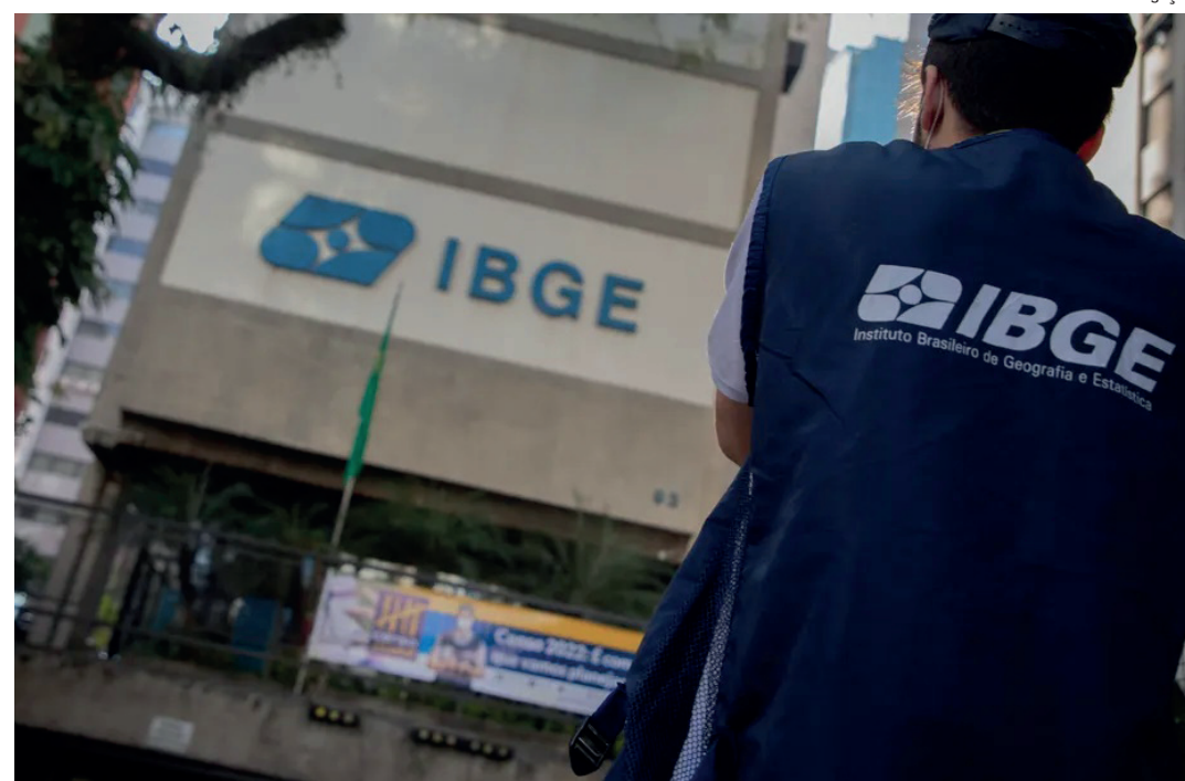
Oportunidades têm bolsa-auxílio que varia entre R$ 787,98 e R$ 1.125,69. Para participar, é preciso estar matriculado em instituição de ensino superior e cursar a partir do terceiro período

Ao finalizar a inscrição, o candidato estará apto a iniciar a prova on-line no site do CIEE. Nessa etapa, o candidato terá dois minutos para responder cada uma das 20 questões — cinco de Língua Portuguesa, de Mate-