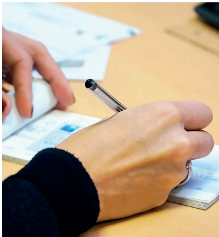
As vagas são para estudantes da graduação, sem limite de idade

sor da respectiva vaga. Após a aprovação na fase de entrevista, será iniciado o trâmite de contratação e a assinatura do Termo de Compromisso de Estágio.