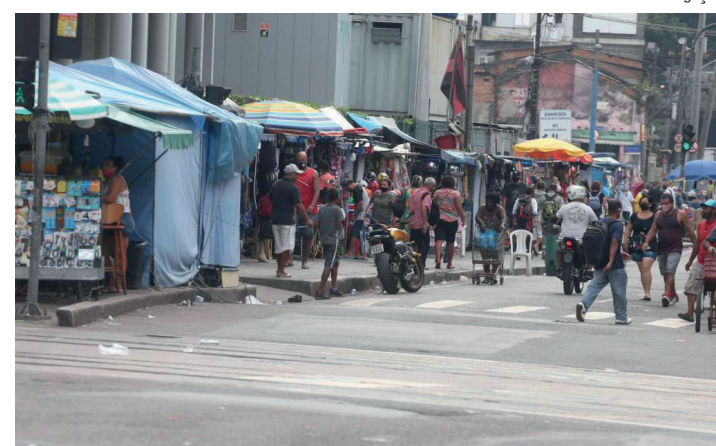
Workshops acontecerão na unidade Estácio Presidente Vargas, no Centro do Rio