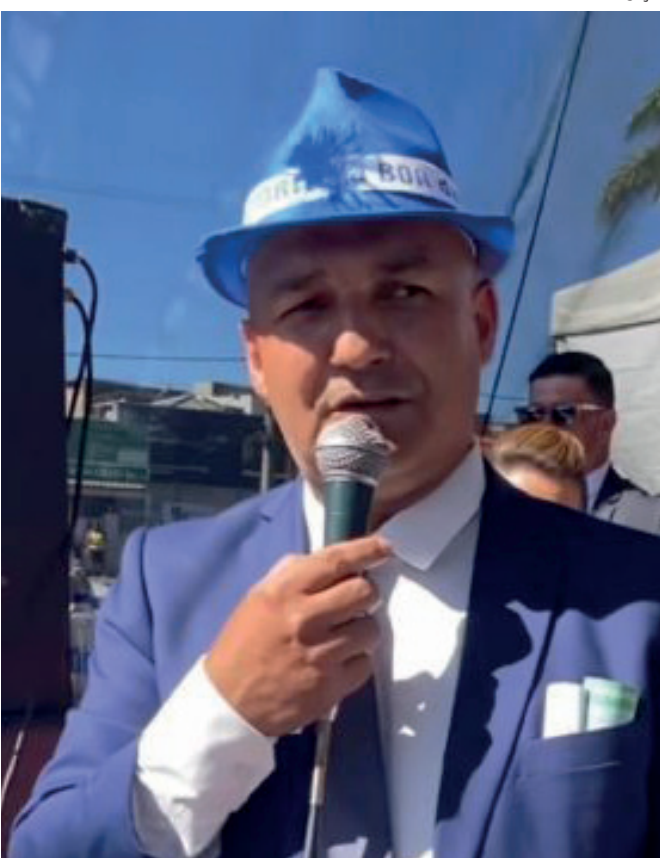
Instituições emitiram nota de repúdio