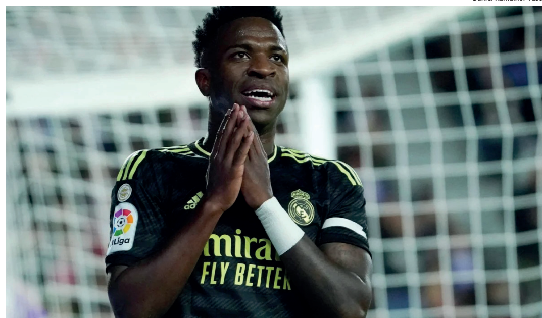
Javier Tebas afirmou que a liga espanhola combate com dureza os casos de racismo

4. Não podemos permitir que seja manchada a imagem de uma competição que é acima de tudo um símbolo de união entre os povos, onde mais de 200 jogadores negros em 42 clubes recebem diaria-