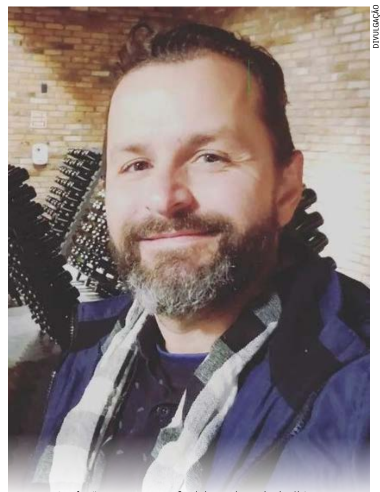
Confusão aconteceu no final da madrugada do último domingo durante uma roda de samba no Beco do rato, tradicional reduto negro da capital fluminense

"Pra votar no Lula não precisa ser petista, basta amar o Brasil". Em seguida, Fernando comentou: "Volta pra floresta, tartaruga".