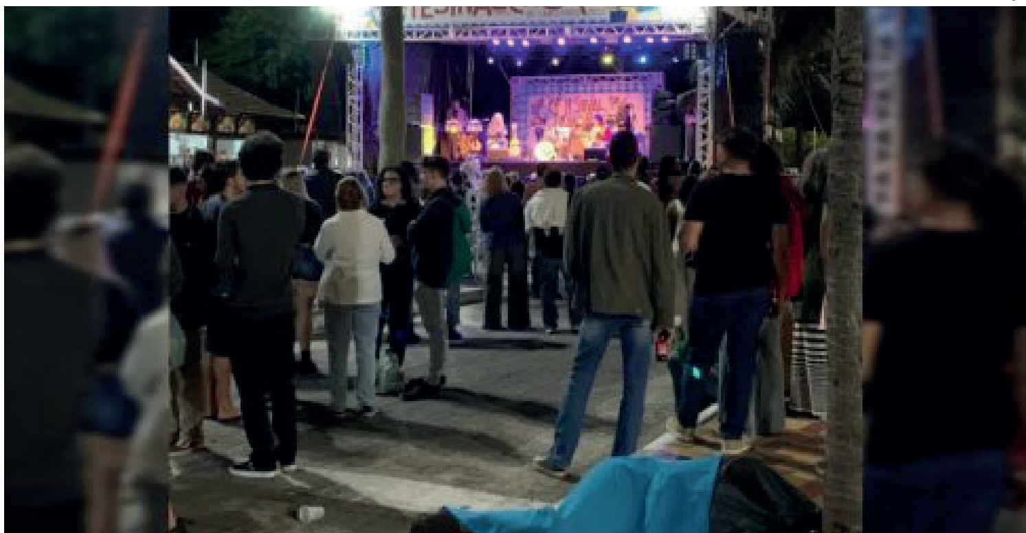
A prefeitura afirma que, entre janeiro e abril, o CREAS registrou 84 pessoas em situação de vulnerabilidade extrema

Entre 2021 e 2022, o Brasil registrou um aumento de aproximadamente 21% na população em situação de rua, saltando de 232 mil para 281 mil, segundo o Instituto de Pesquisa Econômica Aplicada (IPEA). Destes, 151 mil residem na região Sudeste. Na cidade de Cabo Frio, em 2023, o Centro de Referência de Assistência Social (CREAS) registrou, entre janeiro e abril, 84 pessoas em situação de vulnerabilidade extrema no município, o que representa 0,039% dos moradores. Contudo, quem atua para ajudar este público acredita que, na verdade, o número é muito maior.