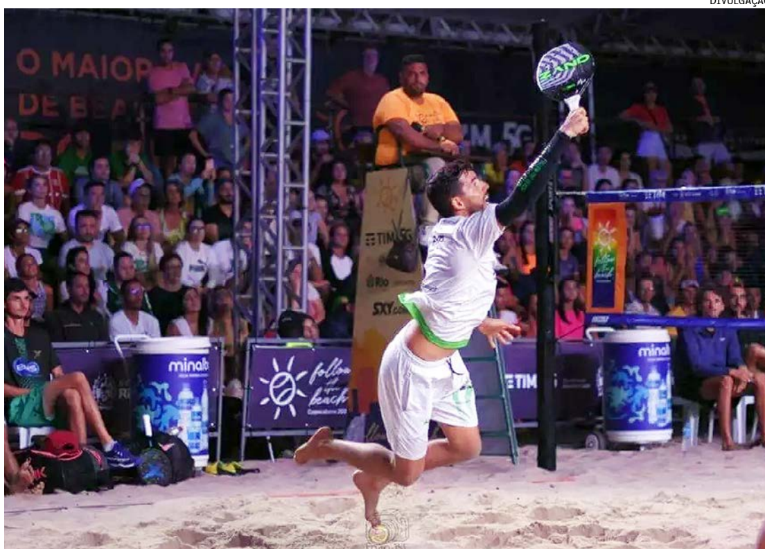
"Follow the Beach" chegou à sua 4ª edição; ao todo, foram mais de 2 mil inscritos, de 12 países

A premiação foi de R$ 400 mil, sendo R$ 100 mil para a Lopes Cup (time Mundo x time Europa) e o recorde de uma premiação de Simples com R$ 272 mil, sendo R$ 60