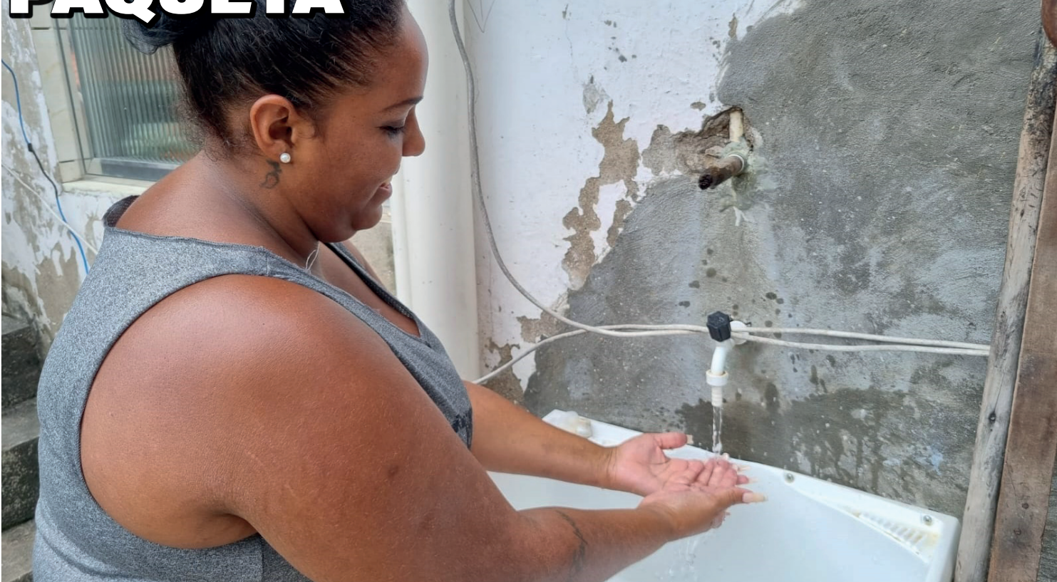
Moradora da ilha relata que durante anos ela e outras 17 famílias conviveram com água de poço e sem qualidade

no ponto de partida que abastece a região, garantindo maior controle operacional para possibilitar uma tomada de decisão rápida e assertiva caso ocorra algum problema na rede de distribuição. A revitalização da Estação Elevatória de Água Tratada foi outra ação importante na ilha, onde substituímos tubulações, trocamos sistemas