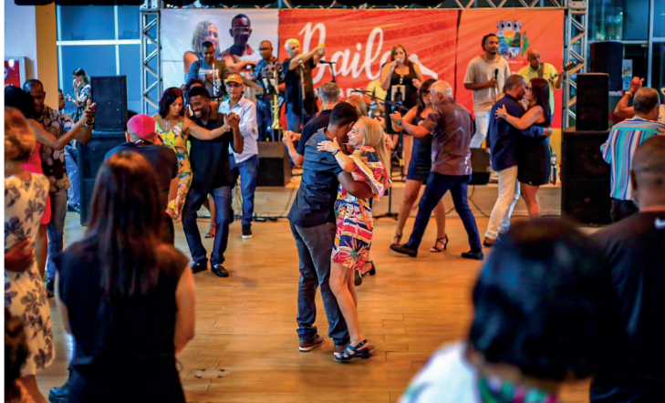
Baile, em comemoração ao Dia das Mães, contou com um bom número de adeptos da dança de salão