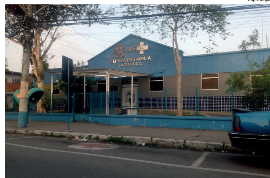
Com a reforma da unidade, atendimentos foram transferidos para um endereço provisório

Clínica da Família Dr. Jorge Campos - Funcionando na Igreja Batista Boas Novas - Rua Sergipe 746, na Coréia.