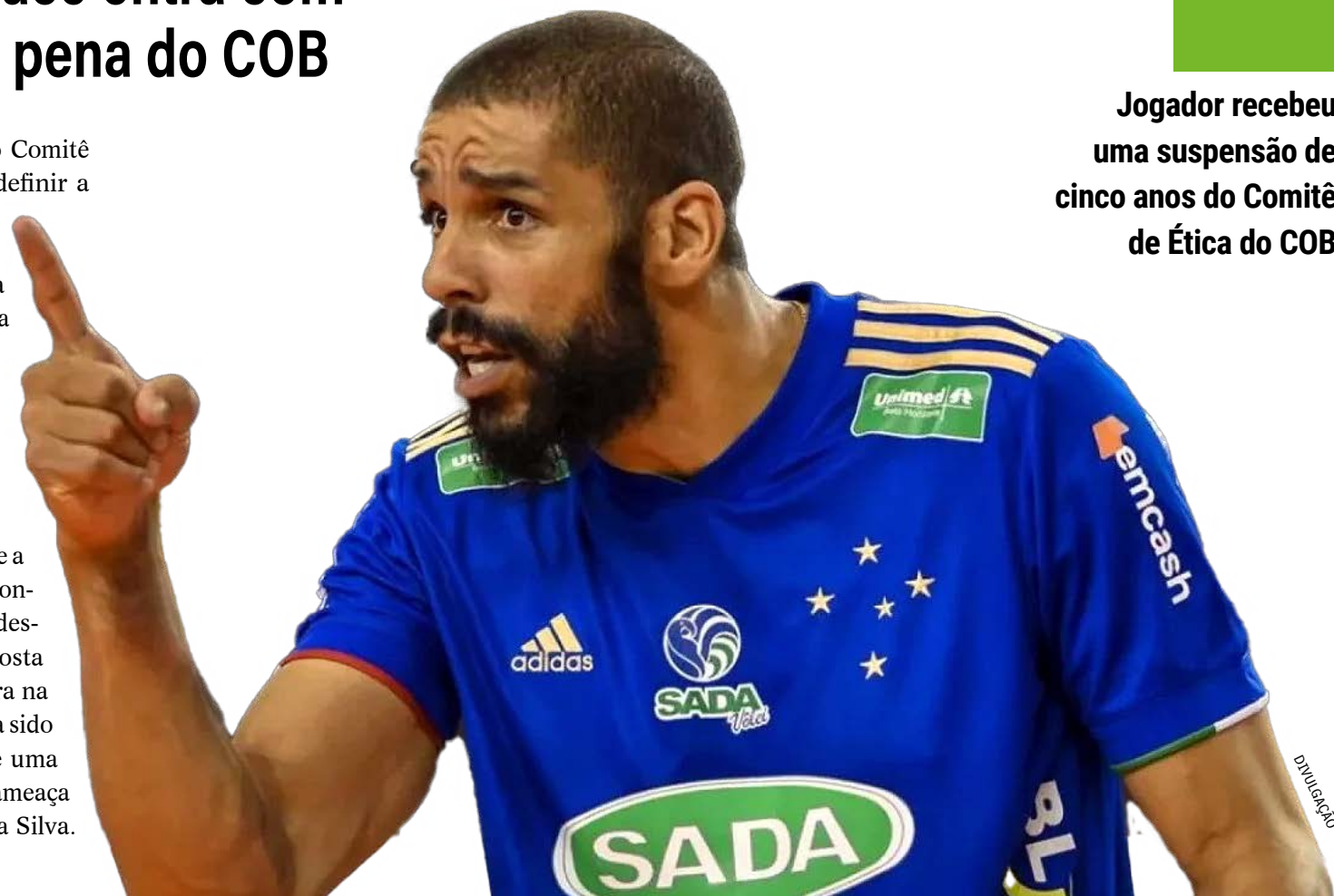
Jogador recebeu uma suspensão de cinco anos do Comitê de Ética do COB

A defesa do oposito acredita que a punição é descabida. Segundo o Conselho de Ética do COB, Wallace desrespeitou a primeira punição imposta pela entidade ao entrar em quadra na final da Superliga. O jogador havia sido punido por 90 dias por causa de uma postagem com uma enquete com ameaça ao presidente Luiz Inácio Lula da Silva.