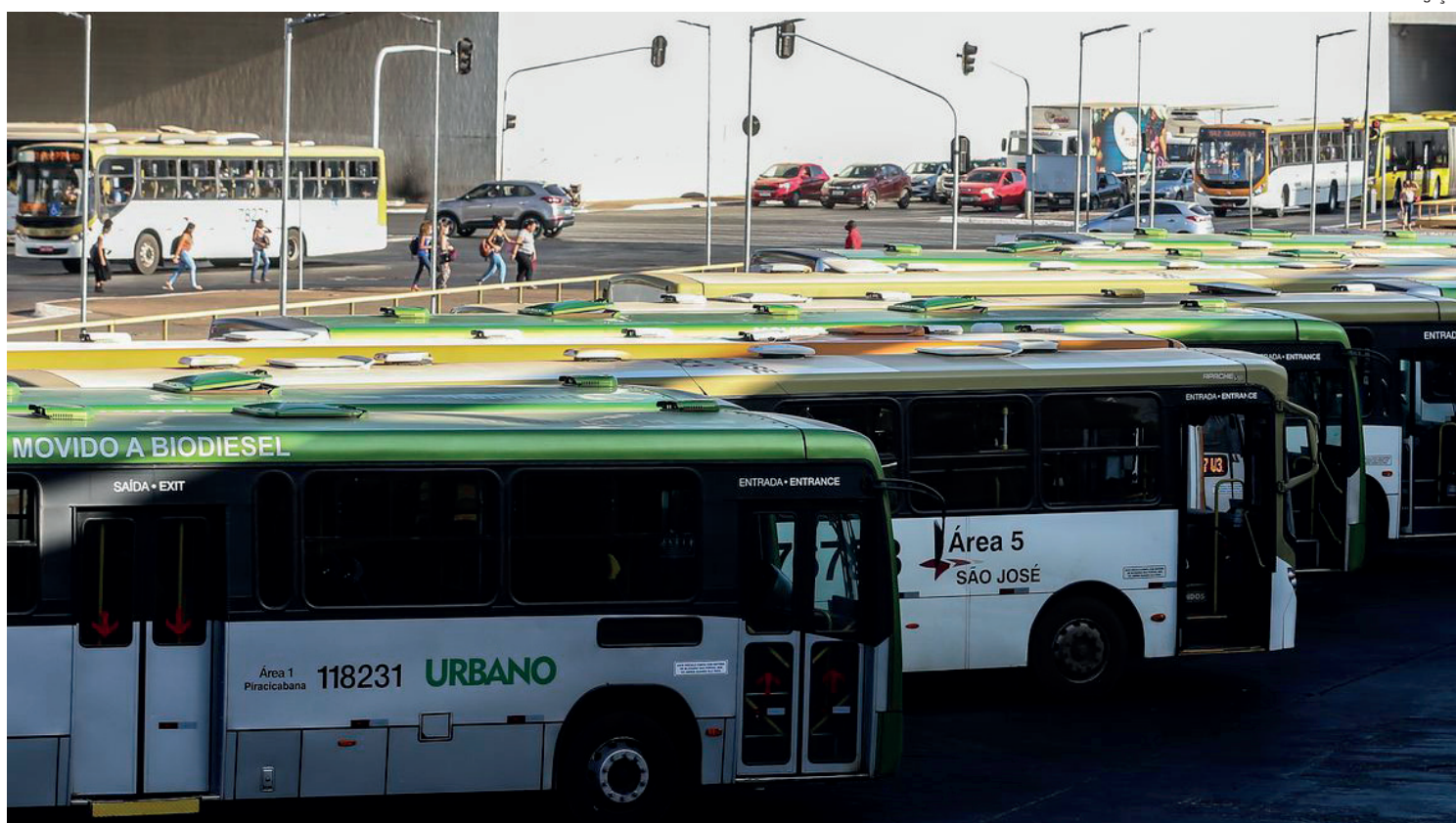
Desgaste com deslocamentos prejudica produtividade do trabalhador

As 15 regiões metropolitanas avaliadas são Brasília, São Paulo, Rio de Janeiro, Curitiba, Belo Horizonte, Goiânia, Belém, Fortaleza, Natal, Salvador, João Pessoa, Maceió, Porto