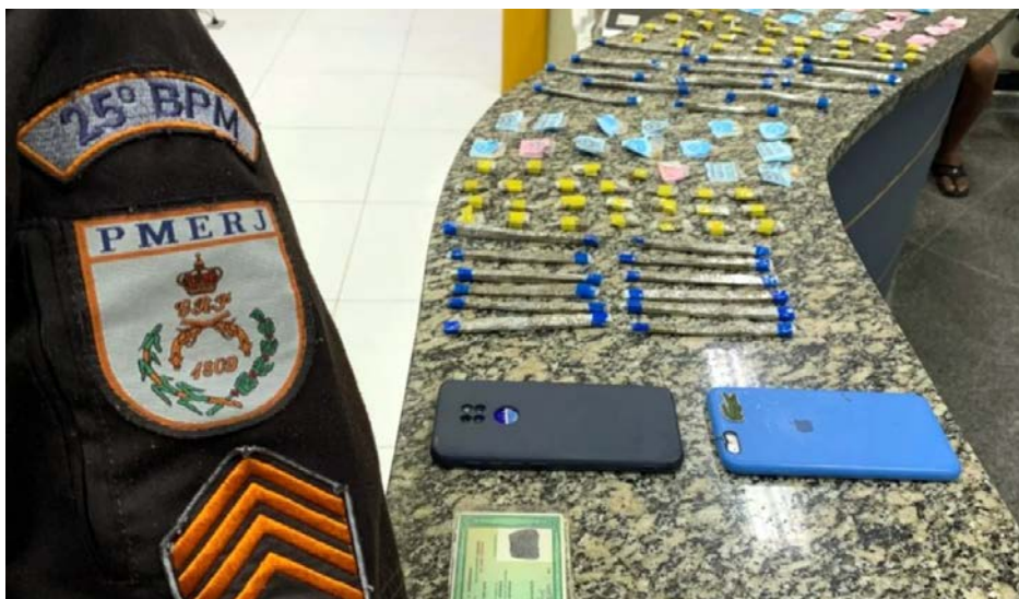
A ocorrência foi registrada na Rua Nossa Senhora das Graças, na Fazendinha, durante ação de patrulhamento

Ao todo, foram apreendidas 76 buchas de maconha, 38 pedras de crack, R$ 27 em espécie e dois aparelhos celulares.