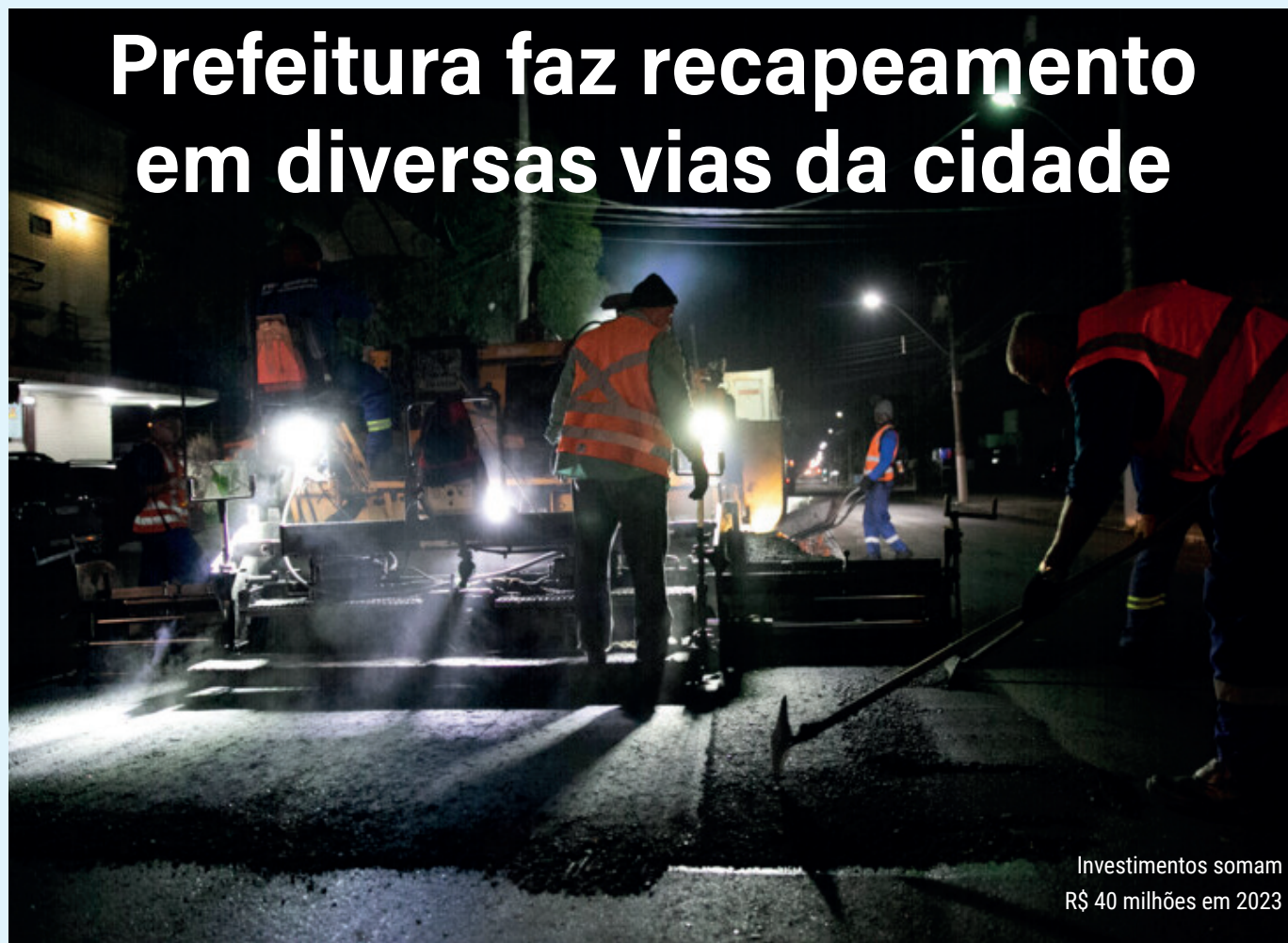
Investimentos somam R$ 40 milhões em 2023

A Prefeitura de Niterói segue recapeando vias em todas as regiões da cidade. Equipes da Diretoria de Pavimentação e Reparos (DPR) da Empresa Municipal de Moradia, Urbanização e Saneamento (Emusa) iniciaram, esta semana, melhorias na Avenida Central, em Itaipu, Região Oceânica, no trecho entre a rotatória do Engenho do Mato e a do Posto Monza.