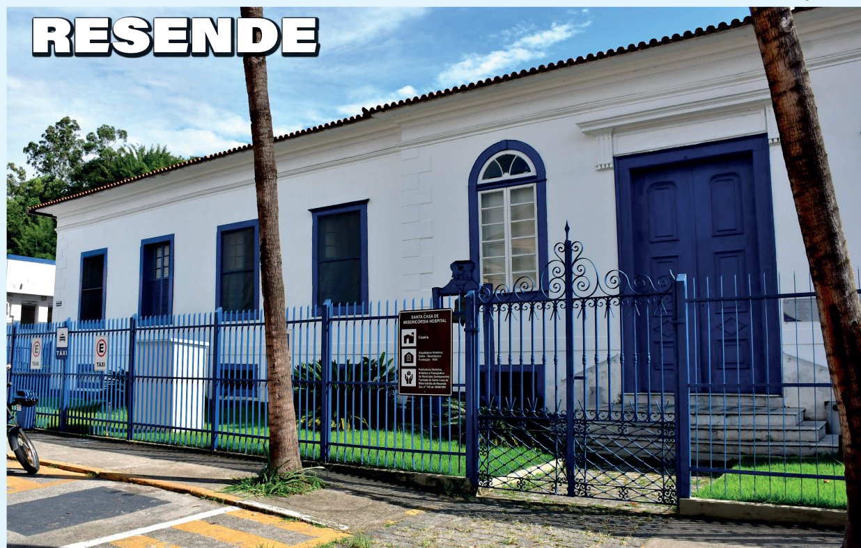
Evento de abertura aconteceu nesta sexta-feira