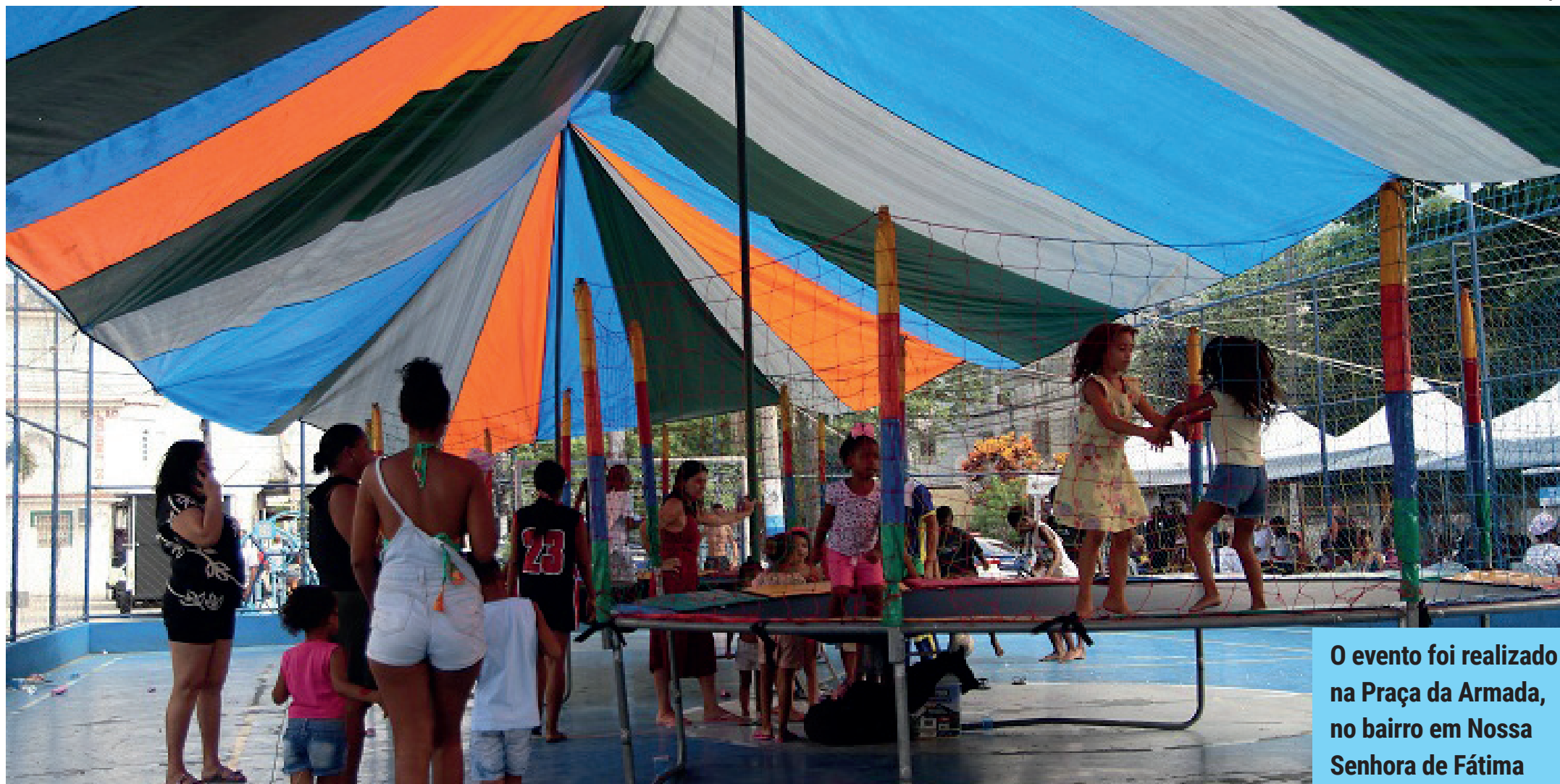
O evento foi realizado na Praça da Armada, no bairro em Nossa Senhora de Fátima