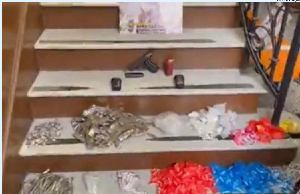
PMs apreenderam uma pistola, um carregador, uma granada, dois radiotransmissores e drogas

Os presos e o material apreendido foram levados para a 9ª DP (Catete), onde o caso foi registrado.