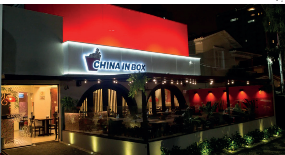
Ao todo são 36 vagas

de um objetivo maior, que é incluir um número — acima da cota instituída pelo governo — de pessoas com deficiência em todo o Grupo. Para mais informações, acesse os links: https://grupotrigo.gupy.io/ (Grupo Trigo - Escritório, Fábrica e banco de talentos) e https://gurume.gupy.io/ (Gurumê).