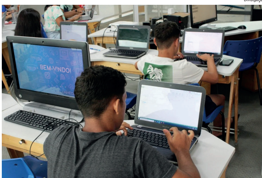
São 500 vagas em capacitações voltadas para a inserção dos alunos no mercado de trabalho

Já o curso de instalador de sistemas fotovoltaicos começa em 19 de junho, com aulas de 8h às 12h, turma de 25 alunos, carga horária 180 horas, na unidade Senai Tijuca. O interes-