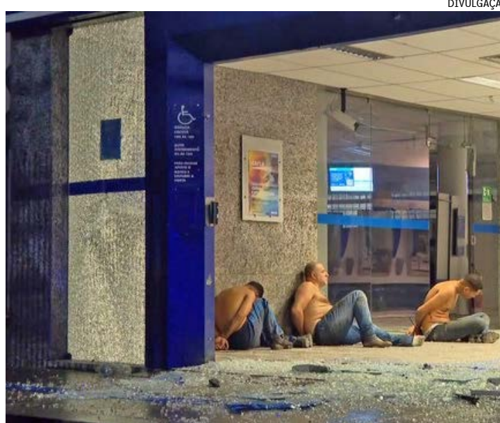
Polícia frustra tentativa de assalto a banco na Ilha do Governador e 11 são presos após tiroteio e explosão