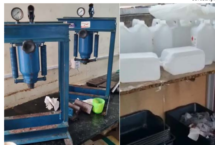
Além disso, um galpão de desmanche de carros também foi localizado. Na ação em conjunto com a PM, oito pessoas foram presas e mais de 50 veículos foram apreendidos

Durante a operação, moradores relataram tiroteio na região desde as primeiras horas do dia. Devido ao confronto, a Secretaria Municipal de Educação informou que 27 unidades escolares foram fechadas, afetando cerca de 9.119 alunos. Já a Secretaria Municipal de Saúde relatou que as Clínicas da Família Augusto Boal e Jeremias Moraes da Silva, acionaram o protocolo de acesso mais seguro e, para segurança de profissionais e usuários, também interromperam o funcionamento.