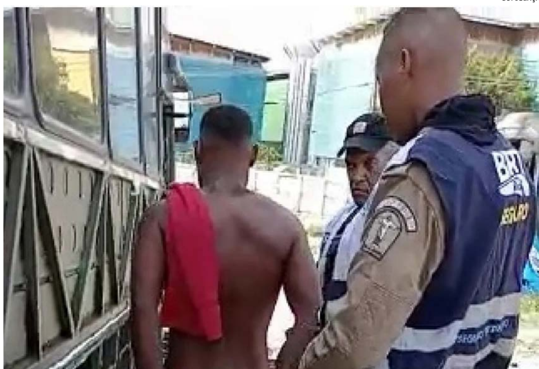
As peças furtadas foram encontradas no local junto com os homens e a ocorrência foi encaminhada para a 35ª DP em Campo Grande

Jennifer foi encaminhada à Cidade de Polícia e, posteriormente, ao sistema prisional. Ela está à disposição da Justiça.