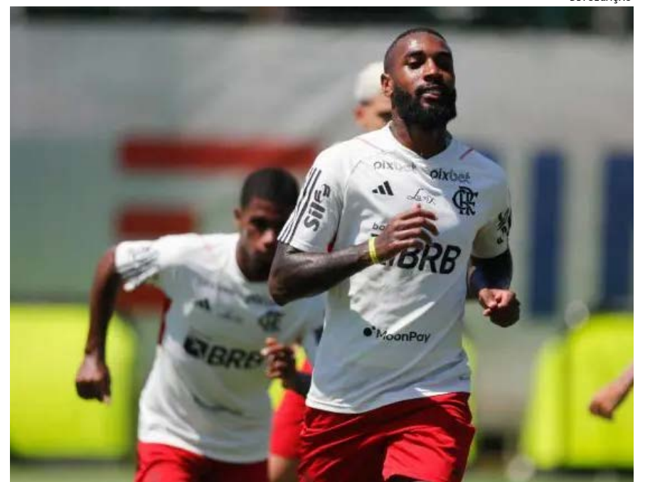
O camisa 20 está sendo preparado pela comissão técnica para ficar à disposição de Jorge Sampaoli no Fla x Flu