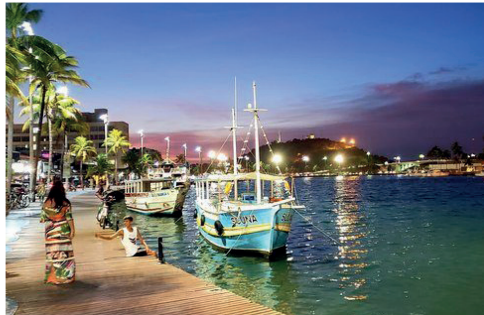
Evento com grandes nomes da música instrumental brasileira será realizado no Boulevard Canal até domingo (14), a partir das 18h

O evento é gratuito e aberto a toda a família. Além de reunir os amantes do gênero, o festival é uma oportunidade para conhecer mais um pouco do primeiro estilo musical urbano tipicamente brasileiro e prestigiar o trabalho de grandes músicos e cantores, vários deles de renome nacional.