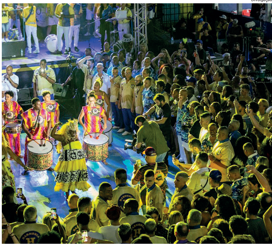
O evento será transmitido pela FitaAmarela a partir das 20h