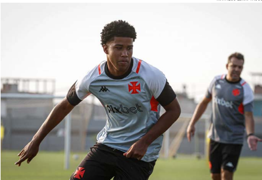
Jovem não vai enfrentar o Santos neste domingo