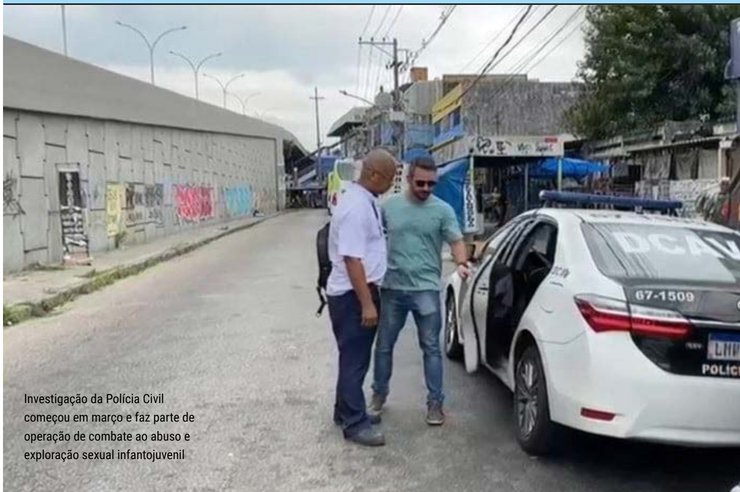
Investigação da Polícia Civil começou em março e faz parte de operação de combate ao abuso e exploração sexual infantojuvenil