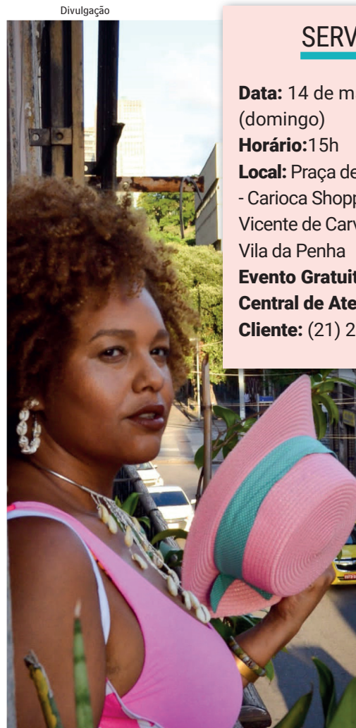
Evento gratuito faz parte do projeto Música na Praça

Para curtir os shows, as ótimas pedidas são as deliciosas opções dos restaurantes da praça de alimentação, como o Come Kéto, Tempero Mania, Sancho, Billy The Grill e Sass Grill, que oferecem diversas sugestões para compartilhar.