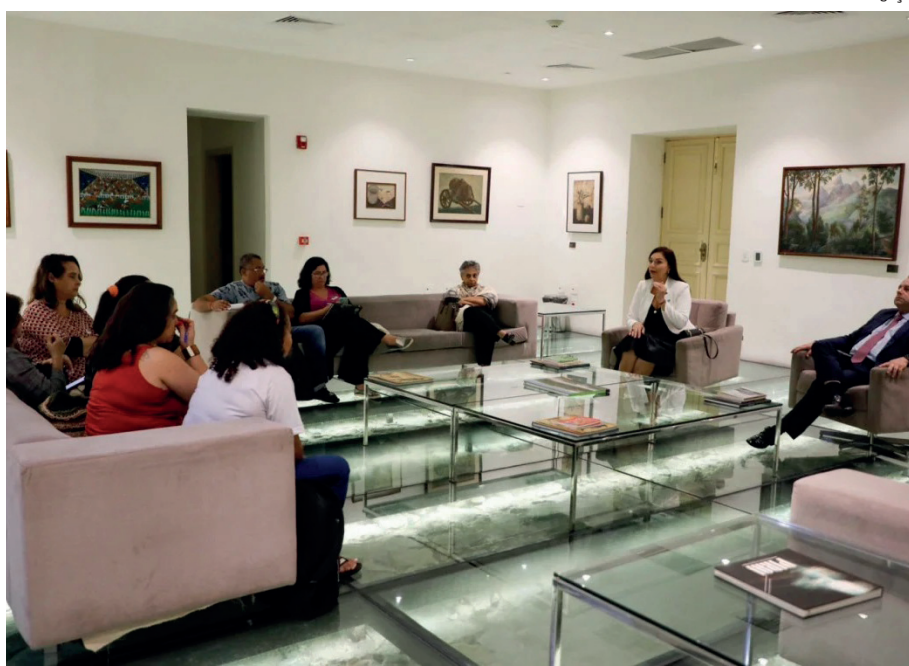
Proposta vai contemplar servidores ativos e inativos