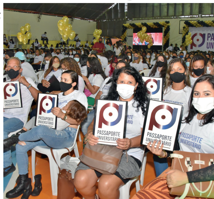
Vítima foi encaminhada para o Hospital Conde Modesto Leal