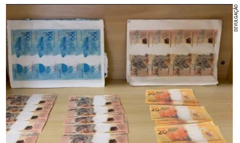
O suspeito foi abordado enquanto recebia uma encomenda no centro de distribuição dos Correios

A Polícia Federal prendeu em flagrante um homem de 27 anos com notas falsas em Macaé, no Norte Fluminense. O suspeito foi abordado enquanto recebia uma encomenda no centro de distribuição dos Correios, localizado no bairro São José do Barreto, na mesma cidade. O pacote apreendido continha 26 notas falsas de R$ 20 e dez de R$ 50, além de 12 páginas contendo cédulas de R$ 50 e R$ 100, totalizando um montante de R$ 5.820. A ação teve início a partir de informações da Unidade Especial de Repressão à Falsificação de Moeda da Polícia Federal, além do auxílio dos Correios. O homem será indiciado pelo crime de moeda falsa, em que a pena pode chegar até 12 anos de reclusão.