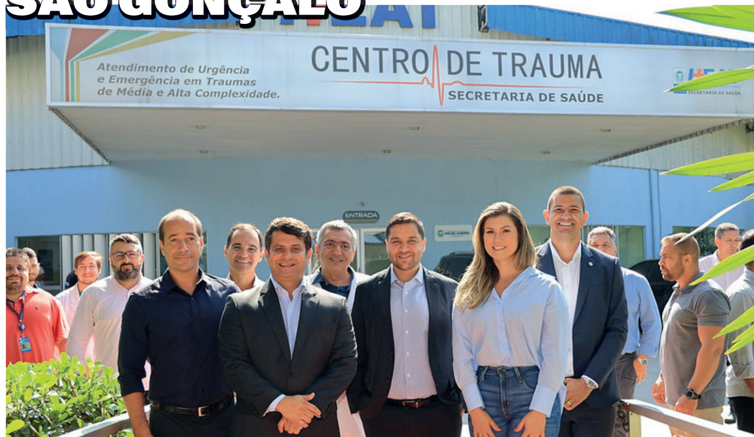
Hospital passa a ter um atendimento exclusivo e mais humanizado para as crianças