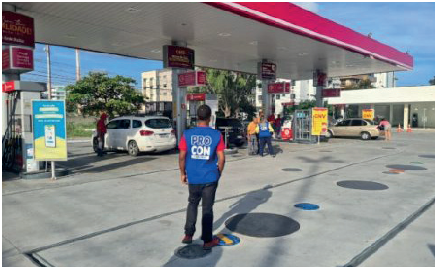
Pesquisa comparativa foi realizada no 1º e 2º distritos