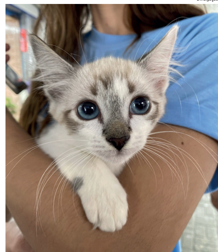
Os pets foram entregues vermifugados aos novos tutores