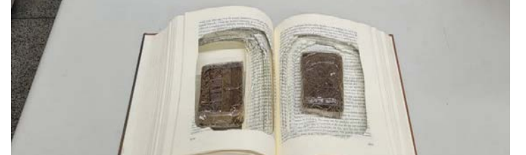
Material vinha da Espanha e tinha como destino o Rio