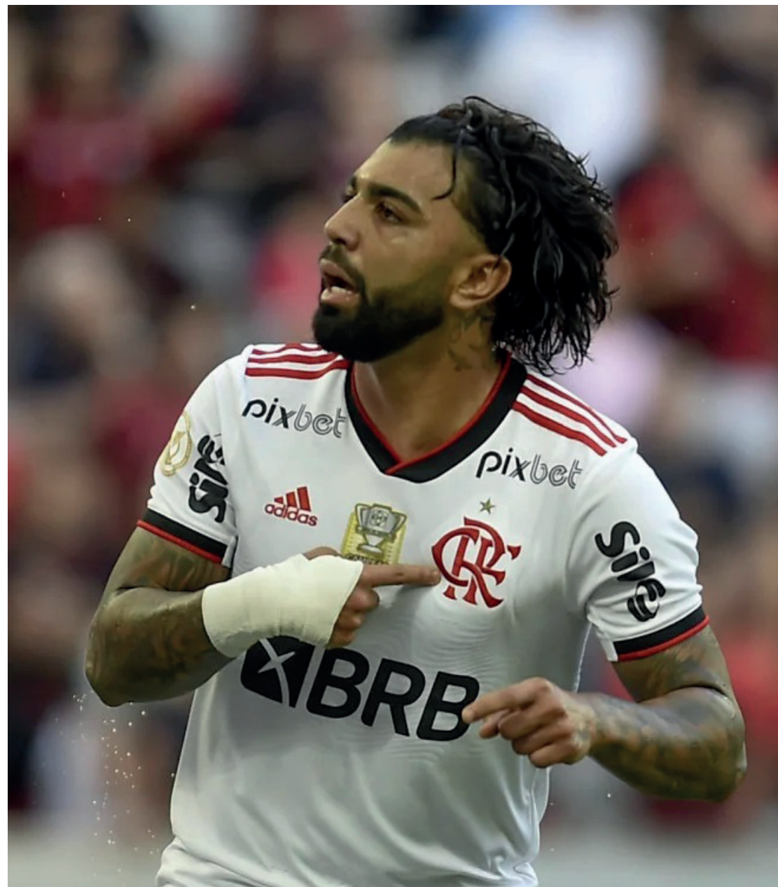
Última vez do Rubro-Negro na degola foi na 6ª rodada da última edição

Precisando virar a chave por bons resultados em meio à crise e protestos de torcedores, o Flamengo volta a campo na próxima quarta-feira (10), às 20h, no Maracanã, contra o Goiás.