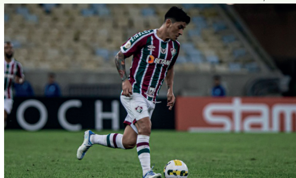
Tricolor carioca tem 7 pontos e ocupa o sexto lugar na tabela