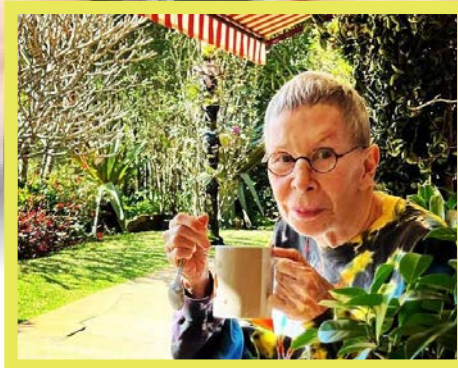
Rita Lee morreu aos 75 anos

L uto na música brasileira. A cantora e rainha do rock brasileiro Rita Lee morreu aos 75 anos, em São Paulo, na noite desta segunda-feira (8).