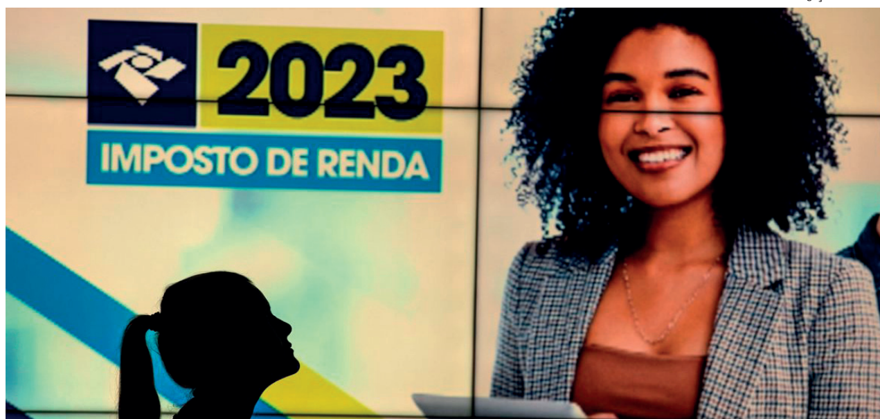
Primeiro lote será pago no dia 31 de maio. No total, são cinco lotes

Os outros lotes de restituição serão pagos nos seguintes dias: segundo lote (30 de junho), terceiro lote (31 de julho), quarto lote (31 de agosto) e quinto e último lote (29 de setembro).