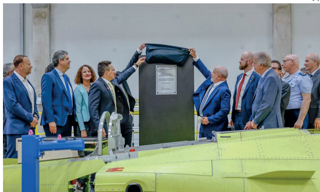
Ministro participou da inauguração da linha de produção da aeronave

“Muito mais do que uma evolução nos meios de defesa aérea, o advento do caça Gripen permite ao país um aumento significativo de sua capacidade operativa, de aquisição de alvos, de eficiência, podendo atuar ao longo alcance em conjunto com outras estrelas da Embraer, o KC-390, por meio da capacidade de reabastecimento em voo”, explicou.