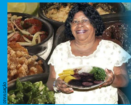
Teatro Rival recebe a Feijoada da Tia Surica CULTURA, P9