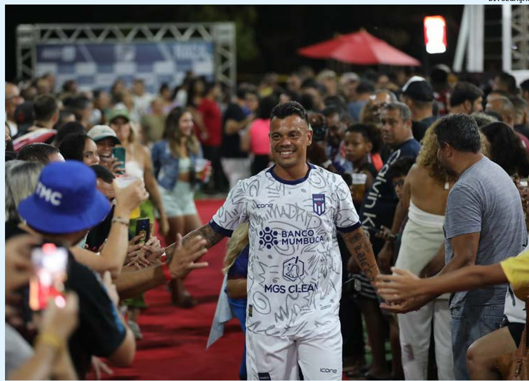
Cerimônia reuniu centenas de pessoas e encerrou o Espaço Gourmet, na orla de Araçatiba

Paralelo ao lançamento do novo manto, a Prefeitura de Maricá encerrou neste domingo (07/05) o Espaço Goumert, montado na orla de Araçatiba, e que ofere-