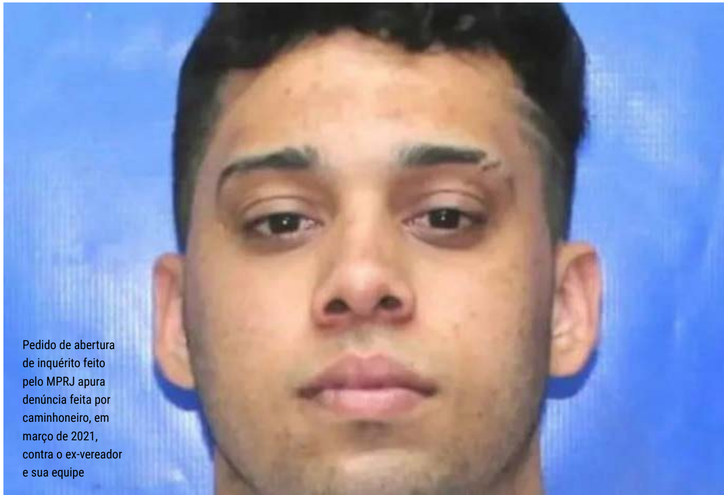
Pedido de abertura de inquérito feito pelo MPRJ apura denúncia feita por caminhoneiro, em março de 2021, contra o ex-vereador e sua equipe