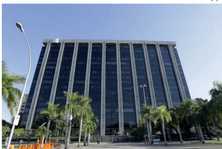
Inscrições devem ser feitas entre 9 de maio e 12 de junho, pela internet. Custo é de R$125

Continua obrigado a apresentar declaração quem teve ganho de capital na alienação de bens ou direitos sujeitos à incidência do imposto, bem como aqueles que, no dia 31 de dezembro de 2022, eram proprietários de bens ou direitos, inclusive terra nua, acima de R$ 300 mil; e pessoas que, na atividade rural, receberam rendimentos tributáveis com valor acima de R$ 142.798,50.