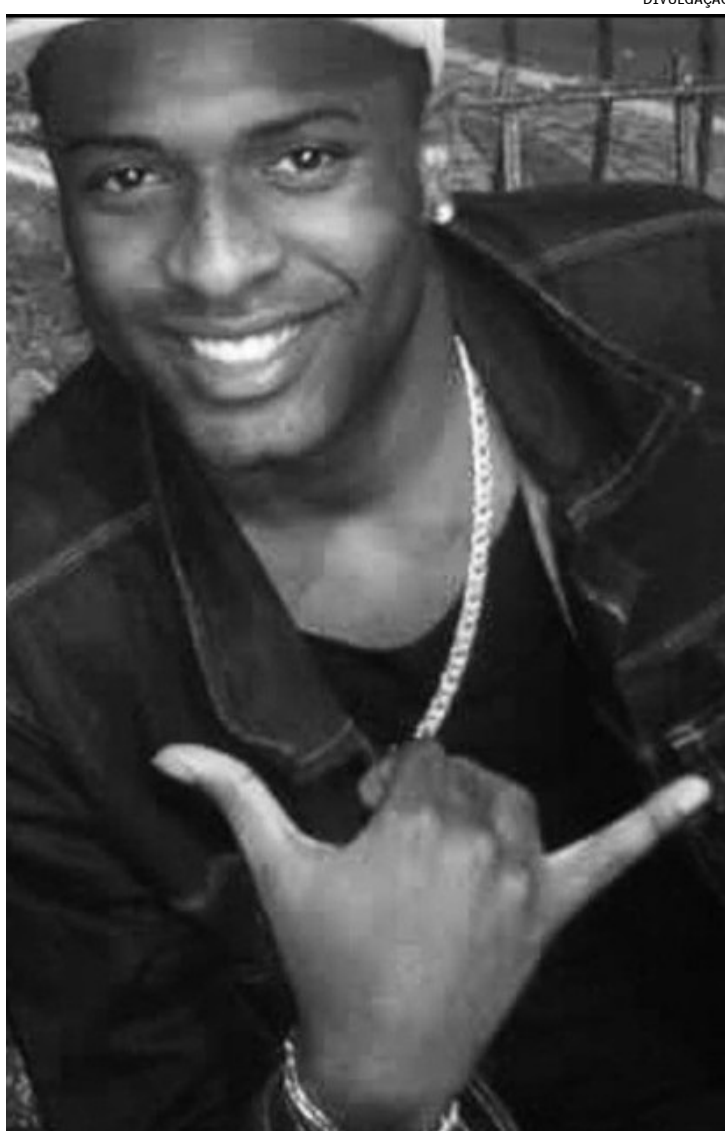
O caso aconteceu em Guapimirim e está sendo investigado pela Delegacia de Homicídios da Baixada Fluminense (DHBf)