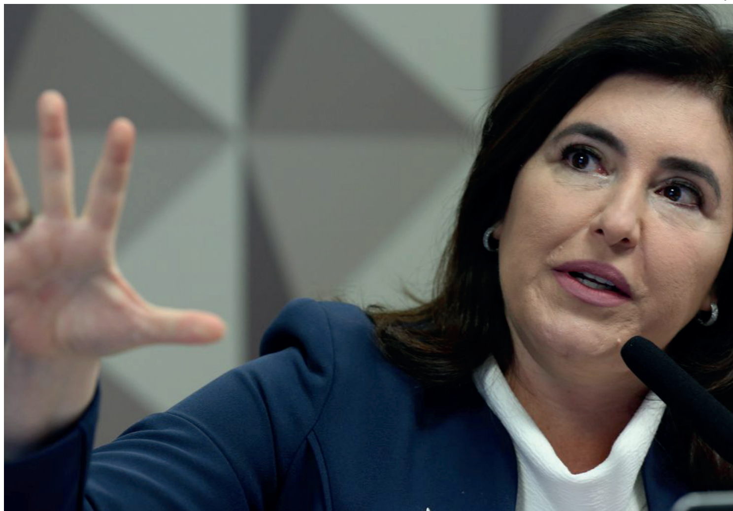
Estimativa para este ano é taxa de 5,3%

Segundo Tebet, o PPA, que está sendo preparado, “será amplamente participativo, conforme determinação do presidente Lula e de organismos internacionais. Será o PPA mais participativo da história”, disse a ministra ao se referir ao PPA Participativo, iniciativa por meio da qual cidadãos, integrantes de conselhos nacionais e entidades da sociedade civil,