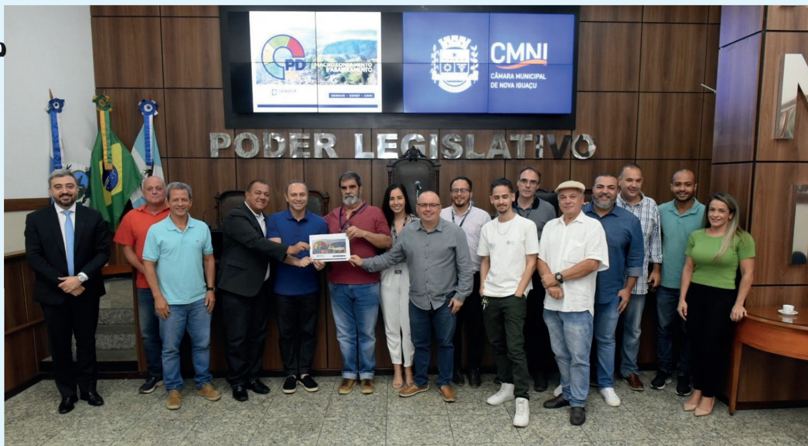
O material apresentado pelo Executivo foi entregue aos vereadores para uma primeira análise

Aconteceu na manhã desta quinta-feira (04/05), na Câmara Municipal de Nova Iguaçu, reunião técnica dos vereadores e assessorias com os servidores das Secretarias municipais de Economia e Fazenda e de Desenvolvimento Urbano. Na pauta do encontro a elaboração do Plano Diretor, lei municipal que orienta o crescimento e o desenvolvimento urbano de todo o município.