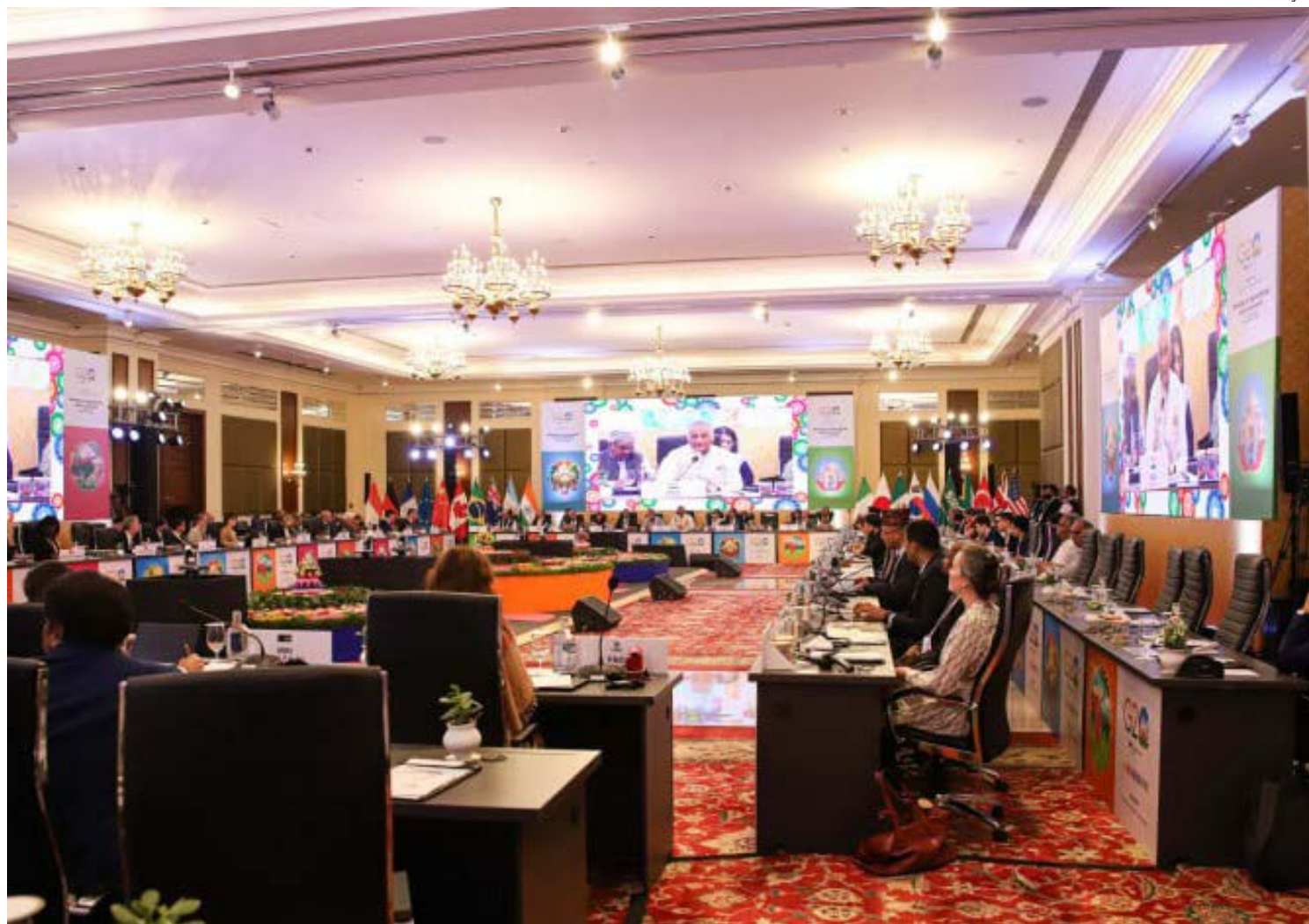
Este ano o encontro aconteceu na Índia

Além do Brasil e Índia, a cúpula é formada por: Argentina, Austrália, Canadá, China, França, Alemanha, Indonésia, Itália, Japão, México, Coreia do Sul, Rússia, Arábia Saudita, África do Sul, Turquia, Reino Unido, Estados Unidos e União Europeia.