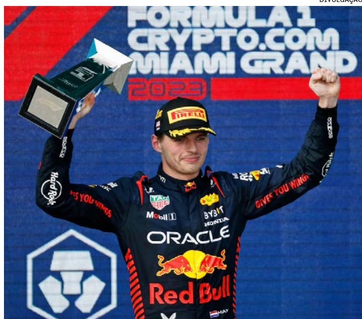
Holandês largou do nono lugar e superou o companheiro de equipe Sérgio Pérez nas últimas voltas

WTA 1000 de Roma. “Daqui algumas horinhas já tenho o voo para a Itália, essa é a vida de tenista. Amanhã começa tudo de novo e agora é trabalhar duro”, finalizou. A chave de simples do torneio italiano já foi sorteada, e a brasileira aguarda a vencedora do duelo entre a chinesa Lin Zhu, 39ª do mundo, e a tcheca Linda Fruhvirtova, a 58ª do ranking, para a sua estreia.