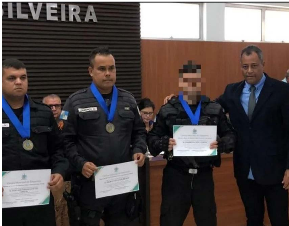
Jovem de 18 anos teria sido abordada antes pelos policiais por suspeita de estar com drogas