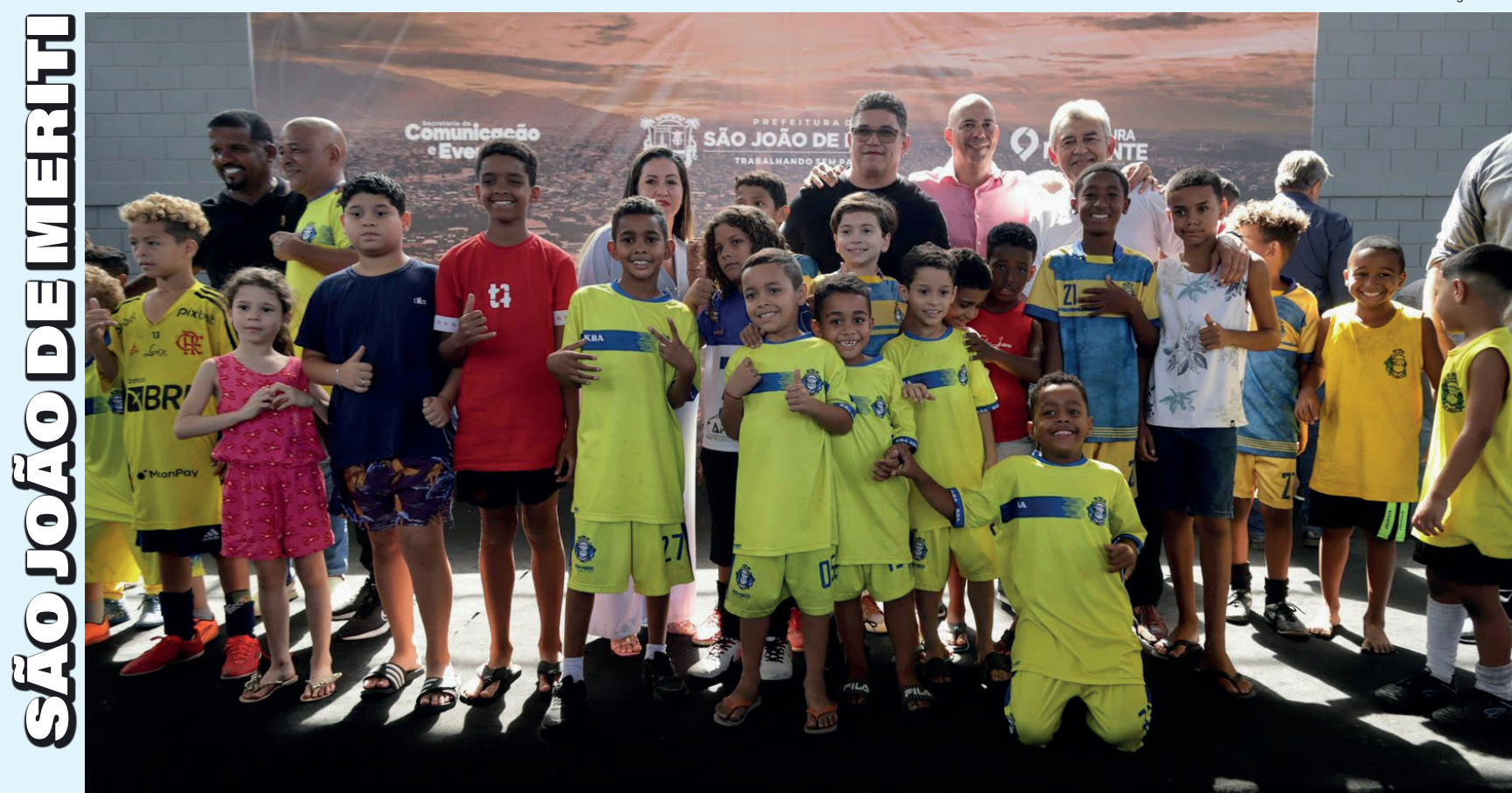
Toda a estrutura da quadra, que agora tem acessibilidade, passou por uma reforma completa

Na última quarta-feira, dia 26, a Prefeitura de São João de Meriti entregou à população a Quadra Poliesportiva Municipal Humberto Tozzi, em Coelho da Rocha.