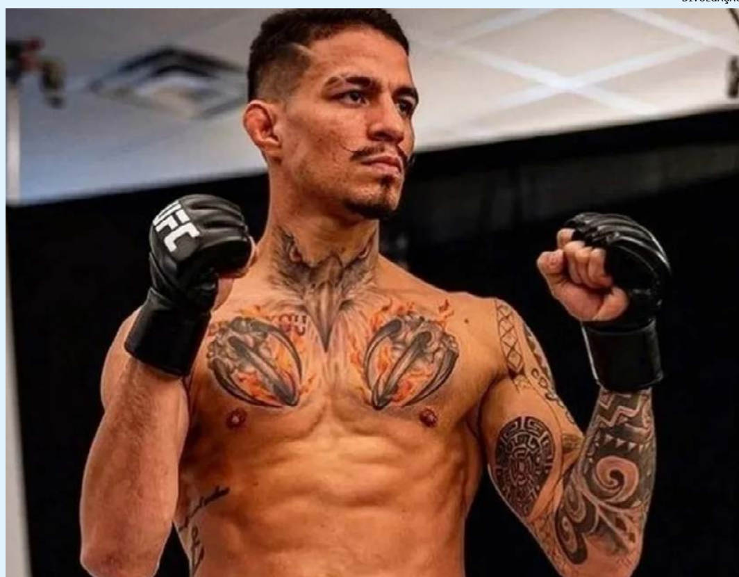
Atleta de MMA, de 29 anos, foi atingido em Guaratiba, na Zona Oeste