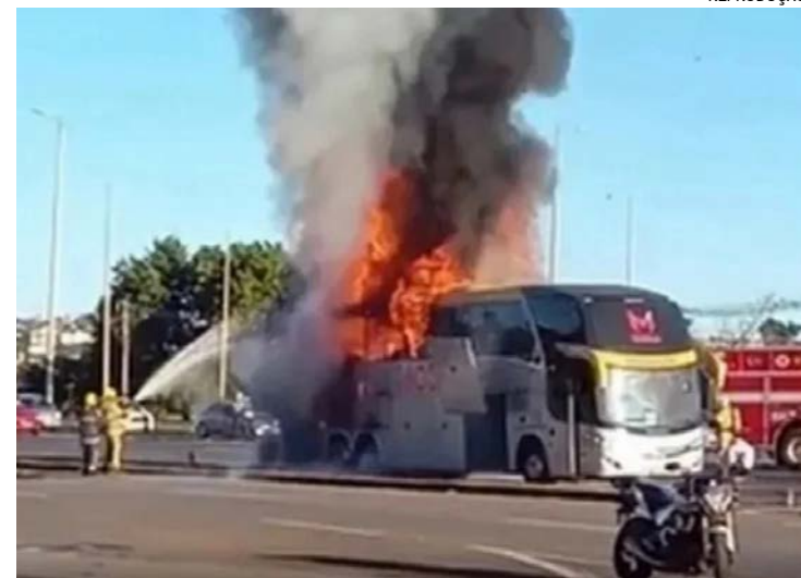
Delegação retornava ao Tocantins após vitória pela Série A3 do Campeonato Brasileiro