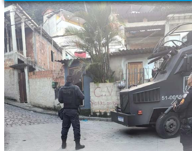
De acordo com a PM, agentes do 31º BPM (Recreio dos Bandeirantes) foram atacados a tiros durante um patrulhamento nos acessos à comunidade