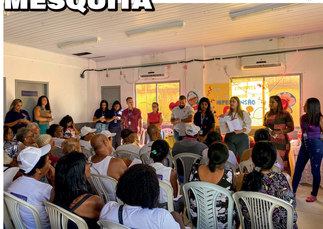
Evento aconteceu no Centro Municipal de Longevidade, na Chatuba, na última terça-feira, dia 25 de abril