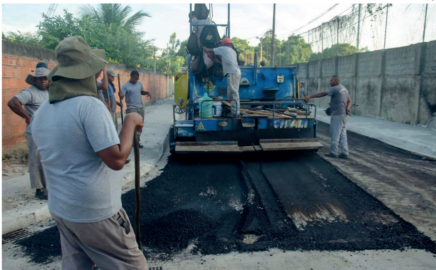
Mais quatro ruas do bairro foram beneficiadas