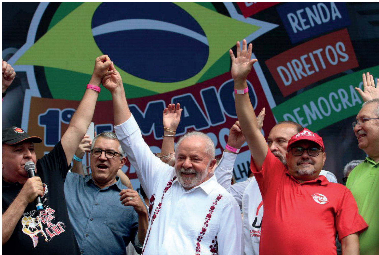
Anúncio foi feito por Lula durante ato do Dia do Trabalhador

O chefe do Poder Executivo concluiu o discurso com uma mensagem sobre