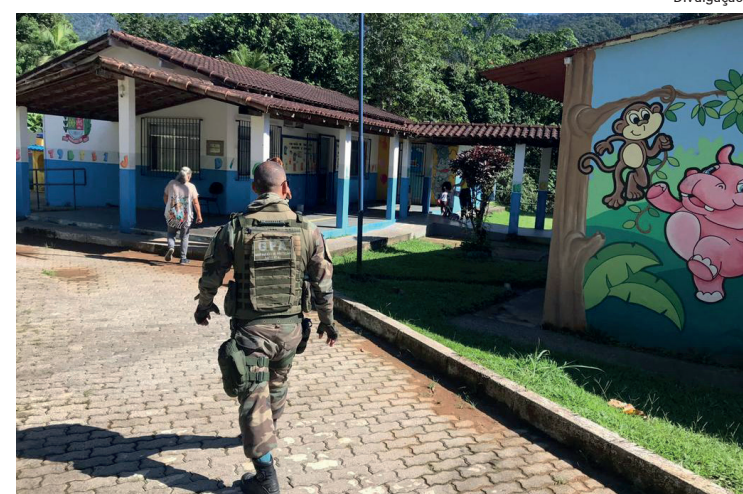
O patrulhamento foi intensificado para a proteção dos estudantes e funcionários