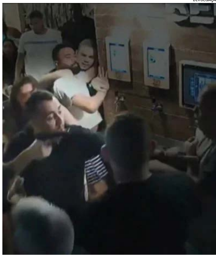
Imagens inéditas obtidas pelos investigadores podem esclarecer crime ocorrido em janeiro do ano passado

Os vídeos das câmeras de segurança, exibidos pelo RJTV nesta terça-feira (25), foram entregues pela dona do bar à Polícia Civil em fevereiro deste ano. Os investigadores acreditam que outras imagens da área interna e externa do estabelecimento podem esclarecer