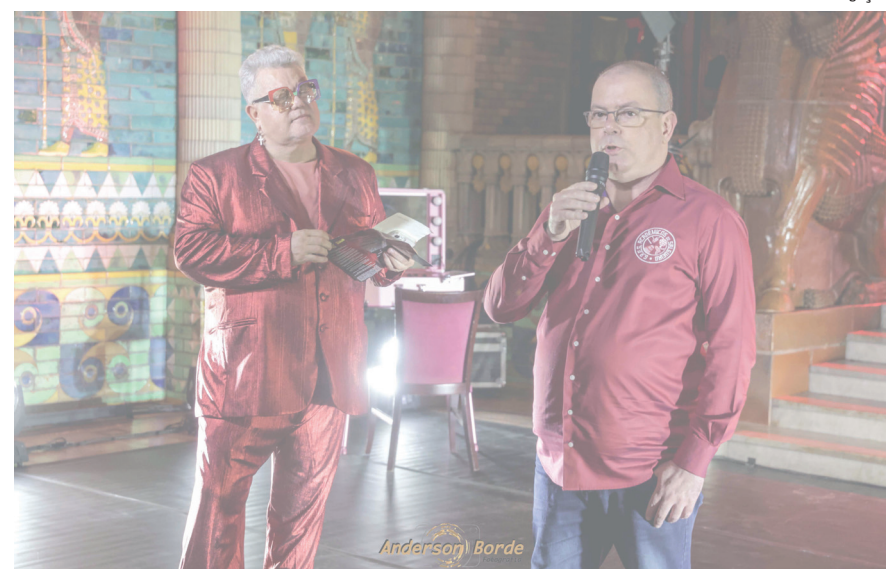
Escola é pioneira entre as agremiações a encenar um espetáculo em um dos principais palcos da cultura erudita