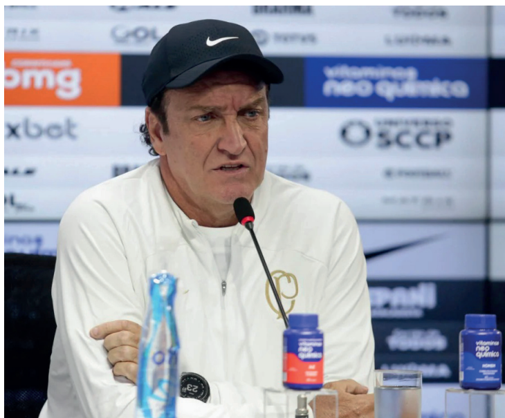
Por meio de nota oficial, treinador do Corinthians 'refuta as acusações que lhe são atribuídas'