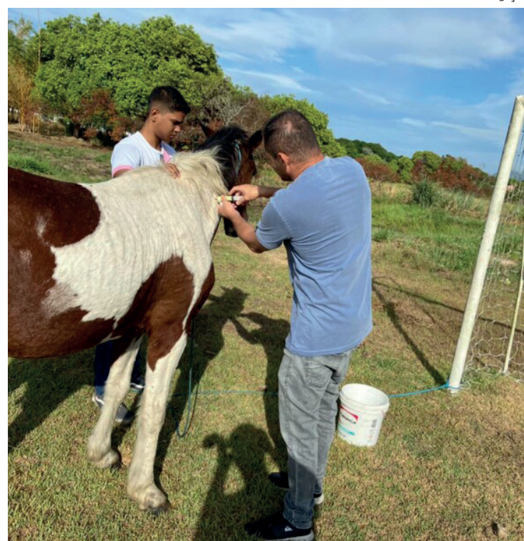
O imunizante está disponível nos 12 postos da cidade