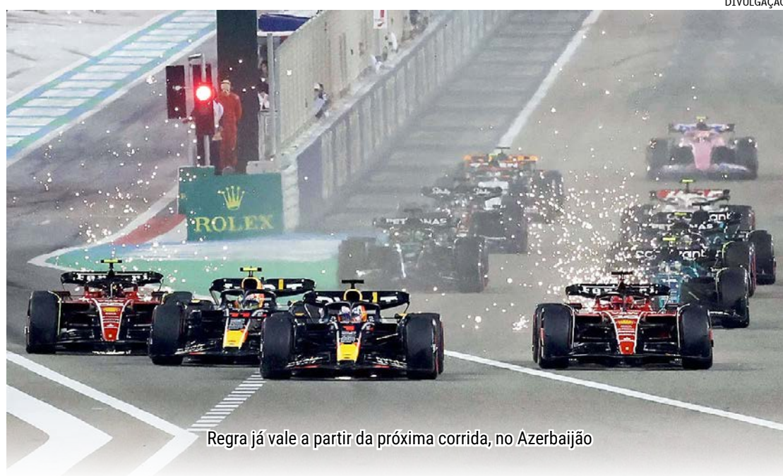
Regra já vale a partir da próxima corrida, no Azerbaijão

Além disso, a Fórmula 1 também decidiu que haverá