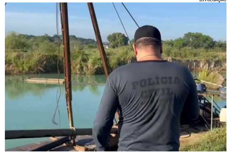
Investigações apontam que a atividade clandestina tem causado graves danos ao meio ambiente