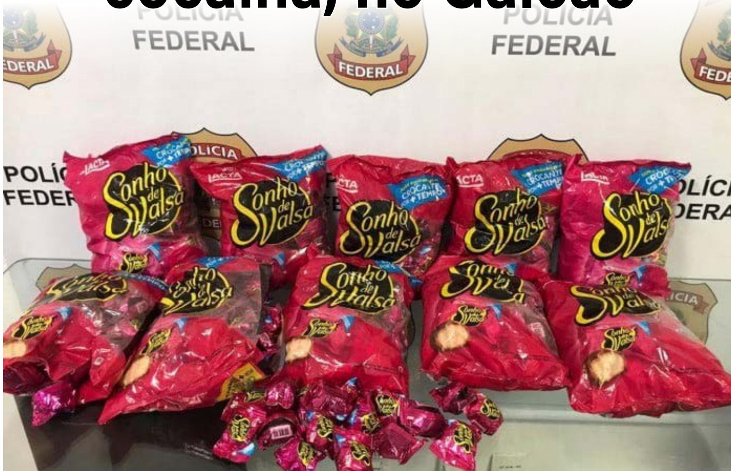
Destino final da droga seria a cidade de Nice, na França

A Polícia Federal prendeu uma cidadã francesa que transportava cerca de 8kg de cocaína escondidos em recheio de bombons. O flagrante aconteceu na noite desta terça-feira (25), no Aeroporto Internacional Tom Jobim, na Ilha do Governador.