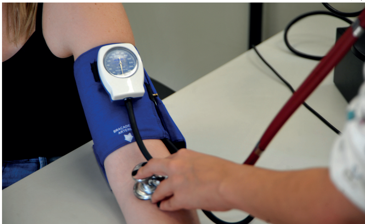
Doença mata 400 brasileiros por ano

O diretor argumentou que há uma questão genética que não se consegue mudar. Pessoas com pais, mães, irmãos,