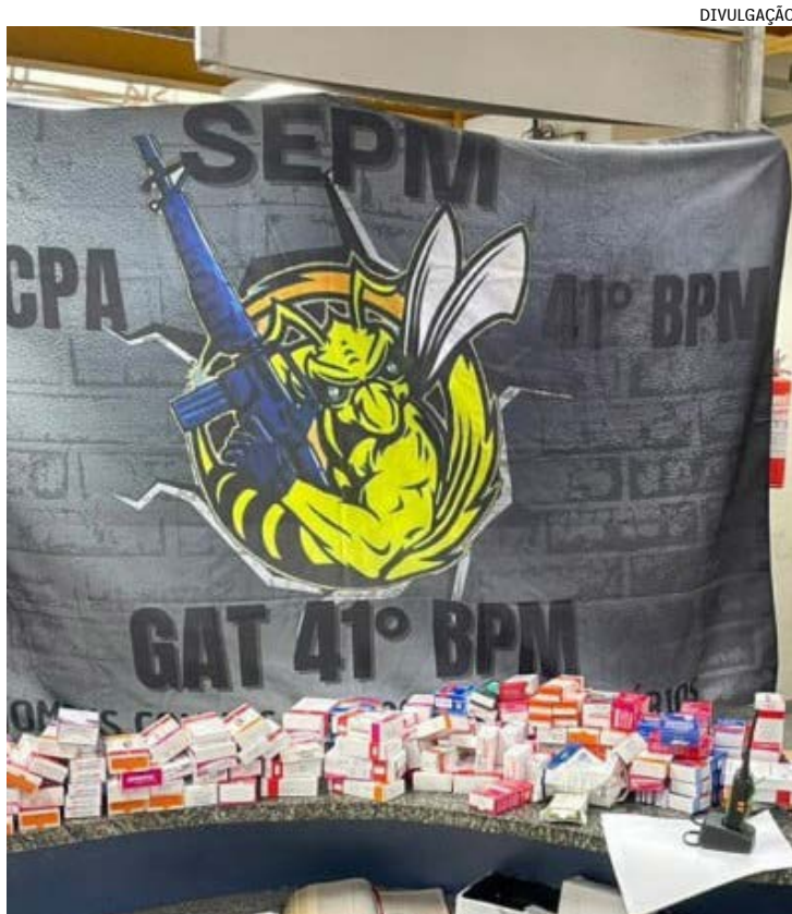
Houve troca de tiros entre policiais e criminosos; uma pessoa saiu ferida

Além dos medicamentos recuperados, os policiais apreenderam uma pistola, munições e um rádio comunicador.