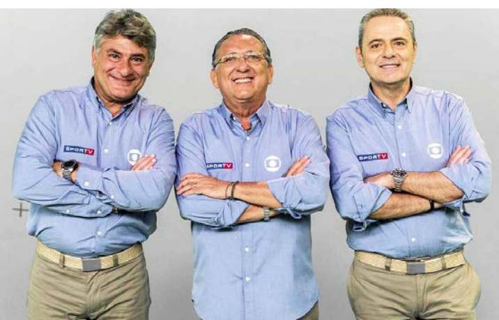
Locutor contou como funcionavam as ações comerciais na emissora

Após quase um mês, a Fórmula 1 volta neste próximo fim de semana com o Grande Prêmio de Baku, no Azerbaijão. Na sexta-feira (28), haverá o treino livre 1 e a classificação para a corrida. No sábado (29), será realizada a classificação e a corrida rápida. Já a corrida principal será no domingo (30), às 8h (de Brasília).