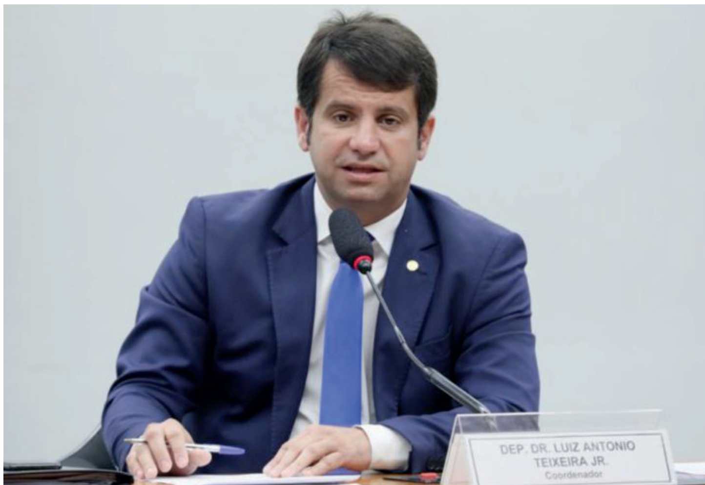
Evento chega à 13ª edição e vai oferecer atendimentos gratuito à população na Praça do Pacificador