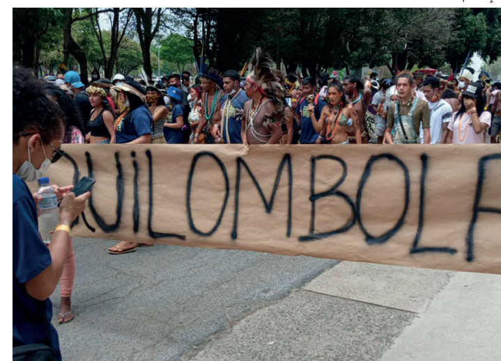
Audiências em Santiago, no Chile, encerram hoje

“A imposição do Estado de construir o Centro de Lançamento de Alcântara num território tradicional, deteriorando