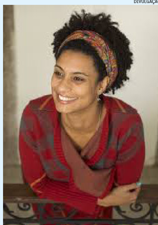
Sexta turma tomou a decisão por 4 votos a 0

Relator do caso, o ministro Rogério Schietti disse que o acompanhamento das investigações pela família é um direito e evita uma revitimização. "O direito do acesso à vítima ao