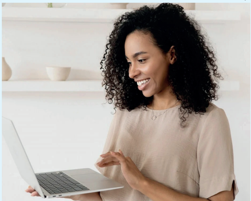
Iniciativa promovida pela CCR Barcas e Instituto CCR oferece curso gratuito para 1 mil mulheres

Foram prorrogadas, até o próximo dia 20, as inscrições para o Programa Despertando a Empreendedora, uma iniciativa do Instituto CCR e da CCR Barcas, em parceria com a Empreende Aí, que capacitará mil mulheres que desejam abrir seu próprio negócio em territórios populares de todo o Brasil.