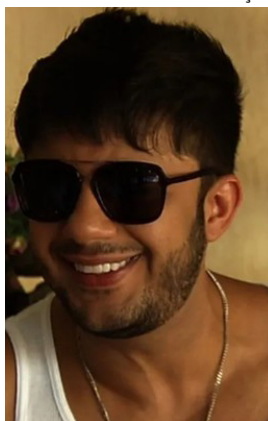
Jovem, de 22 anos, usou uma rede social para propagar imagens dos artistas feitas para laudo pericial do IML. 'Imagens foram obtidas de forma ilegal e distribuídas de forma indiscriminada na internet', diz Polícia Civil

As investigações apontam que as imagens foram obtidas de forma ilegal e distribuídas de forma indiscriminada na internet. A prisão foi realizada pela Delegacia Especial de Repressão aos Crimes Cibernéticos (DRCC), durante operação para reprimir crimes praticados na internet. O nome do suspeito não foi divulgado. A ação faz parte de uma investigação realizada pela Operação Fenrir que visa identificar administradores de perfis em redes sociais que divulgaram e compartilharam fotos e vídeos do corpo de artistas feitas para o laudo pericial no Instituto de Medicina Legal (IML). Segundo a Polícia Civil, o suspeito confessou o crime e, agora, fica à disposição da Justiça, aguardando audiência de custódia. No Brasil, a pena para quem pratica o crime de vilipêndio de cadáver pode ser de detenção de 1 a 3 anos e pagamento de multa, conforme previsto no art. 212 do Código Penal.