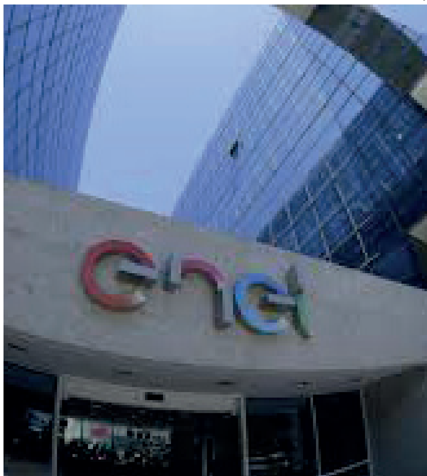
Companhia oferece vagas nas áreas de Engenharias, Administração, Ciências Contábeis, Análise de Sistemas, Psicologia, Recursos Humanos, Direito e Economia; inscrições podem ser feitas até o dia 5 de maio

Os candidatos devem ter disponibilidade para estagiar por seis horas por dia. As etapas do processo seletivo serão todas online com dinâmica em grupo e entrevistas individuais. Além disso, vale destacar que a empresa oferece bolsa-auxílio compatível com o mercado; auxílio transporte; vale-refeição; Gympass (plataforma corporativa de atividade física); cursos no eDucation (plataforma online de treinamento); curso de idioma (inglês, italiano ou espanhol); e folga de aniversário.