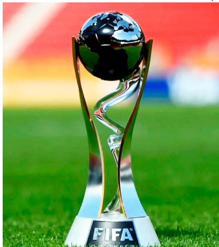
País sul-americano herdou a competição da Indonésia, que perdeu o torneio dois meses antes de seu início