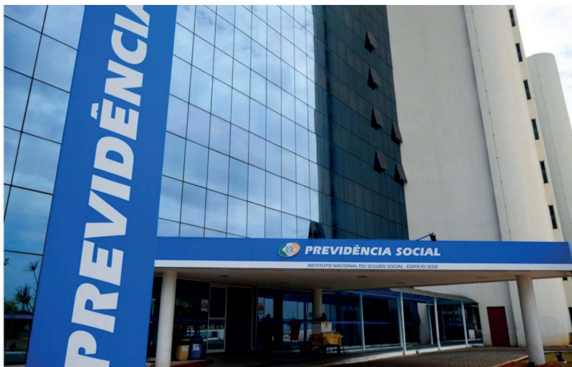
Iniciativa estimula inclusão de aposentados, pensionistas e segurados por auxílio-doença no mercado de trabalho

No 1º de maio, o Ministério disponibilizará o atendimento ao público com estande do INSS ins-