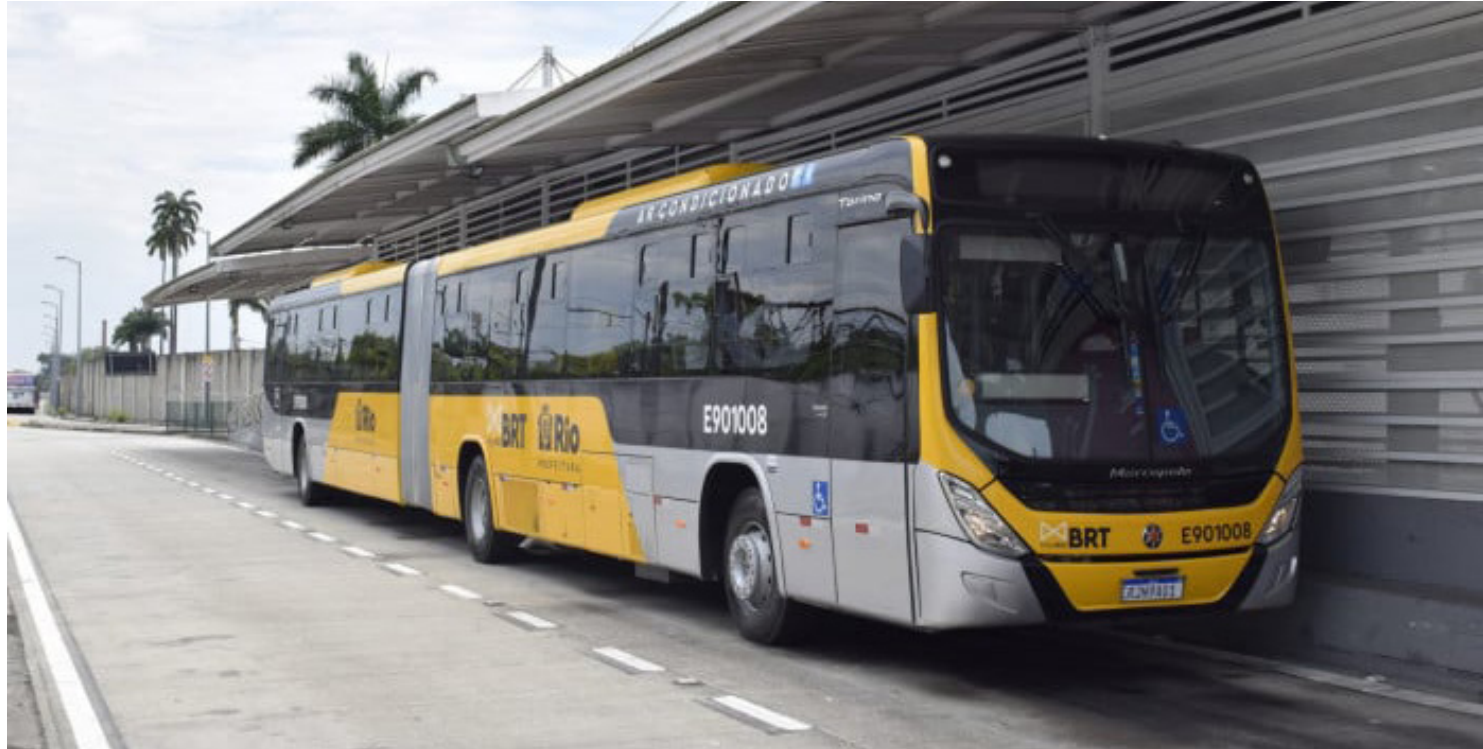
Para utilizar o integração, os passageiros vão precisar usar o Bilhete Único Carioca (BUC); desde que tenha o BRT como um dos meios de transporte, benefício é válido também em ônibus convencionais, vans e VLT

Todos os modais da Prefeitura que operem com validadores do BUC podem ser utilizados nas outras duas viagens, como ônibus convencionais, vans e VLT, sem importar a ordem das integrações, desde que o BRT seja um dos meios de transporte utilizados. O período para fazer as integrações será de três horas