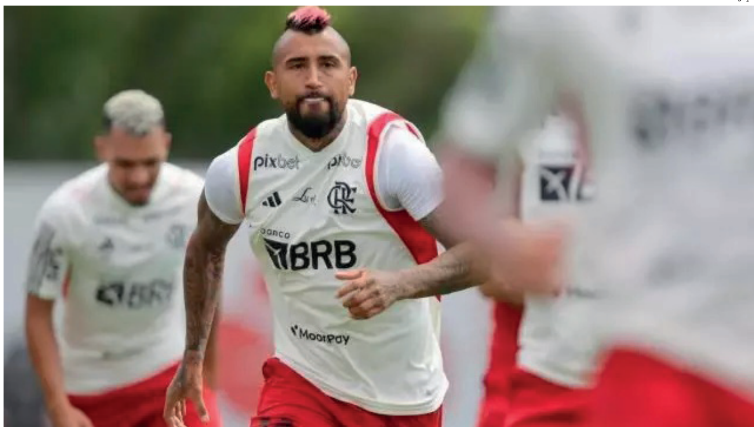
Treinador ganhou opção no meio de campo com o retorno de Arturo Vidal

Flamengo x Ñublense acontece nesta quarta-feira (19), às 21h30 (horário de Brasília), no Maracanã. O duelo será válido pela segunda rodada da fase de grupos da Libertadores da América.