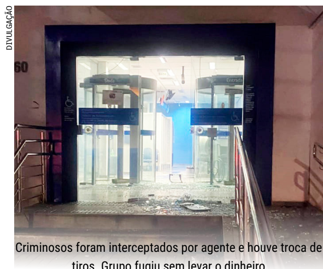
Criminosos foram interceptados por agente e houve troca de tiros. Grupo fugiu sem levar o dinheiro