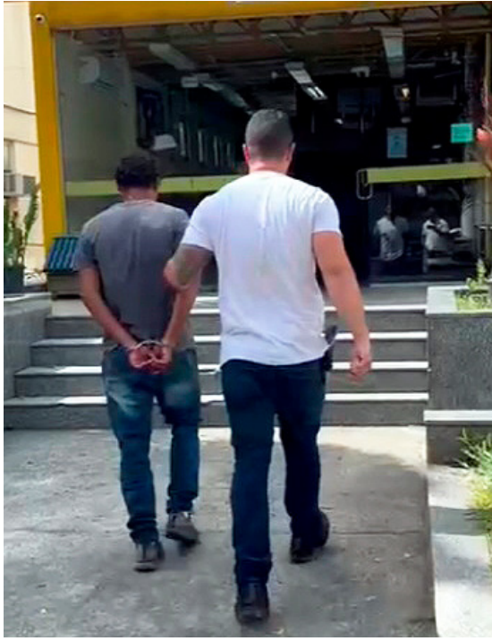
Suspeito colocou calmante em bebida da vítima

Equipes da 50ª DP (Itaguaí) prenderam, ontem, um homem de 45 anos por estuprar a vizinha, no bairro Leandro, em Itaguaí, na Região Metropolitana. Ele não resistiu à prisão.