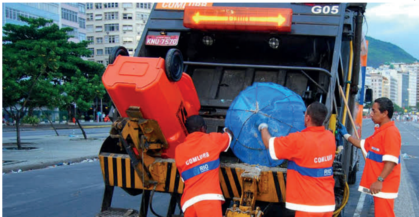
Gratificação por produtividade será paga até o final de junho e folha suplementar, com cálculo feito com base no valor do 13º salário

A Fundação Mudes oferece, nesta semana, 253 vagas de estágio, nos níveis superior, médio e técnico. O valor da bolsa-auxílio pode chegar a R$ 2 mil. Para se candidatar, basta acessar o site www.mudes.org.br . As carreiras do Ensino Superior com o maior número de vagas são: administração (87), engenharia (52) e comunicação social (33). Ainda há vagas para cursos como arquitetura e urbanismo, biomedicina, ciências contábeis, direito, letras, gastronomia, informática, medicina, pedagogia, veterinária, sistemas de informação e muito mais.