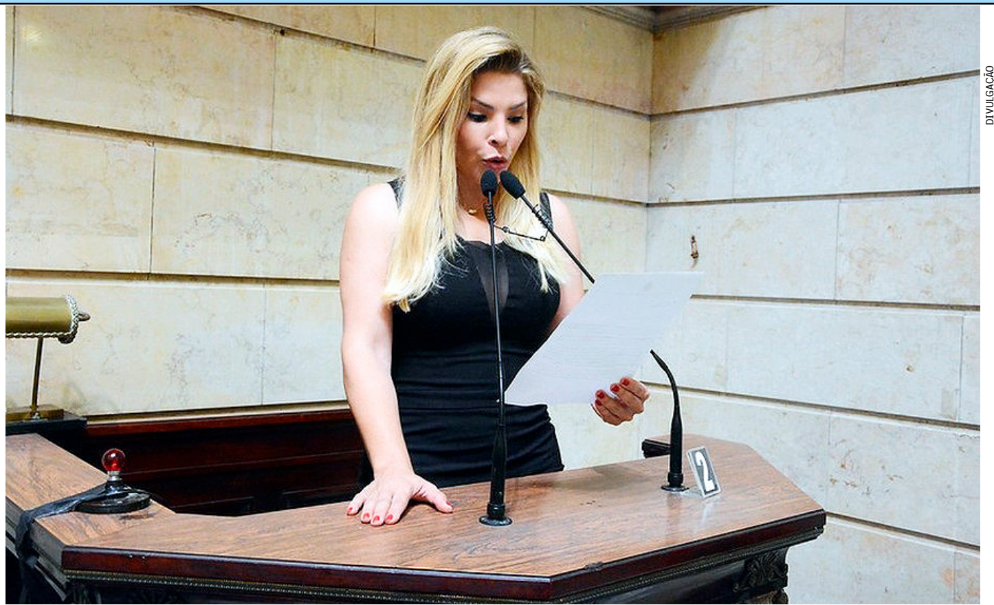
Desembargadores decidiram que o cumprimento da pena seja em regime inicialmente fechado e que ela perca o cargo de vereadora

O homem foi conduzido à presença da autoridade policial e levado para o sistema prisional, onde ficará à disposição da Justiça.