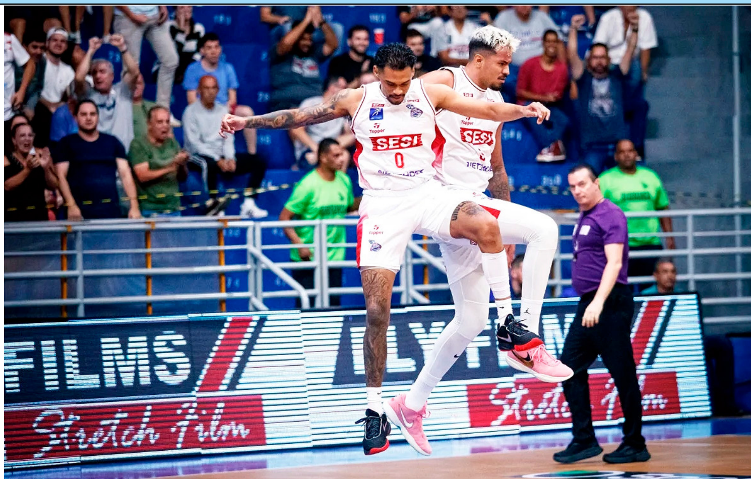
Equipe paulista termina temporada regular do NBB com 100% de aproveitamento

Das 32 seleções no Mundial, oito são estreantes: Filipinas, Haiti, Irlanda Marrocos, Panamá, Portugal, Vietnã e Zâmbia. Já o Brasil está entre os sete países participantes de todas as nove edições do Mundial, ao lado de Alemanha, Estados Unidos, Japão, Nigéria, Noruega e Suécia.