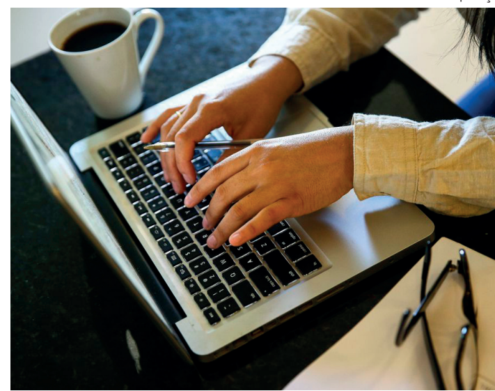
Estudo mostra ensino de C&T na educação básica brasileira

Em relação à infraestrutura, dois tipos principais de carências atrapalham as escolas: a baixa conectividade, desafio de porte para um país com a extensão territorial do Brasil, e a dificuldade de acesso a computadores, tablets e outros suportes. "Para se ter uma ideia, os países da Organização para Cooperação e Desenvolvimento Econômico (OCDE)