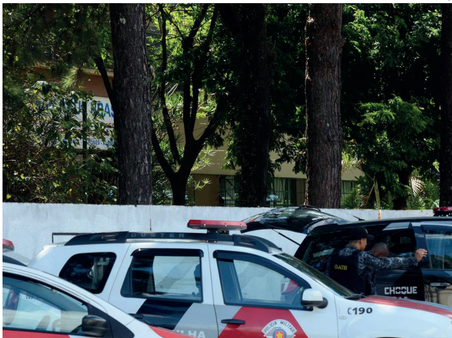
Com R$ 150 milhões, programa financiará projetos locais

Na última segunda-feira (10), Flávio Dino se reuniu com representantes de plataformas digitais e exigiu a criação de canais abertos e ágeis para atender solicitações das autoridades policiais sobre conteúdos com apologia à violência e ameaças a escolas nas redes