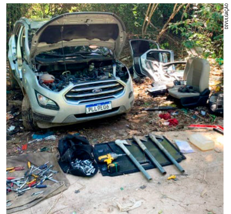
Os homens atuavam na Zona Norte e na Baixada Fluminense e, segundo a PM, eram do TCP; no mesmo dia, outra operação apreendeu 10 carros em Belford Roxo

Policiais militares do 39º BPM (Belford Roxo) apreenderam, nesta mesma terça-feira (11), dez carros em um depósito que era utilizado para desmanche de veículos roubados, na comunidade Santa Teresa, em Belford Roxo, na Baixada Fluminense.