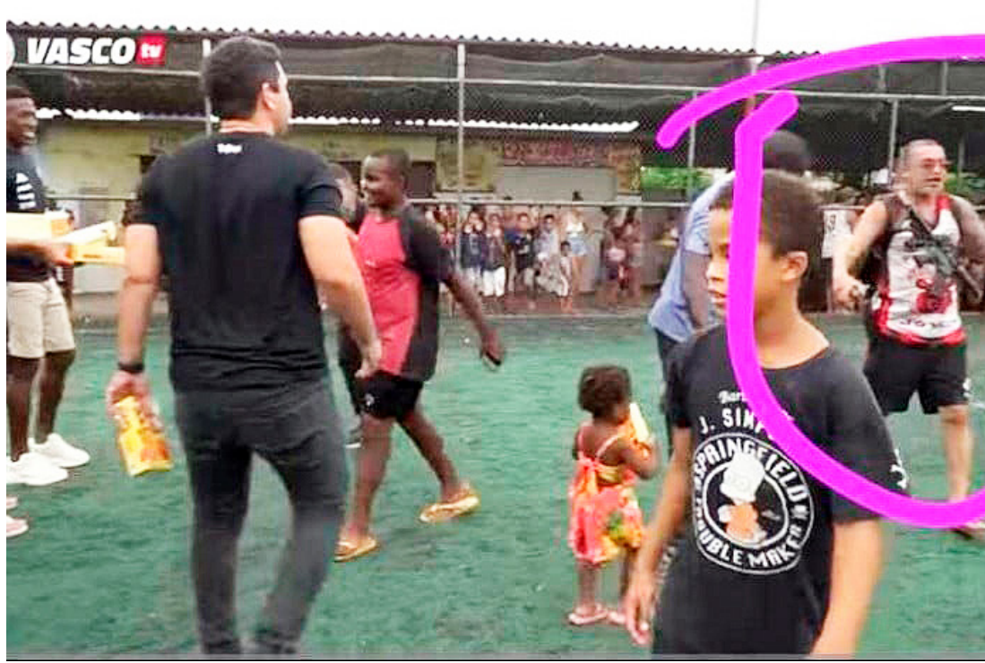
Suspeito está na condição de evadido do sistema penitenciário desde 2021

Segundo a 32ª DP (Taquara), responsável pela investigação, a distrital recebeu a informação por meio de publicação em redes sociais e vai apurar os crimes de associação ao tráfico de drogas e porte ilegal de arma de fogo contra o suspeito. Diligências estão em andamento para esclarecer