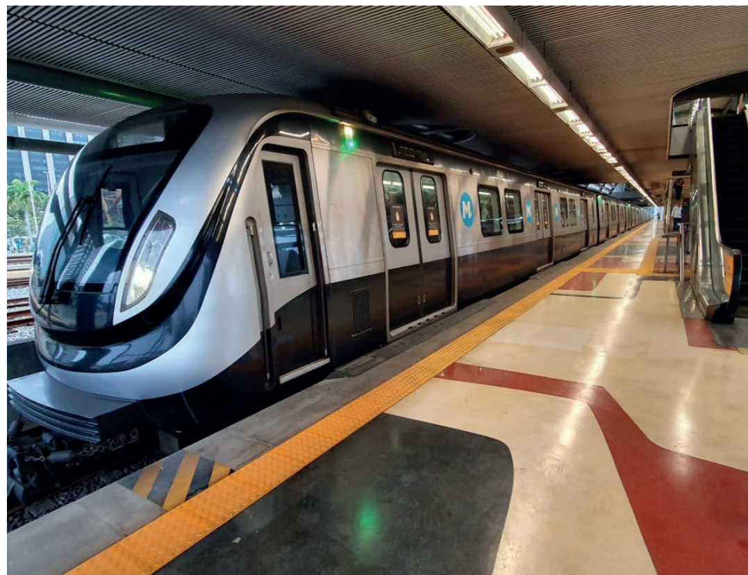
Nova tarifa foi aprovada em março pela Agência Reguladora dos Transportes (Agetransp)

Carioca (7h às 19h) Maracanã - (7h às 19h) Siqueira Campos - (10h às 19h) Jardim Oceânico - (10h às 19h) Pavuna - (10h às 19h) Coelho Neto - (10h às 19h) Trajá - (10h às 19h) Saens Peña - (10h às 19h) São Conrado - (10h às 19h) Botafogo - (10h às 19h)