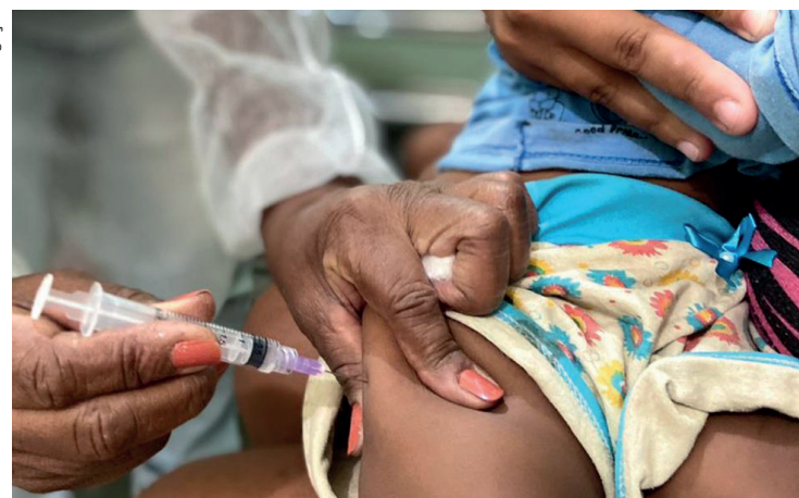
O imunizante está disponível nos 12 postos da cidade