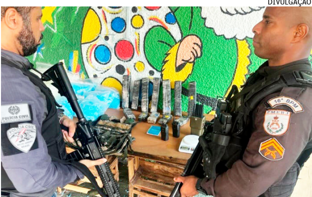
Policiais militares e civis realizaram, ontem, um cerco em um local seria do traficante Álvaro Malaquias Santa Rosa, conhecido como Peixão, chefe do Complexo de Israel

esconderijo de traficantes durante ações nas comunidades Cidade Alta, Cinco Bocas e Pica-Pau, na Zona Norte da cidade do Rio de Janeiro. O local seria do traficante Álvaro Malaquias Santa Rosa, conhecido como Peixão, chefe do Complexo de Israel, também na Zona Norte. De acordo com os agentes, Peixão estaria em um apartamento na Cidade Alta, mas conseguiu escapar. Segundo a Polícia Militar, militares do 6º BPM (Olaria) e do Batalhão de Ações com Cães (BAC) atuaram em conjunto com policiais da 38ª DP (Brás de Pina) nas regiões. No local, foram encontradas 12 tabletes de maconha, cerca de 5 mil pinos vazios para acondicionamento de drogas, dois radiotransmissores, um bloqueador de sinal, uma capa de colete, uma balança de precisão e um caderno de anotações.