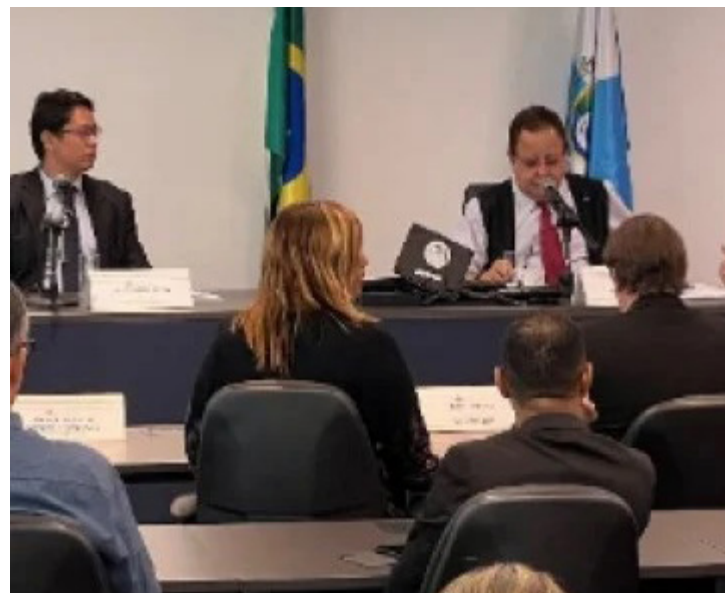
Comissão de Transporte exige cumprimento do contrato, a melhoria dos serviços e respeito para a população

Os parlamentares ouviram usuários das barcas que enfatizaram os problemas do ser-