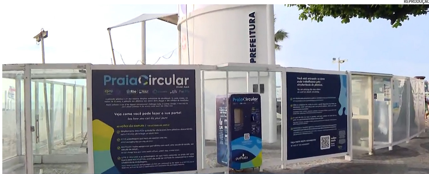
Foi instalada uma máquina de água gelada, a R$ 1 para cada meio litro, para reduzir a compra e o descarte de garrafas plásticas na praia. Projeto é uma iniciativa da Riotur, da União Europeia e da Orla Rio

Na pesquisa da UFRJ, a maioria dos pedidos de patentes formulados (87%) tem mulheres participando como inventoras. No período de 2017 a 2021, foram pedidas 148 patentes por 816 inventores, dos quais 443 eram homens e 373, mulheres. Mas, das 148 patentes depositadas pela UFRJ nos últimos cinco anos, somente 19 foram pedidas exclusivamente por homens.