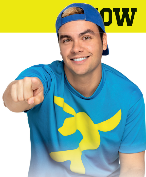
Show acontece no dia 11 de março