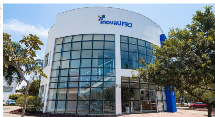
Dado refere-se ao período de 5 anos, entre os anos de 2017 e 2021