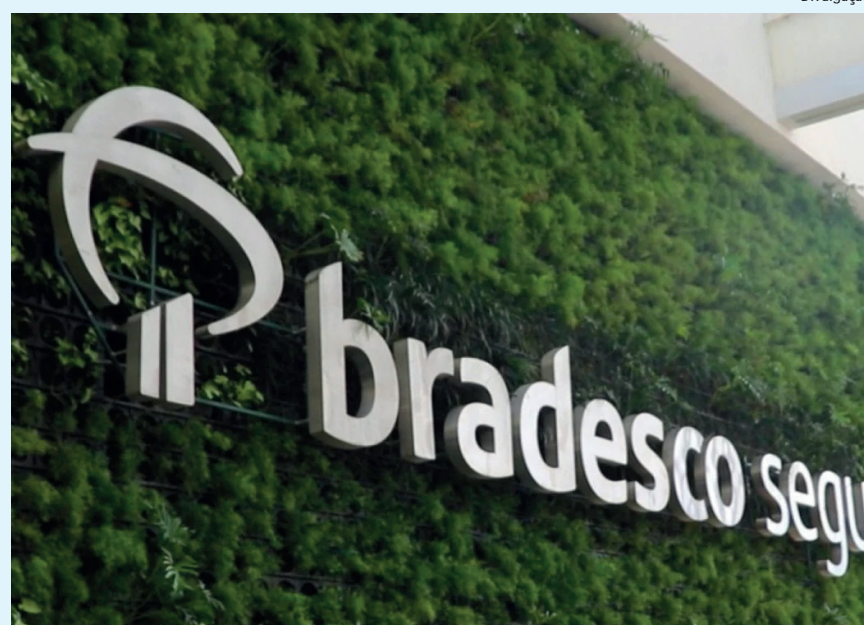
Há vagas disponíveis para a unidade Rio de Janeiro

As inscrições podem ser realizadas no período até 3 de abril no link https://www.ciadetalentos.com.br/estagiobradescoseguros2023/ . O processo seletivo abrange ainda as avaliações, em abril; dinâmicas de grupo, em entre abril e maio; e o processo admissional previsto para acontecer a partir de junho.