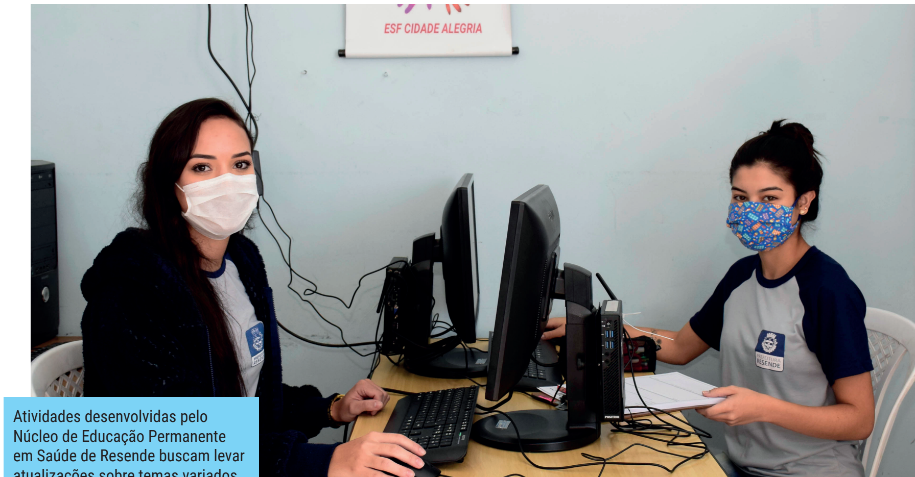
Atividades desenvolvidas pelo Núcleo de Educação Permanente em Saúde de Resende buscam levar atualizações sobre temas variados

“O trabalho não para no NEPS e estamos sempre nos atualizando para trazer o que há de mais moderno e atual nas temáticas sobre saúde pública. Em 2023, muita novidade está por vir e vamos fortalecer e atualizar nosso corpo de profissionais da