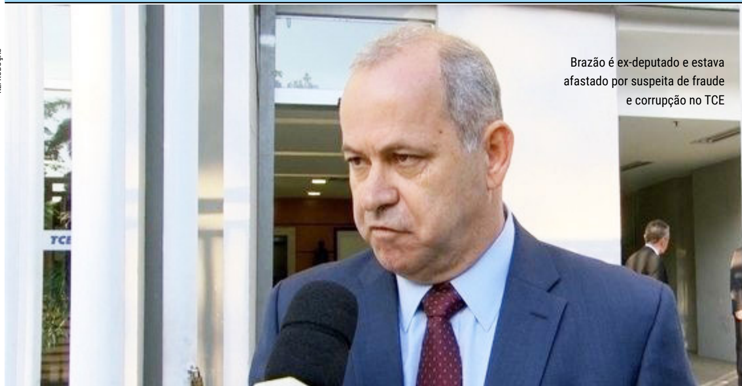
Brazão é ex-deputado e estava afastado por suspeita de fraude e corrupção no TCE