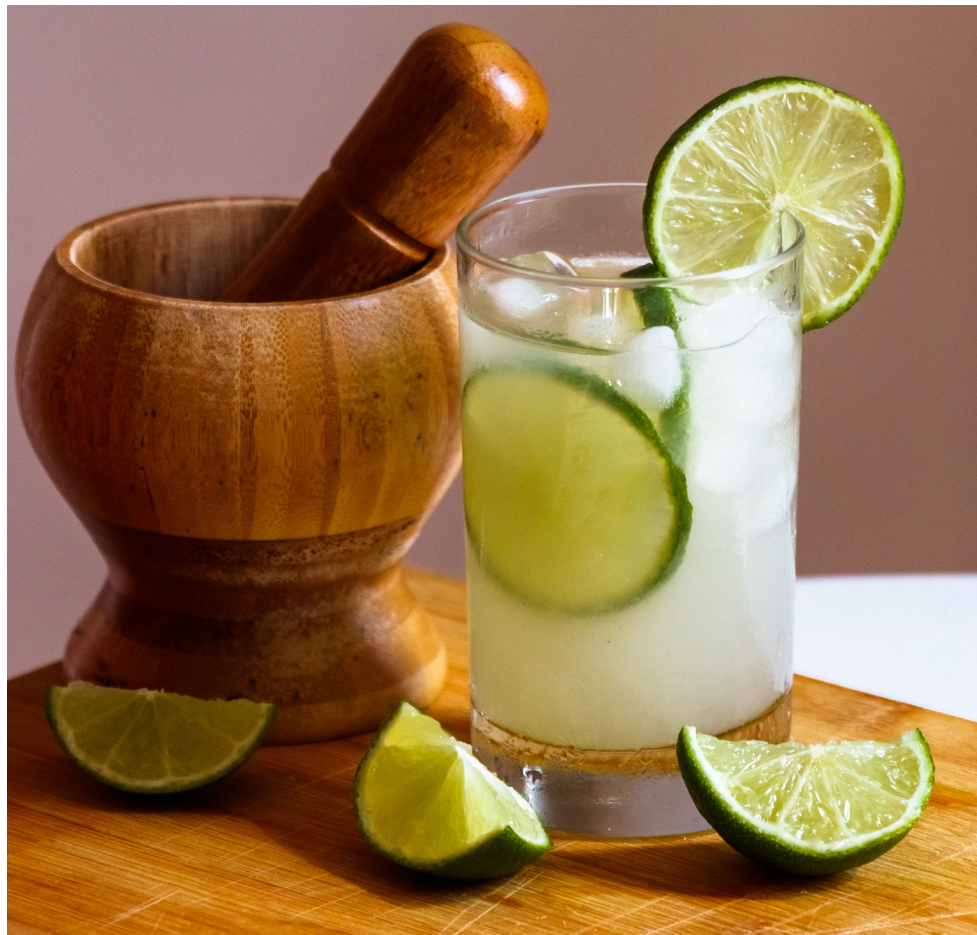
Degusta Copacabana acontece nos dias 9, 10, 11 e 12 de março

Mas vamos ao concurso. Com apoio da Associação Brasileira de Bartenders (ABB), Apacerj – cachaças do Rio e patrocínio da Abrasel. Para a modalidade Caipirinha Tradicional, cada competidor utilizará em sua receita base original e tradicional registrada na IBA Internacional. Para a Caipirinha Inovação: é livre a criatividade do concorrente. Mantendo a cachaça como base e não utilização de espuma. Alguns detalhes são importantes: modo de preparo será a forma tradicional montado no próprio copo (macerando o limão e adicionando o açúcar ou