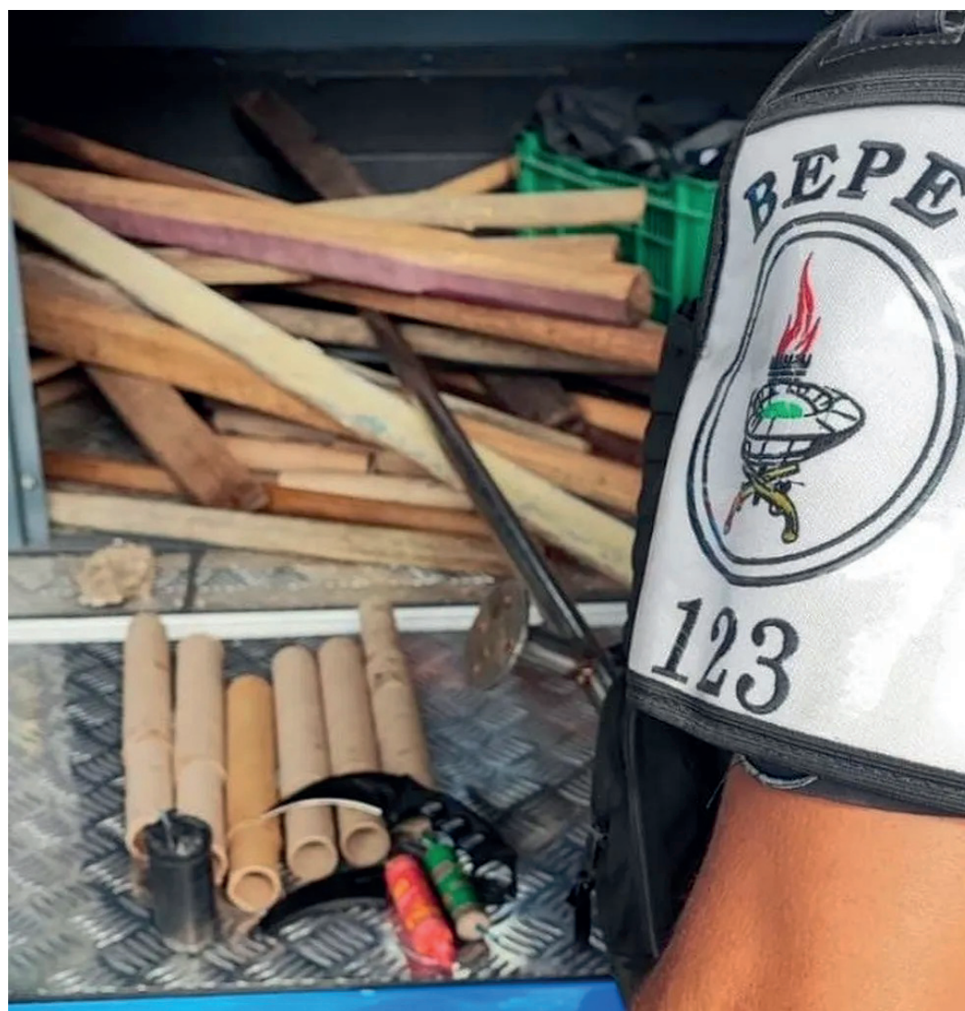
Os torcedores terão de manter 5km de distância dos estádios, caso estejam vestindo uniforme ou portando símbolos das organizadas

Segundo a Secretaria Municipal de Saúde do Rio, oito pessoas deram entrada na emergência do hospital Souza Aguiar, em decorrência das brigas. Até o fim da tarde desta terça, três delas permaneciam internadas - duas em estado grave, outra em quadro estável. Um homem não resistiu, e acabou morrendo depois de ser socorrido.