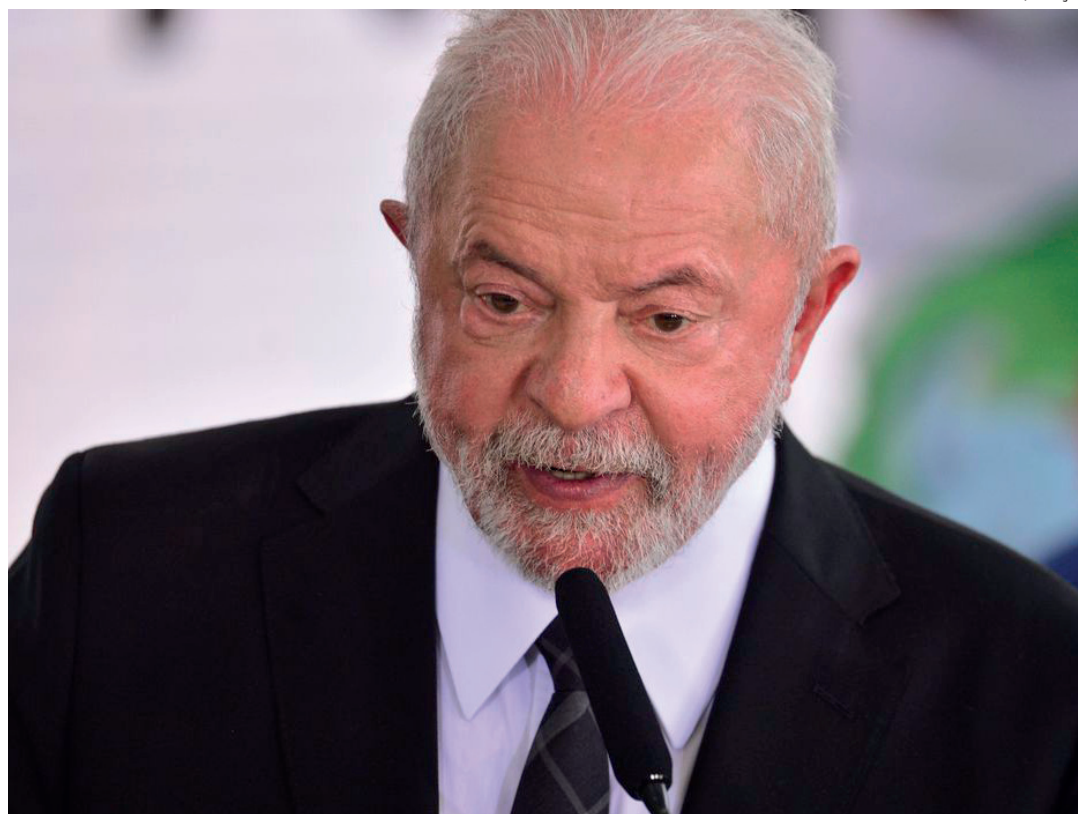
Neste 8 de março, o governo federal anunciou iniciativas que serão enviadas como projeto de lei ao Congresso para garantir salário igual a homens e mulheres que exerçam mesma função

A ministra propôs um pacto com a sociedade para enfren-