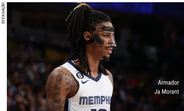
Armador Ja Morant

A Anistia Internacional da Austrália disse que há uma “ironia” no fato de um órgão de turismo saudita patrocinar o torneio feminino, já que as mulheres sauditas “nem podem ter um emprego sem a permissão de seu responsável masculino”.