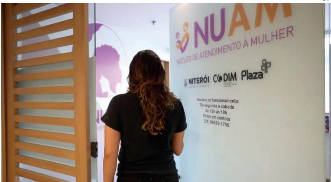
Coordenadoria de Políticas e Direitos das Mulheres (Codim) é responsável pelas políticas públicas de acolhimento e apoio às vítimas de agressão

A Codim – Coordenadoria de Políticas e Direitos das Mulheres – é o órgão da Prefeitura de Niterói que estabelece políticas públicas que garantam a emancipação das mulheres por meio da independência econômica e de ações de cidadania. O órgão nasceu há 20 anos com a missão de criar ações consistentes que levem mulheres que sofrem violência, das mais diversas formas, a terem sua autonomia e romperem os laços com seu agressor.