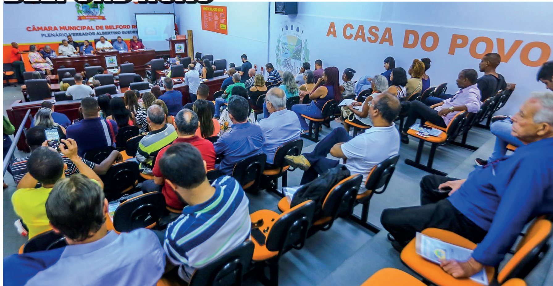
A pré-conferência contou com a participação de profissionais de saúde e representantes da sociedade civil organizada