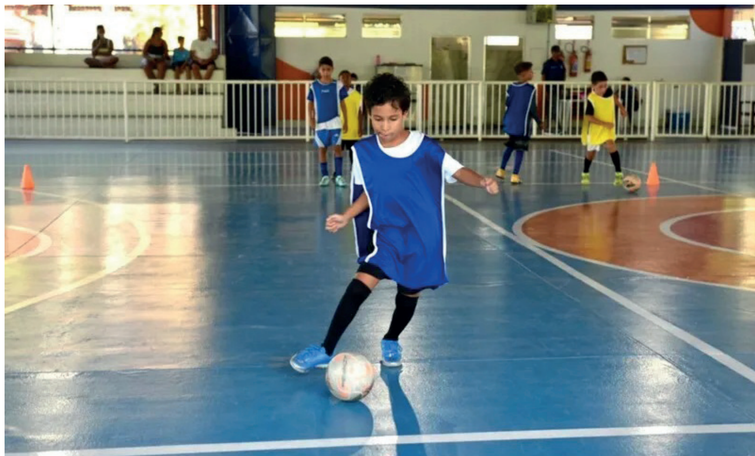
Quarenta e um atletas participaram das avaliações, nas categorias sub 9, sub 11 e sub 13

“Os atletas começam desde pequenininhos, no sub 9 do futsal, aí quando ficam mais velhos, nós os direcionamos para o campo, onde