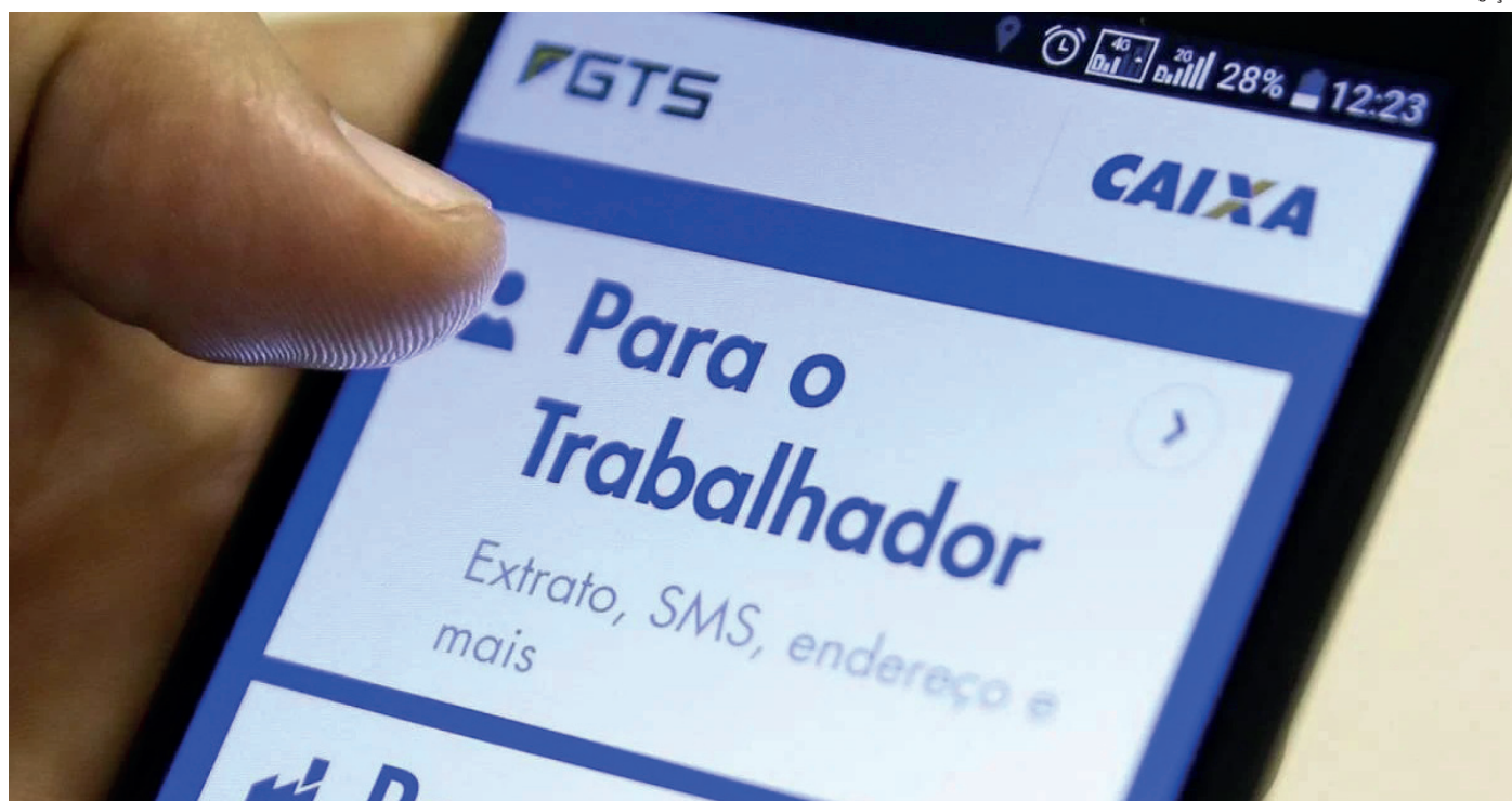
Além do certificado de formação, alunos com os melhores desempenhos podem ser absorvidos para trabalhar no Pan

A pessoa interessada pode acessar o site https://www.domesticalegal.org.br/ e se cadastrar. Para participar da Ação Coletiva, é necessário associar-se à ONG pagando uma taxa para as despesas iniciais de entrada da ação. Antes, o trabalhador pode calcular gratuitamente o valor que tem a receber para saber se vale a pena participar. Para saber o valor correto, o site do Instituto Fundo de Garantia do Trabalhador disponibiliza