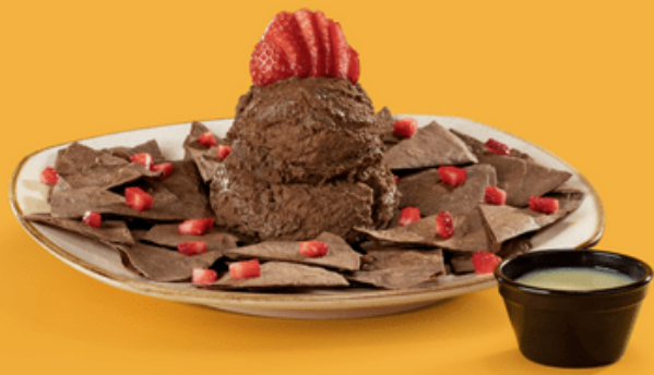
Os produtos estão disponíveis somente nos restaurantes e por tempo limitado