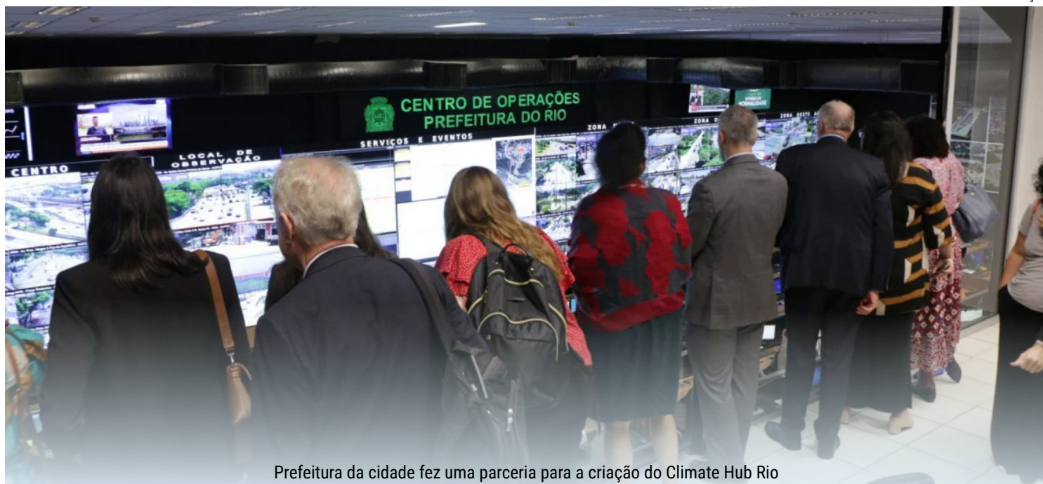
Prefeitura da cidade fez uma parceria para a criação do Climate Hub Rio

dívida histórica com o Complexo do Alemão. E estamos cobrando o que há de melhor para os condomínios, por-