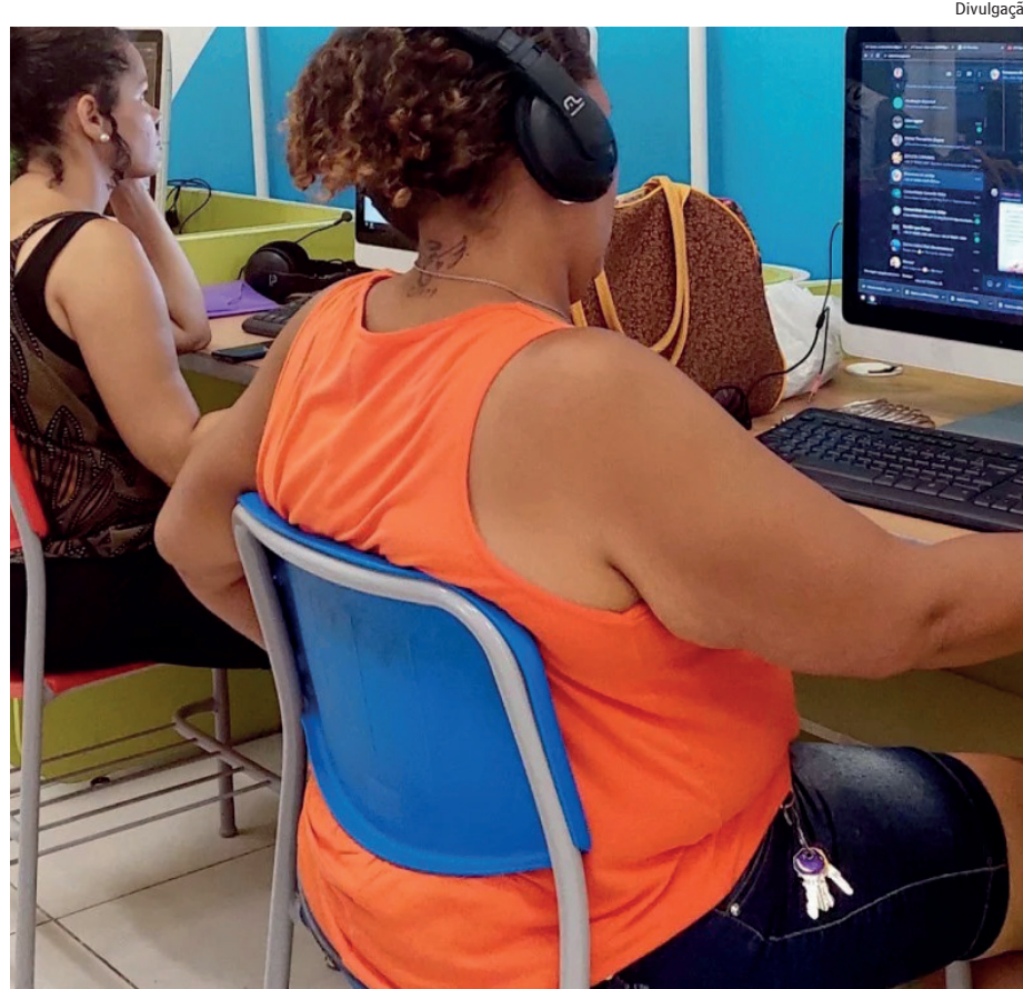
Curso faz parte da segunda edição de evento que debaterá oportunidades de aprendizagem, mercado de trabalho e igualdade de gênero

As inscrições para o curso IT Essentials podem ser feitas através do site: www.navedoconhecimento.rio , ou pessoalmente na Nave do Engenhão.