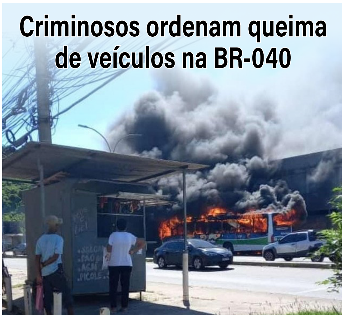
Diversas vias da cidade também foram obstruídas. Protesto teria sido a mando do tráfico

A Rodovia Washington Luiz (BR-040) foi interditada, na tarde de ontem, na altura de Duque de Caxias, na Baixada Fluminense. Ambos os sentidos foram comprometidos com veículos pegando fogo. A suspeita é de que a ordem partiu do tráfico devido a uma operação na região.