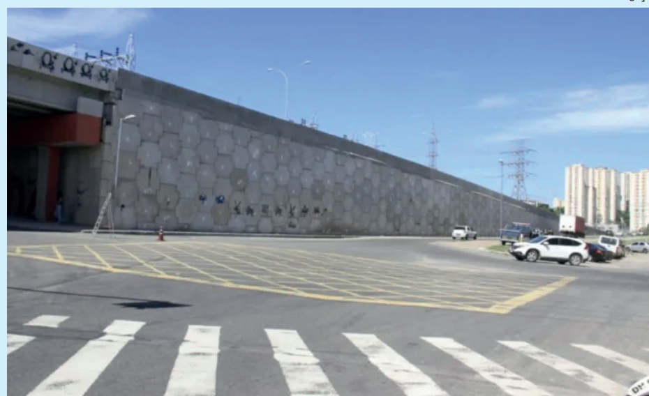
Elevado será o sexto local a receber arte em grafite em São Gonçalo