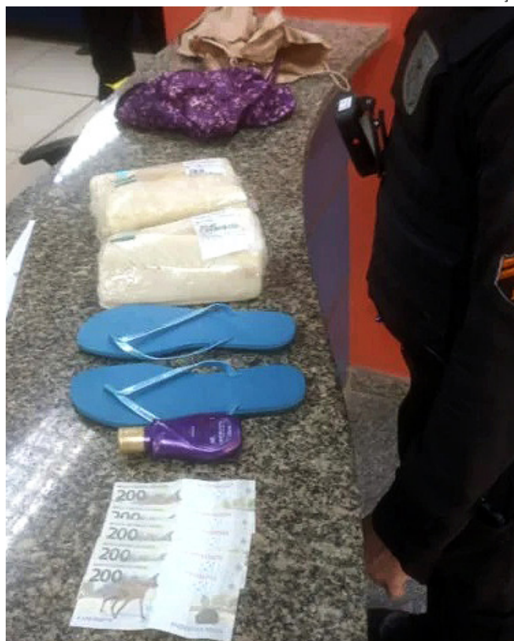
O suspeito ofereceu R$ 1,5 mil para os agentes

Os dois suspeitos foram conduzidos para a 12ª DP (Copacabana).