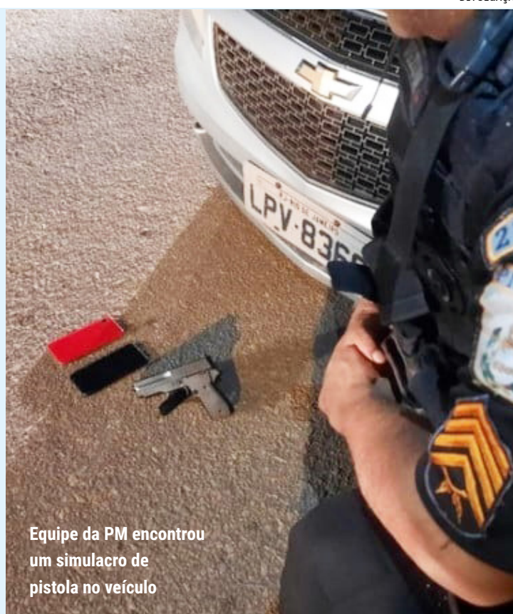
Equipe da PM encontrou um simulacro de pistola no veículo

A ocorrência foi registrada na delegacia da região.