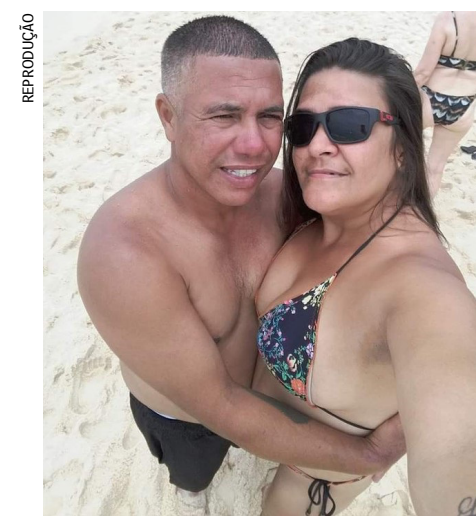
Suspeito tentou fugir, mas foi preso por policiais civis da 55ª DP (Queimados). Vítima estava com a filha de 1 ano e 6 meses quando foi esfaqueada

Um homem foi preso suspeito de tentativa de feminicídio contra a companheira, na manhã de ontem, em Queimados, na Baixada Fluminense. A família da vítima afirma que ela estava dormindo, quando ele tentou ter relações sexuais com ela, que negou.