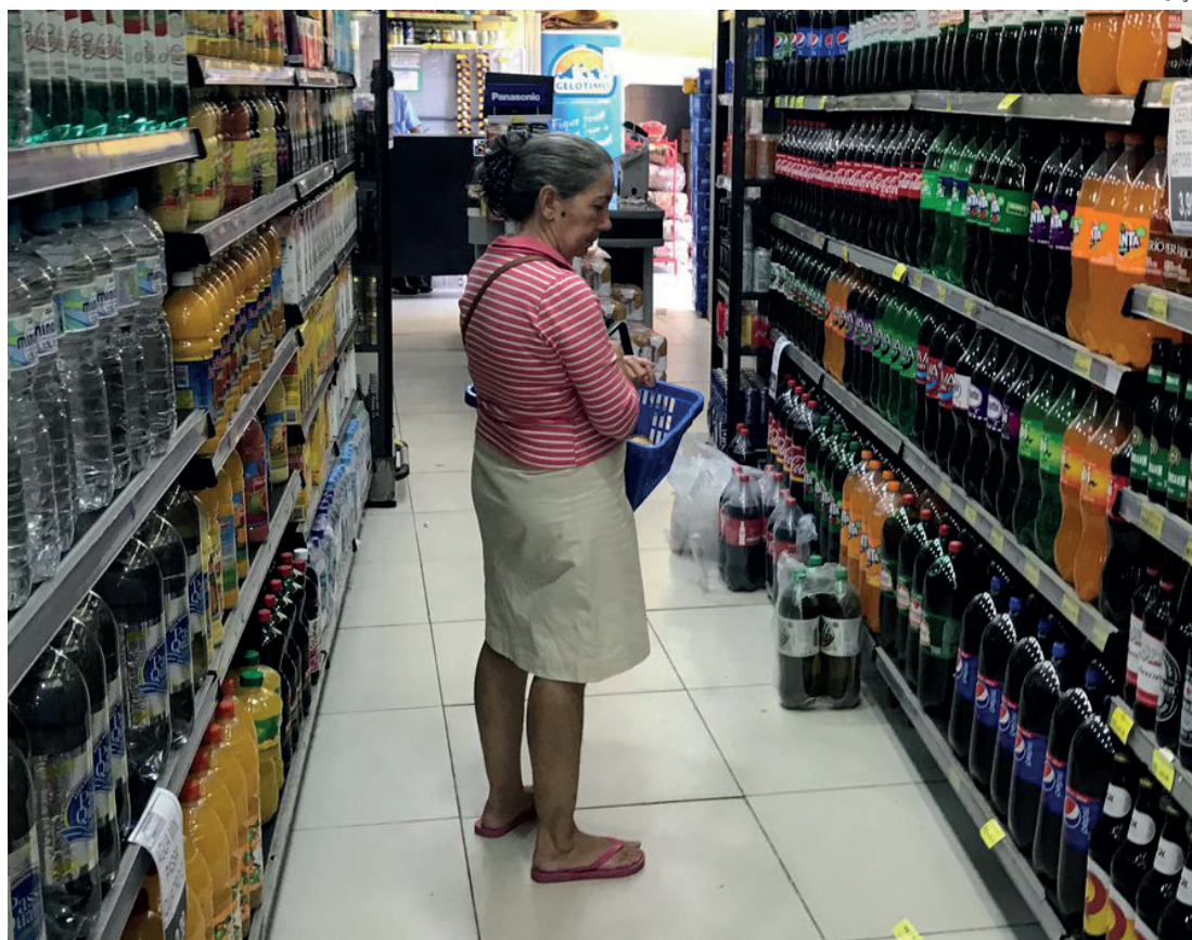
Presuntos, salsichas e refrigerantes recebem aditivos intencionalmente