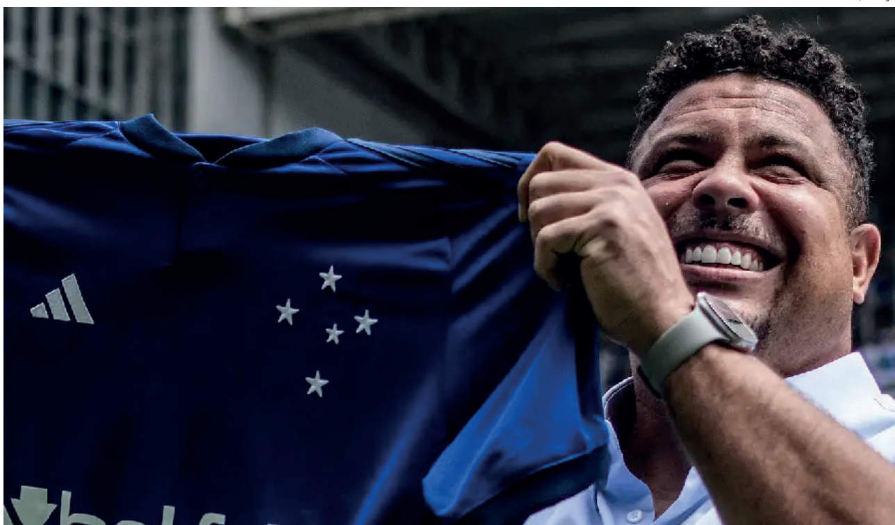
Surpresas marcaram a rodada do Paulista, Mineiro, Carioca e até das ligas europeias; torcedores estão na bronca, mas é preciso ter paciência

zeiro e Athletic 1x0 Atlético-MG! No jogo do Cruzeiro, inclusive, a torcida mandou o Ronaldo para aquele lugar, o que achei uma tremenda injustiça.