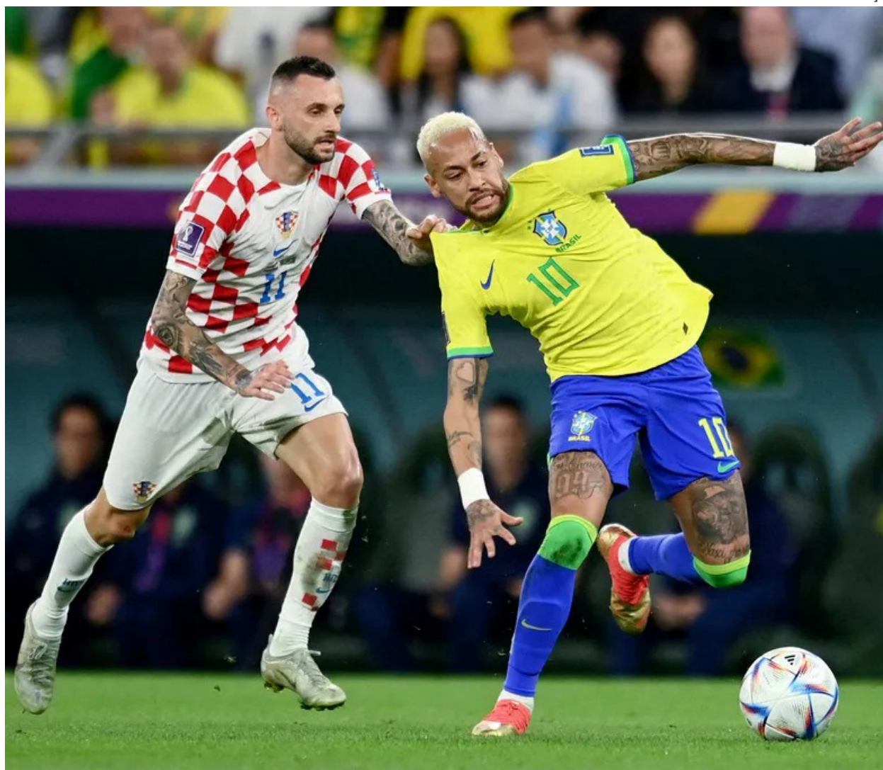
Acordo entre Conmebol e Uefa prevê duelos entre seleções dos dois continentes

Os duelos entre sul-americanos e europeus vão obedecer a critérios técnicos: os seis melhores times da Conmebol vão jogar contra rivais do grupo A da Nations League da Europa. Ou seja: o Brasil (assim como Argentina, Uruguai,