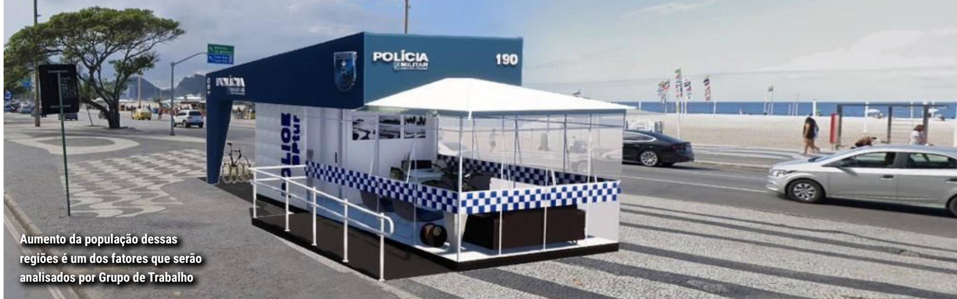
Aumento da população dessas regiões é um dos fatores que serão analisados por Grupo de Trabalho

Seis regiões do Estado do Rio deverão ganhar novos batalhões da Polícia Militar, reforçando a segurança nessas locais. O governador Cláudio Castro instituiu um Grupo de Trabalho para realizar estudos que serão utilizados no planejamento, distribuição e reengenharia do policiamento em Jacarepaguá, Copacabana, Méier, Nova Iguaçu, São Gonçalo e na Região dos Lagos. O decreto que cria o Grupo de Trabalho para alterar as Áreas