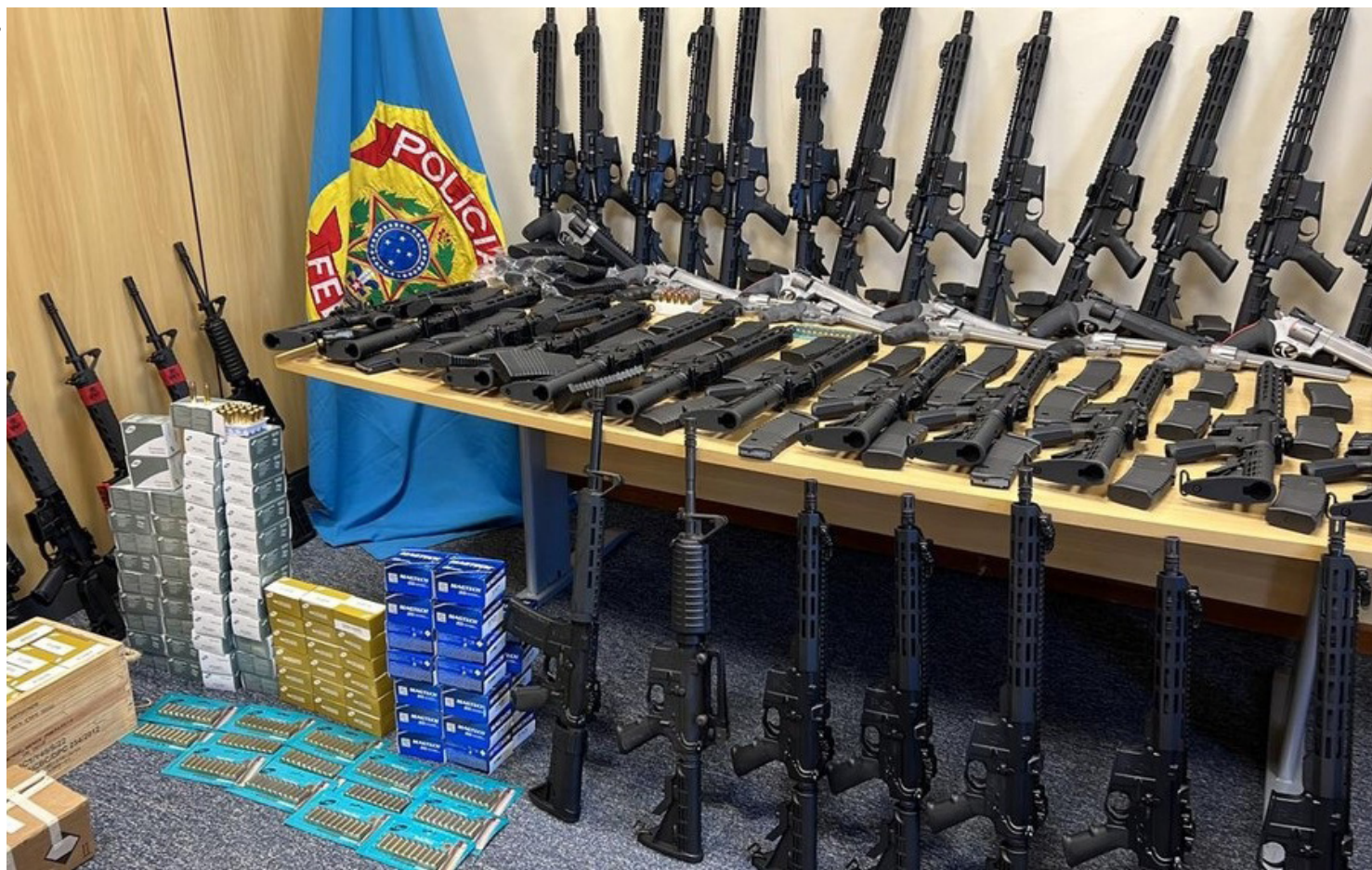
Operação Desarmada foi deflagrada após denúncias de irregularidades na comercialização das armas na Baixada Fluminense. Entre os presos está um policial federal aposentado

A Polícia Federal e o Exército prenderam, nesta quarta-feira (15), 68 fuzis e 12 revólveres em uma operação contra a venda ilegal de armas de fogo na Baixada Fluminense. Foi a maior apreensão da história da PF. Quatro pessoas foram presas — entre elas, um policial federal aposentado.