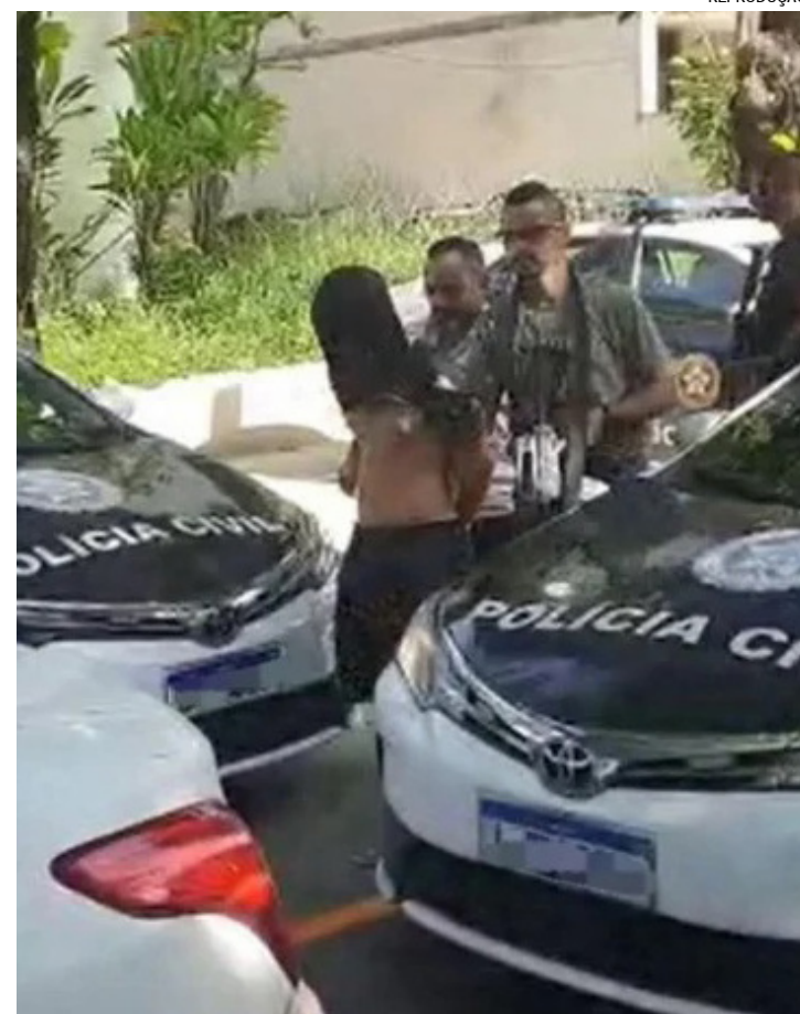
Animais roubados da casa da vítima foram recuperados

Em nota, a Polícia Militar informou que agentes do 14ºBPM (Bangu) foram acionados para verificar uma