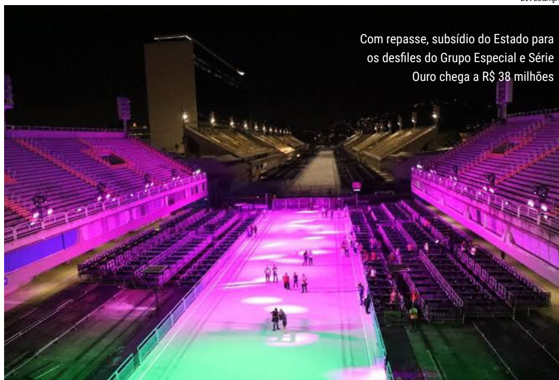
Com repasse, subsídio do Estado para os desfiles do Grupo Especial e Série Ouro chega a R$ 38 milhões

“Esse aporte vai fazer com que as escolas possam entregar um Carnaval mais bonito, que leva positivamente a imagem do Rio, assim como o Réveillon, para todo o mundo. Este ano não tenho dúvidas que será o maior Carnaval da história, e o Rio de Janeiro retoma seu protagonismo como vitrine do Bra-