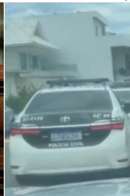
O cantor também não estava em nenhum dos endereços