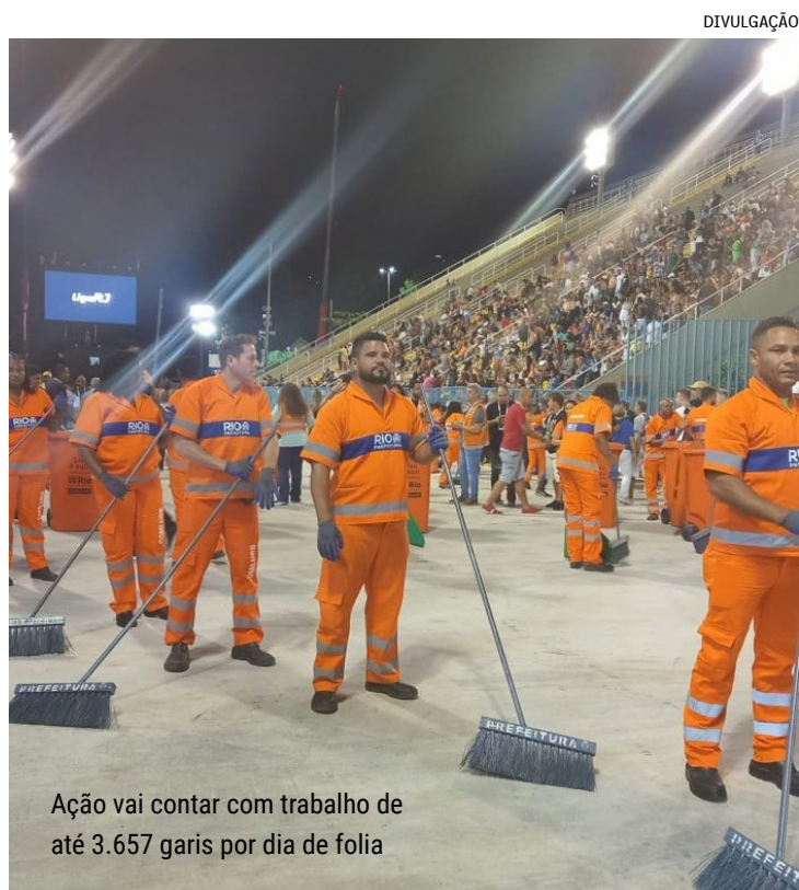
Ação vai contar com trabalho de até 3.657 garis por dia de folia