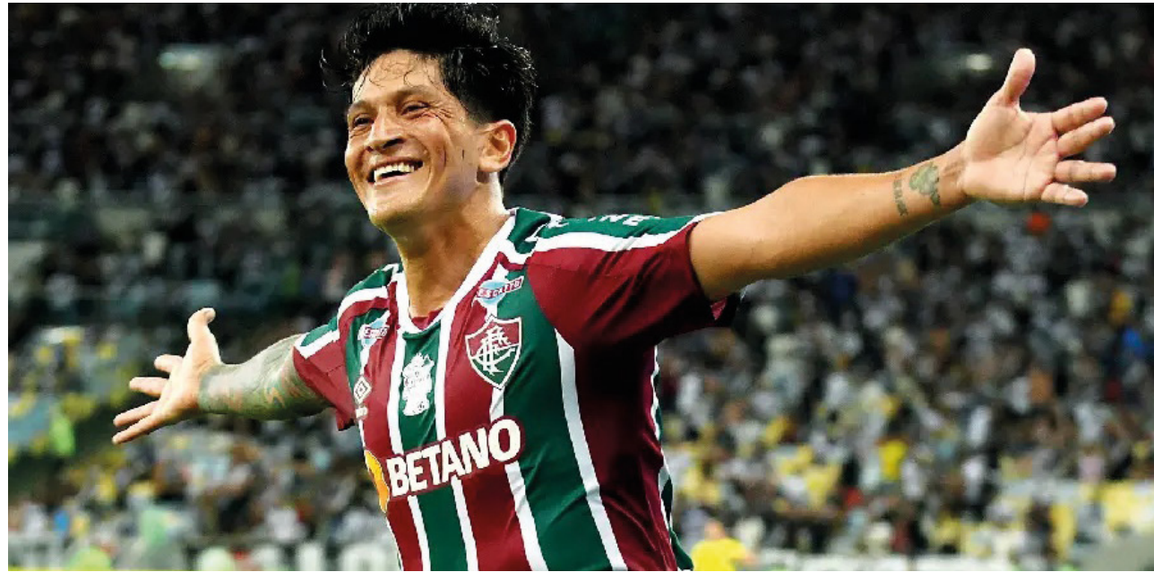
Quase sempre com um toque na bola, o goleador argentino supera os adversários. Por mais golaços e menos violência dentro e fora dos estádios

Ontem mesmo fui ao Maracanã com um casal de amigos franceses para assistir Vasco x Fluminense e, mesmo de camarote, tive que fazer uma série de recomendações e prepará-los psicologicamente para o clima das torcidas. Para evitar o tumulto no fim do jogo, cos-