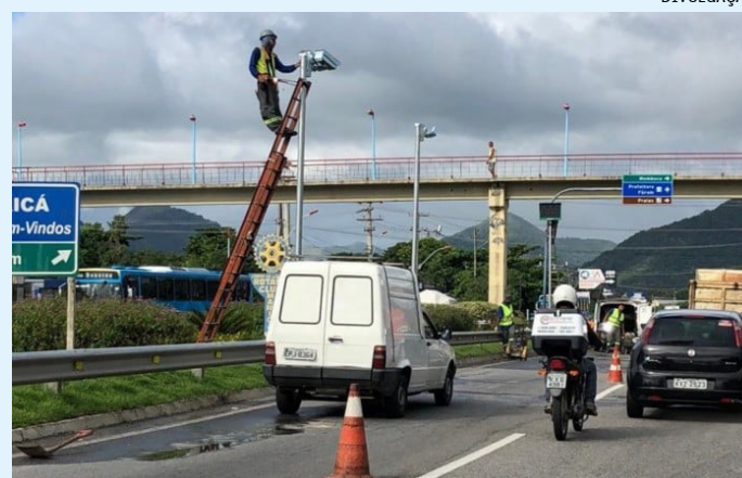
Operação contará com apoio de agentes do Batalhão de Polícia Rodoviária (BPRV) em diferentes pontos do estado

“Equipes do Departamento de Estradas de Rodagem vão trabalhar durante todo o período de carnaval monitorando e supervisionando também as intervenções nas rodovias estaduais