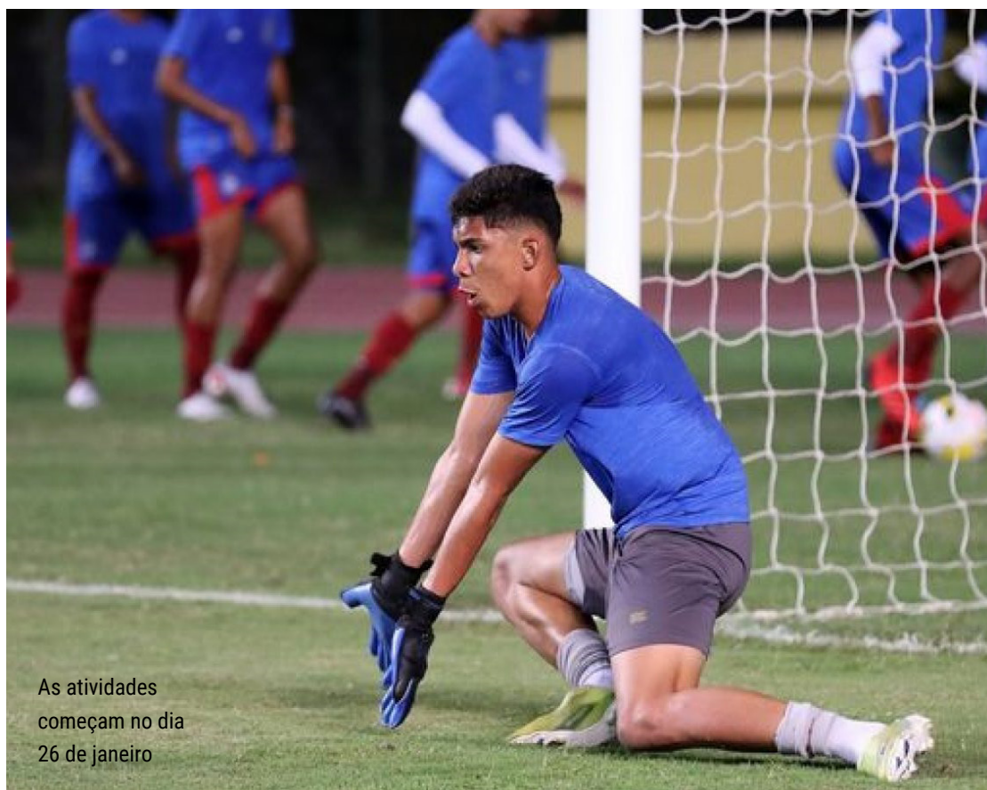
As atividades começam no dia 26 de janeiro

O técnico Phelipe Leal convocou a Seleção Brasileira sub-17 para um período de treinos de olho no Sul-Americano. As atividades começam no dia 26 de janeiro e terminam no dia 4 de fevereiro.