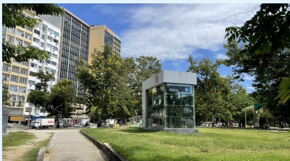
Bairro fazia parte da Zona Sul; determinação foi publicada em diário oficial

No ano passado, a prefeitura anunciou um projeto de revitalização para o bairro da Glória. O projeto, que recebeu o nome de "Dias de Glória", tem como ideia a instalação de totens e placas indicativas em 40 pontos de interesse turístico na região.