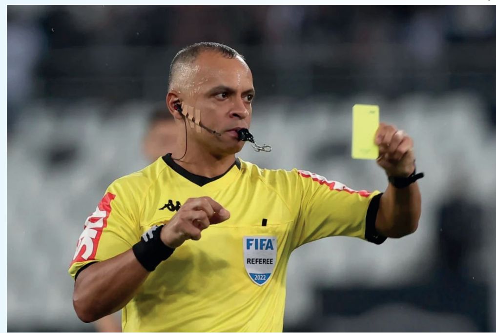
Wilton Pereira Sampaio

A partida entre Flamengo e Palmeiras vai acontecer no dia 28 de janeiro, às 16h30, no Estádio Mané Garrincha, em Brasília. O Rubro-Negro brigará pelo seu terceiro título da competição, enquanto o Alviverde busca o triunfo inédito.