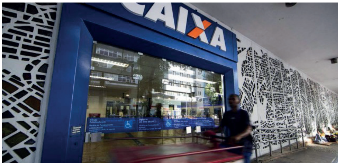
Vagas são para estudantes de níveis médio, técnico e superior

dantes devem estar regularmente matriculados em instituições de ensino públicas ou privadas, com frequência efetiva nos cursos de ensino médio regular, ensino médio EJA, técnico e superior, com reconhecimento do Ministério da Educação.