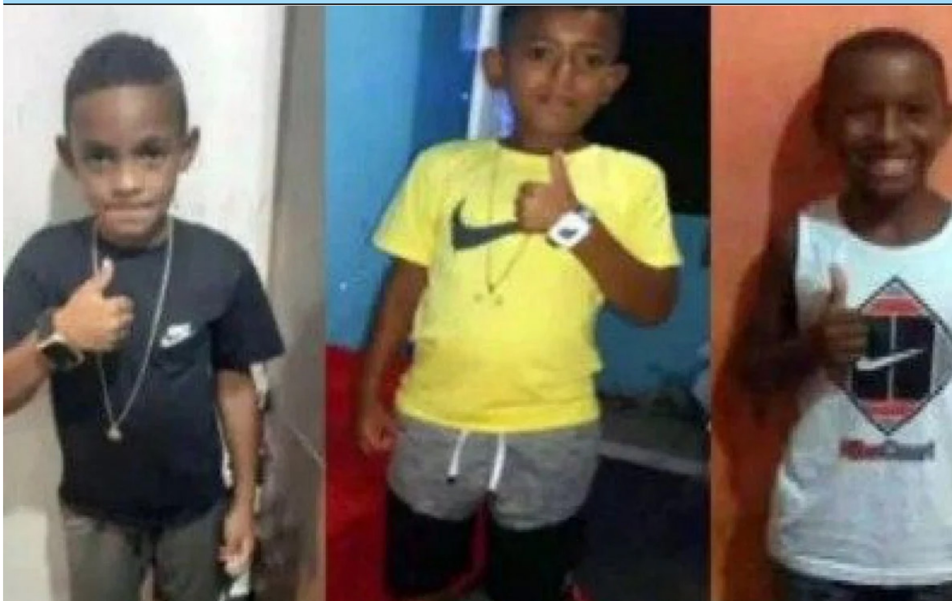
As três crianças desaparecem em dezembro de 2020 e até hoje os corpos não foram encontrados