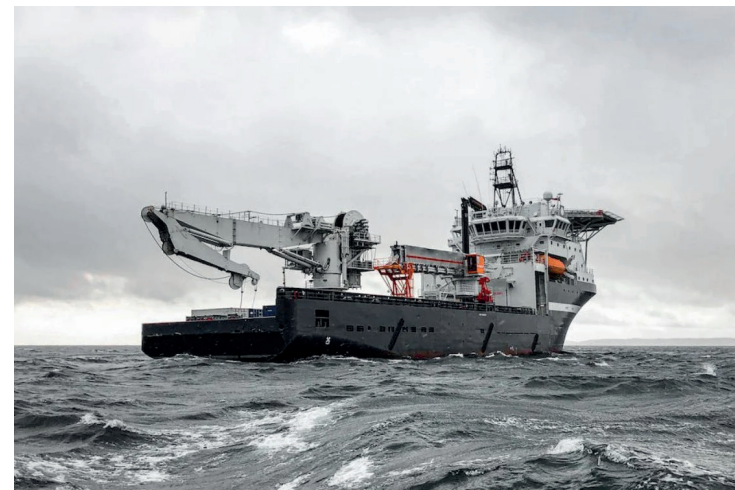
Níveis de escolaridade para ocupar os cargos disponíveis vão do ensino médio ao superior; há oportunidades ainda para trainee e estágios

Além da bolsa-auxílio, os selecionados vão receber um auxílio-transporte de R$ 130. Segundo a Caixa, o estágio não contempla outros benefícios, como auxílio-alimentação, saúde e/ou similares.