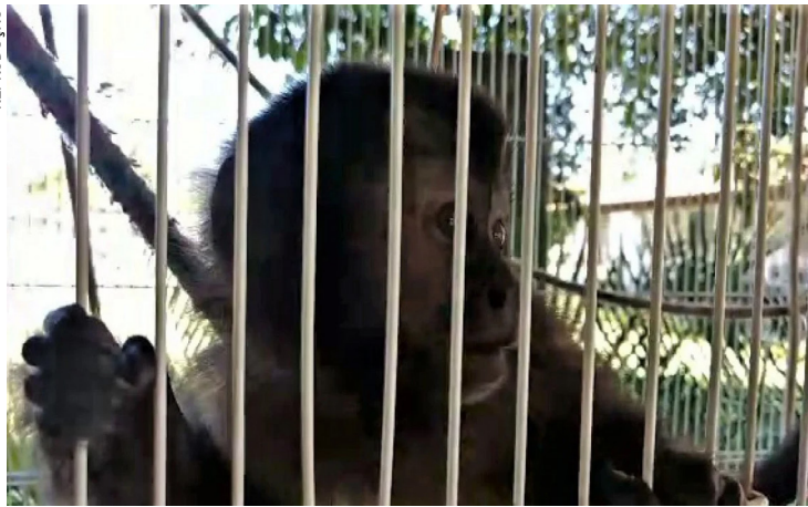
Quatro macacos-prego e duas araras-canindé foram apreendidos

Agentes da Polícia Federal prenderam, em ação conjunta com fiscais do Ibama, uma estudante de veterinária pelo comércio irregular de animais silvestres na Região Metropolitana do Rio. Quatro macacos-prego e duas araras-canindé foram apreendidos.