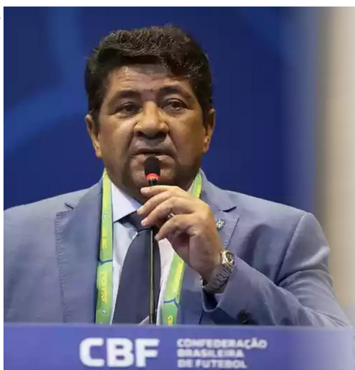
A ideia é que o Brasil já conheça seu novo comandante em março

"Pode até ser que aconteça isso (interino), mas quero até março ter um nome definitivo. Não um provisório para ter que substituir. Será que define até 31 de janeiro? Pode ser que tenhamos. Estamos começando o trabalho a partir de agora. Mas pode ser que não tenha. E, se não tiver, não está atrasado", concluiu.