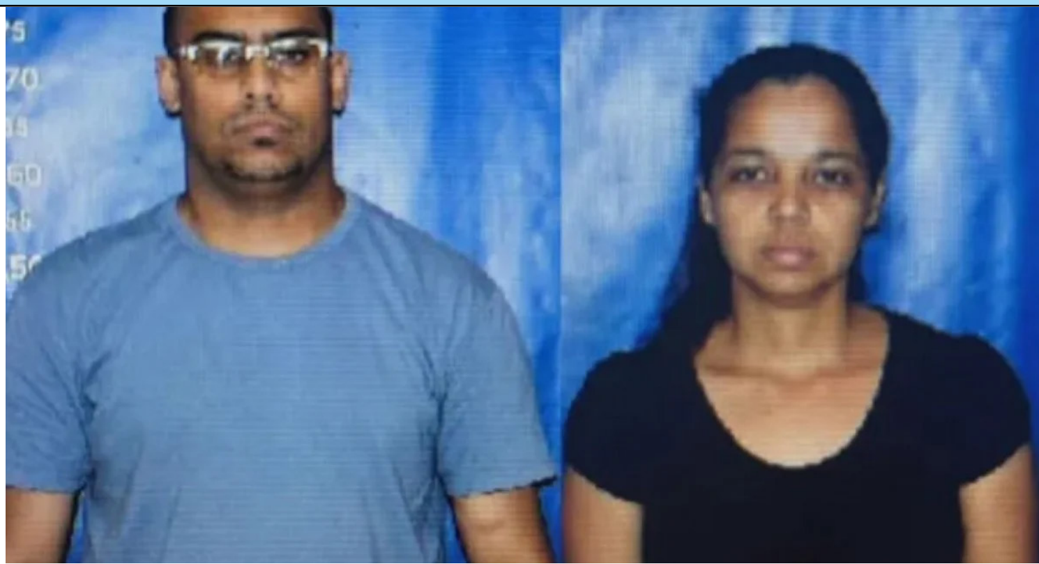
Caso ocorreu em Bonsucesso, na Zona Norte. A vítima chegou a ser ameaçada