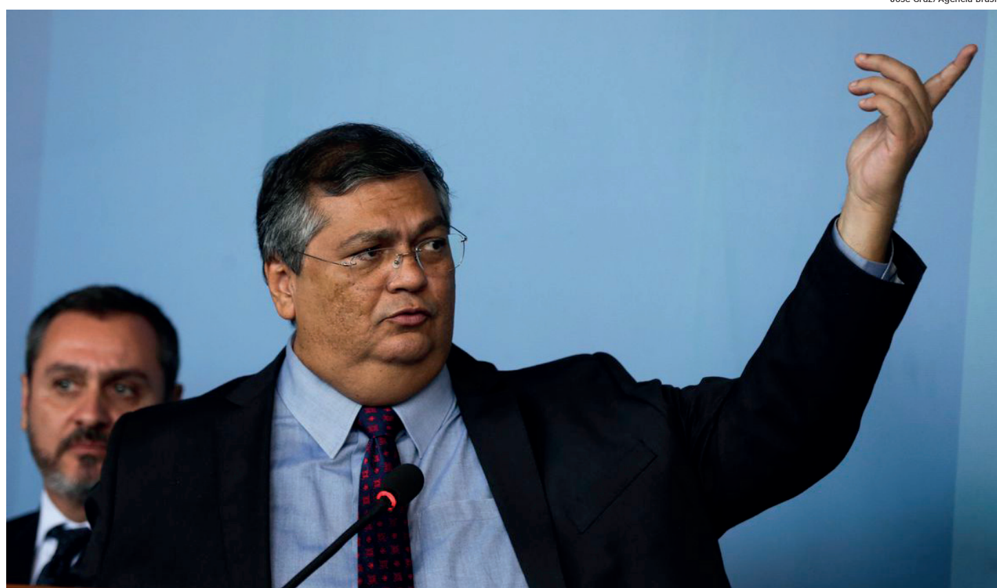
Proposta de sindicatos e Fenaj foi acolhida por Flávio Dino

A Fenaj sugere que o órgão seja composto por representantes dos ministérios da Justiça, dos Direitos Humanos e da Secretaria de Comunicação Social da Presidência da República, além de representantes da sociedade civil organizada, como a própria federação, a Associação Brasileira de Imprensa (ABI), a Abraj, a entidade representante de professores e pesquisadores de jornalismo, além de representações patronais, como a Associação Nacional de Jornais (ANJ) e Associação Brasileira de Emissoras de Rádio e Televisão (Abert).