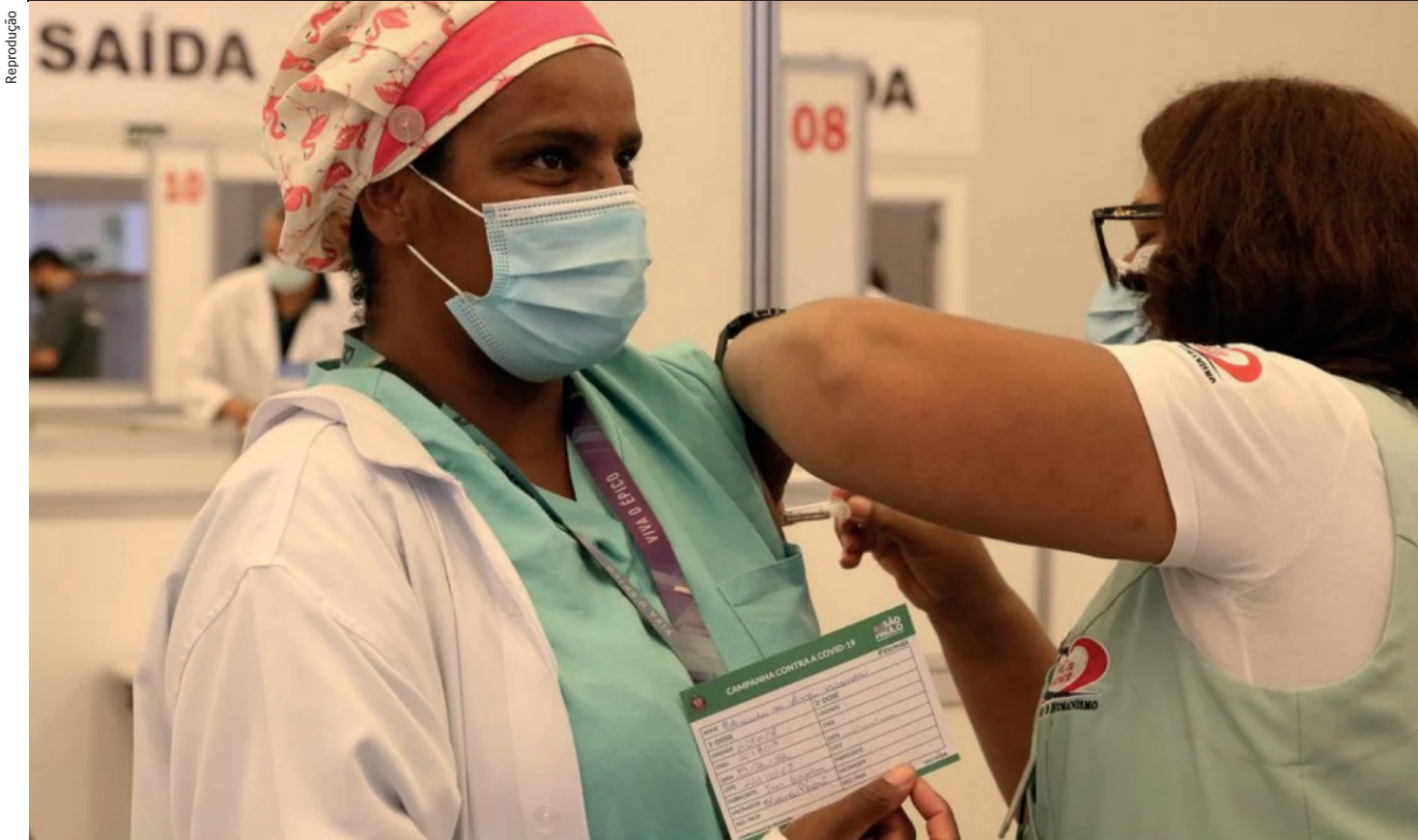
Ministra da Saúde, Nísia Trindade, lembrou que a pandemia não acabou e reforçou a importância de completar o esquema vacinal contra a doença