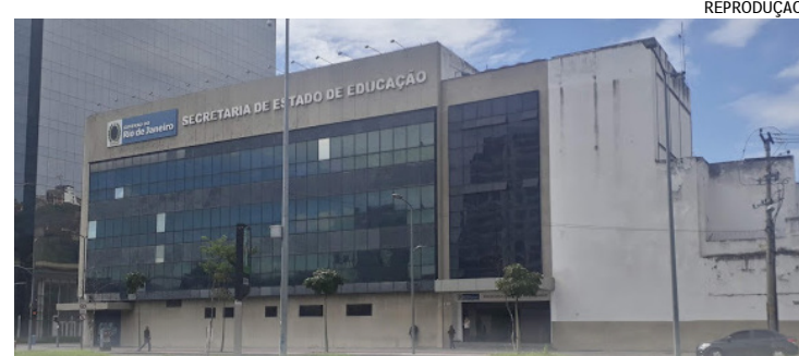
Prédio está cheio de rachaduras e, segundo funcionários, já teve o terceiro andar interditado. Secretaria diz que já fez obras emergenciais e tomou todas as medidas para garantir segurança de funcionários

Na parte interna do prédio, são péssimas as condições de trabalho no local. Fiação exposta, paredes quebradas, teto sem forro, infiltrações e