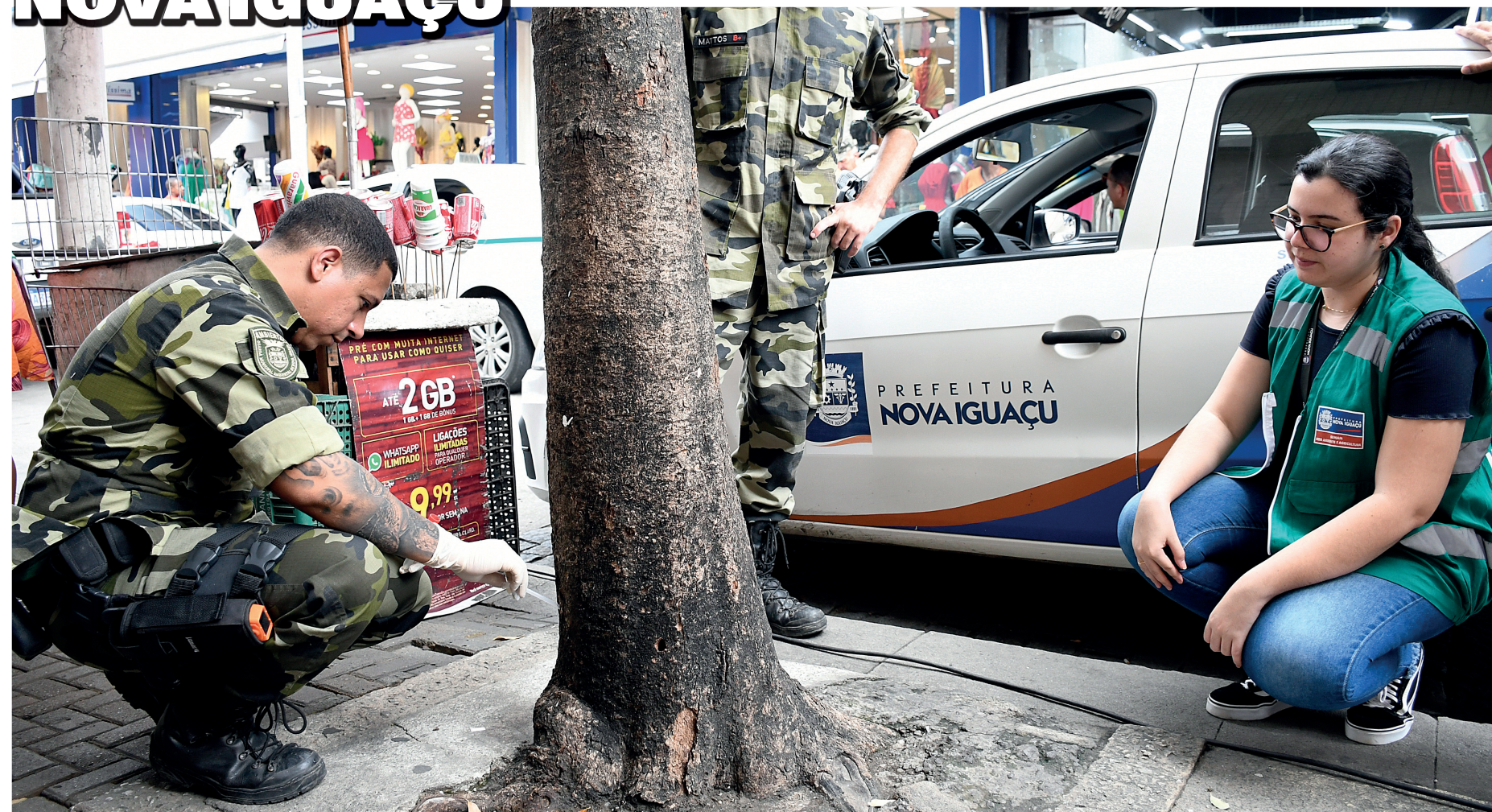
O material será enviado para análise laboratorial