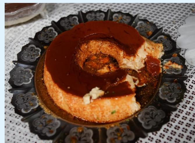
O grupo devorou a sobremesa, e a cápsula foi guardada como lembrança do livramento

Numa comparação com o Réveillon de 2019/2020 — o último em que houve shows, antes da pandemia — houve uma acentuada queda nos registros de lesão corporal (-73%), roubo de rua (-83%) e furto a transeunte (-85%).