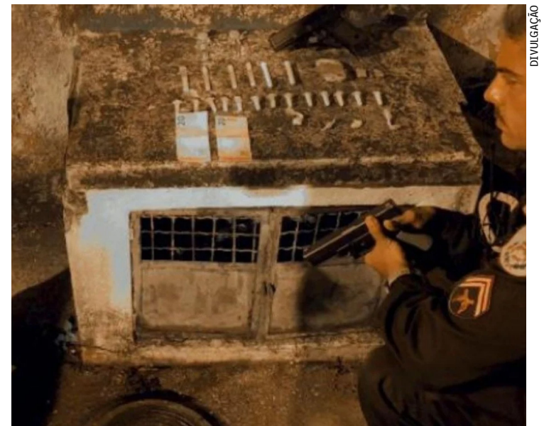
Homem estava em posse do simulacro de arma de fogo e de uma sacola contendo material entorpecente

A ocorrência foi apresentada na 106ª DP, em Itaipava, onde o acusado foi autuado por tráfico de drogas, permanecendo preso em flagrante conforme prevê o Art. 33 da Lei 11.343/06.