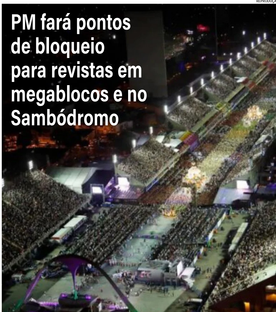
Prática obteve sucesso durante o Réveillon, apreendendo 179 objetos perfurocortantes

A Polícia Militar vai implantar pontos de bloqueio para revistas nas áreas dos megablocos e no entorno do Sambódromo nos dias de desfile das escolas do Grupo A e do Grupo Especial. Como ocorreu durante o Réveillon em Copacabana, a revista contará com agentes equi-