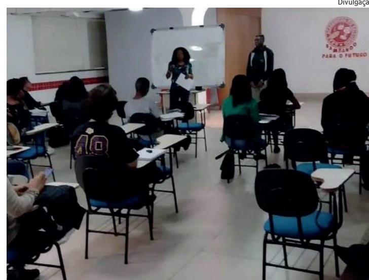
Gratuitas, as aulas do projeto Sambando para o Futuro são aos sábados, entre 8h e 14h, na quadra da escola de samba, no Andaraí, Zona Norte do Rio

Aos interessados, é preciso ter disponibilidade aos sábados, das 8h às 14h. Voluntários devem entrar em contato pelo telefone (21)98538-0224.