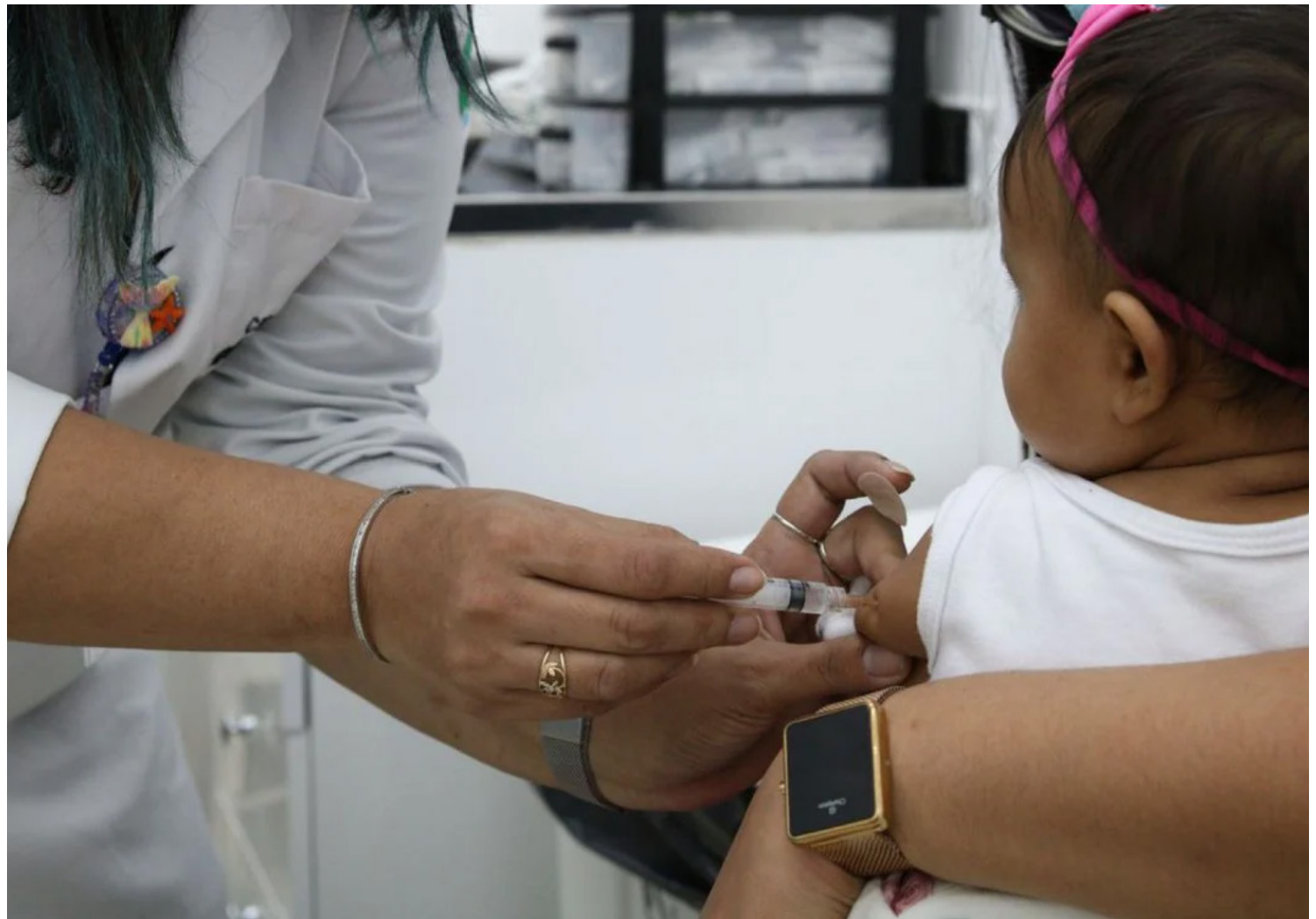
Segundo a pasta, a orientação considera estudos científicos que apontam aumento da proteção com a dose complementar

A pasta também recomenda a administração simultânea de vacinas contra a covid-19 com outros imunizantes do calendário vacinal infantil.