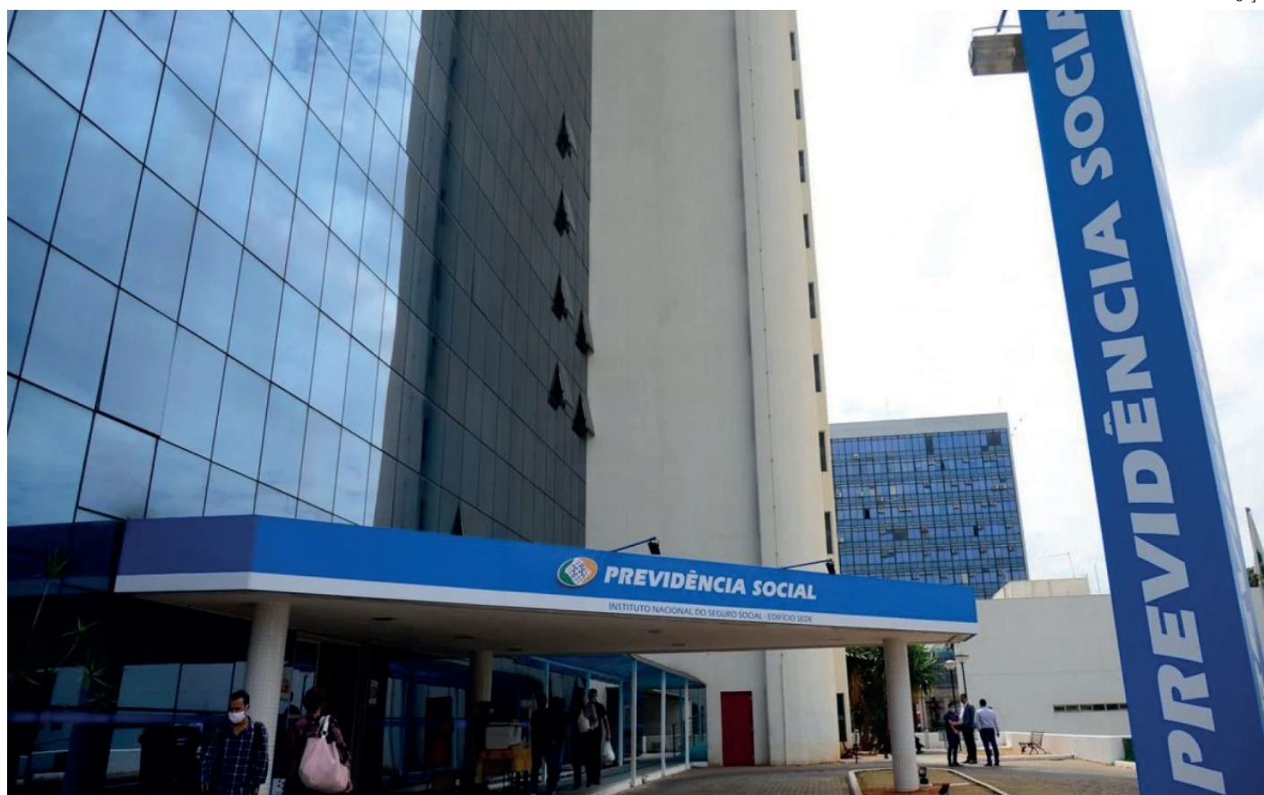
Novo ministro do Trabalho, Luiz Marinho, afirmou que um novo edital seria necessário pela falta de funcionários

O desmonte promovido pelo atual governo deixou como herança uma fila de 5 milhões de pessoas esperando análise do INSS. Teremos muito trabalho pela frente e temos um compromisso com o povo brasileiro. Vamos juntos atuar para garantir direitos e dignidade para a população.