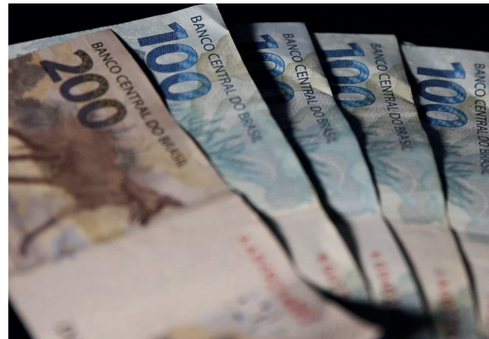
Aumento de 11,5% em relação a 2021