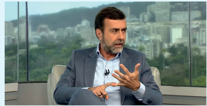
Ele foi candidato derrotado ao Governo do RJ e escolhido para presidir a Agência Brasileira de Promoção Internacional do Turismo (Embratur)