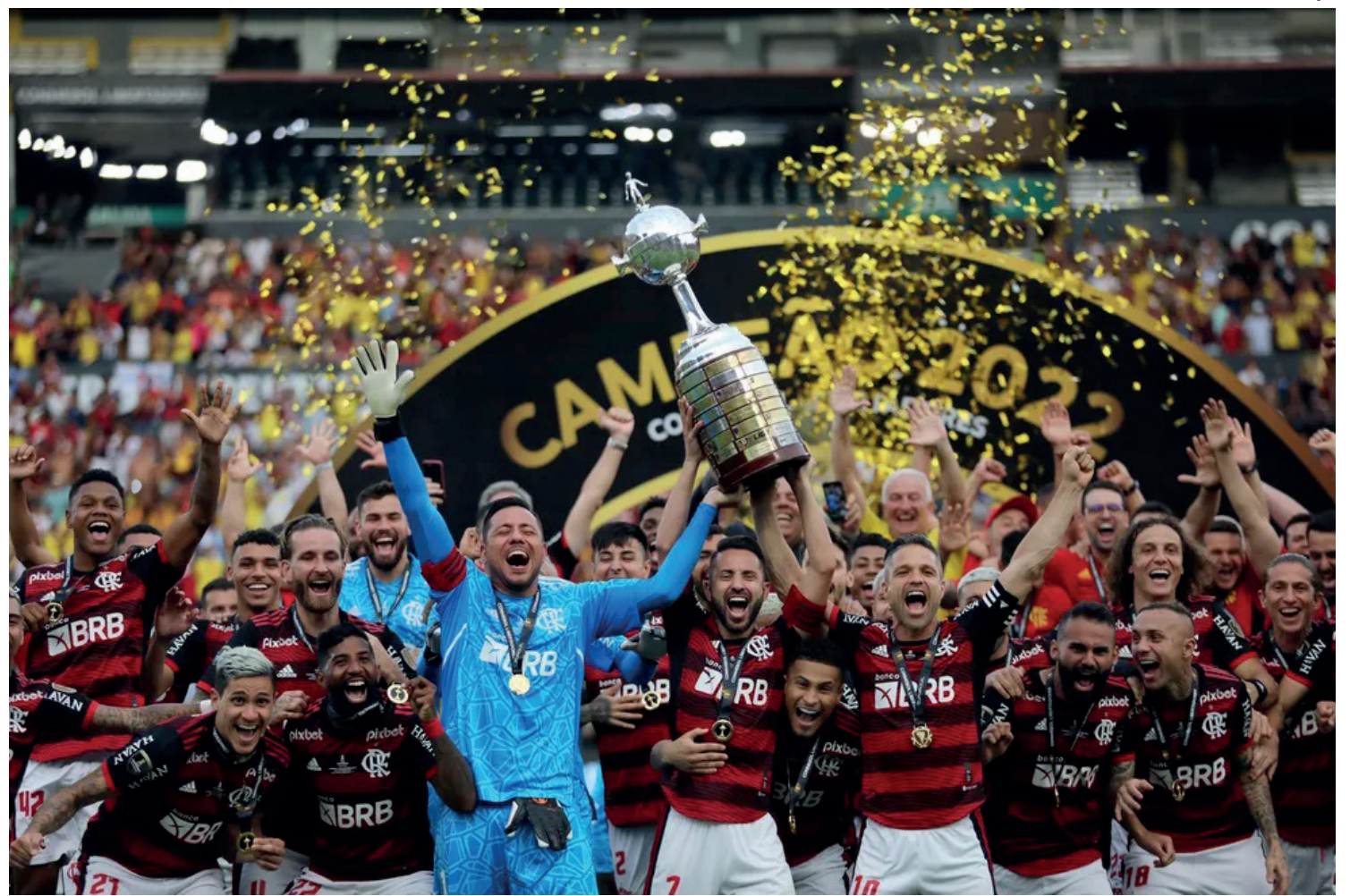
Semifinais serão disputadas nos dias 7 e 8 de fevereiro, e final no dia 11

Flamengo Real Madrid Al Ahly (Egito) Al Hilal (Arábia Saudita) Auckland City (Nova Zelândia) Seattle Sounders (Estados Unidos) Wydad (Marrocos)