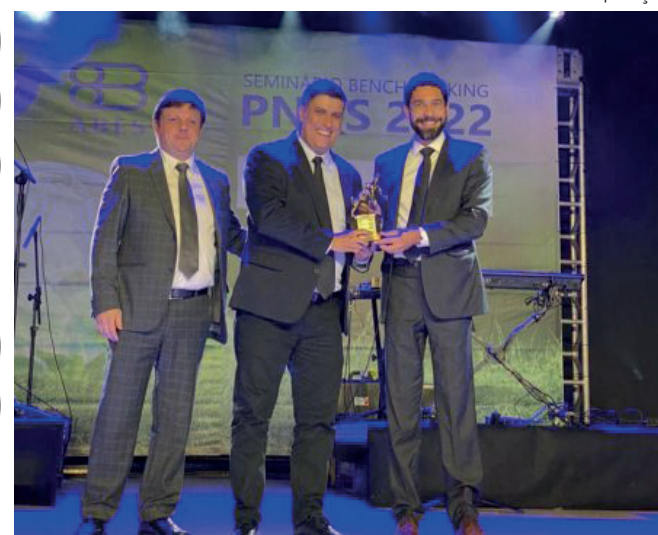
Prêmio Nacional da Qualidade em Saneamento reconhece gestões bem sucedidas do setor