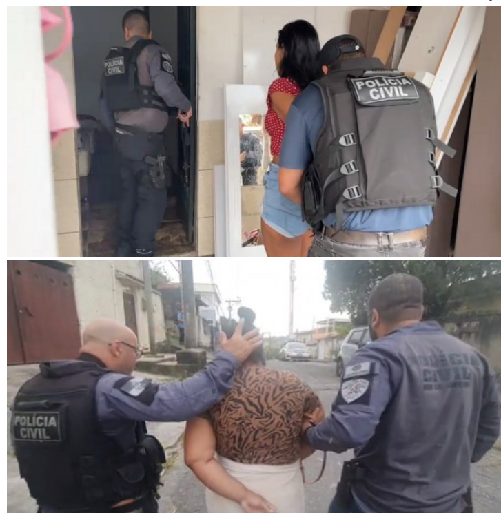
Grupo enganava e usava o nome de idosos e pessoas com pouca instrução para movimentações bancárias

O grupo é investigado há seis meses e chegou a ser alvo de outra ação, que cumpriu mandado de busca e apreensão