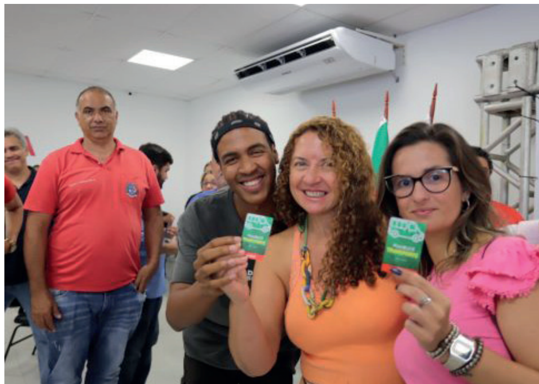
Ação amplia a tarifa zero no município com oferta de mais de 355 mil viagens mensais gratuitas à população nas 15 linhas de vans da cidade

De acordo com o cronograma estabelecido pela Secre-