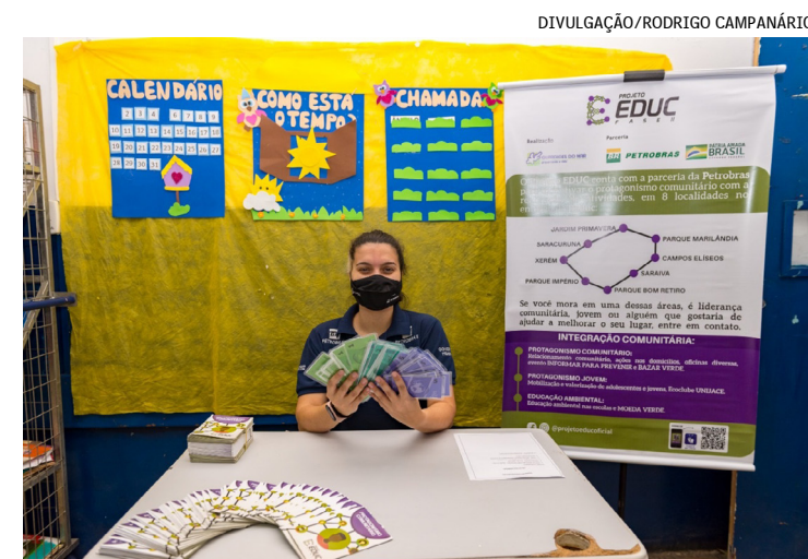
Público poderá "comprar" itens por meio da moeda verde EduCoin, que será adquirida mediante a troca por materiais plásticos recicláveis

O evento também contará com brincadeiras, apresentações artísticas, exposição de animais marinhos in vitro e atividades de cuidados pessoais e beleza, realizadas pela