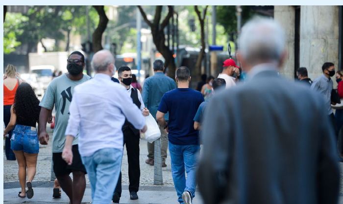
Associação de cartórios diz que aumento é três vezes maior que o usual

Na comparação com os anos de auge da pandemia, houve uma redução de 20,7% em relação ao mesmo período de 2021, quando foram registrados 161.209 óbitos no estado, e de 8,9% em comparação com janeiro a outubro de 2020, que somou 140.412 mortes.