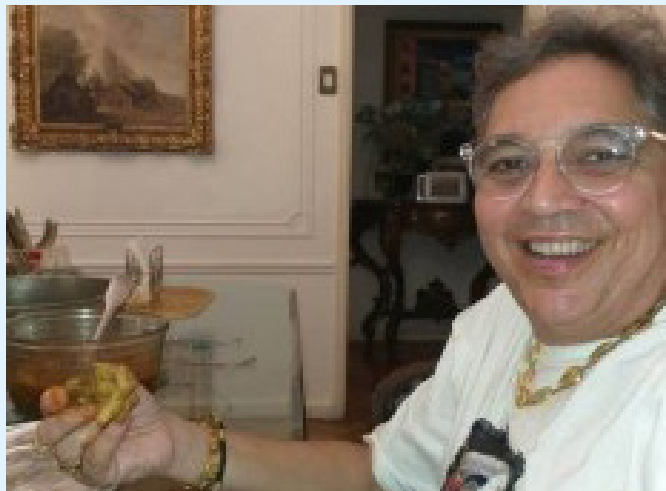
Corpo de Roberto de Aquino Leite foi encontrado em seu apartamento na Zona Sul