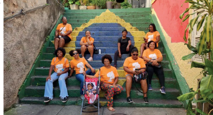
Ação acontece através do programa 'Respeito dá o Tom'