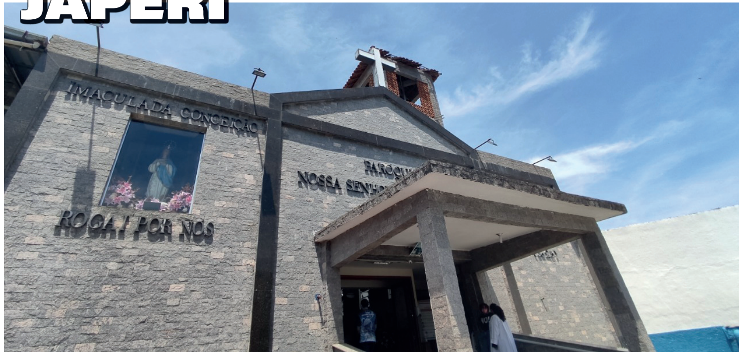
O palco será montado em frente a igreja