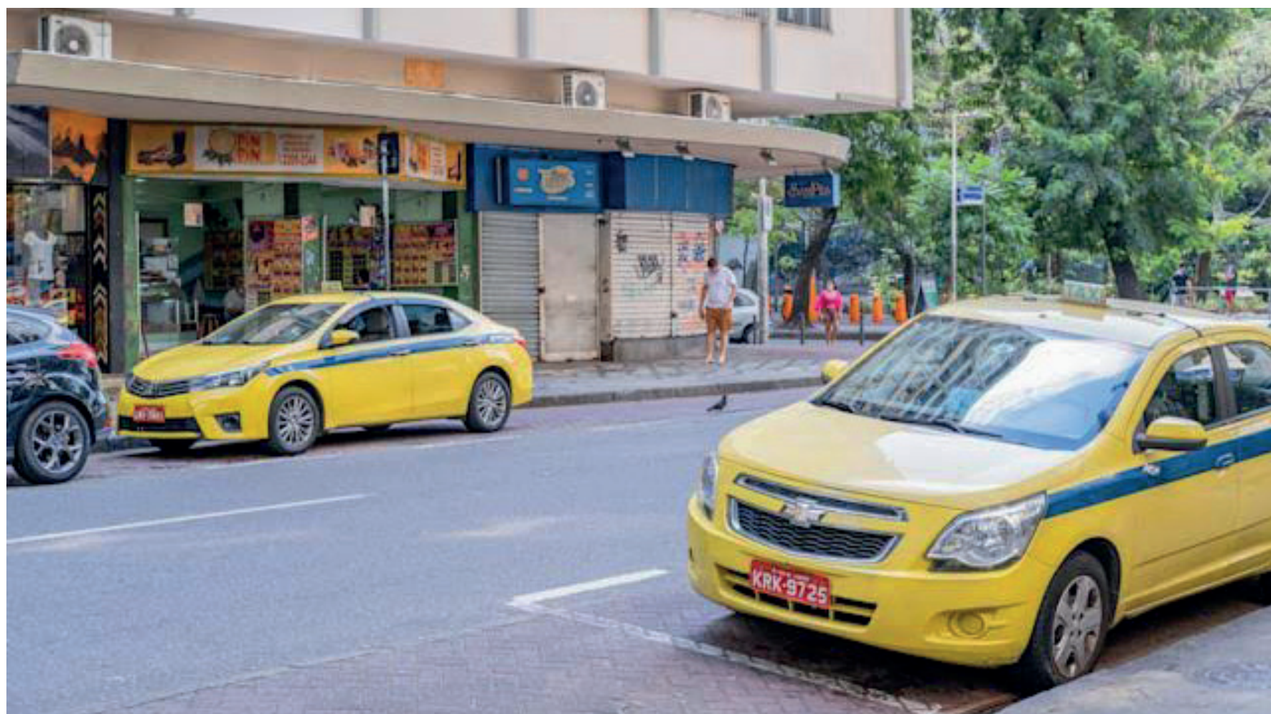
O auxílio para taxista é destinado a motoristas de táxi registrados nas prefeituras

Nos dois casos, também é preciso ter CPF e Carteira Nacional de Habilitação (CNH) válidos. Cada CPF tem direito a apenas um auxílio, ainda que o beneficiário