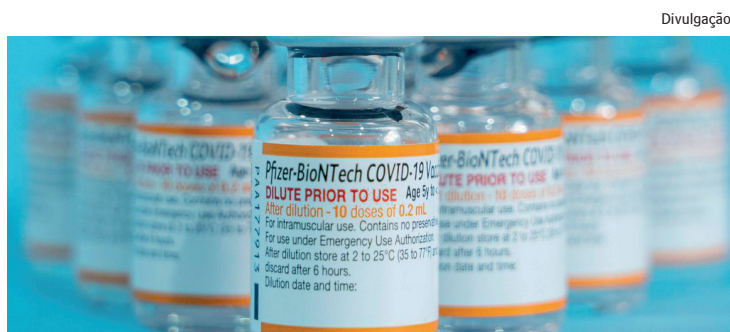
Objetivo é imunizar menores de 5 anos

A nova versão, proposta pelo relator, mantém a permissão para o governo gastar, fora do teto, o excesso de arrecadação deste ano, limitando a despesa a R$ 23 bilhões.