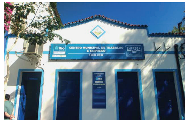
Currículo deve ser enviado por email

Os candidatos também podem comparecer a um dos sete Centros Municipais de Emprego, das 8 às 16h, que ficam em Campo Grande (Rua Coxilha, s/n; Horário de funcionamento: 8h às 16h), Engenho Novo (Rua Vinte Quatro de Maio, 921), Ilha do Governador (Estrada do Dendê, 2080), Santa Cruz (Rua Lopes de Moura, 58), Tijuca (Rua Camaragibe, 25), Centro (Av. Presidente Vargas, 1.997, CIAD- exclu-