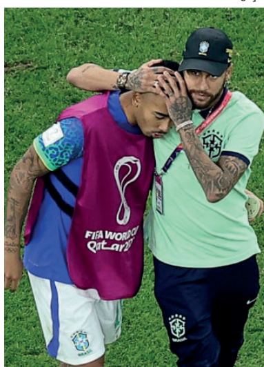
Cortado da Copa do Mundo, atacante foi operado nesta terça-feira