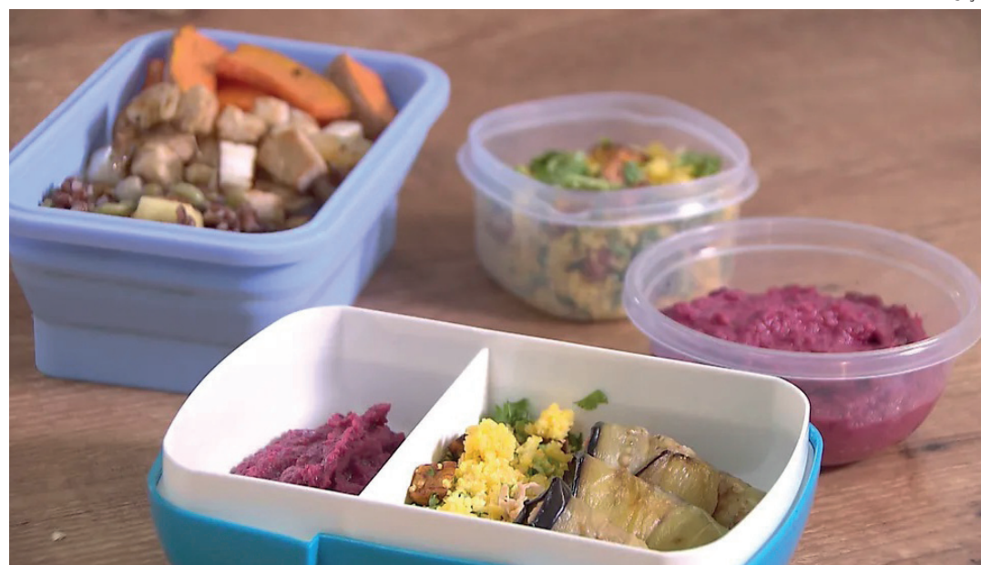
Número de trabalhadores que optaram pela comida levada de casa subiu 12,3% em um ano, segundo a Kantar

A sondagem da Kantar apontou também que a volta