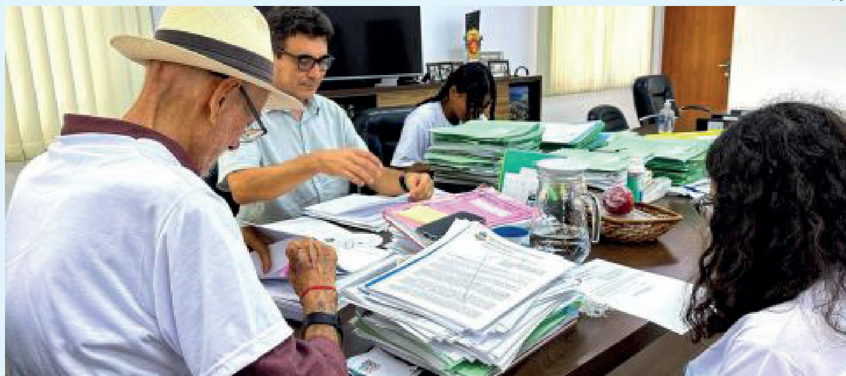
Repasso extra de R$ 220 deverá ser feito antes do Natal, após a aprovação do Poder Legislativo e a sanção do prefeito

O prefeito de Cabo Frio, José Bonifácio, enviou à Câmara Municipal um Projeto de Lei que institui o pagamento de uma 13ª parcela às famílias beneficiadas pela Moeda Social Itajuru. O objetivo é que a recarga extra, já com o valor reajustado de 220 itajurus (R$ 220), seja feita após a aprovação do Projeto de Lei na Casa Legislativa e a posterior sanção do prefeito. A mensagem legislativa foi assinada pelo prefeito na