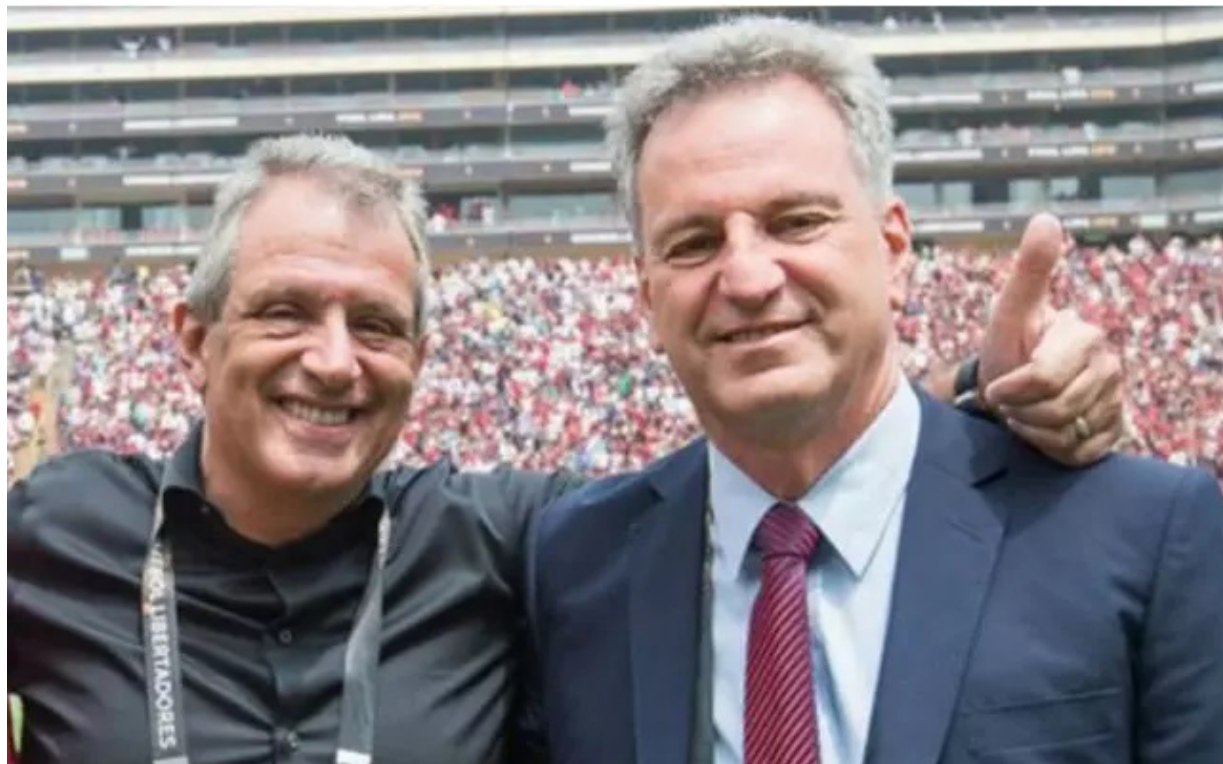
Palestra acontecerá das 18h30 às 20h30

As finanças do Flamengo vão muito bem, obrigado. Porém, engana-se quem pensa que a atual diretoria está fechada para novos modelos de gestão. Isso porque, o Rubro-Negro está analisando a movimentação dos clubes brasileiros, que estão se tornando empresas. Por isso, o Fla organizou palestra para entender melhor as “SAF’s”.