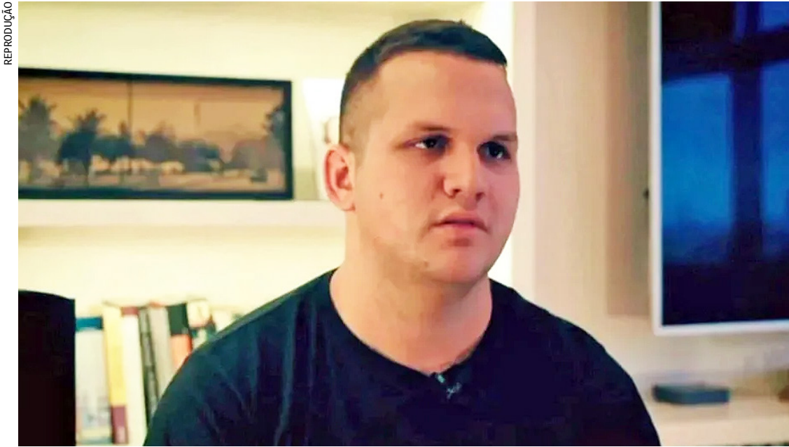
Sérgio Cabral está preso no Batalhão Especial Prisional (BEP) da PM, em Niterói, normalmente destinado a autoridades e a policiais