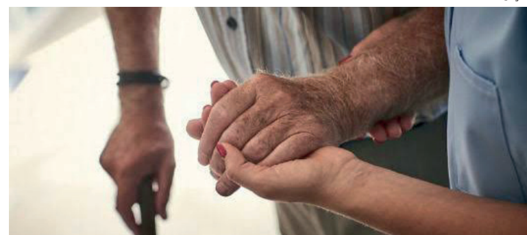
Cuidadores só poderão administrar medicamentos por via oral e que tenham sido prescritos por um profissional de saúde