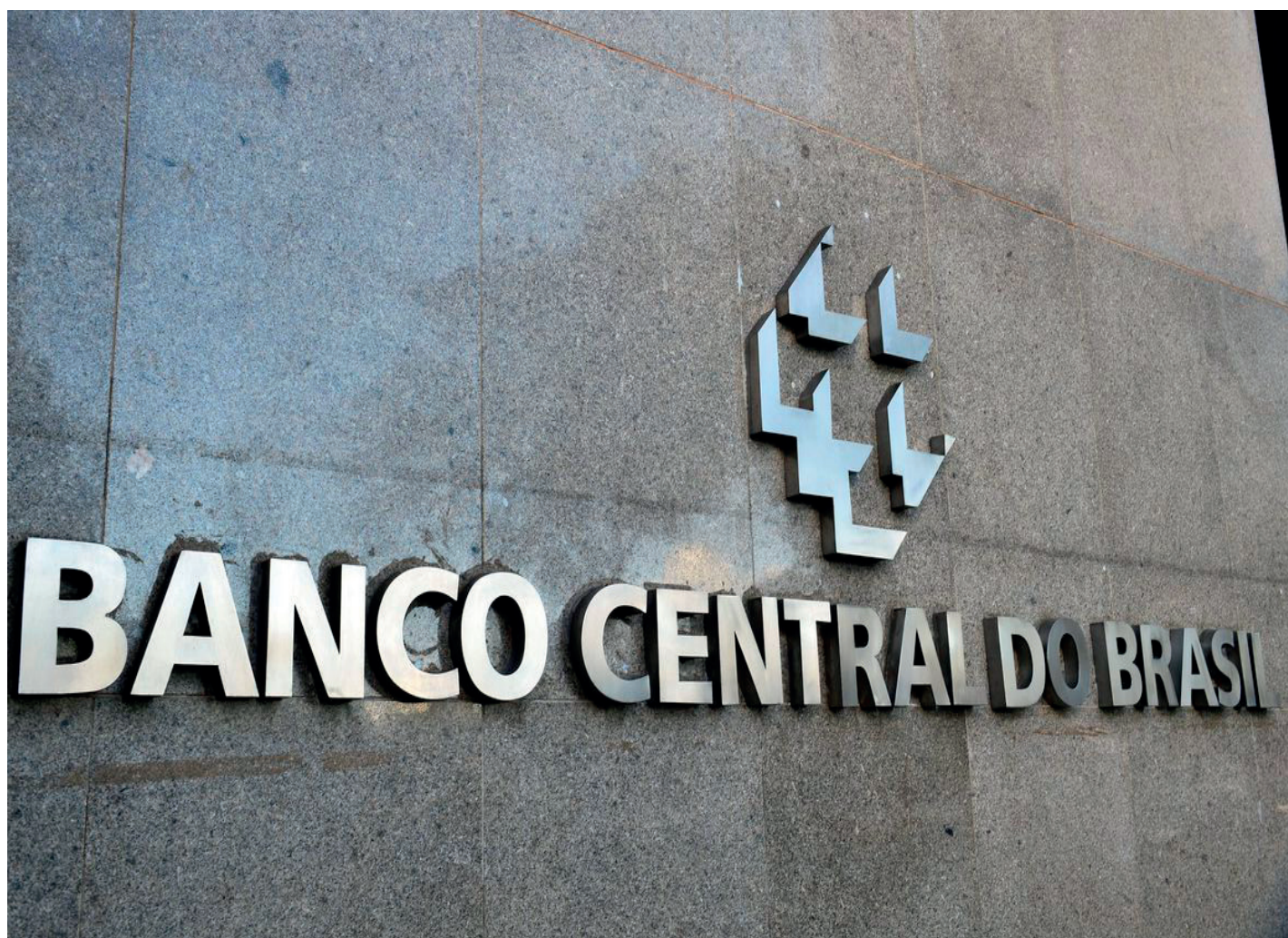
BC, Procon e vários órgãos promovem ação conjunta

Entre 2020 e 2022, por meio de iniciativas como esta, mais de 22 milhões de contratos em atraso foram repactuados, superando R$ 1,1 trilhão de saldo negociado. Na edição mais recente do mutirão, que durou 25 dias – de 7 a 31 de março –, 1,7 milhão de contratos foram renegociados.