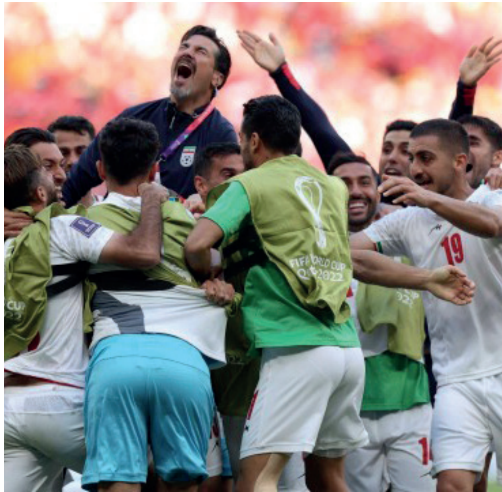
Seleção mantém chance de conseguir uma vaga às oitavas de final

O anfitrião Catar e a atual campeã africana Senegal entraram no Estádio Al Zumamama pressionados a vencer depois das derrotas na primeira rodada. Essa necessidade de somar os três pontos fez com que o jogo fosse aberto desde o apito inicial. Esse ímpeto ofensivo dos dois lados até fez com que faltasse uma maior organização defensiva. A partida foi marcada por uma troca de golpes e transições ofensivas com espaços para os dois lados.