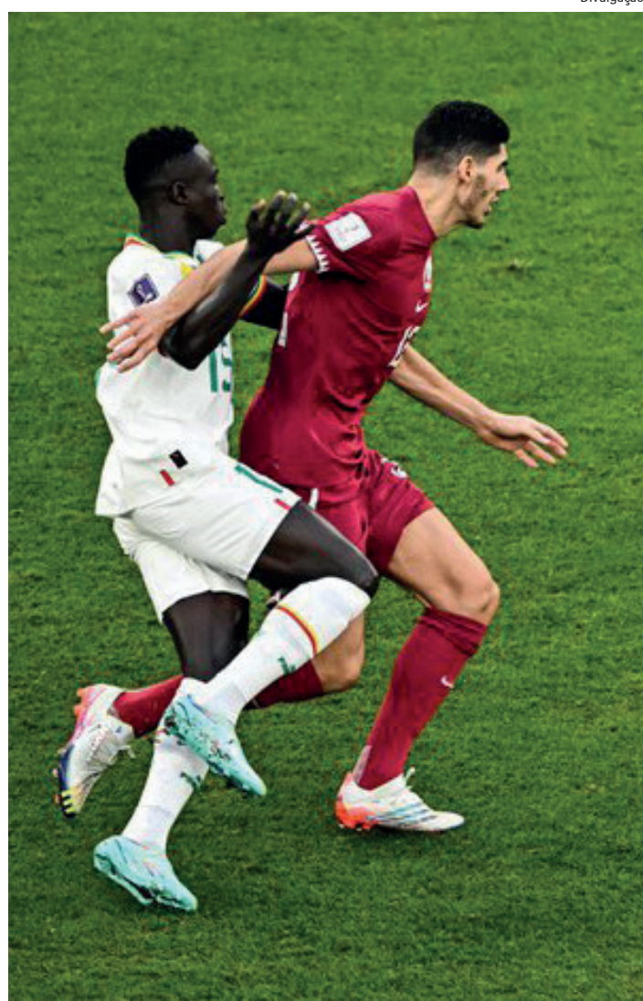
A equipe asiática puniu os galeses duas vezes nos acréscimos

pontos que a Suíça, mas com vantagem no saldo de gols. As seleções se enfrentam na segunda-feira, às 13h (de Brasília), no Estádio 974.