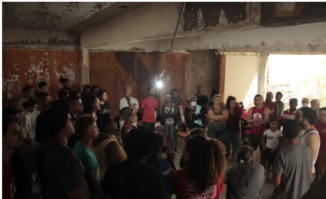
Movimento de Luta nos Bairros, Vilas e Favelas diz que cerca de 70 famílias vivem no edifício na Rua Alcântara Machado, 24. Entre os ocupantes estão 6 crianças, 2 bebês e 15 idosos

Na decisão, a juíza Silvia Regina Portes Criscuolo destacou que “o fato de que o imóvel ocupado é contíguo ao prédio do Banco Central demonstrou temor quanto à ocupação, já que em seu edifício promove a guarda, armazenagem e acautelamento de