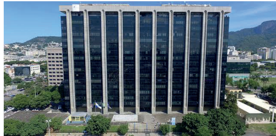
Segundo a prefeitura, os servidores optantes pelo vale-alimentação receberão um crédito adicional no próprio cartão que já possuem

Em 2021, o benefício de Natal — também no valor de R$ 200 — foi concedido a 135.416 funcionários públicos, com salário bruto de até R$ 7,7 mil.