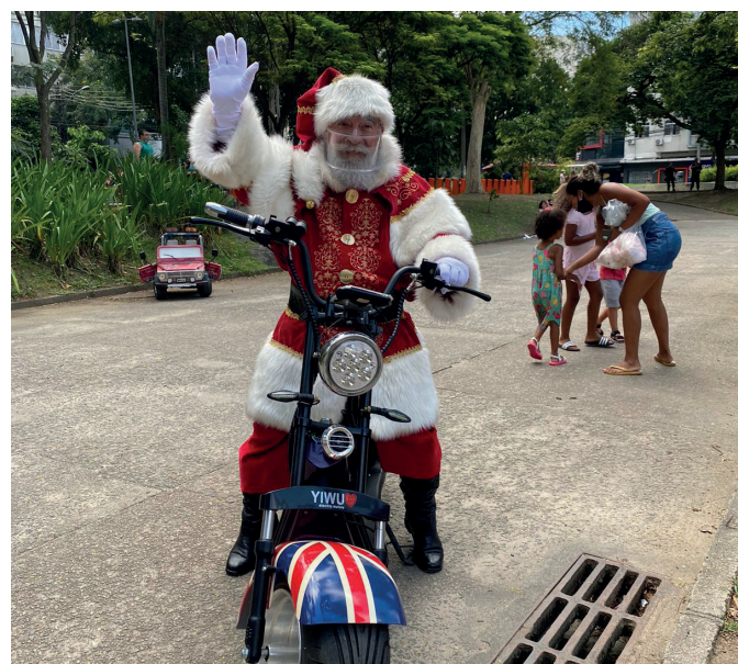
Papai Noel vai chegar na Praça Afonso Pena, às 10h