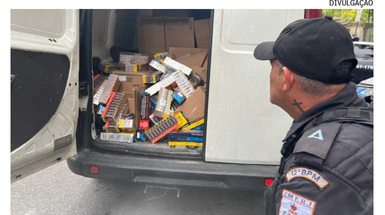
Dois criminosos abordaram um motorista que realizava o transporte de mercadoria na RJ-106, altura de Inoã. Um assaltante conseguiu fugir