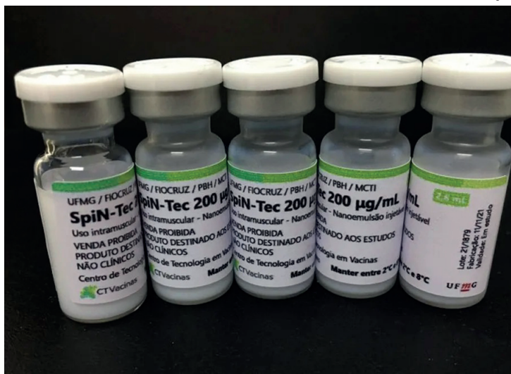
São necessários 72 voluntários para a fase 1 e 360 para a fase 2