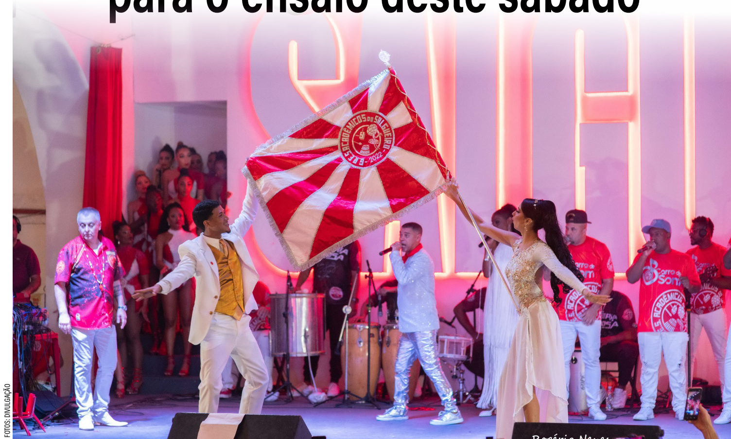
Escolas se apresentarão com todos os segmentos em mas uma noite de muito samba

Já na contagem regressiva para o fim de ano, a quadra do Salgueiro vai abrir suas portas para mais uma edição do Salgueiro Convida recebendo mais duas escolas de samba que trazem em sua trajetória vitoriosa, sambas que marcaram a história do Carnaval. Imperatriz Leopoldinense e Unidos da Tijuca se apresentam no palco da Academia do Samba com todos os seus segmentos, proporcionando ao público mais uma noite inesquecível no período de pré-carnaval.