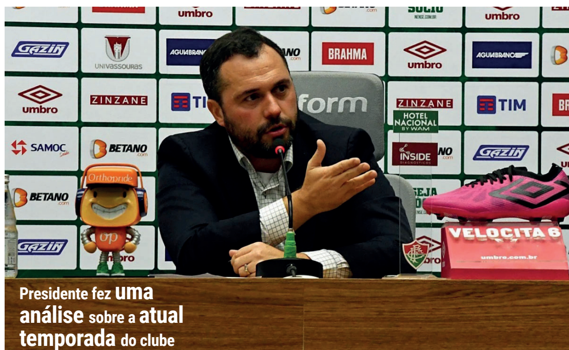
Presidente fez uma análise sobre a atual temporada do clube

“As coisas vão acontecendo. Terceiro ano de gestão, o trabalho se consolidando. Fomos para duas Libertadores e tenho certeza que iremos para a terceira seguida. Vamos ficar nos primeiros colocados e esse ano com uma possibilidade real de sermos campeões. Falei em entrevistas anteriores que se terminássemos com 30 pontos o turno, brigariamos pelo título.