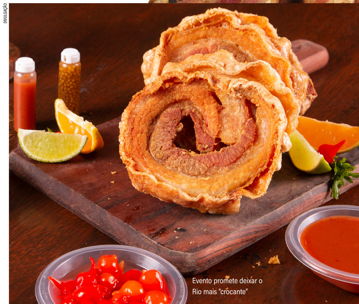
Evento promete deixar o Rio mais "crocante"

O evento mais consagrado no Brasil no quesito carne suína comemora sua 100ª edição, estreando na cidade do Rio de Janeiro, mais precisamente no Uptown Barra. O Festival do Torresmo acontece nos dois primeiros finais de semana de agosto - de 4 a 7/8, e de 11 a 14/8, com a presença confirmada do Embaixador Adan Garcia, chef especialista em carne de porco. A entrada será franca.