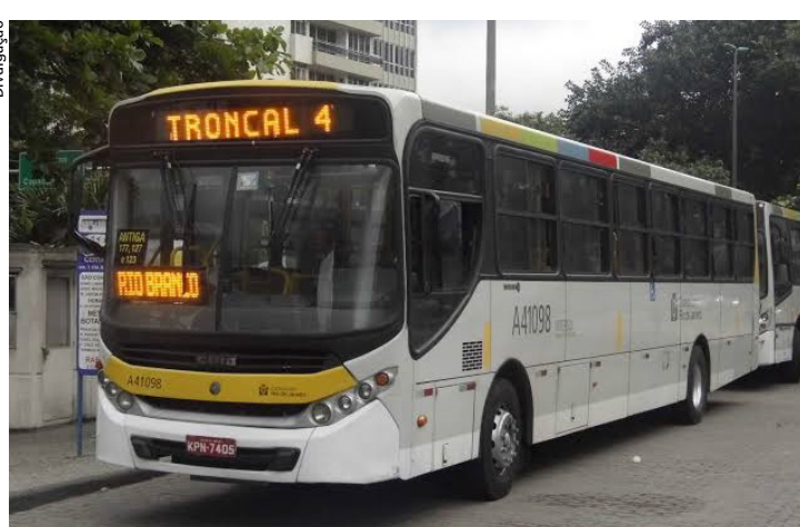
Linhas atendem cerca de 17 bairros

Em dois meses, 39 linhas voltaram às ruas, com cerca de 200 ônibus na frota.