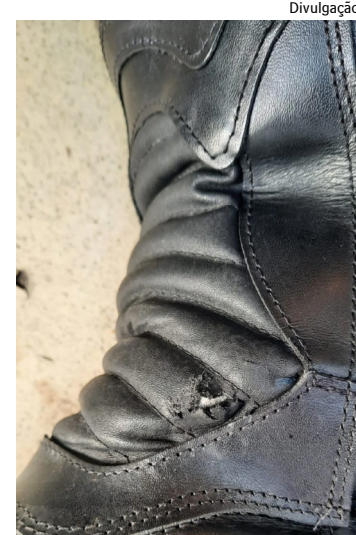
Vítima foi atingida no tornozelo

Na manhã desta quinta, a família da menina afirmou que os médicos informaram que o quadro é “estável, com os sinais vitais bons e não teve alteração” após a cirurgia.