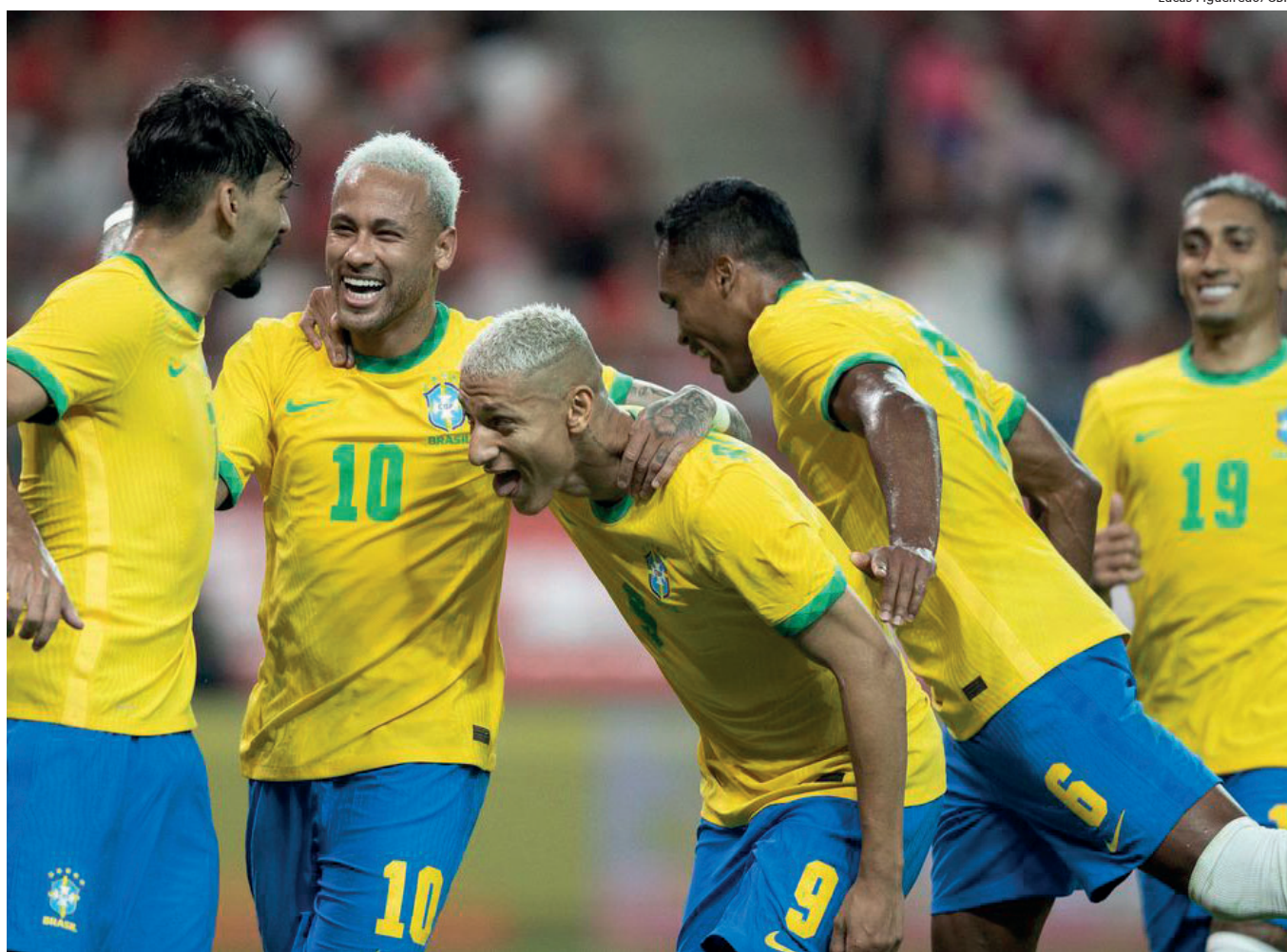
Seleção volta a campo contra o Japão às 7h20 da próxima segunda (6)

A seleção brasileira derrotou a Coreia do Sul por 5 a 1 nesta quinta-feira (2) em amistoso preparatório para a Copa do Mundo do Catar. A partida foi realizada no estádio Copa do Mundo, na capital Seul.