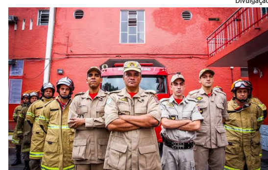
Alerj aprovou projeto de lei

Em abril, o valor médio do gás de cozinha em seis meses chegou a R$ 103,30, e o vale-gás foi de R$ 51. Em maio, a média estava R$ 105,42, mas não houve pagamento do auxílio para a compra de botijão (o que só ocorre a cada dois meses). O valor que será pago agora em junho ainda não foi informado pela pasta da Cidadania.