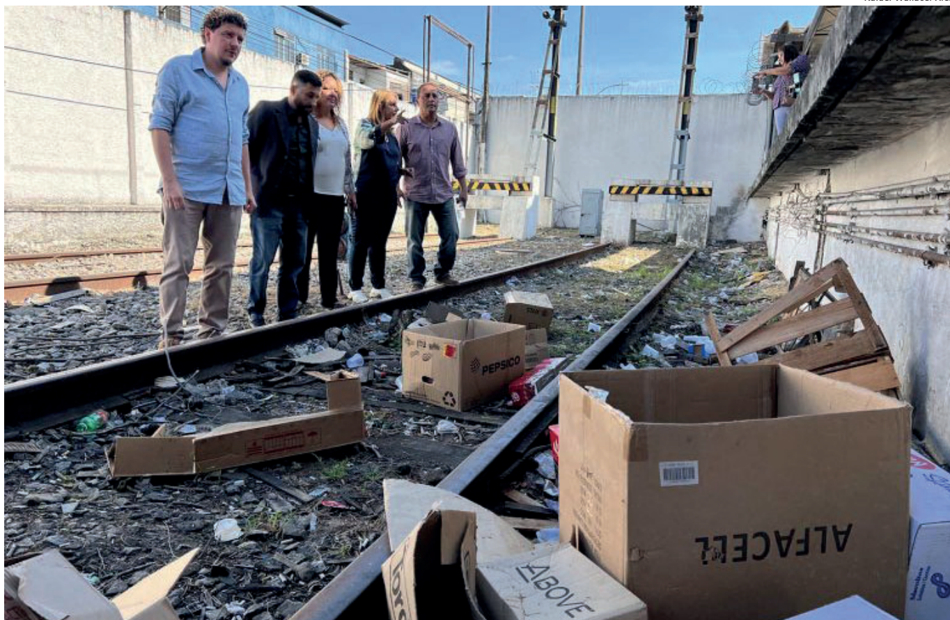
Parlamentares constataram que esse é o pior ramal de todo o sistema ferroviário operado pela SuperVia

Por fim, o deputado Giovanni Ratinho (SDD) chamou a atenção para os efeitos da má prestação do serviço de trem em outros modais. “Sou morador da Baixada Fluminense e com tristeza vejo este abandono total. O usuário deixa de usar o sistema e sufoca outros meios de transporte. O estado precisa atuar de forma emergencial. Diziam que com a privatização o serviço iria melhorar, mas isso não aconteceu”, afirmou.