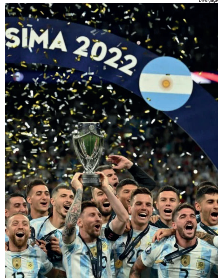
Os argentinos derrotaram a Itália por 3 a 0 e levaram o título

O Brasil estreia na Copa do Mundo contra a Sérvia no dia 24 de novembro, pelo Grupo G. Na sequência, encara Suíça e Camarões na Fase de Grupos.