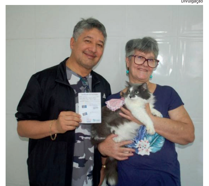
Essa ação está sendo voltada para atender aos protetores de animais

Para facilitar a ação, a Secretaria de Defesa dos Animais colocou um veículo à disposição para o transporte de ida e volta dos protetores e dos animais.