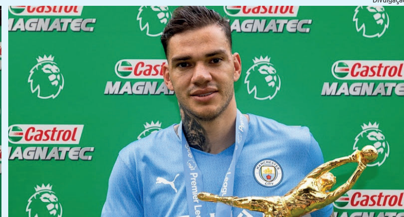
Dupla dividiu o Castrol Golden Glove - Castrol Luva de Ouro