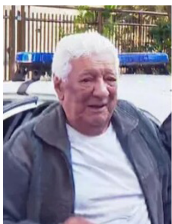
Bicheiro é acusado de assassinato