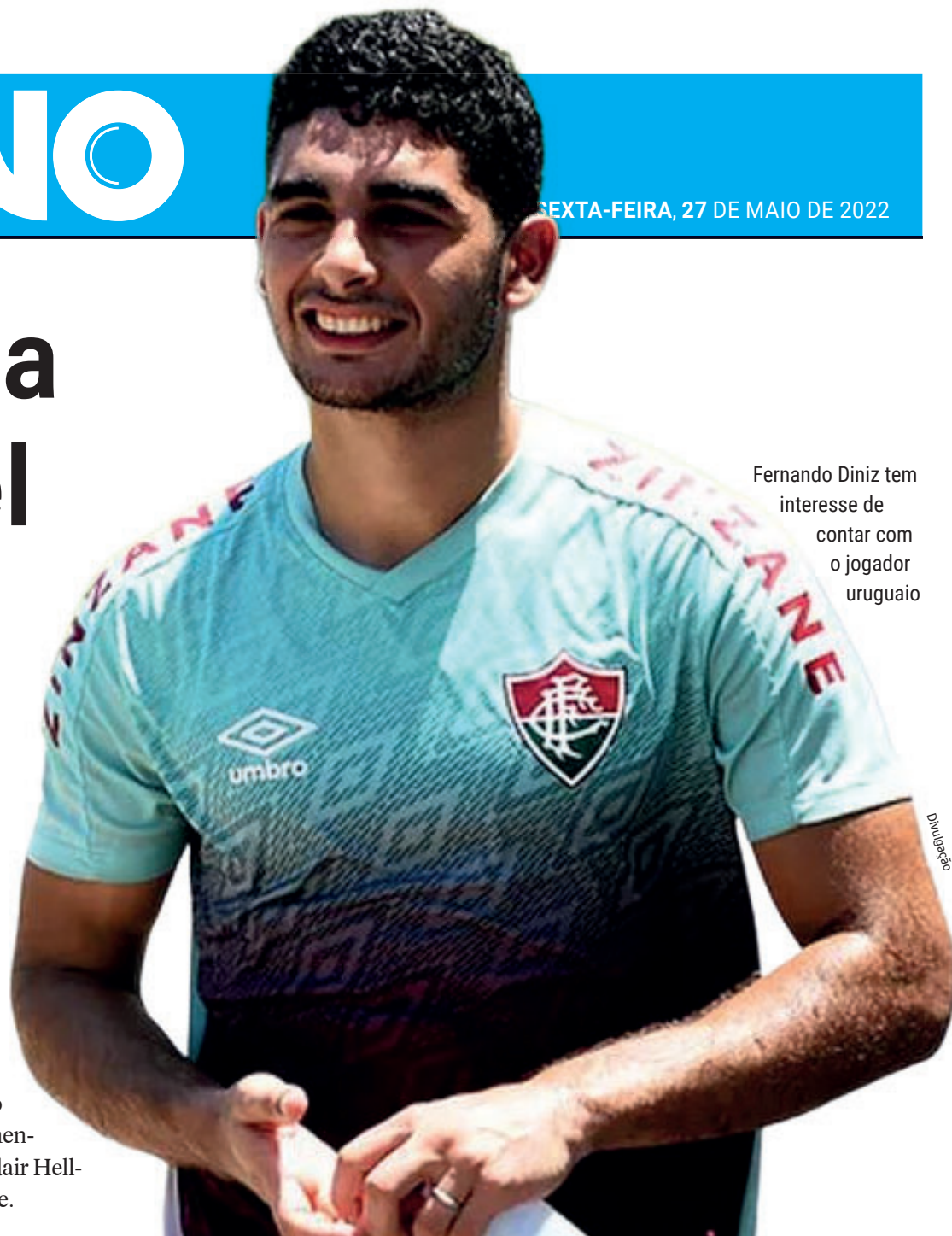
Fernando Diniz tem interesse de contar com o jogador uruguaio