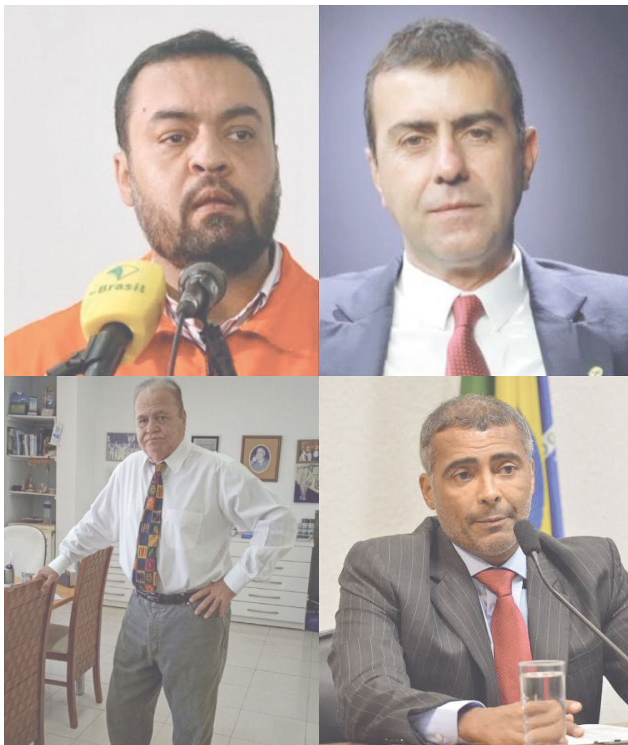
Atual governador tem 22% das intenções de voto, enquanto Freixo tem 18%. Para o Senado Alberto Ahmed está na liderança com 24% dos votos e logo atrás Romário, com 18%

A Enquete do POVO foi realizada através de autopreenchimento de cédulas contendo nomes de candidatos de forma estimulada. Foram feitas 1.473 entrevistas no Rio de Janeiro, Belford Roxo, Nova Iguaçu, São Gonçalo e Itaboraí.