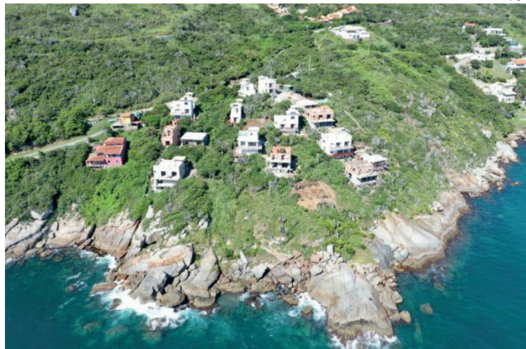
Decisão atende a um pedido do MPF; órgão alega que empreendimentos causam impacto à Ressexmar-AC e costão rochoso do local

• trilhas tradicionais de pesca, protegidas pela Reserva Extrativista Marinha de Arraial do Cabo, bloqueadas pelos condomínios.