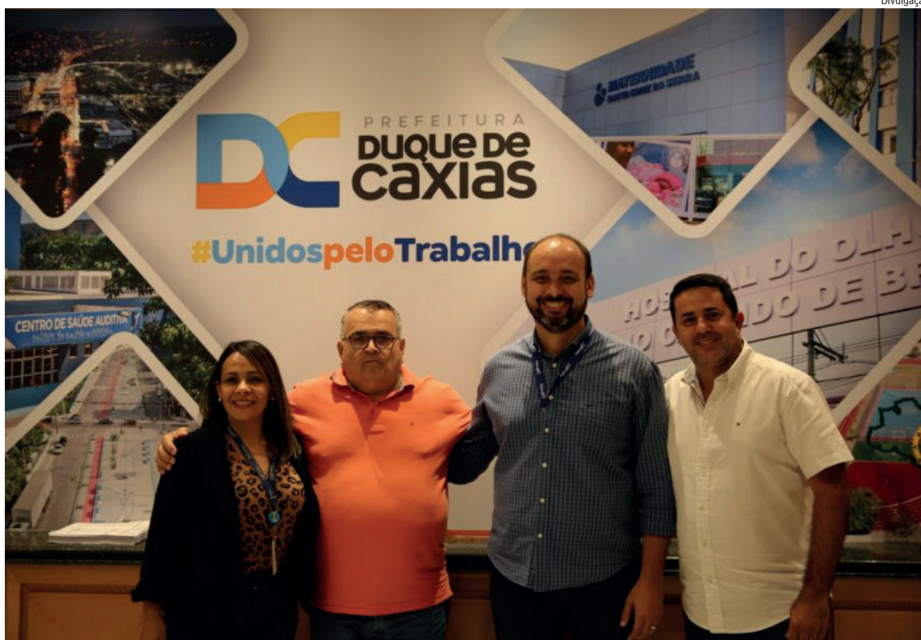
Foi renovado o Programa de Calçada Acessível, desenvolvido pela Firjan

O foco do trabalho é melhorar a qualidade das calçadas, com padronização e acessibilidade, principalmente, para idosos, grávidas, pessoas com mobilidade reduzida ou com deficiência, visando à inclusão e a melhor qualidade de vida.