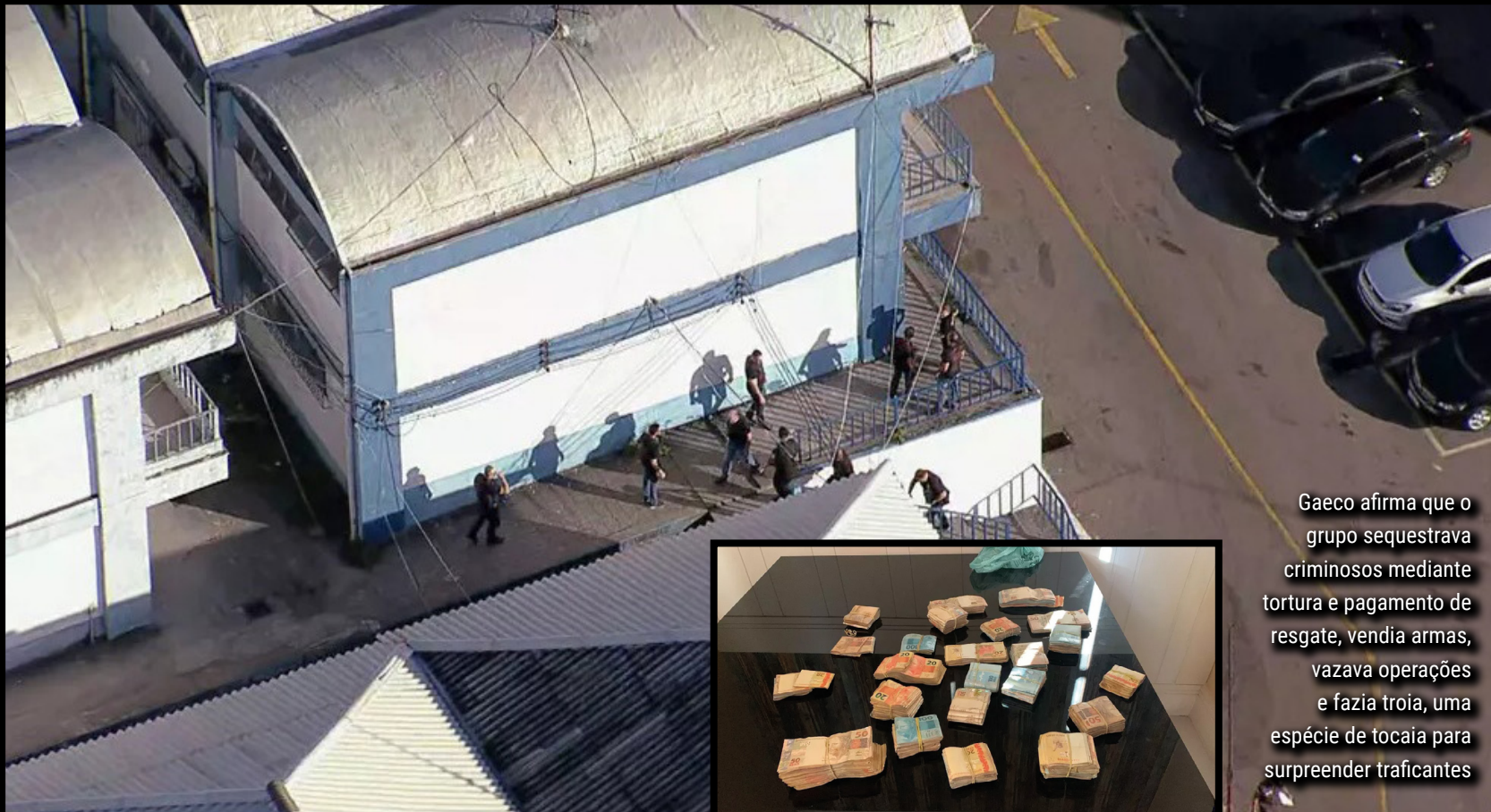
Gaeco afirma que o grupo sequestrava criminosos mediante tortura e pagamento de resgate, vendia armas, vazava operações e fazia troia, uma espécie de tocaia para surpreender traficantes

lhão de Duque de Caxias. Lá, agentes vasculharam armários e escritórios. Na sala de Orrico, o MPRJ apreendeu R$ 37 mil em espécie. Somando os R$ 96 mil da casa dele, foram R$ 133 mil retidos.