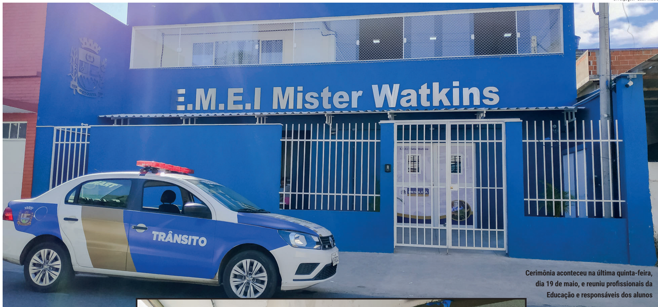
Cerimônia aconteceu na última quinta-feira, dia 19 de maio, e reuniu profissionais da Educação e responsáveis dos alunos

A Escola Municipal de Educação Infantil Mister Watkins foi oficialmente inaugurada. A solenidade aconteceu na última quinta-feira, 19 de maio, e reuniu responsáveis e professores. O prédio fica na Rua Paraná 48, no Centro, e foi construído em parceria com a empresária e filantropa Lily Safra.