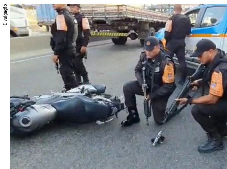
Arma, munições e moto utilizada em roubos foram apreendidas

Um homem não identificado morreu, na última segunda-feira (23), durante uma tentativa de roubo de um automóvel na Avenida Brasil, sentido Zona Oeste, altura de Vigário Geral. De acordo com a PM, um tiroteio começou depois que o suspeito atirou nos agentes do Batalhão de Policiamento em Vias Especiais (BPVE), enquanto tentava fugir com uma moto.