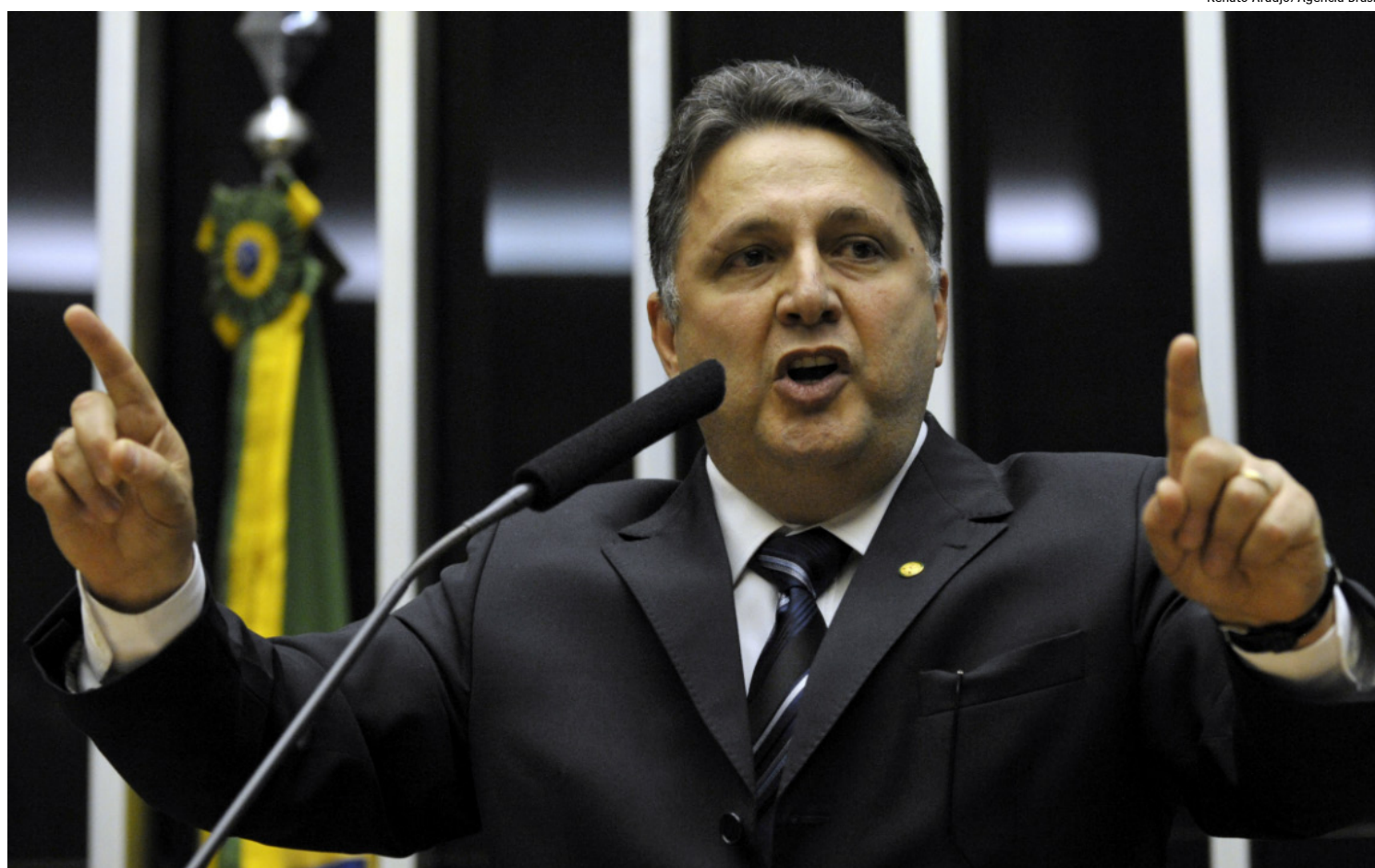
O governador do Rio de Janeiro e o ex-presidente da Câmara preso na Lava Jato tentam derrubar candidatura de Garotinho

Garotinho diz estar sendo vítima de perseguição política de Castro.