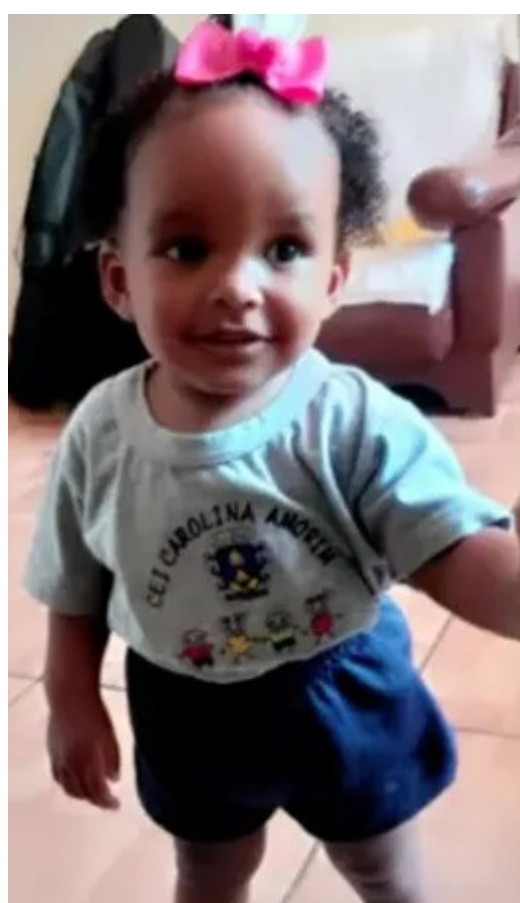
Corpo de bebê passou por exumação

Amanhã, haverá reunião com os pais. Em respeito ao luto, as atividades na escola serão retomadas após quatro dias.