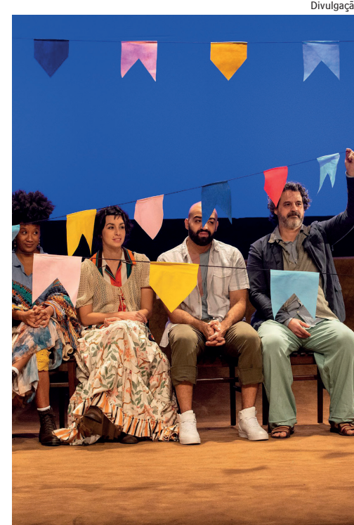
As vendas estão abertas na bilheteria do CCBB e no site Eventim

O Brasil profundo, longe do litoral e dos grandes centros urbanos, apresenta uma cultura rica e diversa, fundamental para a compreensão da identidade nacional. Esse lugar, que pode estar na fronteira entre Minas Gerais, Espírito Santo e sul da Bahia, no interior do Mato Grosso ou mesmo no nosso imaginário afetivo, ganha os palcos no musical inédito “Céu Estrelado”, que estreia nesta quinta-feira, dia 26 de maio, no Centro Cultural Banco do Brasil, para curta temporada, com sessões de quinta a sábado, às 19h, e aos domingos, às 18h. As vendas estão abertas na bilheteria do CCBB e no site Eventim ( www.eventim.com.br/artist/teatro-ceuestrelado-omusical-cbbbrj/ ).