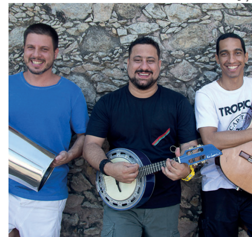
Evento gratuito acontece e domingo, a partir das 15h