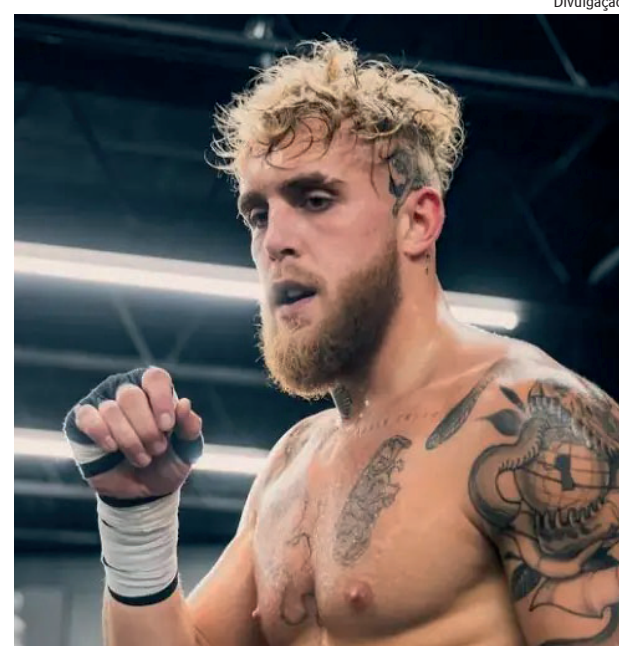
Youtuber americano usou as redes sociais para dizer que venceria Spider e Mayweather na mesma noite