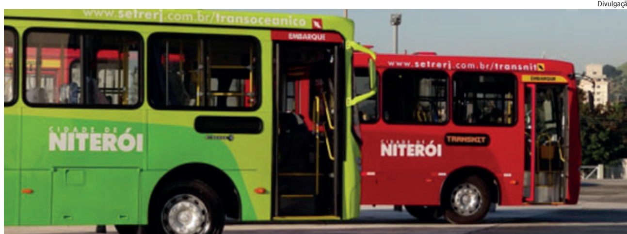
Divulgação Alterações na operação das linhas municipais começam a valer a partir do próximo sábado (28)

“Os primeiros 15 dias serão fundamentais para avaliarmos as mudanças. Encurtando percursos e deixando de fazer viagens mortas, onde os ônibus circulam vazios, a frequência com que os veículos passam nos pontos vai diminuir pela