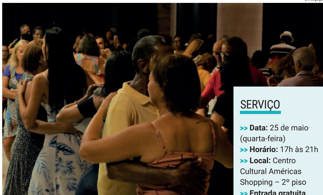
O baile vem para animar a noite dos amantes da dança de salão