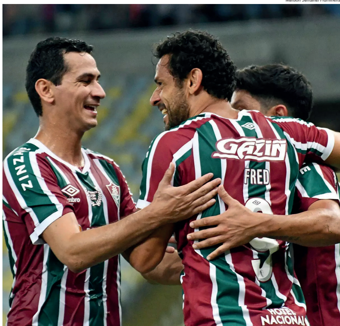
Tricolor precisa vencer por seis gols de diferença e torcer pelo empate de Junior Barranquilla (COL) e Unión Santa Fe (ARG)

Tetracampeão pela seleção brasileira em 1994, Leonardo também já foi treinador, tendo dirigido o Milan e a Inter de Milão. Como dirigente, além do PSG, ele também passou pelo Milan e teve uma passagem anterior pelo clube francês em 2011.