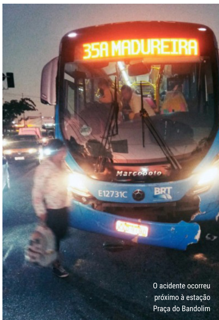
O acidente ocorreu próximo à estação Praça do Bandalim

Até o momento, o corredor com maior número de acidentes de janeiro até agora é o Transcarioca, com 43. O corredor Transoeste teve 25 e o Transolímpica, registrou 3 acidentes.