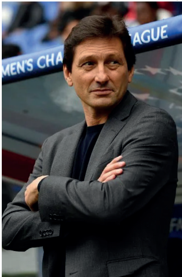
Rubro-Negro pode fazer mudanças na estrutura do esporte