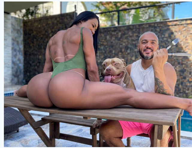
FOTO DE GRACYANNE BARBOSA E BELO ROUBA A CENA NA WEB