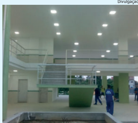
Obras do campus de Itaboraí estão em andamento desde 2019

A esperança logo foi convertida em frustração, já que a unidade não seguiu a linha tradicional dos outros IFFs. Segundo pais de futuros alunos do campus de Itaboraí, a escola terá apenas cursos de curta duração, muito diferente da proposta pedagógica das