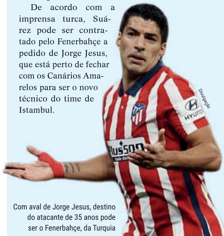
Com aval de Jorge Jesus, destino do atacante de 35 anos pode ser o Fenerbahçe, da Turquia

De acordo com a imprensa turca, Suárez pode ser contratado pelo Fenerbahçe a pedido de Jorge Jesus, que está perto de fechar com os Canários Amarelos para ser o novo técnico do time de Istambul.