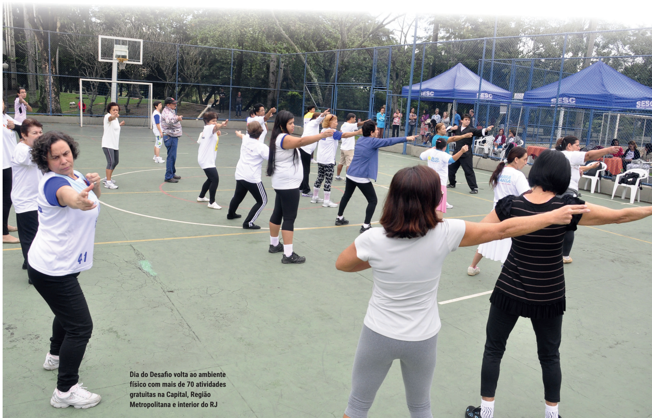
Dia do Desafio volta ao ambiente físico com mais de 70 atividades gratuitas na Capital, Região Metropolitana e interior do RJ

O 28º Dia do Desafio, mobilização mundial de incentivo à prática regular de atividades físicas e esportivas que acontece sempre na última quarta-feira do mês de maio, será presencial hoje, de-