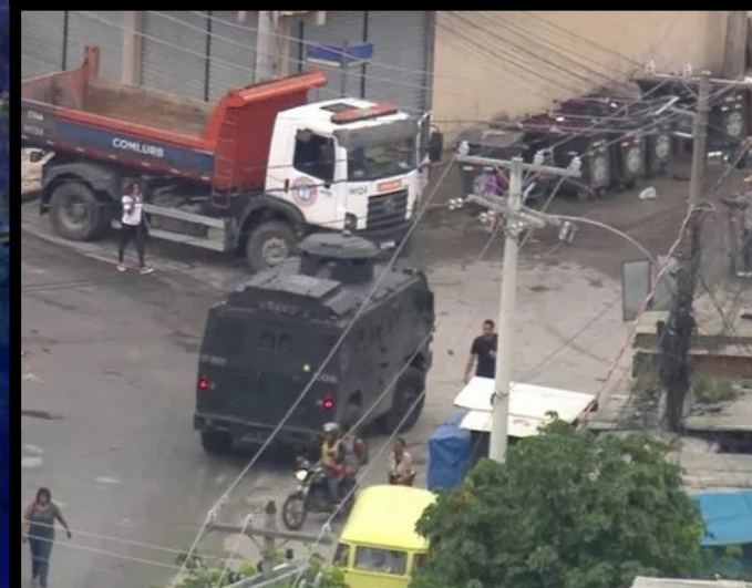
Entre os 21 mortos está uma moradora da comunidade atingida por uma bala perdida. Um policial civil foi ferido por estilhaços