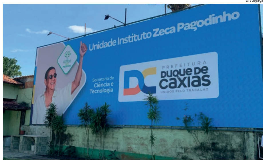
O Instituto Zeca Pagodinho fica na Rua Carlos Mateus, 54, em Xerém

O Instituto Zeca Pagodinho fica na Rua Carlos Mateus, 54, em Xerém, no quarto distrito de Duque de Caxias. O atendimento no local é de segunda a sexta-feira, das 08h às 17h.