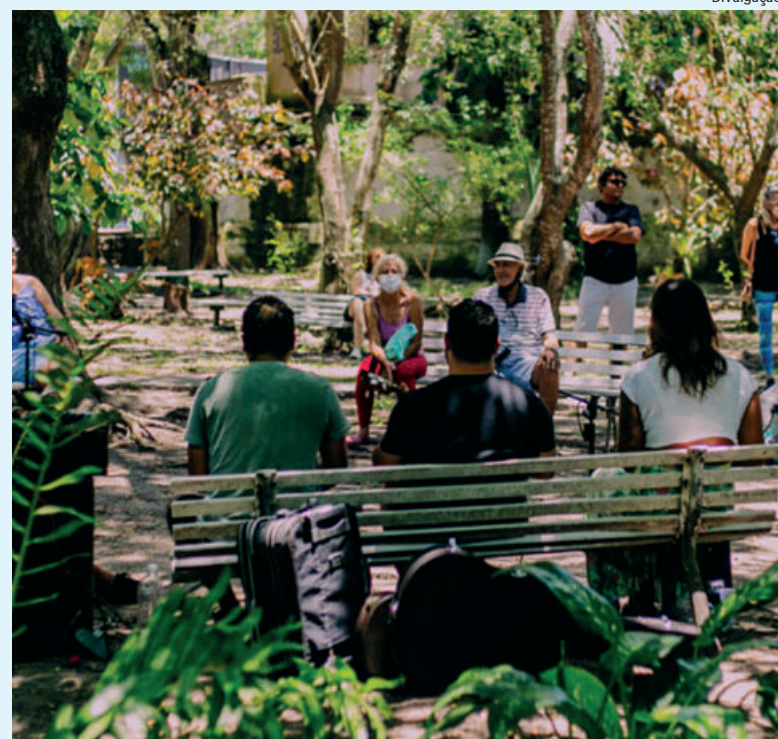
“Música na Fonte” é o nome do projeto

O local fica aberto para a população todos os dias, das 9h às 17h, onde os visitantes podem desfrutar de momentos de contato com a natureza.