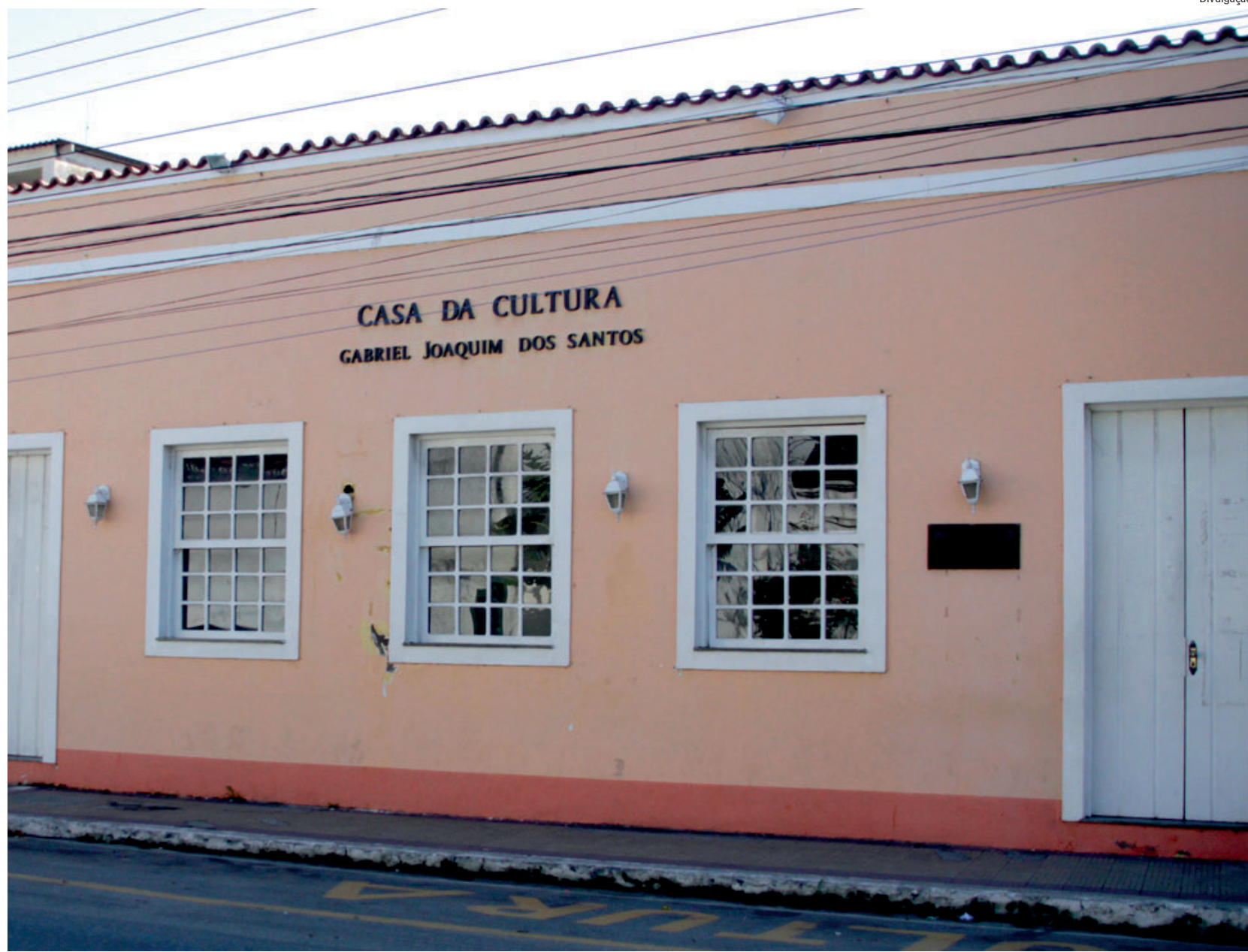
Programação gratuita acontecerá na sexta-feira (13), em alusão aos 405 anos de fundação da cidade

A Casa da Cultura está localizada na Avenida Francisco Coelho Pereira, nº 255, no Centro.