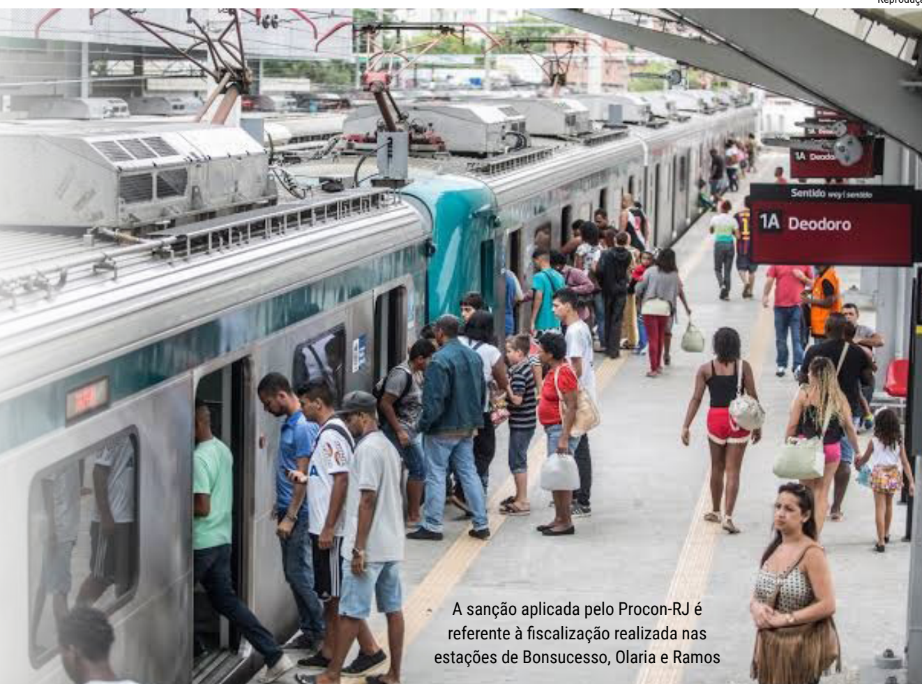
A sanção aplicada pelo Procon-RJ é referente à fiscalização realizada nas estações de Bonsucesso, Olaria e Ramos