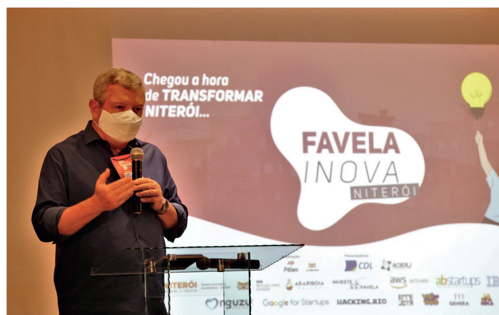
O programa tem como objetivo promover a transformação social e a democratização da educação através do desenvolvimento de novos negócios

A equipe responsável por promover o programa ressalta que o Favela Inova é