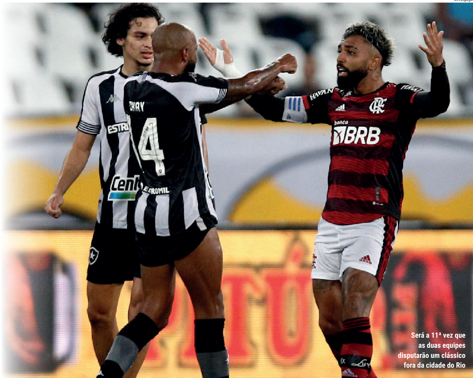
Será a 11ª vez que as duas equipes disputarão um clássico fora da cidade do Rio

Esta será a primeira vez que Flamengo e Botafogo farão um clássico fora da cidade do Rio de Janeiro após quatro anos. Além disso, será o primeiro confronto entre a dupla fora do estado após oito anos.