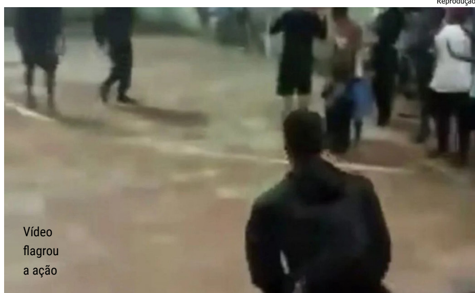
Vídeo flagrou a ação

Na noite da última quinta-feira (5), agentes da Polícia Militar efetuaram disparos de arma de fogo contra jovens que realizavam uma batalha de rima no bairro Manoel Corrêa, em Cabo Frio, município da Região dos Lagos. Imagens mostram o momento em que um MC