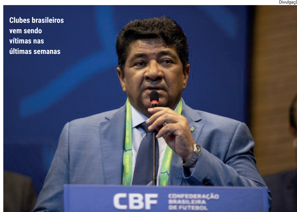
Clubes brasileiros vem sendo vítimas nas últimas semanas