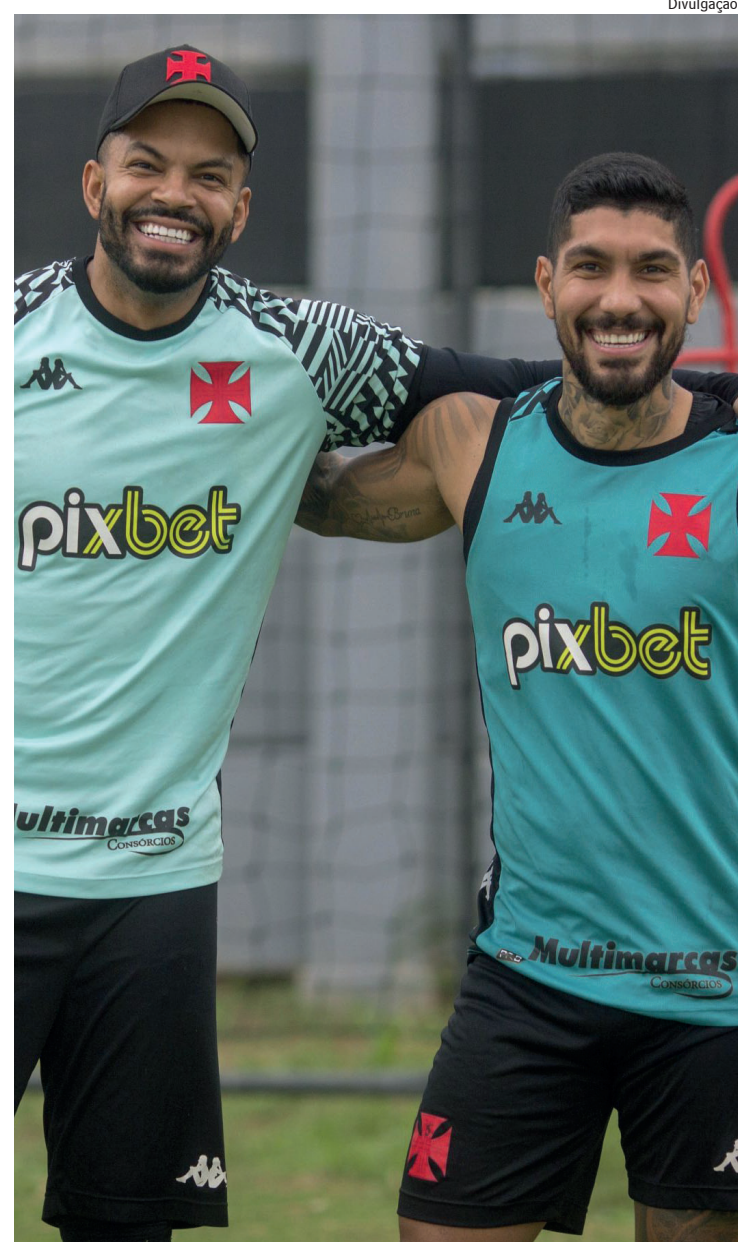
Partida acontece neste sábado, às 19h