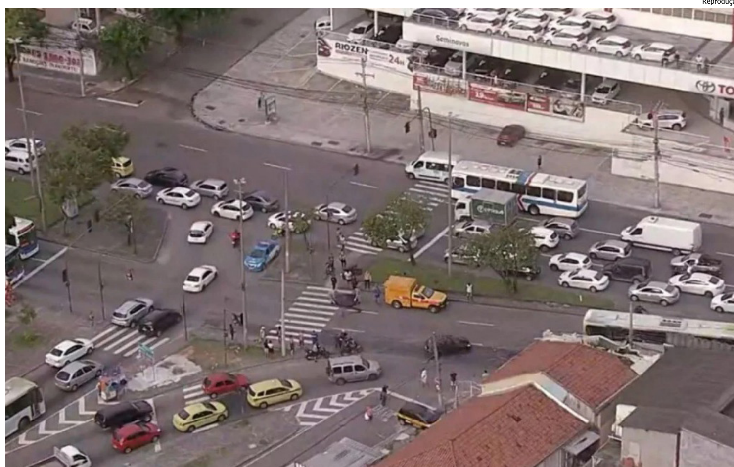
A vítima que sobreviveu foi levada para o Hospital Salgado Filho