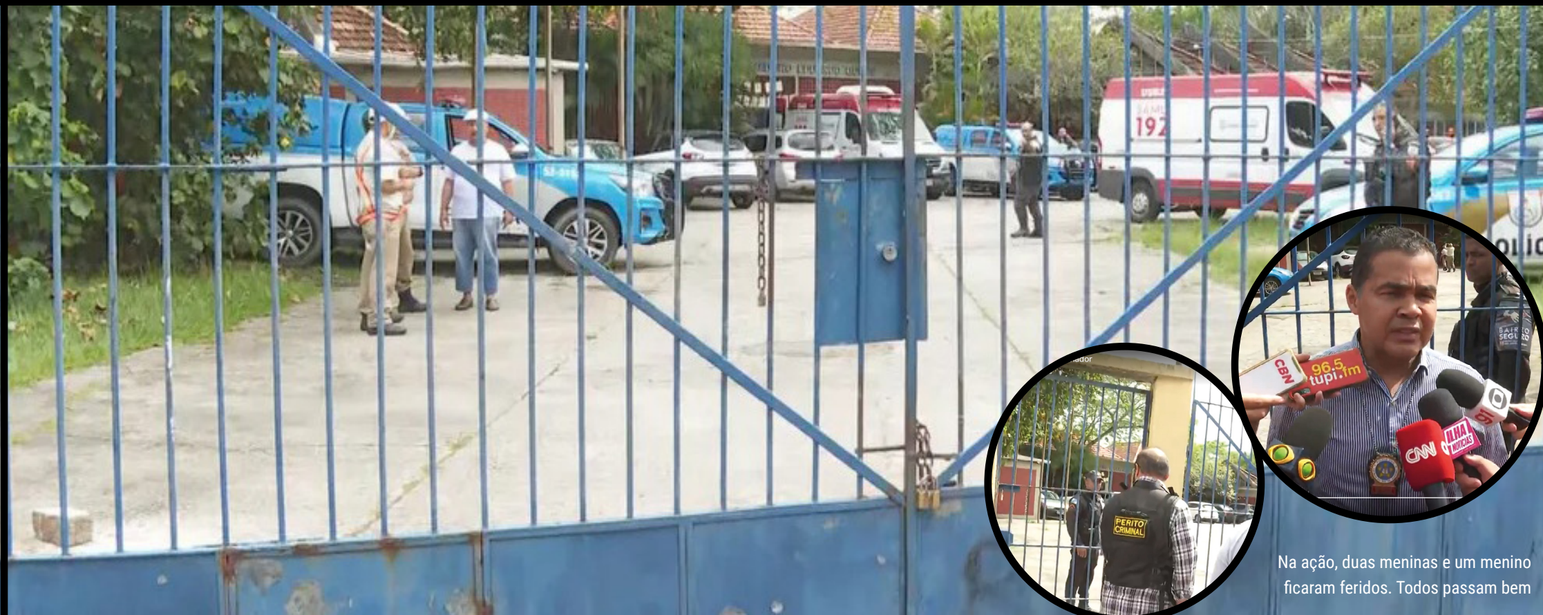
Na ação, duas meninas e um menino ficaram feridos. Todos passam bem