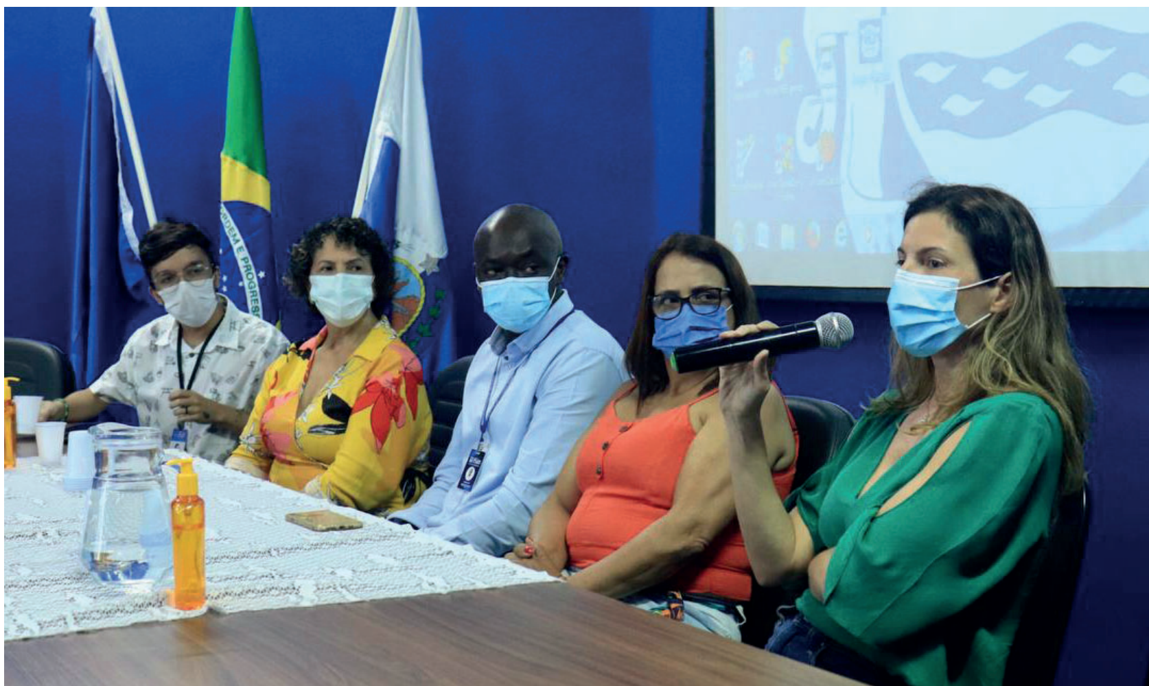
A proposta de pesquisa e extensão foi totalmente voltada para a atualização do mapeamento das redes de proteção social

A proposta de pesquisa e extensão foi totalmente voltada para a atualização do mapeamento das redes de proteção social, expressa nos equipamentos, profissionais, serviços e recursos das políticas setoriais relativas à saúde, assistência social, educação, habitação e direitos humanos.