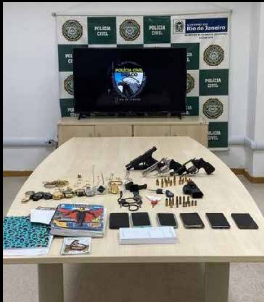
Durante a operação, os agentes apreenderam celulares, joias, armas, cadernos e peças de munição, além de três motos e um carro