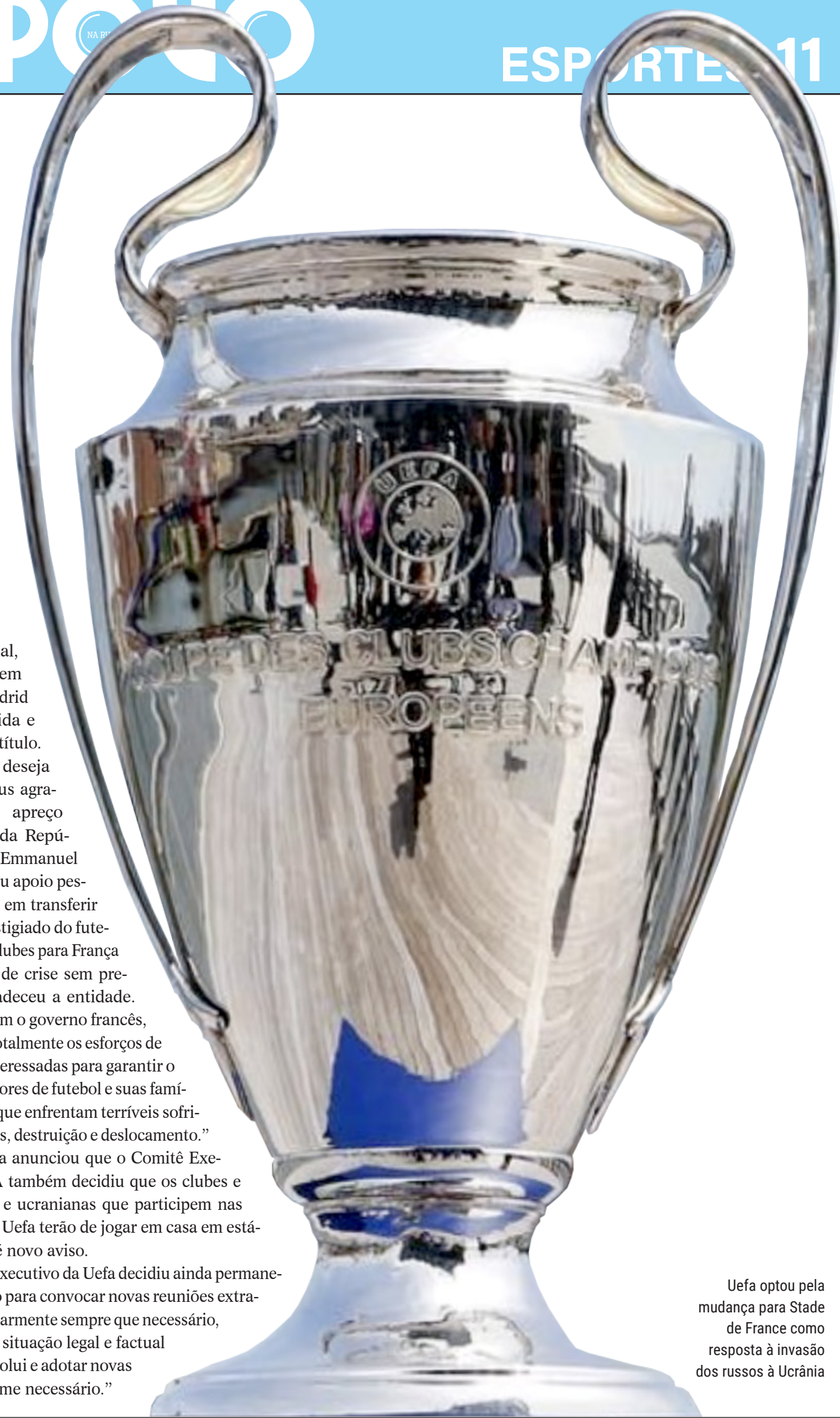
Uefa optou pela mudança para Stade de France como resposta à invasão dos russos à Ucrânia

“O Comitê Executivo da Uefa decidiu ainda permanecer de prontidão para convocar novas reuniões extraordinárias, regularmente sempre que necessário, para reavaliar a situação legal e factual à medida que evolui e adotar novas decisões conforme necessário.”