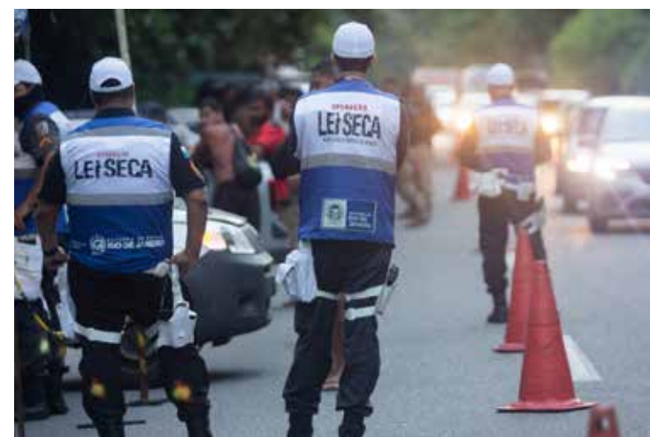
A previsão é que sejam realizadas 42 ações

Brasil já tem quatro produtos autorizados