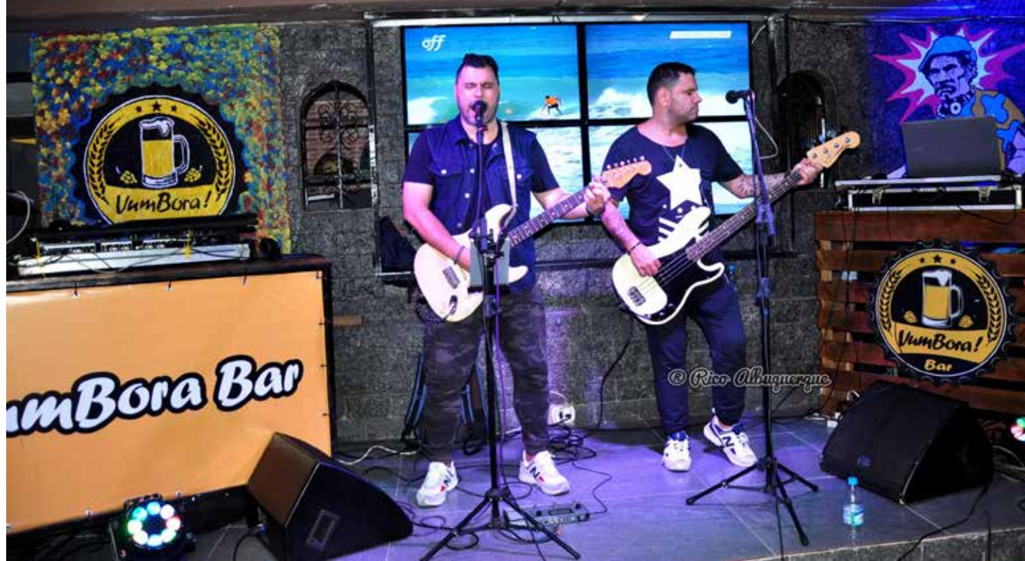
Os fãs de Flashback e que também curtem carnaval vão se divertir no Mackenzie

COLABOROU: RICO ALBUQUERQUE - RICODOPOVO@GMAIL.COM