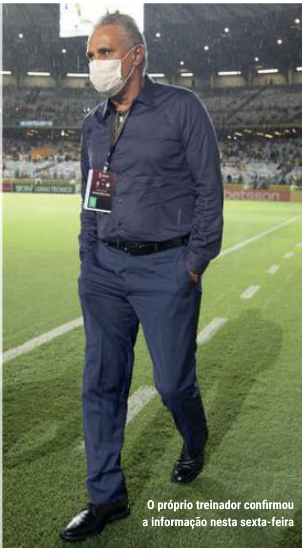
O próprio treinador confirmou a informação nesta sexta-feira

Tite assumiu a seleção em 2016, após carreira multi-vitória, em especial pelo Corinthians — onde foi bicampeão brasileiro, além de campeão da Libertadores e do Mundial. Comandou a amarelinha em 70 jogos até agora, com 51 vitórias, 14 empates e 5 derrotas. Nesse período, conquistou a Copa América uma vez, em 2019.