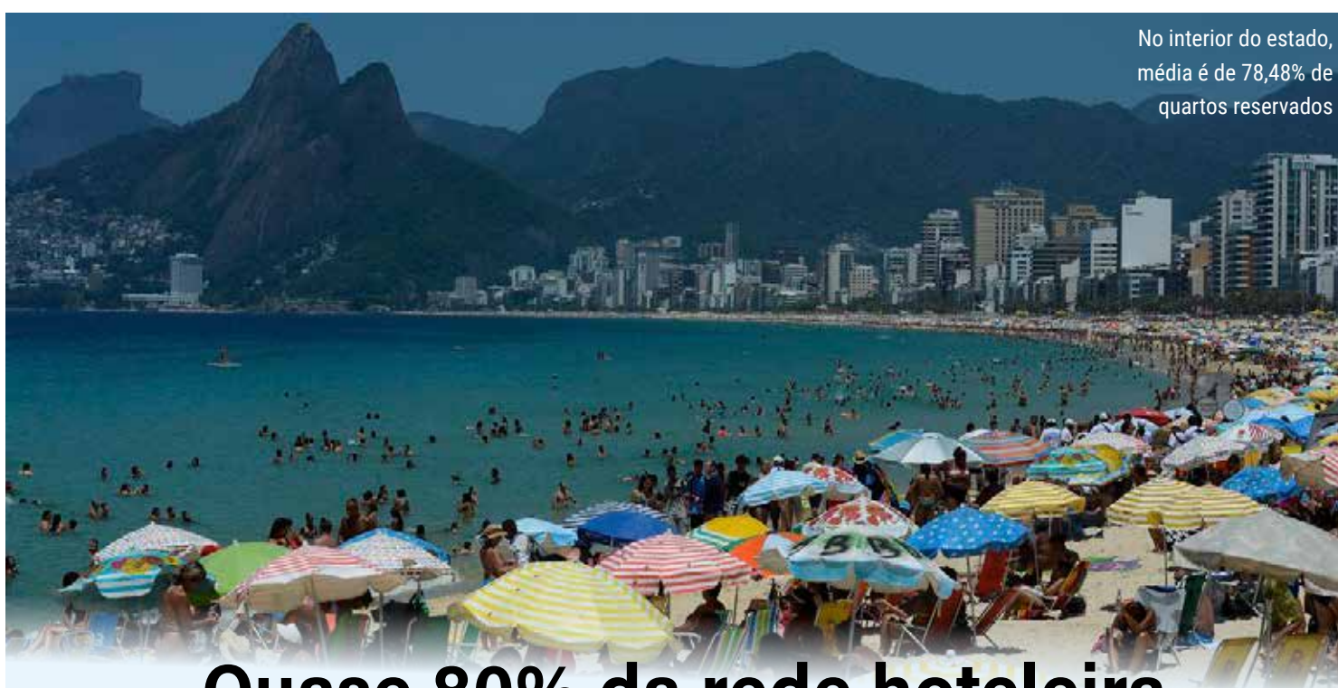
No interior do estado, média é de 78,48% de quartos reservados