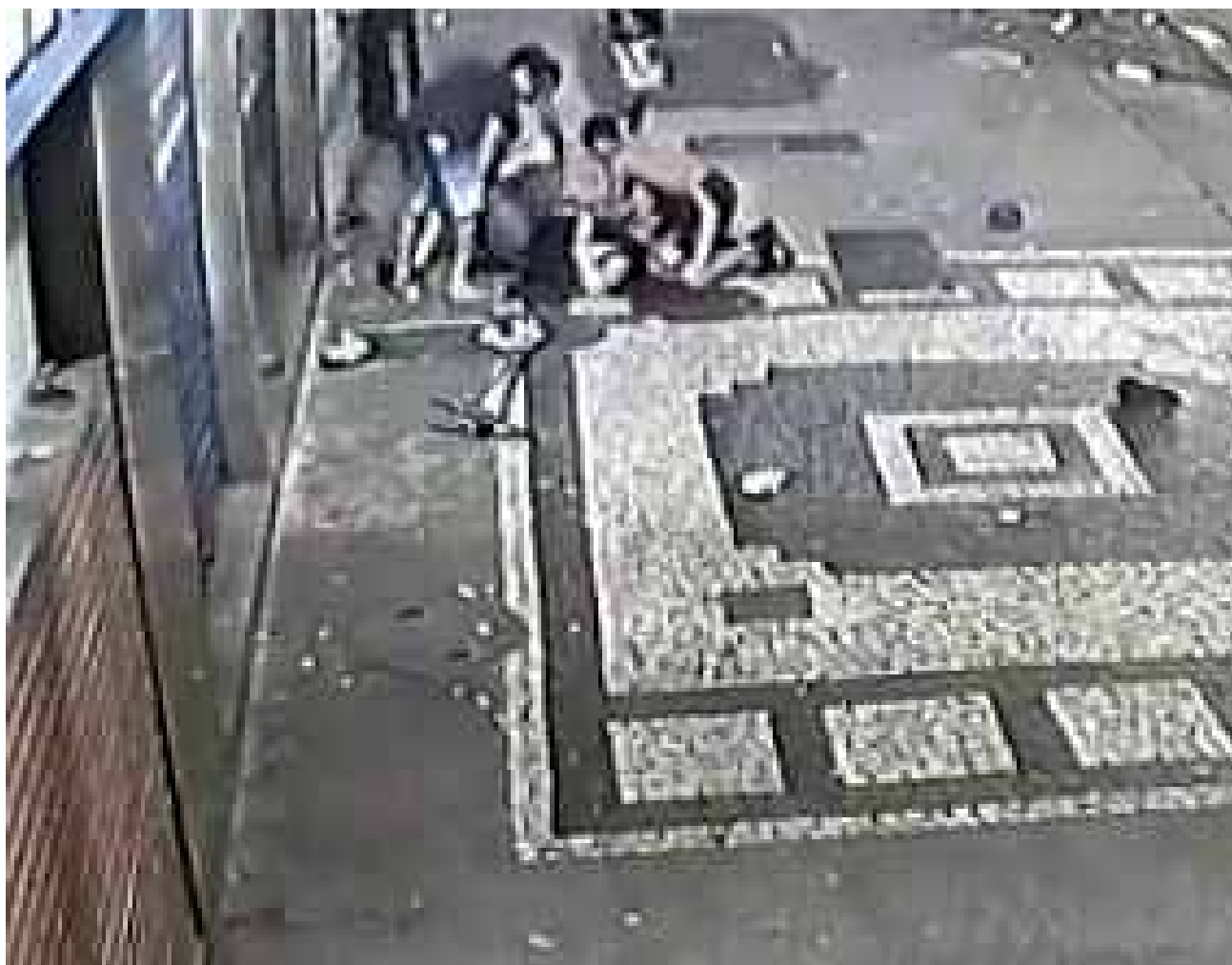
Bando foi capturado na última quinta-feira

Durante as agressões, que duraram cerca de dois minutos, além de receber diversos chutes e socos, a vítima ainda foi agredida com um patinete elétrico