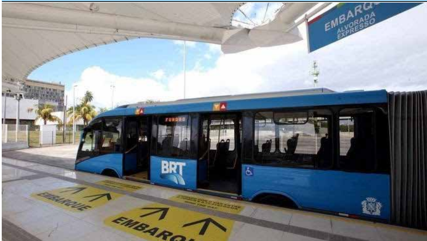
Parte dos funcionários fizeram uma manifestação