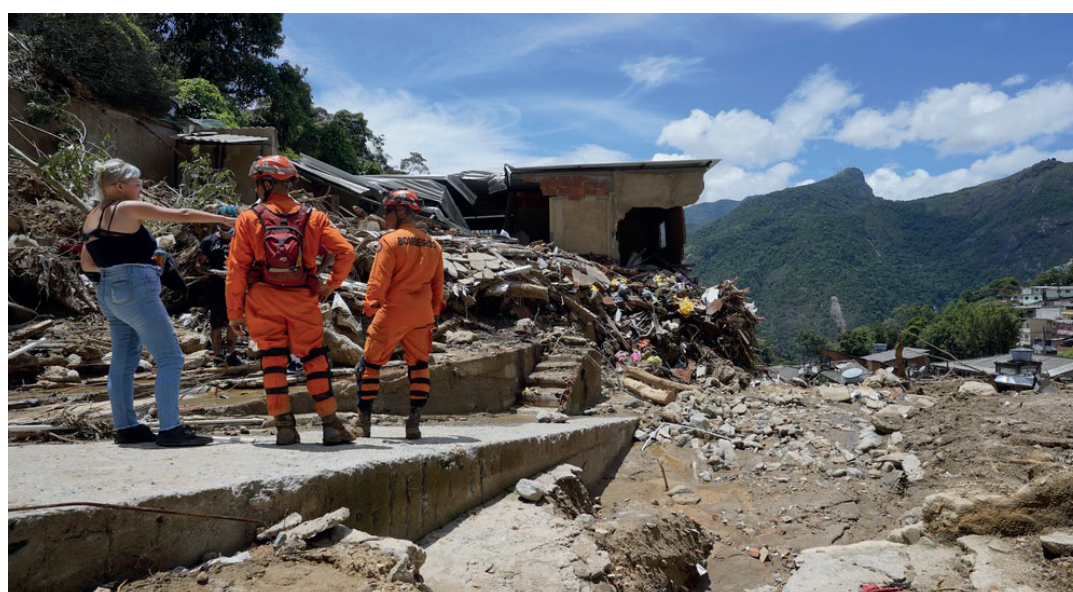
Essa já é considerada a maior tragédia da história de Petrópolis

O município mantém 13 escolas abertas para o acolhimento dos moradores de área de risco. Até o momento, 811 pessoas estão abrigadas nesses locais.