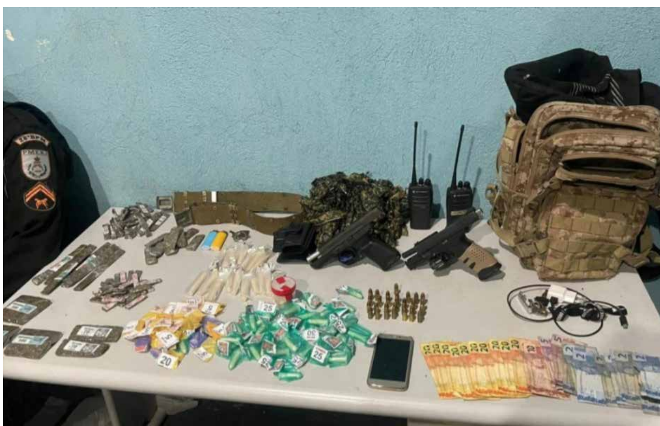
Armas e drogas foram encontradas

Segundo a PM, o seguinte material foi apreendido: 02 pistolas calibre 9 milímetros, 29 munições do mesmo calibre, 95 pinos de cocaína, 76 unidades de maconha, 02 rádios de comunicação e R$ 264 em espécie. O caso foi registrado na Delegacia de Polícia de Volta Redonda, a 93ª DP.