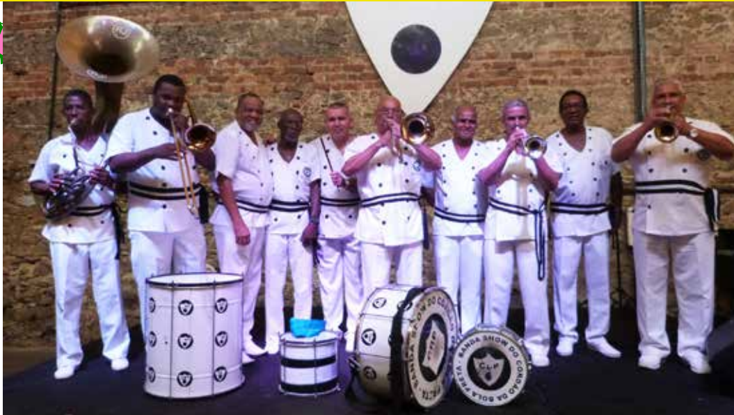
Mulheres da Vila, Cordão da Bola Preta e Bateria da Grande Rio comandam a diversão gratuita

Apresentado por Milton Cunha, o "Rio Carnaval 2022" acontece neste sábado (26) e domingo (27), data original dos desfiles na Marquês de Sapucaí, que foram adiados. A festa, organizada pela Liesa, conta com a presença do público, mas as vagas são limitadas. Os ingressos esgotaram nesta terça-feira (22).