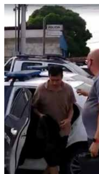
Crime ocorreu na Baixada

Ele foi preso em flagrante pelo crime de tentativa de homicídio qualificado pelo motivo fútil.