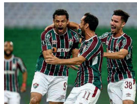
Vindo de sete vitórias seguidas, o Fluminense tem 21 pontos e lidera o Cariocão Betfair 22

“Acho que vai ser bacana antes do jogo, o respeito que tenho de todos, da própria torcida. É bacana além da rivalidade. A hora que entrar em campo, realmente esquece e concentra somente no nosso time. Acho que um reencon-