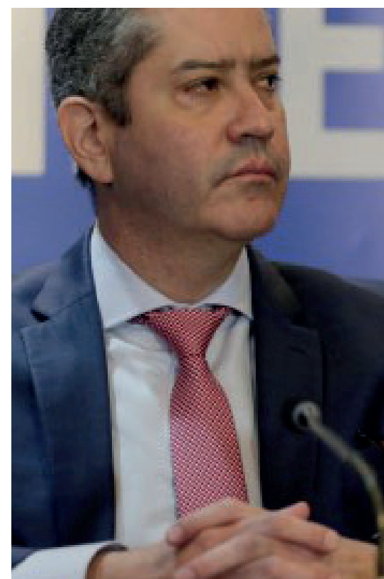
Rogério Caboclo está fora da presidência da CBF

Caboclo já estava afastado por 21 meses desde setembro do ano passado, também por decisão unânime da assembleia, como punição num caso de assédio sexual. As duas sanções somadas ultrapassam o fim do mandato do dirigente, que seria em abril de 2023.