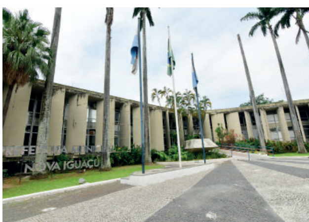
A prefeitura de Nova Iguaçu decretou ponto facultativo nos dias 28 de fevereiro e 2 de março (até às 12h)

A prefeitura de Nova Iguaçu decretou ponto facultativo nos dias 28 de fevereiro e 2 de março (até às 12h) devido ao feriado prolongado de Carnaval. No dia 1º, também não haverá expediente. Os serviços essenciais, como o Hospital Geral de Nova Iguaçu (HGNI), Unidades de Pronto Atendimento (UPAs), Maternidade Mariana Bulhões, Defesa Civil, a Empresa Municipal de Limpeza Urbana (Emlurb) e agentes da Secretaria de Ordem Pública, funcionarão normalmente.