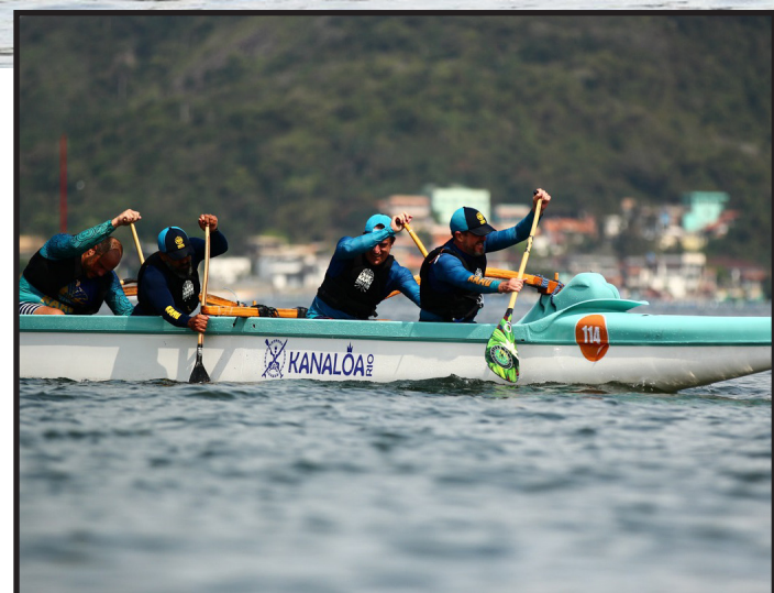
Disputas serão realizados na praia de São Francisco, em Niterói

Os dois eventos têm o apoio da Secretaria Municipal de Esporte e Lazer de Niterói, chancelado pela Federação Estadual de Canoa Havaiana do Estado do Rio de Janeiro (FCHERJ) e a Confederação Brasileira de Va'a (CBVaa).