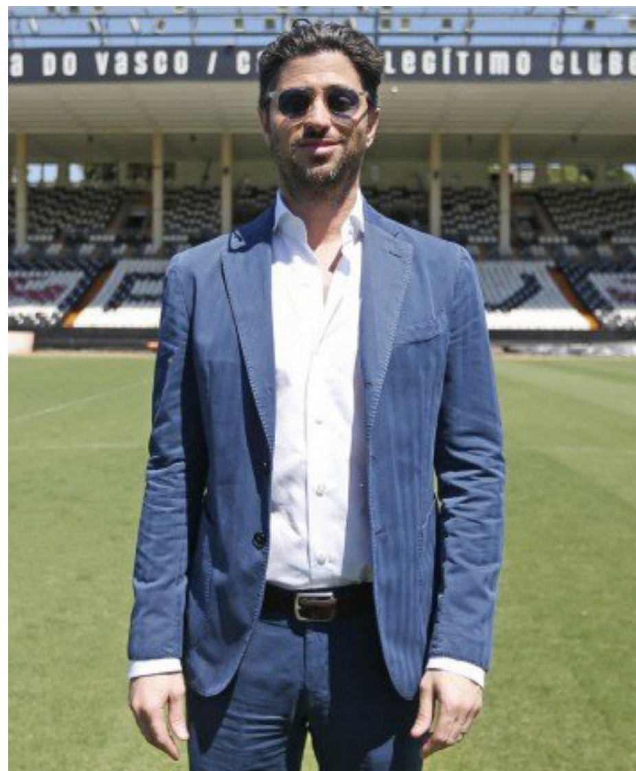
Cruzantino pode contratar até cinco novos jogadores

Com apenas o Campeonato Brasileiro da Série B pela frente, o Vasco precisa fortalecer o seu elenco para a disputa da Série B. E o Cruzantino recebeu o aval da 777 Partners para utilizar o dinheiro emprestado pelo grupo investidor na contratação de reforços para a temporada de 2022. As informações são do canal "Atenção Vascaínos".