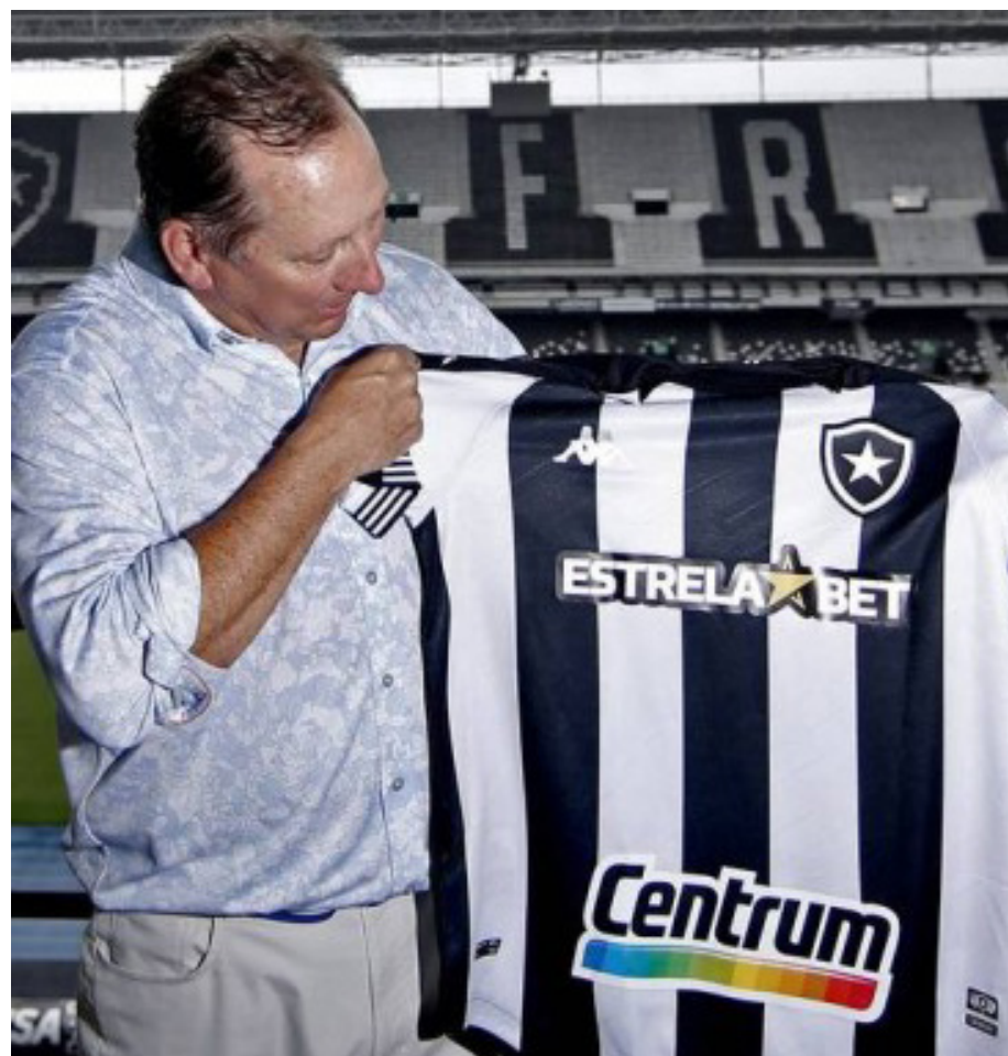
A declaração de Textor foi dada ao programa “CNN Soft Business”

O Londrina deixou o Campeonato Paranaense neste domingo. Nos pênaltis, acabou eliminado pelo Athletico nas quartas de final. Neste ano, a equipe disputará a Série B do Campeonato Brasileiro. Em 2021, o Londrina escapou do rebaixamento à terceira divisão nacional na última