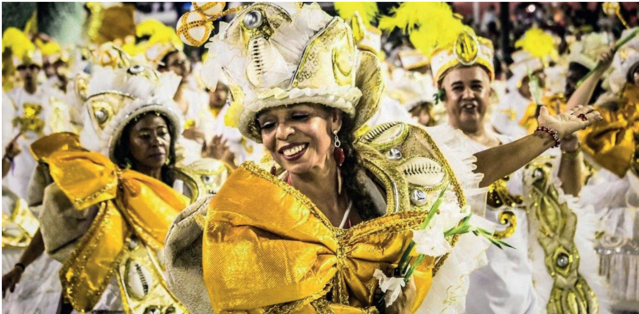
Desfiles serão realizados em abril

A Prefeitura do Rio abriu as inscrições para o sorteio de comerciantes ambulantes que terão pontos fixos (barracas) durante os desfiles das escolas de samba na Marquês de Sapucaí em abril. Os interessados devem realizar a inscrição pelo site https://jeap.rio.rj.gov.br/je-sorteio/inscricao/324 até hoje. Só será aceita uma inscrição por pessoa física, e os participantes deverão ser maiores de 18 anos e residentes no