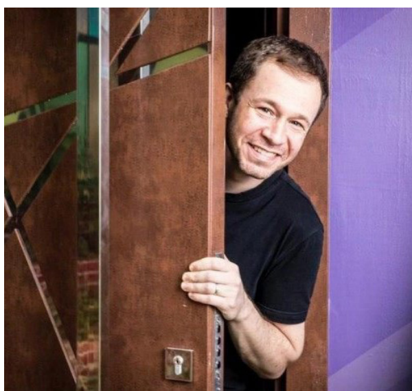
Ex-apresentador do 'BBB' deixou a emissora no fim do ano passado e agora criou um canal no 'YouTube'