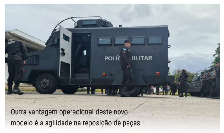
Outra vantagem operacional deste novo modelo é a agilidade na reposição de peças

O Batalhão de Polícia Militar de São Gonçalo (7ºBPM) está entre os sete batalhões que receberam um veículo blindado para ações em áreas consideradas de alto risco. O 7ºBPM, que policia uma das cidades mais violentas do estado, operava com apenas um veículo blindado atualmente e agora poderá aumentar seu policiamento ostensivo.