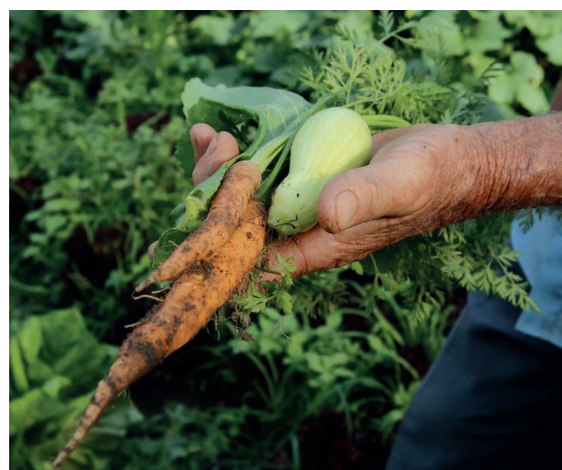
Convênio foi assinado com o BID

Na avaliação da ministra da Agricultura, Tereza Cristina, o projeto terá impacto para pequenos produtores. “Isso pode ser uma revolução para a agricultura familiar, porque é tudo o que eles precisam. Eu fiquei muito bem impressionada com os casos de sucesso dos pequenos produtores atendidos pelo programa AgroNordeste. A transformação é impactante, principalmente no Nordeste”, disse.