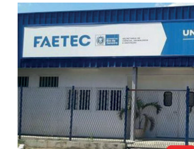
Estão sendo oferecidas 2.448 vagas. As inscrições acontecem até 27/03

A maior parte das vagas está distribuída entre os 34 cursos do Ensino Técnico de Nível Médio, entre eles: Administração, Análises Clínicas, Cozinha, Construção Naval, Eletrônica, Eventos, Gerência em Saúde, Guia de Turismo, Imobilizações Ortopédicas, Informática para