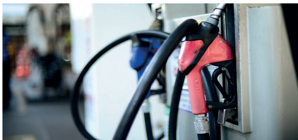
Medida vale até o fim do ano e pretende conter inflação

De acordo com a pasta, a medida fará o preço da gasolina cair até R$ 0,20 para o consumidor. Atualmente, o litro da gasolina tem 25% de álcool anidro. Por causa da alta recente dos combustíveis, o governo espera que a redução da tarifa de importação praticamente zere os efeitos do último aumento.