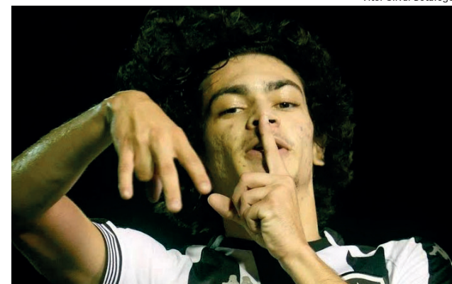
A joia do Botafogo já virou realidade e tem consciência do que representa esta data