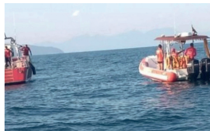
Barco afundou com seis pessoas

Em nota enviada pela Secretaria de Estado de Saúde, no início desta tarde, destaca-se que a medida pode ser revista caso o cenário epidemiológico mude no estado. No momento, de acordo com o último mapa de risco da Covid-19 do governo estadual divulgado, a maioria dos municípios do Rio de Janeiro estão com bandeira amarela (risco baixo), à exceção das cidades da região Noroeste, que estão com bandeira vermelha (risco alto).