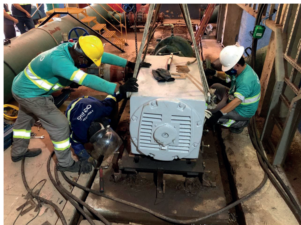
Fornecimento de água foi comprometido em alguns bairros

A concessionária pede a compreensão dos clientes por possíveis transtornos e está disponível via ligação ou WhatsApp, através do 0800 195 0 195.