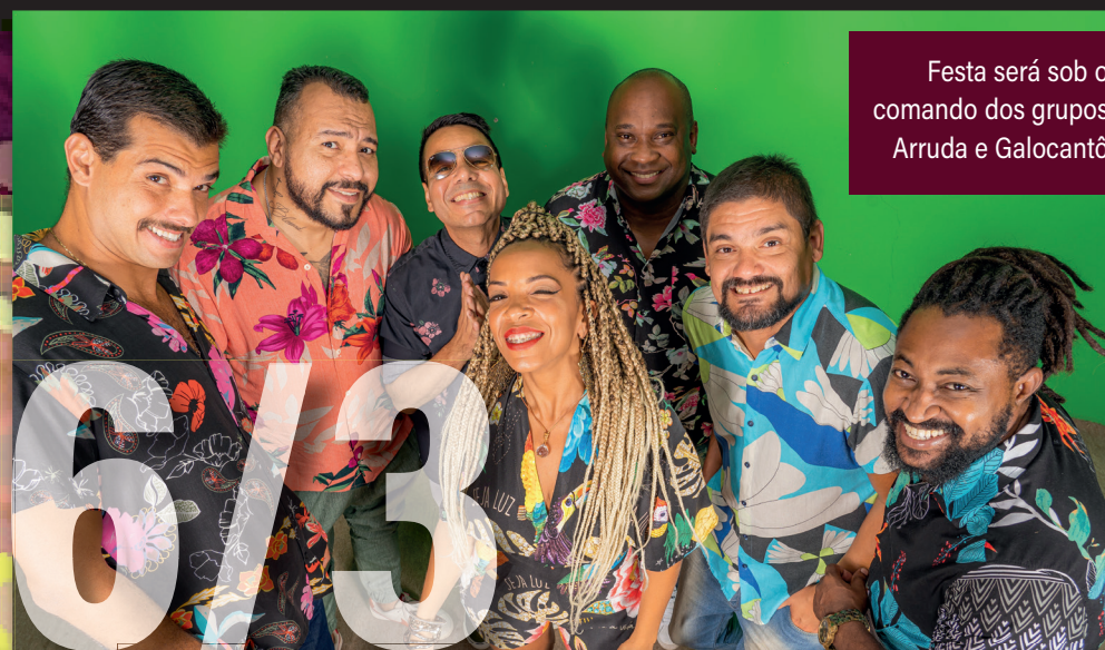
Festa será sob o comando dos grupos Arruda e Galocantô

A promoção de ingressos VIP continua. As vendas já começaram. Os primeiros 500 que entrarem no site SYMPLA poderão adquirir o ingresso 0800! A única regra a ser seguida para quem conseguir a gratuidade é entrar no evento até às 18h, após este horário o ingresso não será mais válido.