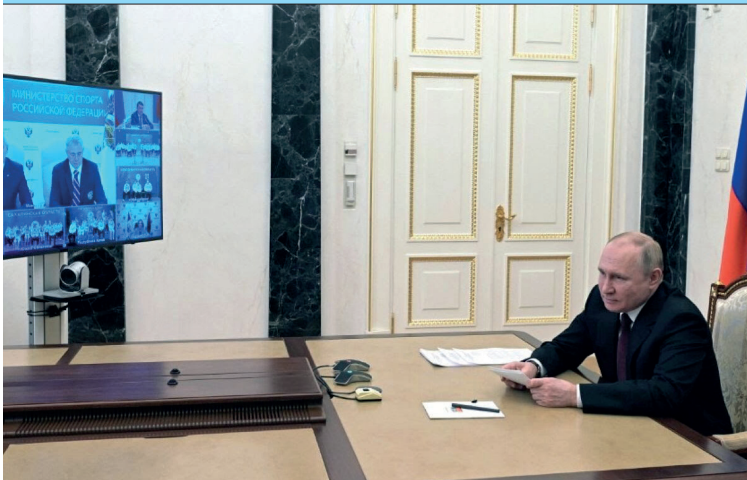
Comité Paralímpico Internacional espera, assim, "preservar a integridade" da competição e "a segurança de todos os participantes"