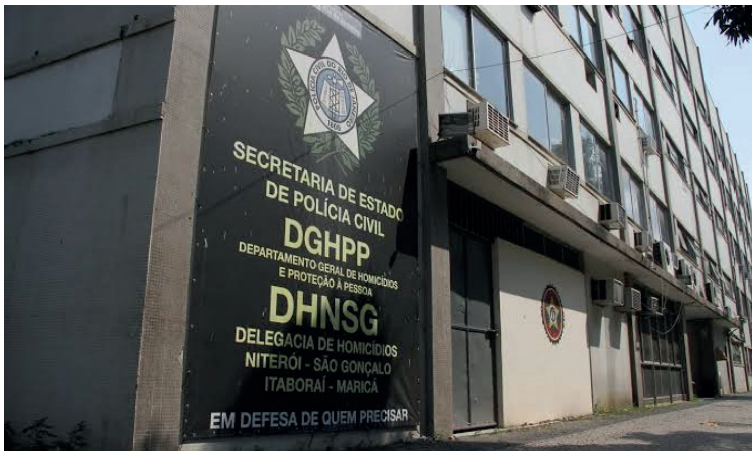
A DHNSG não registra crimes hediondos desde o último dia 23

São Gonçalo é considerada a cidade mais violenta da Região Metropolitana, segundo relatório divulgado em setembro de 2021 pelo Instituto Fogo Cruzado, que estuda, coleta e disponibiliza dados sobre violência armada em áreas urbanas e demais regiões no Rio de Janeiro.