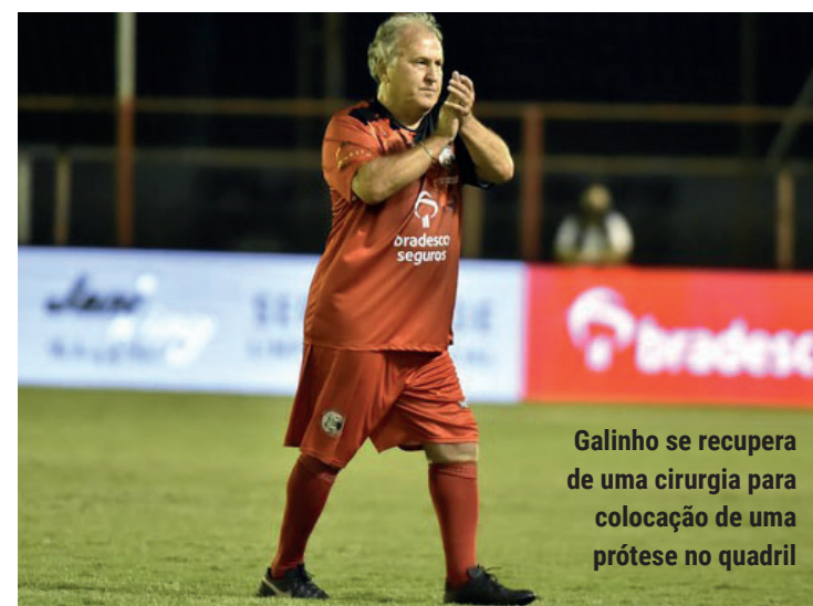
Galinho se recupera de uma cirurgia para colocação de uma prótese no quadril

O Flamengo e a Conmebol, que lembrou a conquista da Libertadores de 81, também comemoraram a data.