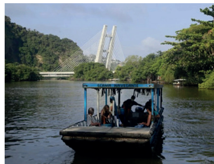
Cepe irá selecionar até dois interessados para concessão de sistema da Barra da Tijuca

A Prefeitura do Rio anunciou que está retomando o projeto de concessão do transporte aquaviário de passageiros na Barra da Tijuca, na Zona Oeste. O primeiro passo aconteceu no mês passado, quando o PMI (Procedimento de Manifestação de Interesse) foi publicado no Diário Oficial, para que fossem desenvolvidos os estudos técnicos, ambientais, jurídicos e econômicos.