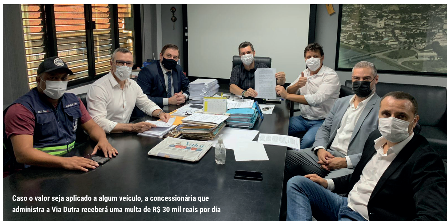
Caso o valor seja aplicado a algum veículo, a concessionária que administra a Via Dutra receberá uma multa de R$ 30 mil reais por dia

“Ganhamos a liminar e estamos muito felizes com a decisão. Haverá ainda uma longa batalha jurídica e administrativa pela frente, mas,