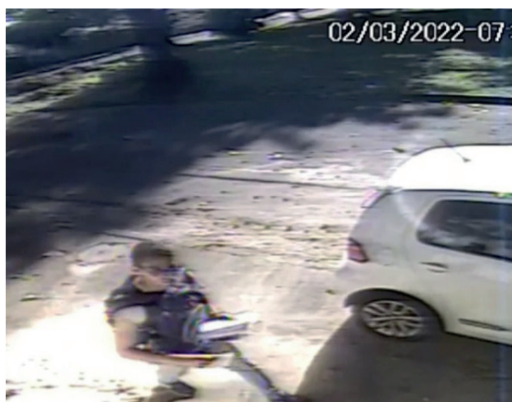
Imagens flagraram acusado em Sulacap

por exemplo, afirma que um nano chip será implantado em quem recebe a dose e a pessoa ficará conectada à internet. “A tecnologia dessa Marca/vacina é baseada numa substância chamada Luciferase (Lúcifer), que possibilitará fazer leitura de códigos de QR Code para se efetuar compras e pagamentos”, diz um trecho.