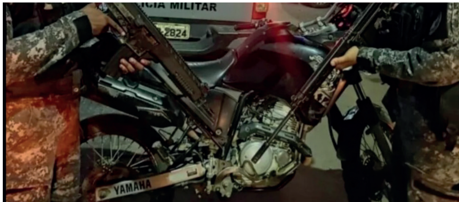
Ninguém se feriu na ação e a dupla fugiu a pé

Policiais militares perseguiram dois criminosos e recuperaram uma moto, em São Gonçalo, Região Metropolitana do Rio. A dupla teria ignorado uma ordem de parada dos PMs, iniciado uma troca de tiro e fugido. Após buscas, a moto usada pelos criminosos foi encontrada. Ninguém se feriu na ação