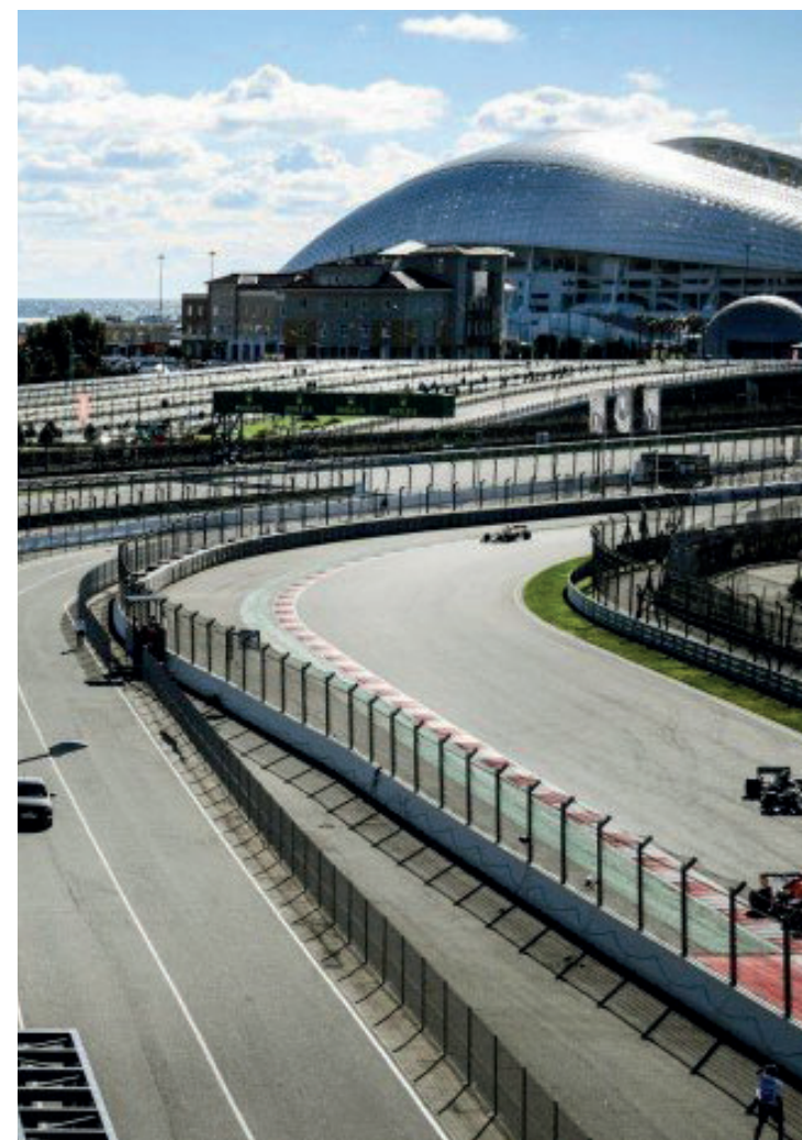
Após suspender prova deste ano, diretoria da categoria optou por rescindir o contrato com o país

Uma semana após suspender o GP da Rússia, marcado para o mês de setembro, em Sochi, a direção da Fórmula 1 adotou uma medida ainda mais rigorosa e anunciou nesta quinta-feira que rescindiu o contrato com os russos em definitivo após a invasão à Ucrânia.