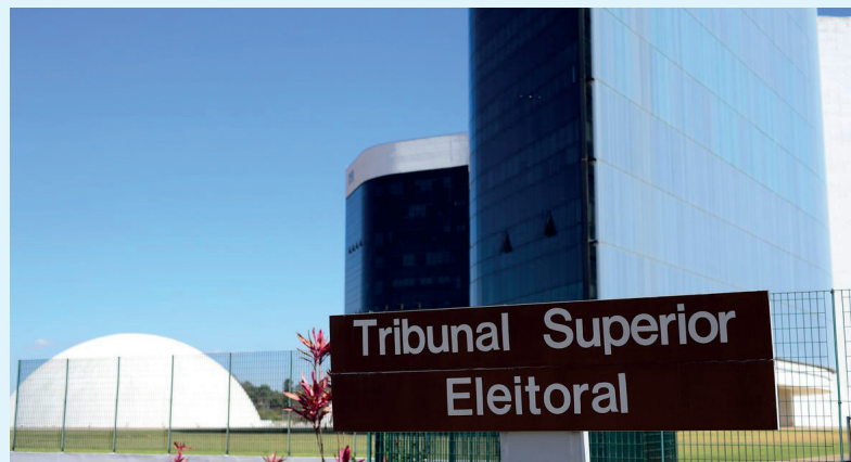
Federações devem cumprir condições para registro até 31 de maio

lução para dar visibilidade às eleições de 2022, aos procedimentos relacionados à totalização dos votos no processo eleitoral. A medida autoriza o acesso, a quem estiver interessado, a boletins de urna e tabelas de correspondência encaminhados para a totalização ao longo de todo o período de recebimento, no dia de votação. Antes, o prazo era de três dias após o fechamento das urnas.