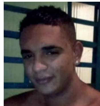
Crime ocorreu em Senador Camará