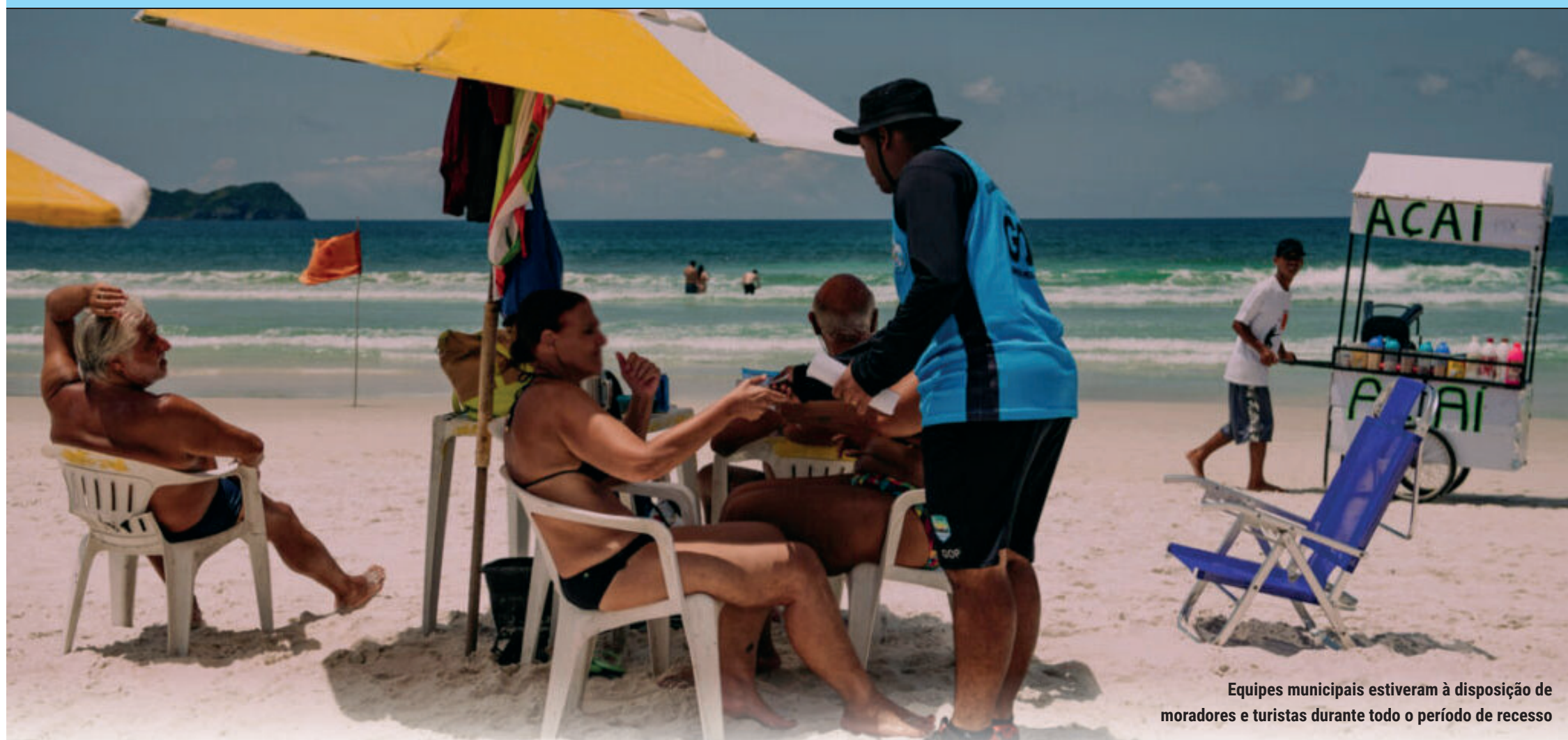
Equipes municipais estiveram à disposição de moradores e turistas durante todo o período de recesso