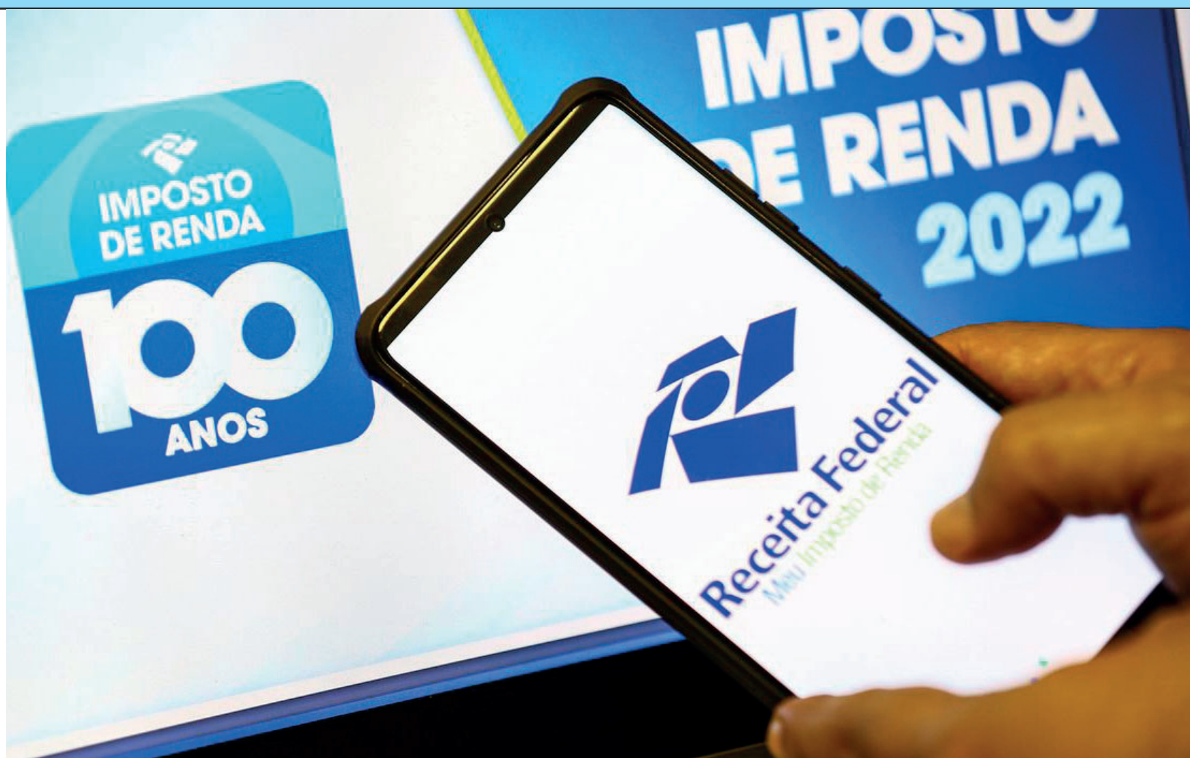
Órgão adverte para tomar cuidado com e-mails recebidos