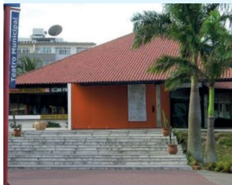
No total, PL determina à União que repasse R$ 3,8 bilhões a estados e municípios para socorro ao setor cultural, afetado pela pandemia

A Câmara aprovou na última quinta-feira (24) um projeto de lei que determina à União que faça o repasse de R$ 3,8 bilhões a estados e municípios para aplicação em ações de socorro ao setor cultural, afetado pelas restrições adotadas durante a pandemia do novo coronavírus.