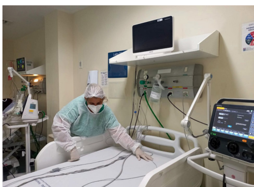
O diretor da unidade ressalta que, mesmo com tendência de queda, não é hora de afrouxar os cuidados com a doença.