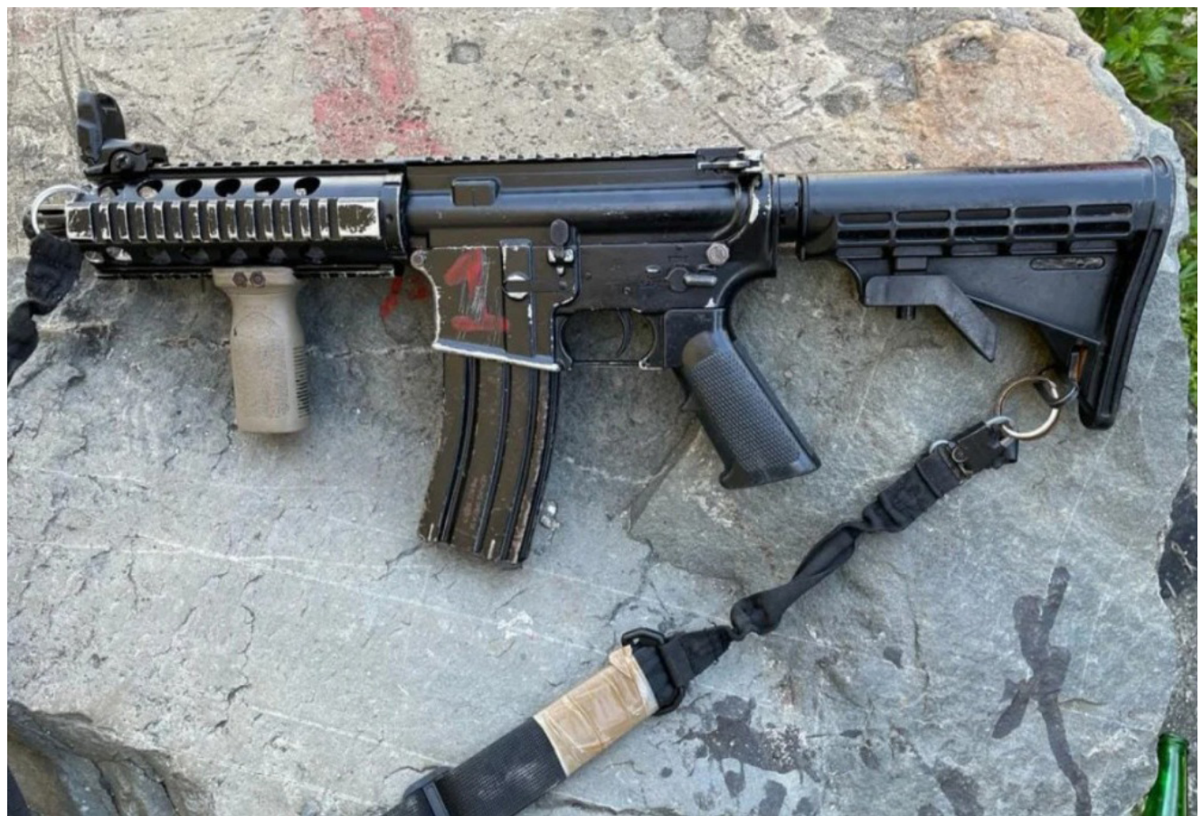
Foram apreendidos um fuzil calibre 556, um carregador, 29 munições e drogas

A ocorrência foi encaminhada à 53ª DP (Mesquita) e, posteriormente, à 54ª DP (Belford Roxo).