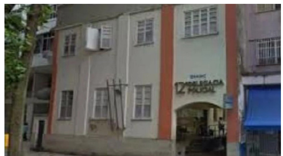
Prisão foi efetuada após cruzamento de dados do setor de inteligência

ção, o carro clonado é oriundo do Morro dos Prazeres, em Santa Teresa, na Região Central. Na ocasião da diligência, os policiais constataram que o automóvel possuía identificação adulterada e que o veículo original foi produto de roubo na área da 9ª DP (Catete).