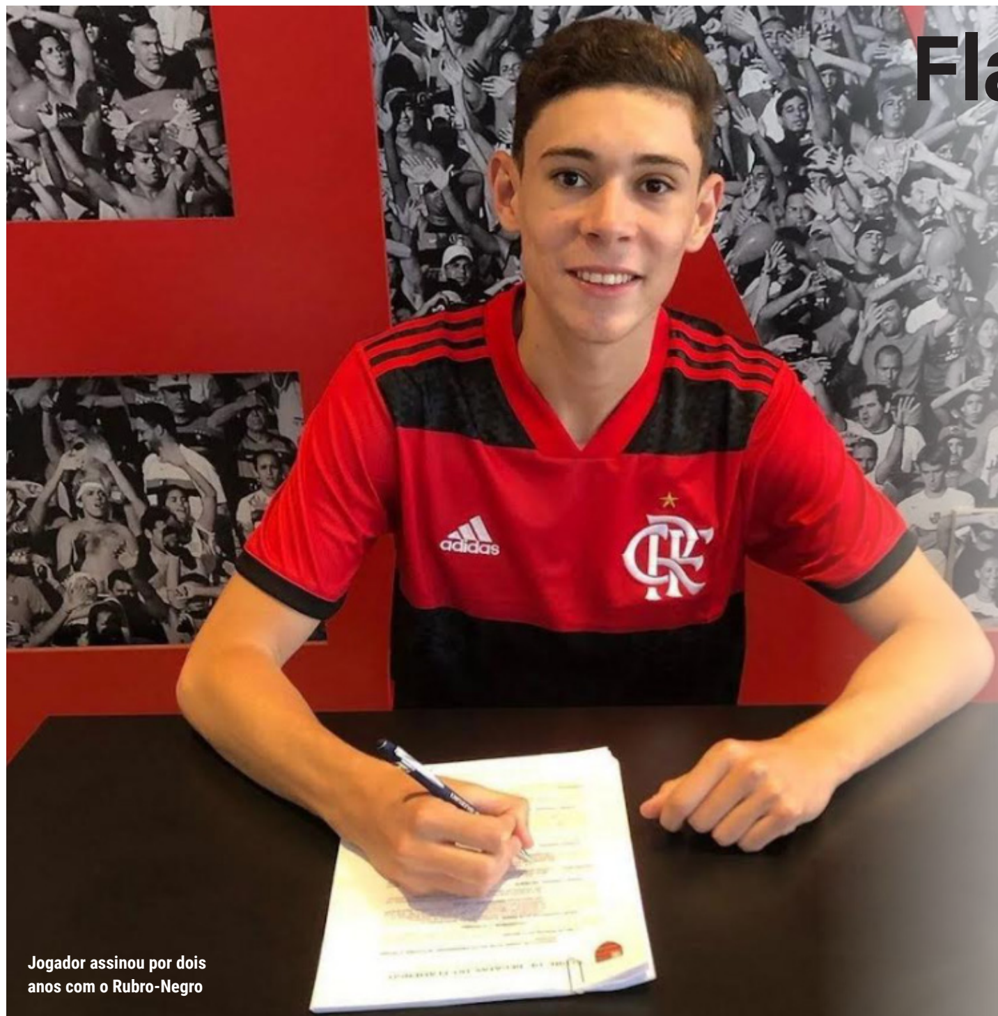
Jogador assinou por dois anos com o Rubro-Negro