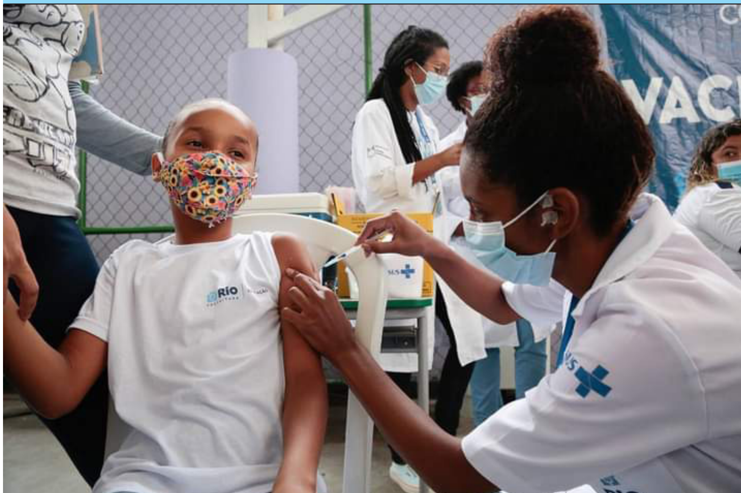
A campanha pretende aumentar o número de crianças imunizadas