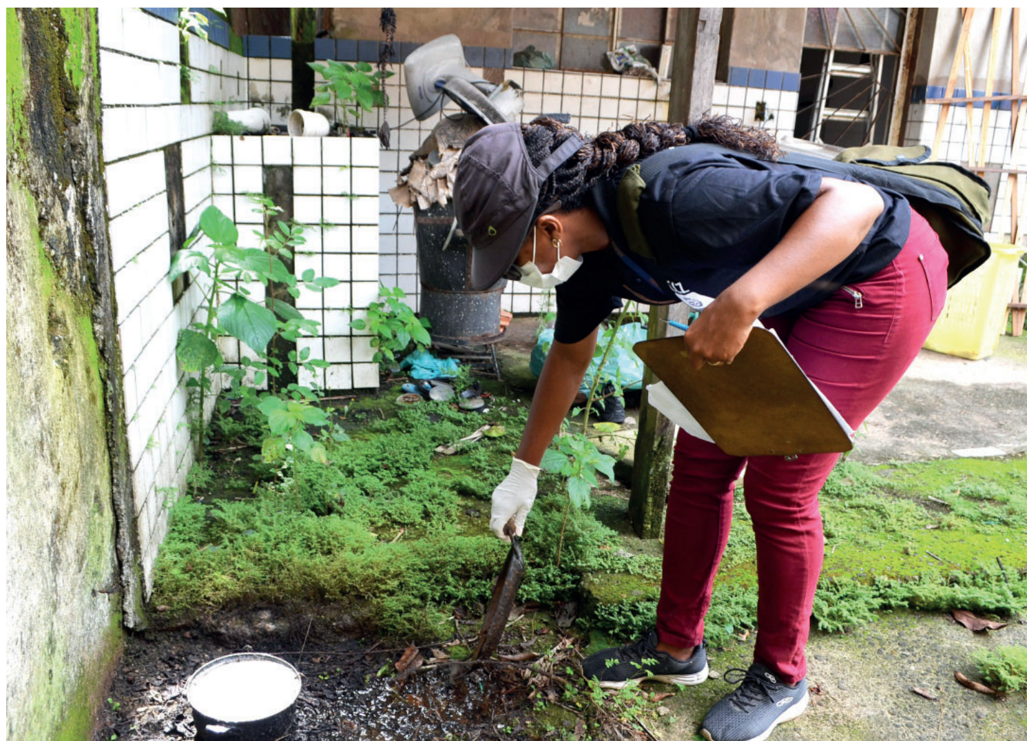
Visitas domiciliares aconteceram nos meses de janeiro e fevereiro pelas equipes do CCZ

O mutirão da dengue percorreu 17 bairros e 109 amostras foram coletadas.