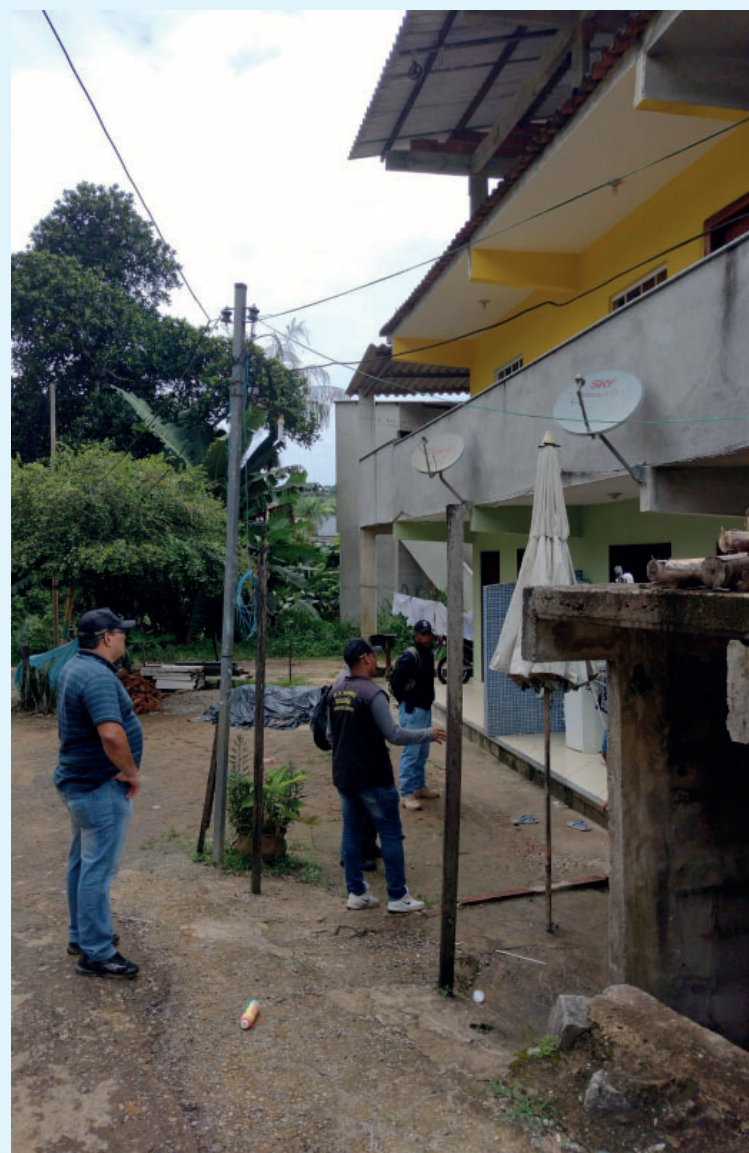
Mais de 50 agentes participaram da mobilização

A Operação Conceição de Jacareí contou com a participação das Secretarias de Meio Ambiente, Saúde (através da Vigilância Sanitária) e da Subsecretaria de Fiscalização de Obras e Posturas.