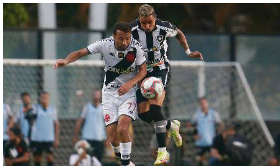
Após a derrota para o Botafogo, por 1 x 0, no Maranhão, o Vasco perdeu sua invencibilidade no ano

Após a derrota para o Botafogo, por 1 x 0, no Maranhão, o Vasco perdeu sua invencibilidade no ano. Eram, portanto, quatro vitórias e um empate até aqui. Decerto, agora o time ocupa a 4ª posição, com 13 pontos, empatados com Flamengo (2º) e Botafogo (3º). Confira os próximos jogos da equipe: