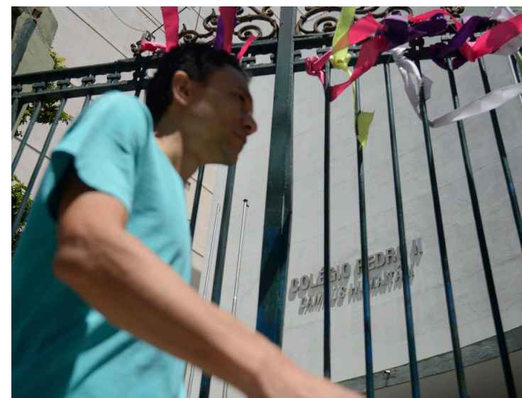
Turmas foram divididas e frequentarão a escola em semanas alternadas

O Colégio Pedro II (CPII), da rede federal do Rio de Janeiro, retomou ontem as aulas presenciais, após adiar o retorno marcado inicialmente para o dia 7 de fevereiro. A previsão foi feita em dezembro, mas a data foi adiada diante da propagação da variante Ômicron do novo coronavírus no estado.