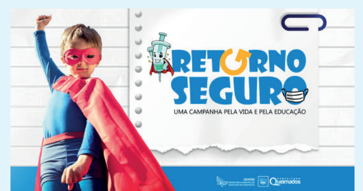
Município terá uma semana repleta de ações de educação preventiva para enfrentamento da COVID-19