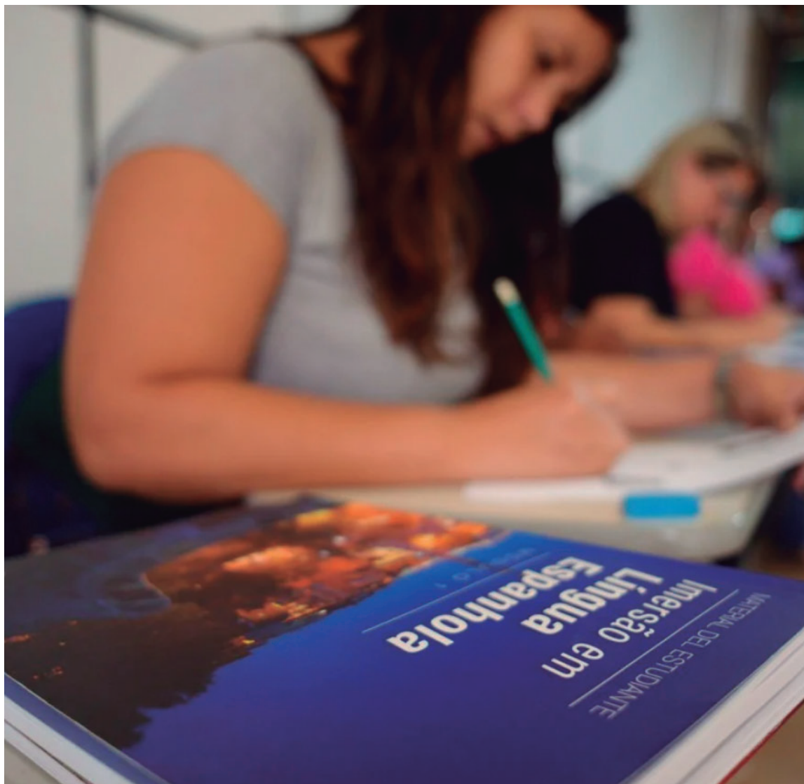
O prazo para inscrições se encerra no dia 13 de fevereiro

Para participar, o interessado deve preencher um formulário disponível no site do Sesc RJ em <www.sescrj.org.br> onde também está publicado o edital com todas as informações.