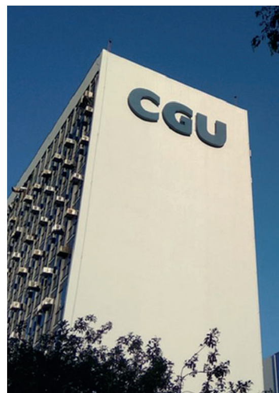
O processo seletivo será composto por uma única etapa

Os interessados podem acessar o edital e se inscrever pelo site da FGV, banca organizadora do concurso. A taxa de inscrição para a prova de auditor é de R 120 e para a de técnico é de R$ 80 e pode ser realizada até o dia 4 de fevereiro (às 23h59). Mais informações podem ser obtidas pelo telefone 0800 2834628 e pelo e-mail concursocgu21@fgv.br.