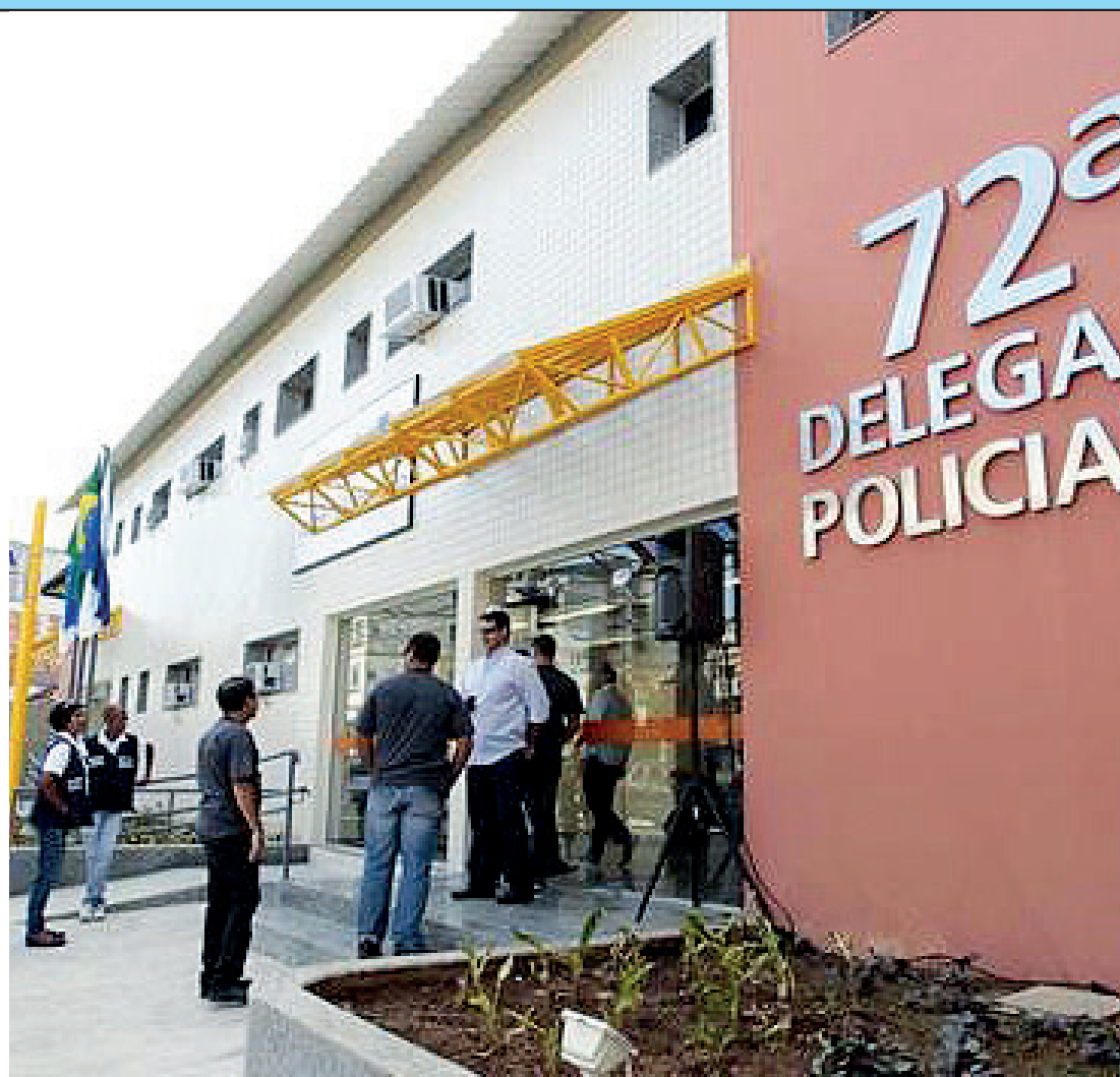
Todo entorpecente estava com a mulher na garupa da moto

Ao prestarem depoimento na delegacia, os dois admitiram que a droga era oriunda do Complexo do Salgueiro e seria entregue em uma comunidade no Itambi, em Itaboraí. A dupla foi encaminhada ao sistema prisional, onde ficará à disposição da Justiça.