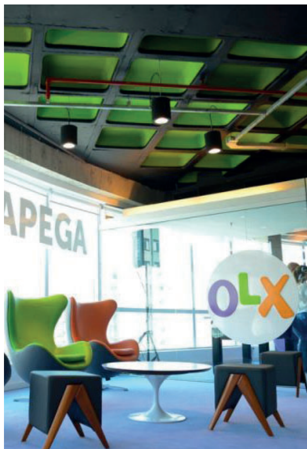
A empresa continua com o formato 100% remoto