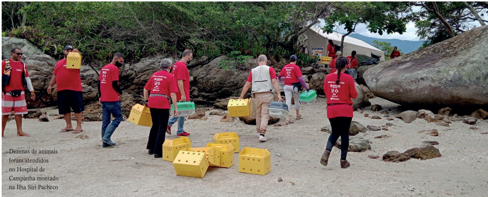
Dezenas de animais foram atendidos no Hospital de Campanha montado na Ilha Siri Pacheco

Conforme anunciado, nesta terça-feira (01) a Secretaria de Saúde da Prefeitura de Mangaratiba, junto com a empresa Amo Veterinária e a Universidade Federal Rural do Rio de Janeiro (UFRRJ), iniciaram a ação de captura, cadastro e castração dos felinos abandonados na Ilha Furtada, no distrito de Itacuruçá. Dezenas de animais foram atendidos no Hospital de Campanha montado na Ilha Siri Pacheco.