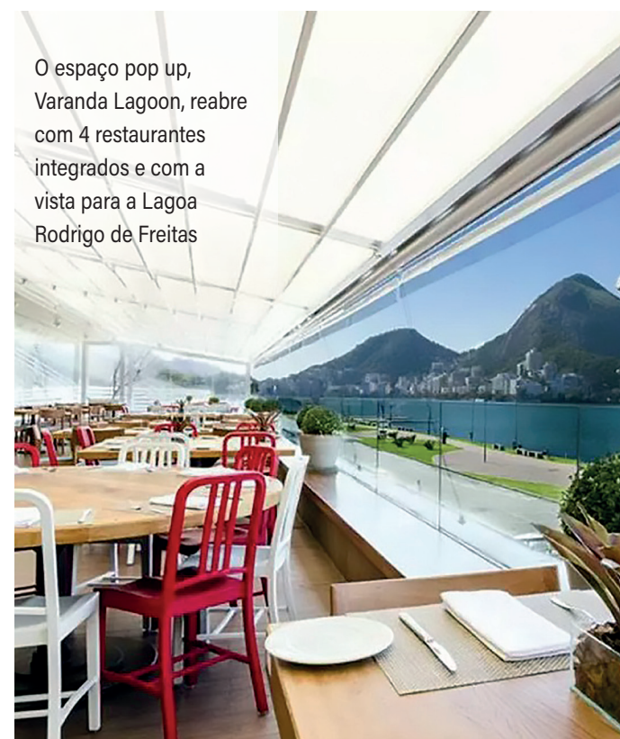
O espaço pop up, Varanda Lagoon, reabre com 4 restaurantes integrados e com a vista para a Lagoa Rodrigo de Freitas

O evento ao ar livre respeitará as restrições e os protocolos de prevenção contra a Covid-19. A entrada é gratuita, mas haverá controle de acesso de público e o uso de máscara é obrigatório.