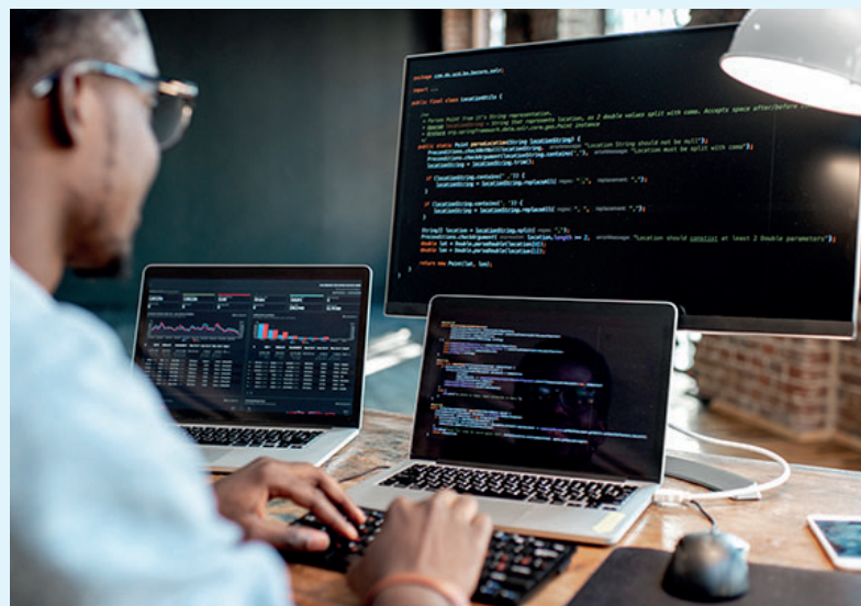
Programa capacita pessoas entre 18 e 39 anos, com renda familiar de até um salário mínimo e ensino médio completo

dade, no ciclo 2019/2020 foram 92%, um destaque do Recode Pro é o nível em que as pessoas formadas conseguem se inserir no mercado. Seis meses após o término, a média salarial das pessoas que concluíram o primeiro ciclo era de R$ 4.985.