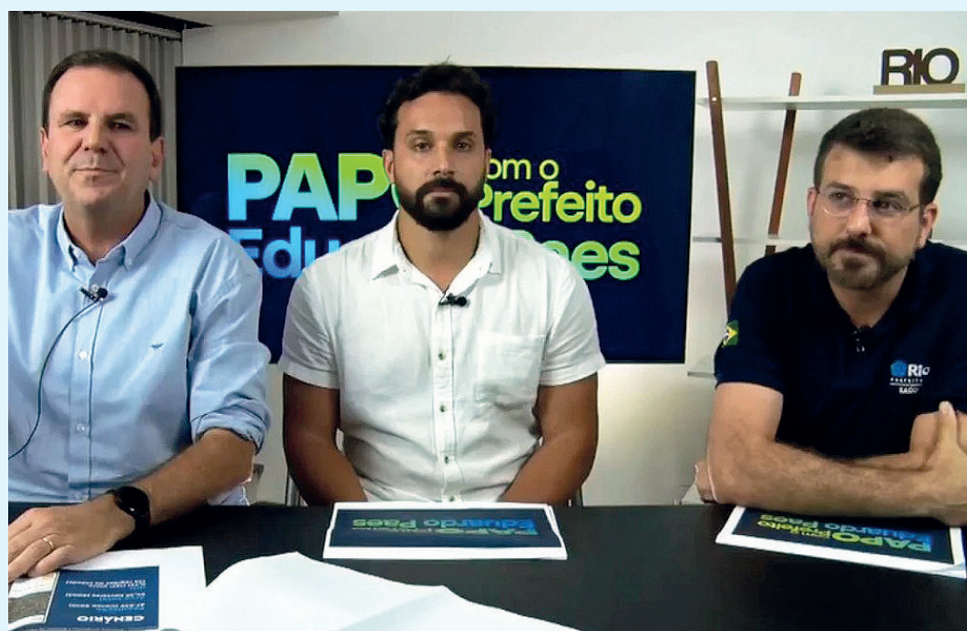
Anúncio foi feito em live com Eduardo Paes

“A gente sabe que o Jacarezinho é uma comunidade muito violenta, dominada pelo tráfico de drogas. No Rio, infelizmente, esses territórios são dominados ou por milicianos ou pelo tráfico de drogas, e o Estado fez uma intervenção lá, e aí a prefeitura anunciou um conjunto de ações de intervenções”, disse o prefeito.