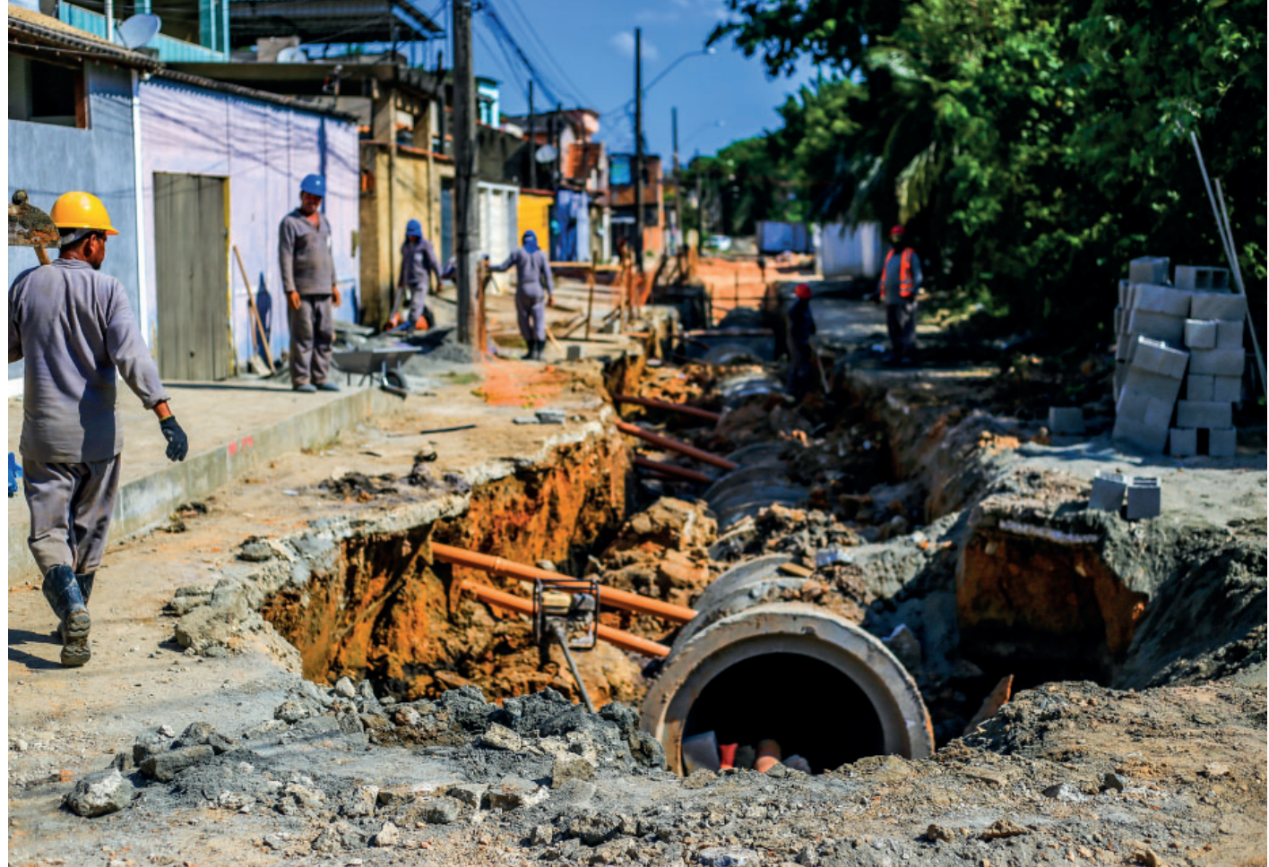
Quatorze ruas do bairro Jardim Anápolis estão recebendo obras de infraestrutura