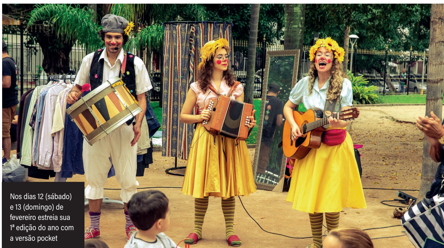
Nos dias 12 (sábado) e 13 (domingo) de fevereiro estreia sua 1ª edição do ano com a versão pocket