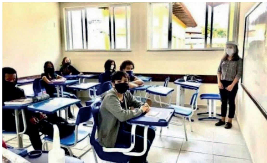
A medida determina que o passaporte de vacina seja cobrado para matrícula e frequência

O outro projeto é de Eliomar Coelho, também do PSOL. Ele foca apenas na rede superior de ensino. De acordo com o texto, o passaporte da vacinação seria obrigatório para entrar em universidades de todo o estado.