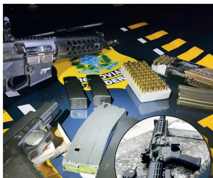
Com eles os agentes encontraram um fuzil, pistola, carregadores e munições

O casal foi preso pelo crime de tráfico de armas, podendo pegar até oito anos de prisão em regime fechado. Eles foram encaminhados para a 165ª DP (Mangaratiba).