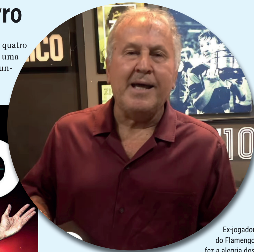
Ex-jogador do Flamengo fez a alegria dos torcedores que lotaram o Shopping Via Parque

Arthur Antunes Coimbra, o Zico, atuou com a camisa do Flamengo por 21 anos, e é o maior ídolo do clube da Gávea.