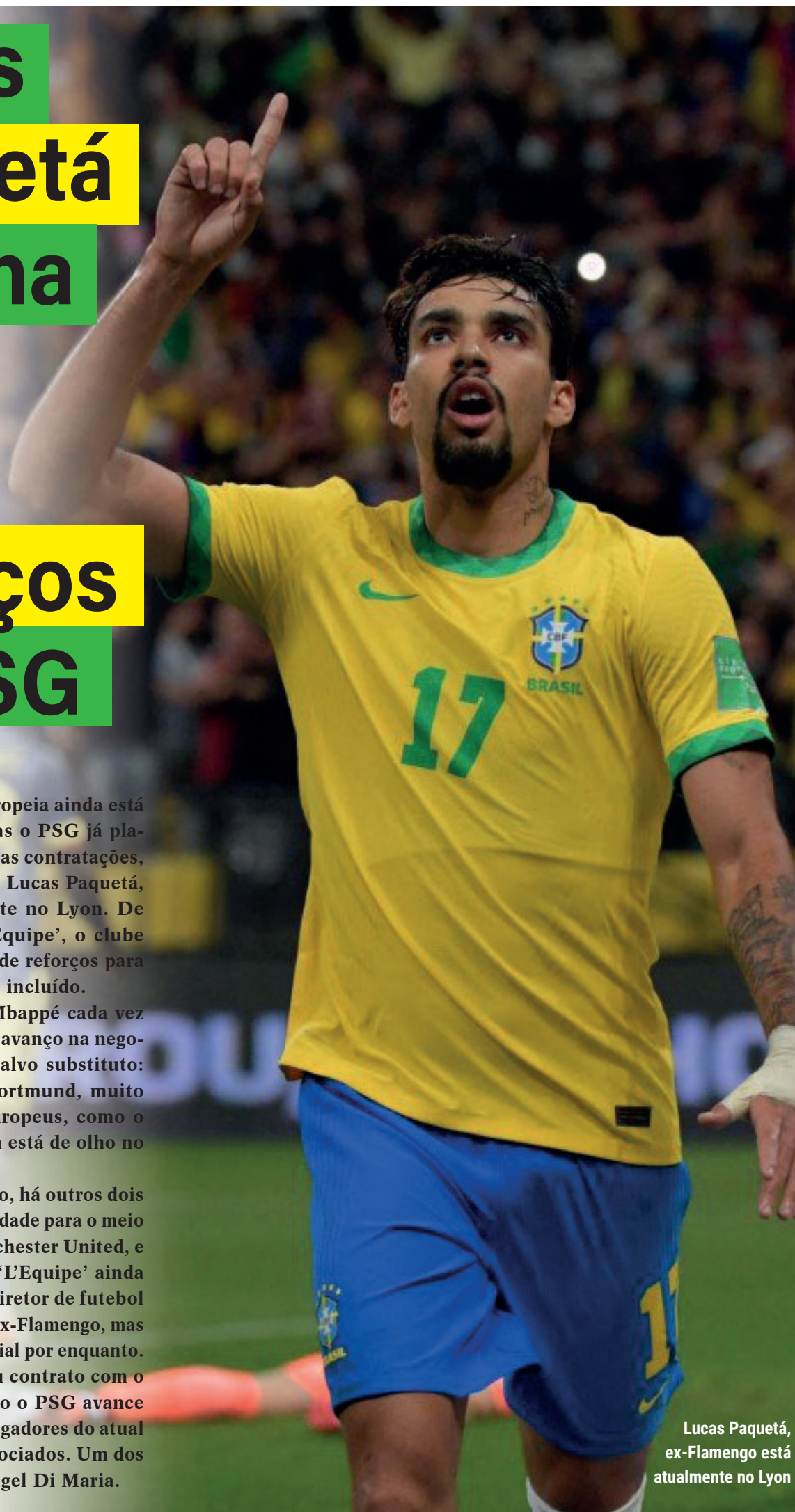
Lucas Paquetá, ex-Flamengo está atualmente no Lyon

Já Pogba terminará seu contrato com o United e estará livre. Caso o PSG avance por esses nomes, alguns jogadores do atual elenco teriam que ser negociados. Um dos nomes apontados é de Ángel Di Maria.