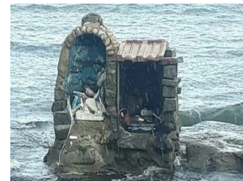
Santuário fica na Pontinha do Outeiro

As imagens de Yemanjá e Ogum que ficavam em um pequeno santuário em uma gruta na Pontinha do Outeiro, no Areal, bairro de Araruama, na Região dos Lagos, foram destruídas em um ato de vandalismo e intolerância religiosa.