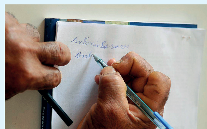
Público alvo do programa são pessoas acima de 15 anos

O desenho original do programa apresentava deficiências que resultaram na interrupção dos ciclos a partir de 2016. Para