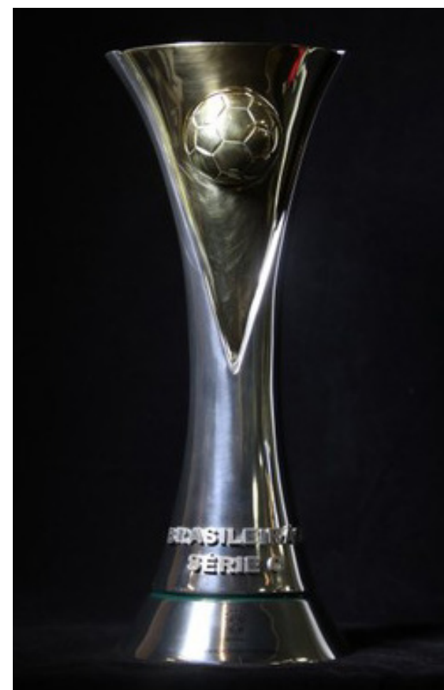
A Rodada #1 está programada para acontecer entre os dias 9 e 11 de abril