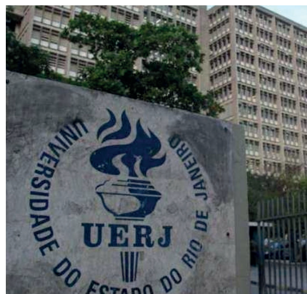
As aulas acontecem ao vivo em dias e horários programados

As inscrições vão até o dia 28 de Fevereiro e para acessar mais informações sobre os cursos, bem como, os editais, basta acessar o site em https://cepeduerj.org.br/ .