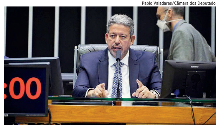
Arthur Lira busca acordo

economia, focado em garantir à população serviços essenciais “como saúde, educação, segurança, liberdade, habitação e saneamento”.