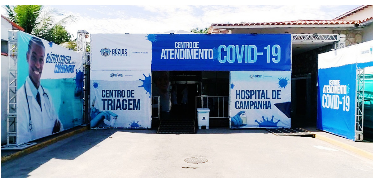
Variante foi identificada em um laboratório no Rio através de sequenciamento genético de amostras positivas da COVID-19

Na última sexta (7), o governador, Cláudio Castro (PL), sugeriu que todos os municípios cancelassem o Carnaval de rua.