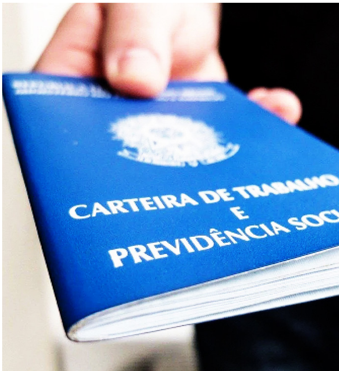
Na região Metropolitana são oferecidas 371 vagas, sendo 93 para pessoas com deficiência

Para se inscrever ou atualizar o cadastro, é necessário ir a uma unidade do Sis-