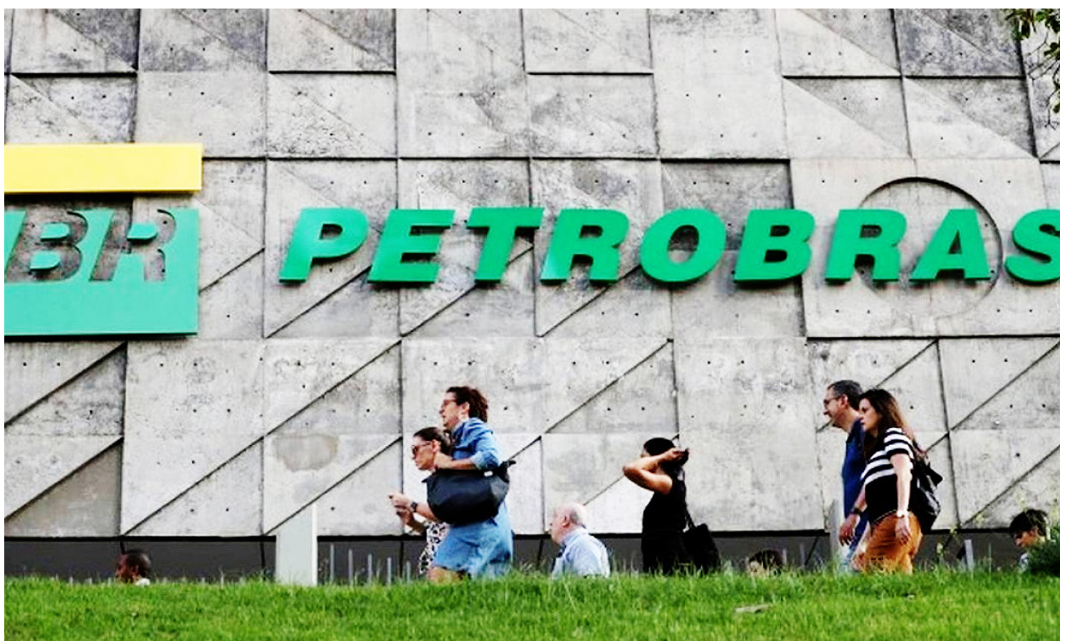
As inscrições podem ser realizadas online até 28 de janeiro

Segundo a Petrobras, os convocados poderão trabalhar em qualquer área ou unidade, a depender da necessidade da Petrobras.