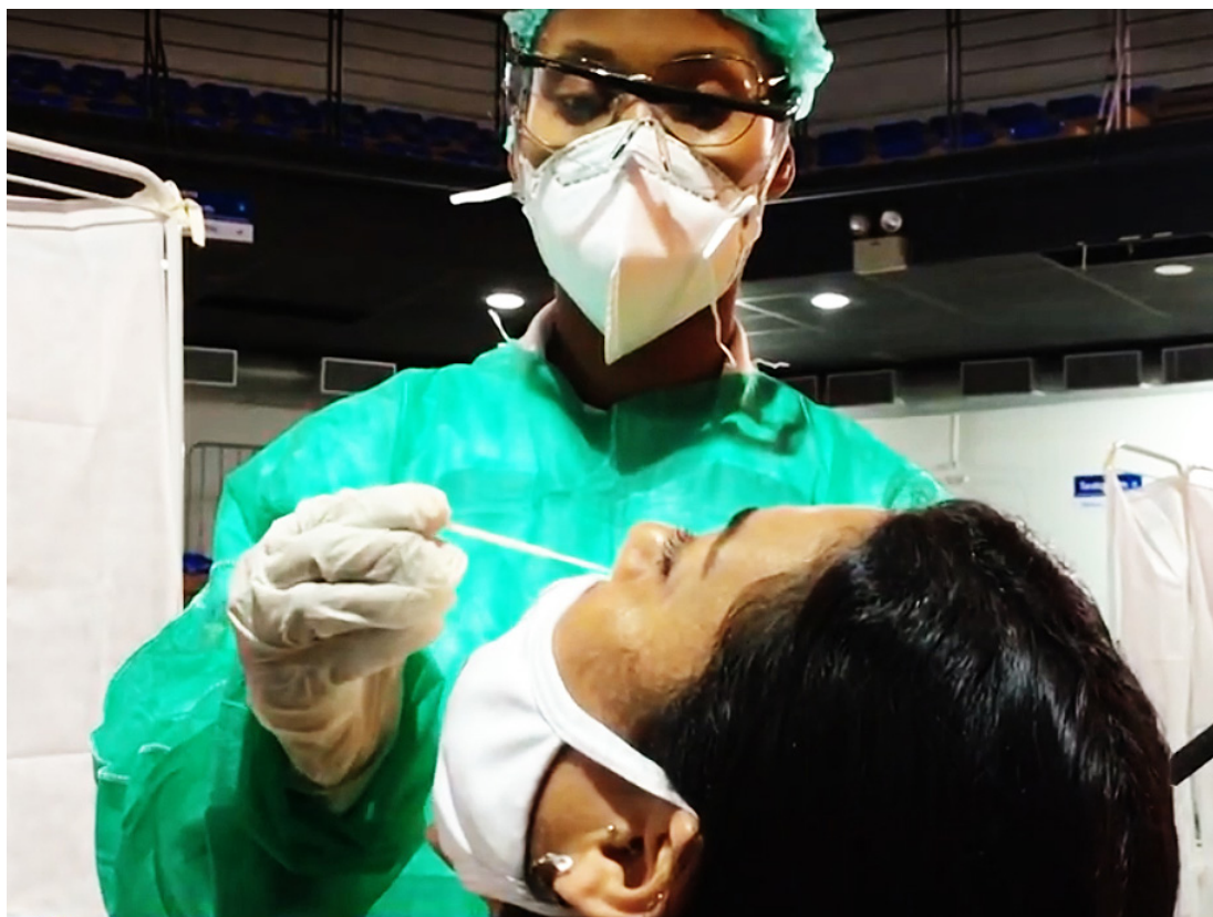
Pelo menos 12 mil só na rede municipal e em hospitais particulares

O prefeito afirmou que é impossível no momento fazer restrições a atividades econômicas. "Na hora que você lota a rede você dificulta o atendimento. Vacina é o que permite à gente estar circulando normalmente, evitar restrições", disse o prefeito do Rio em sua rede social.