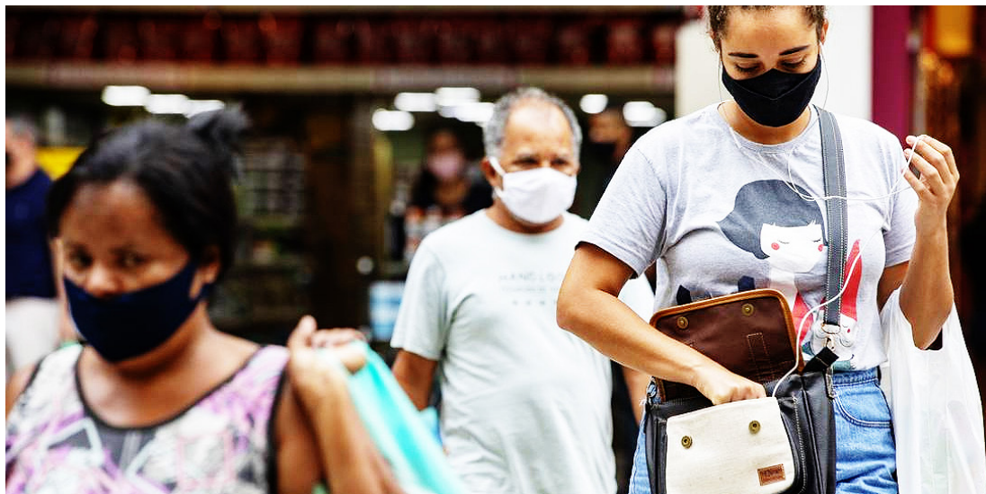
Além disso, o comitê também defendeu a retomada do uso de máscaras em locais abertos, especialmente onde não for possível manter o distanciamento social

Além disso, o comitê também defendeu a retomada do uso de máscaras em locais abertos, especialmente onde não for possível manter o distanciamento social, embora o protocolo não deva voltar a